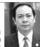
Ông Lều Vũ Điều Phó Chủ tịch Trung ương Hiệp Hội Nông dân Việt Nam

Làm nông dân cũng phải học, nhất là khi các bạn muốn làm nông dân giỏi. Tại Đức, nghề nông nghiệp được dạy trong trường nghề tới 3 năm và ở đó, các bạn sẽ được học tất cả các kiến thức, kỹ năng cần thiết cho người nông dân. Thực hiện chương trình hỗ trợ giữa hai quốc gia, chúng tôi sẽ hết sức giúp đỡ các bạn tiếp cận những thông tin, kỹ thuật hữu ích nhất để nông dân Việt Nam chủ động trong công việc hàng ngày.