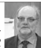
Tiến sỹ Uwe Clar Trung tâm đào tạo nông nghiệp Echem, Đức

Hiện tại, nông dân Lâm Đồng phát triển đàn bò rất tốt. Tuy nhiên, qua thực tế nhận thấy, điểm yếu nhất của nông dân vẫn là vấn đề kỹ thuật. Chúng ta chưa có một quy chuẩn chăm sóc, chữa bệnh cụ thể cho từng giống bò ở từng địa phương dẫn đến người chăn nuôi chủ yếu theo kinh nghiệm và truyền miệng, chất lượng đàn bò chưa đồng đều. Việc cần làm ngay là phổ biến rộng rãi kiến thức chăm sóc, nuôi dưỡng bò sữa đúng kỹ thuật tới cho nông dân để đảm bảo đàn bò phát triển bền vững.