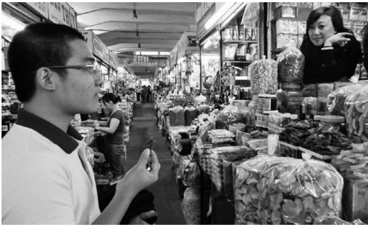
• Phần lớn quầy hàng đặc sản Đà Lạt đều ký cam kết đảm bảo an toàn thực phẩm