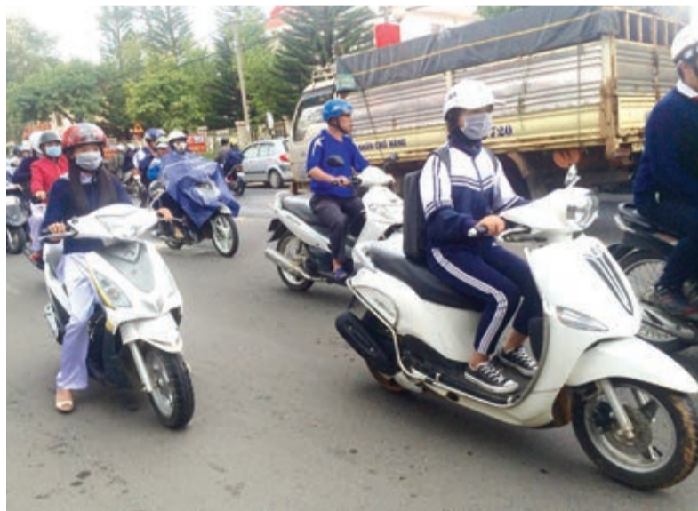
• Tình trạng học sinh vi phạm Luật ATGT diễn ra khá phổ biến