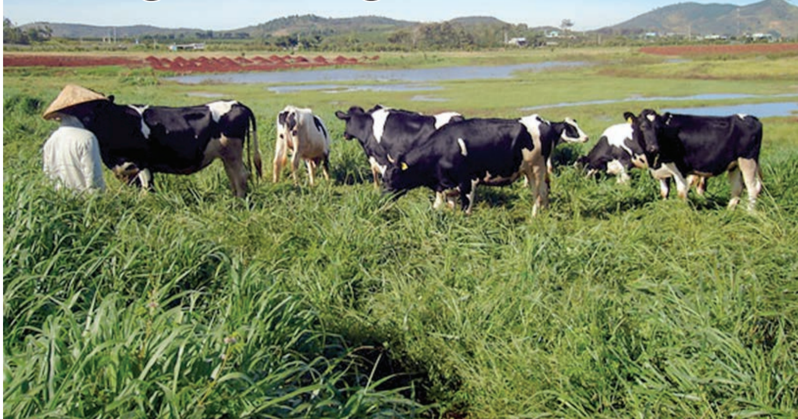
• Toàn tỉnh có khoảng 2.610 ha chuyên phục vụ chăn nuôi bò sữa, bò thịt