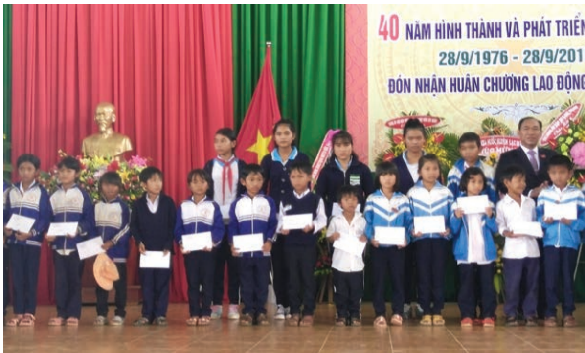
• Từ nguồn quỹ khuyến học của xã, nhiều học sinh có hoàn cảnh khó khăn đã được tiếp sức đến trường

Nói thêm về Quỹ học bổng ông Trị, ông Trương Văn Hoàng, cán bộ Tư pháp, Phó Chủ tịch Hội Khuyến học xã Tân Hội cho biết rằng Quỹ học bổng ông Trị được thành lập từ 2010, lấy tên là ông Trị vì mạnh thường quân chính của quỹ này là cháu ngoại của ông Trị, một cán bộ của xã từ những năm đầu khi xã mới được thành lập và thực chất, quỹ học