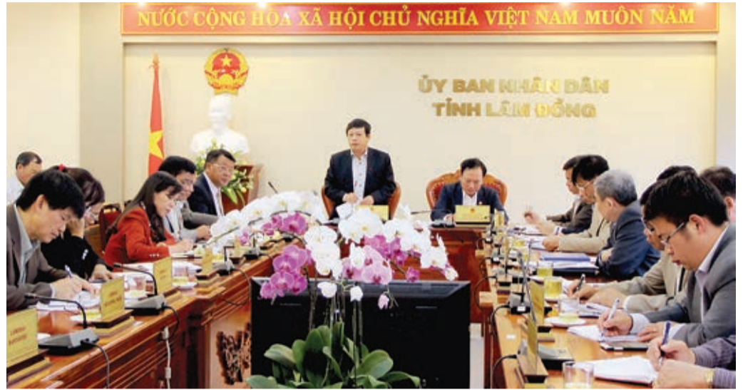
• Đồng chí Đoàn Văn Việt - Phó Bí thư tỉnh ủy, Chủ tịch UBND tỉnh, Trưởng Đoàn ĐBQH tỉnh Lâm Đồng phát biểu tại buổi làm việc.

Kiến nghị với Chính phủ, cử tri cho rằng, sau vụ ô nhiễm môi trường xảy ra tại các tỉnh miền Trung, Chính phủ cần cân nhắc đối với dự án thép tại Cà Ná - Ninh Thuận nhằm tránh để xảy ra thảm họa môi trường lần thứ