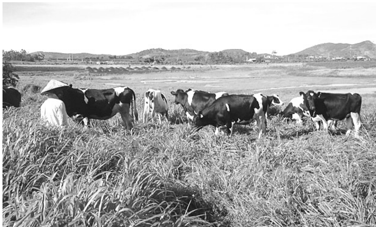
• Toàn tỉnh có khoảng 2.610 ha chuyên phục vụ chăn nuôi bò sữa, bò thịt

Với sản lượng sữa chừng 160 tấn/ngày, toàn tỉnh có 12 trạm thu mua sữa, hầu hết lượng sữa tươi được thu mua bởi ba công ty đóng chân trên địa bàn tỉnh bao gồm Vinamilk,