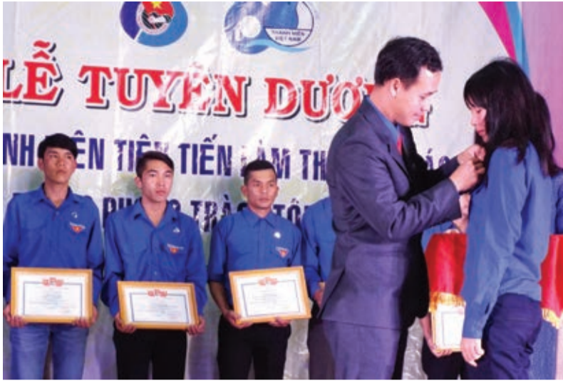
• Tuyên dương 53 gương thanh niên tiên tiến làm theo lời Bác và điển hình trong phong trào "Tôi yêu Tổ quốc tôi"

Chào mừng 60 năm ngày thành lập Hội Liên hiệp thanh niên Việt Nam (15/10/1956 - 15/10/2016), chiều 9/10/2016, Thành Đoàn Đà Lạt đã tổ chức lễ Tuyên dương "Thanh niên tiên tiến làm theo lời Bác" và những tấm gương tiêu biểu trong phong trào "Tôi yêu Tổ quốc tôi".