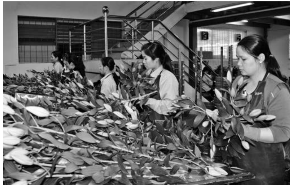
Năm 2016 được chọn là năm quốc gia khởi nghiệp, cho mọi thành phần, tầng lớp nhân dân.

Đồng thời, hình thành vườn ươm doanh nghiệp để nuôi dưỡng và phát triển ý tưởng khởi nghiệp thành các sản phẩm cụ thể cho ít nhất là 3 dự án và 5 doanh nghiệp hàng năm; bên cạnh các chính sách hỗ trợ chung cho tất cả các