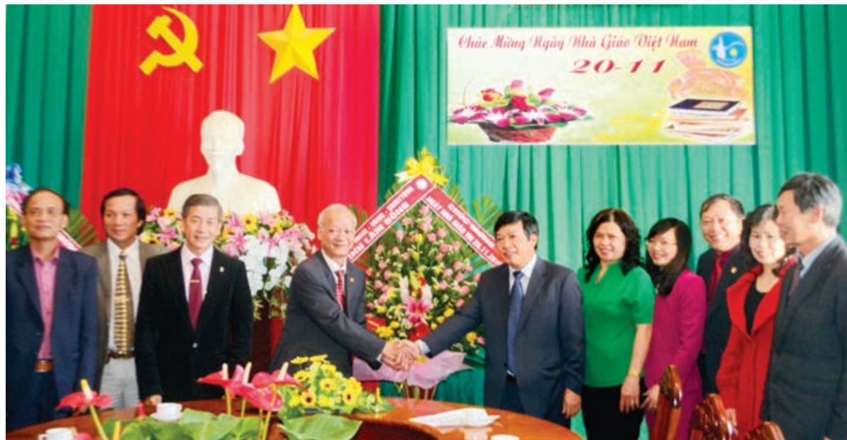
Đồng chí Đoàn Văn Việt - Phó Bí thư Tỉnh ủy, Chủ tịch UBND tỉnh thăm và chúc mừng cán bộ, giáo viên Trường CĐSP Đà Lạt nhân Ngày Nhà giáo Việt Nam 20/11.

Trong những năm tháng tiếp theo, trước nhu cầu đòi hỏi bức thiết về đội ngũ GV cấp 2, trường tiếp tục đào tạo học hỗ trợ cho các ngành giáo dục Bình Dương, Bến Tre, Đồng Tháp và mở rộng địa bàn tuyển sinh khắp cả nước, từ Hà Nội, Thanh Hóa, Nghệ Tĩnh và các tỉnh duyên hải miền Trung; đặc biệt khóa 4 và khóa 5, trường ra tận Nghệ Tĩnh tuyển sinh gần 300 sinh viên mỗi khóa. Phần lớn số sinh viên này đã bám trụ lại Lâm Đồng kể cả những địa bàn heo hút, khó khăn nhất và lấy Lâm Đồng làm quê hương thứ hai của mình.