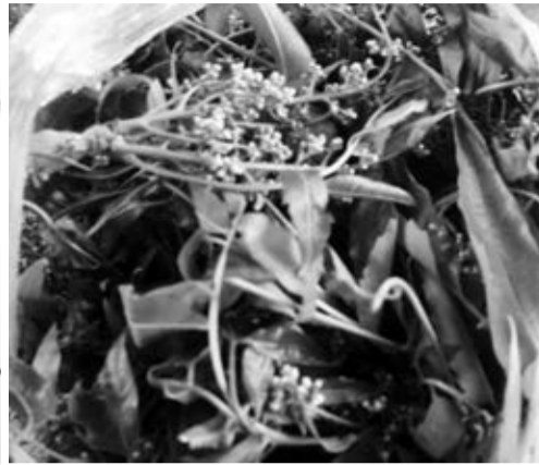
Lá teng neng.

Món thứ 2 là muối kiến. Không phải kiến nào cũng có thể ăn được. Cũng như người Tây Nguyên có món lá mì (sắn) đặc sản mà giờ đã nghe ngệch vào các nhà hàng hạng sang ở thành phố, nhưng không phải lá mì nào cũng dùng được, không biết hái là say sập trời ngay. Nó phải là loại kiến càng màu vàng chân cao đặc chủng, dít không trong các lùm lá, tiếng Jrai gọi là hdomsao, bắt về, giã đập ra với ớt hiểm, thế là thành món chấm. Đồng bào không bao giờ bắt kiến trong vườn vì có thể nó không sạch, vườn có thể có xác động vật. Họ vào rừng sâu, tìm các cây có kiến, để nĩa dưới gốc cây rồi hơ lửa, kiến rơi xuống được sàng sảy sạch rồi mang về chế biến. Tức là giã với ớt như đã nói. Nó dòn dốt chua và hơi mặn mặn. Chấm với thịt nướng thì... thôi rồi. Mà ăn với cơm cũng bắt. Ngoài ra, đồng bào còn dùng để nêm vào