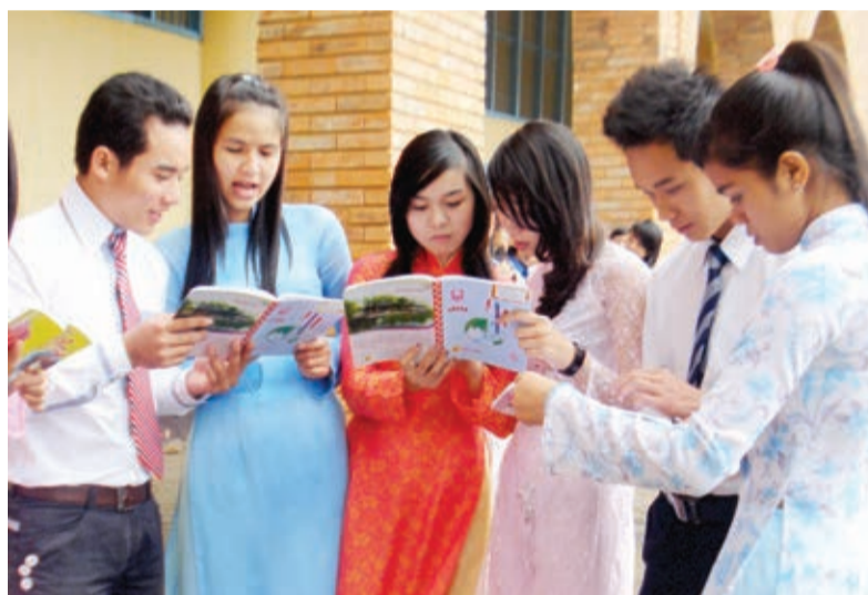
Dưới mái trường - Ảnh: PV

Trải qua 40 năm xây dựng, phát triển và đổi mới, nhà trường đã đạt được những thành tích nổi bật trong công tác xây dựng đội ngũ giáo viên - nhân tố quyết định chất lượng giáo dục - đào tạo. Từ chỗ 100% giáo viên có trình độ đại học những ngày đầu, đến nay trong 101 giáo viên có 3 TS, 1 NCS, 68 thạc sĩ, 10 GV đang học cao học, tức là số GV có trình độ thạc sĩ trở lên là 71/101 người, chiếm tỷ lệ 70.3% (cao hơn qui định chuẩn GV các trường CĐSP của Bộ GD & ĐT). Vượt qua muôn vàn khó khăn, thiếu thốn, đội ngũ GV của nhà trường với lòng yêu người, yêu nghề, với việc ý thức được trách nhiệm cao cả, đã nỗ lực phấn đấu không ngừng nghỉ để nâng cao trình độ chuyên môn nghiệp vụ, nâng cao chất lượng đào tạo nhằm tạo ra những thế hệ sinh viên có trình độ chuyên môn, tay nghề, có nhân cách SP, được xã hội thừa nhận và tôn vinh.