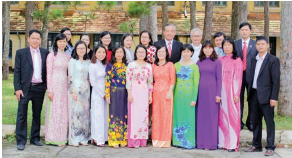
Tập thể cán bộ, giảng viên của Khoa Xã hội - CĐSP Đà Lạt.

Gần 40 năm trưởng thành cùng CĐSP Đà Lạt, Khoa Xã hội hiện nay được đánh giá có một đội ngũ cán bộ giảng viên hùng hậu, có năng lực chuyên môn cùng bề dày kinh nghiệm sư phạm trong đào