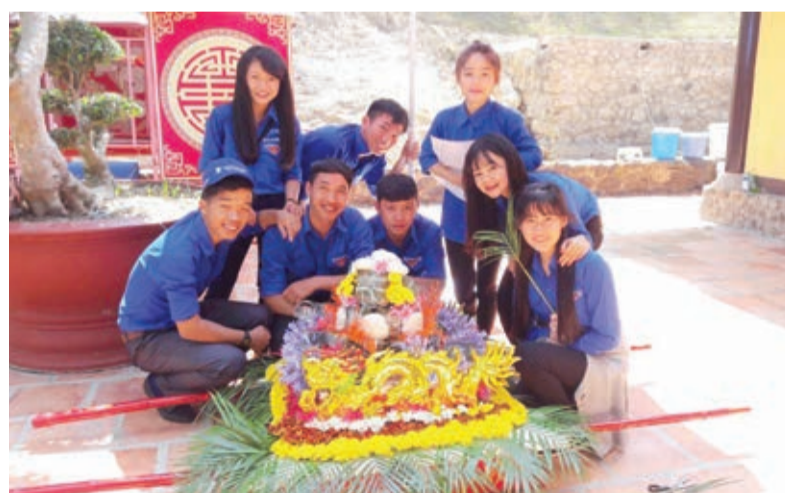
Đoàn viên Trường CĐSP Đà Lạt tham gia xếp mâm quả trong Lễ Giỗ tổ Hùng Vương tổ chức tại KDL thác Prenn (tác phẩm đoạt giải nhì).

Hiện có 4 liên chi đoàn, 1 chi đoàn giáo viên trực thuộc, 35 chi đoàn với gần 2.000 đoàn viên; Đoàn Trường CĐSP là tổ chức Đoàn đông thứ nhì tỉnh và có hoạt động mạnh. Trong các hội thi gần đây của tỉnh, Đoàn Trường CĐSP đã ghi danh với 2 giải A Hội thi đồng diễn giai điệu Tổ quốc và hát Quốc ca toàn tỉnh, giải nhì Hội thi tìm hiểu Nghị quyết Đại hội Đảng lần thứ XII, Luật Bầu cử Quốc