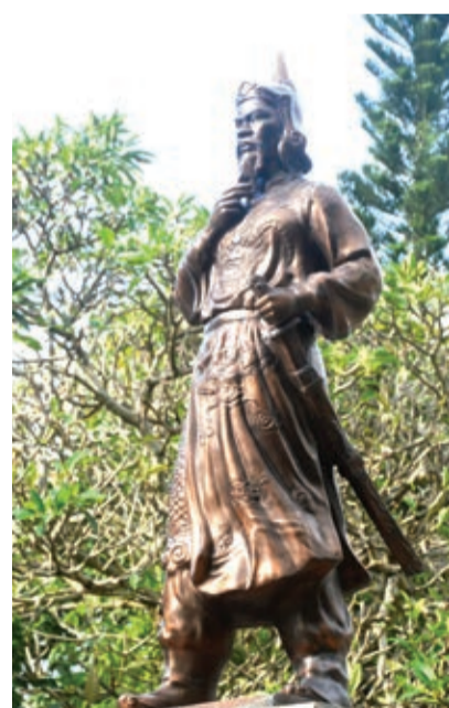
Tượng đài Nguyễn Hữu Cảnh

Dân cư thời ấy gồm các sắc tộc: Khơme, Chăm, Việt, Hoa... nhưng