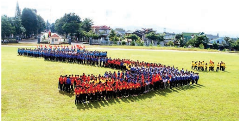
Đoàn Trường THPT Lộc An biểu diễn tại hội thi đồng diễn và hát giai điệu Tổ quốc.

Cùng với đó, Đoàn trường đã tổ chức triển khai 6 bài lý luận chính trị cho ĐVTN vào những buổi chào cờ, hát những bài ngợi ca Đảng, Bác Hồ dưới cờ và trong các ngày lễ lớn. Đặc biệt, Đoàn trường luôn chú trọng tăng cường các hoạt động giáo dục đạo đức, lối sống và ý thức chấp hành pháp luật cho học sinh thông qua các buổi học ngoại khóa và hướng nghiệp, chọn ngành, nghề cho tương lai.