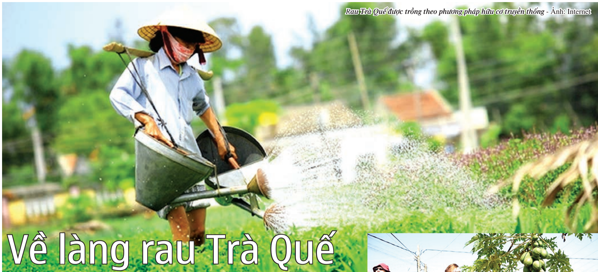
Rau Trà Quế được trồng theo phương pháp hữu cơ truyền thống