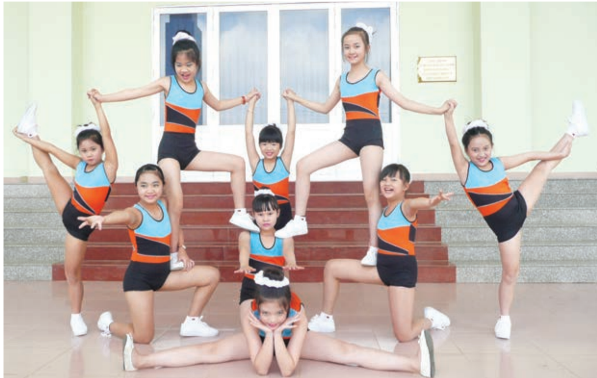
Aerobic đang phát triển rất mạnh hiện nay trong nhiều trường học trong tỉnh. Trong ảnh: Một tiết mục tại giải Aerobic tỉnh Lâm Đồng.

khóa, Sở GD Lâm Đồng còn chỉ đạo các trường học, các cơ sở giáo dục đẩy mạnh các hoạt động thể thao ngoại khóa cho sinh viên, học sinh theo đặc điểm từng bậc học, từng địa phương. Các hoạt động ngoại khóa này không chỉ phát động phong trào cho có mà cần hướng vào thực chất, có tác dụng động viên khuyến khích học sinh, sinh viên tự giác tham gia tập luyện thể thao, hình thành thói quen rèn luyện thân thể thường xuyên. Ngành khuyến khích học sinh bậc tiểu học có thể tham gia các môn cờ vua, Aerobic, bóng đá mini, bóng bàn, cầu lông; bậc THCS và THPT có nhiều hoạt động đa dạng hơn như bóng đá sân lớn, bóng chuyền, bóng rổ, vận động ngoài trời... Ngoài ra, các trường học phổ thông ở cả 3 cấp nên đưa các môn thể thao dân tộc như kéo co, đá cầu, các trò chơi dân gian vào tạo thêm nét vui tươi trong học đường.