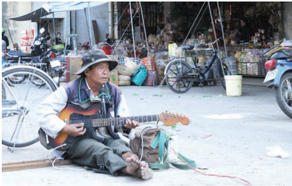
Ông an nhiên lặng lẽ ca ở chợ Tùng Nghĩa.

Lời hát lại tiếp tục rải ra, chen trong sự ồn ào, va vào lưng - vai - môi - mắt... người, lèn qua tà áo, vấy ngấn váy dài và cả trùng trùng bước chân chật nê của người đi chợ. Năm mét cách đó là một cái ca nhựa to được đặt trên một bệ gỗ nhỏ để mọi người tiện tay dừng lại bỏ tiền vào. Người kia ngồi bệt dưới đất hát, đơn chiếc, cứ hát say sưa, không để ý đến cái ca nhựa lẫn người qua.