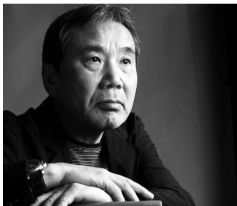
Nhà văn Haruki Murakami.

Tiểu thuyết gia người Nhật là tác giả được yêu thích nhất mùa giải năm nay, theo tỷ lệ đặt cược của nhà cái Ladbrokes.