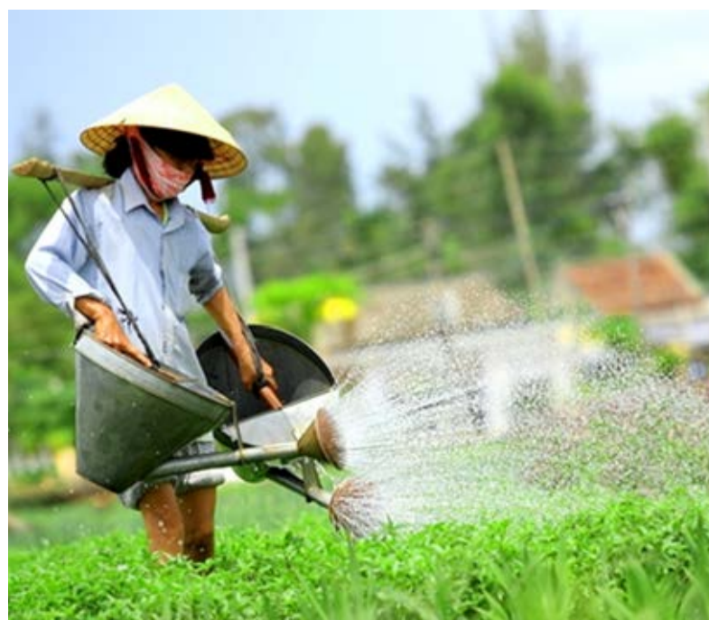
Rau Trà Quế được trồng theo phương pháp hữu cơ truyền thống.