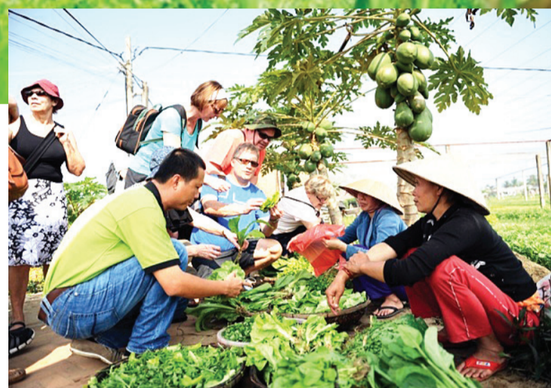
Du khách thích thú mua sản phẩm rau Trà Quế

Đến với làng rau Trà Quế, du khách sẽ được trở thành những người nông dân trồng rau thực thụ trong những bộ áo quần nông dân, dép lê, nón lá, được