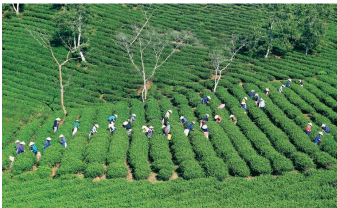
Hái chè ở đồi chè cổ Cầu Đất.