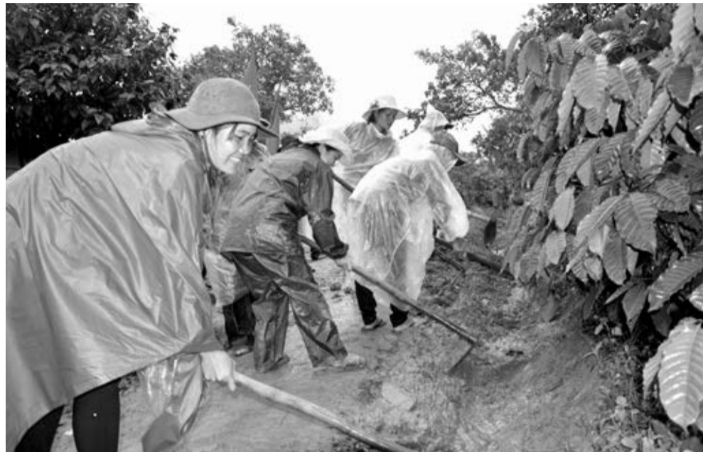
Mặc dù thời tiết mưa lớn kéo dài, nhưng các thành viên trong Đoàn công tác đều hăng hái tham gia thực hiện các chương trình phần việc đã đề ra theo kế hoạch.

Ghi nhận thêm từ Ban chỉ huy Quân sự huyện Đam Rông - Cơ quan thường trực Ban chỉ đạo 502 huyện Đam Rông: Đợt dân vận này thật sự là câu nói ngắn nhất và hiệu quả nhất trong công tác thắt chặt tình đoàn kết giữa bà con các dân tộc trong xã. Điều này được thể hiện rõ trong công tác tập hợp thanh niên. Ban ngày, lực lượng này xông xáo đi đầu trong việc tham gia tất cả các hoạt động. Đêm về, họ lại quây quần bên nhau. Ngoài trời mưa tầm tã còn trong hội trường nhà văn hóa thì chật kín không còn chỗ đứng. Hơn 200 thanh niên các dân tộc sinh sống trong toàn xã đã đến bên nhau lắng nghe phổ biến các kiến thức về pháp luật và cùng sinh hoạt