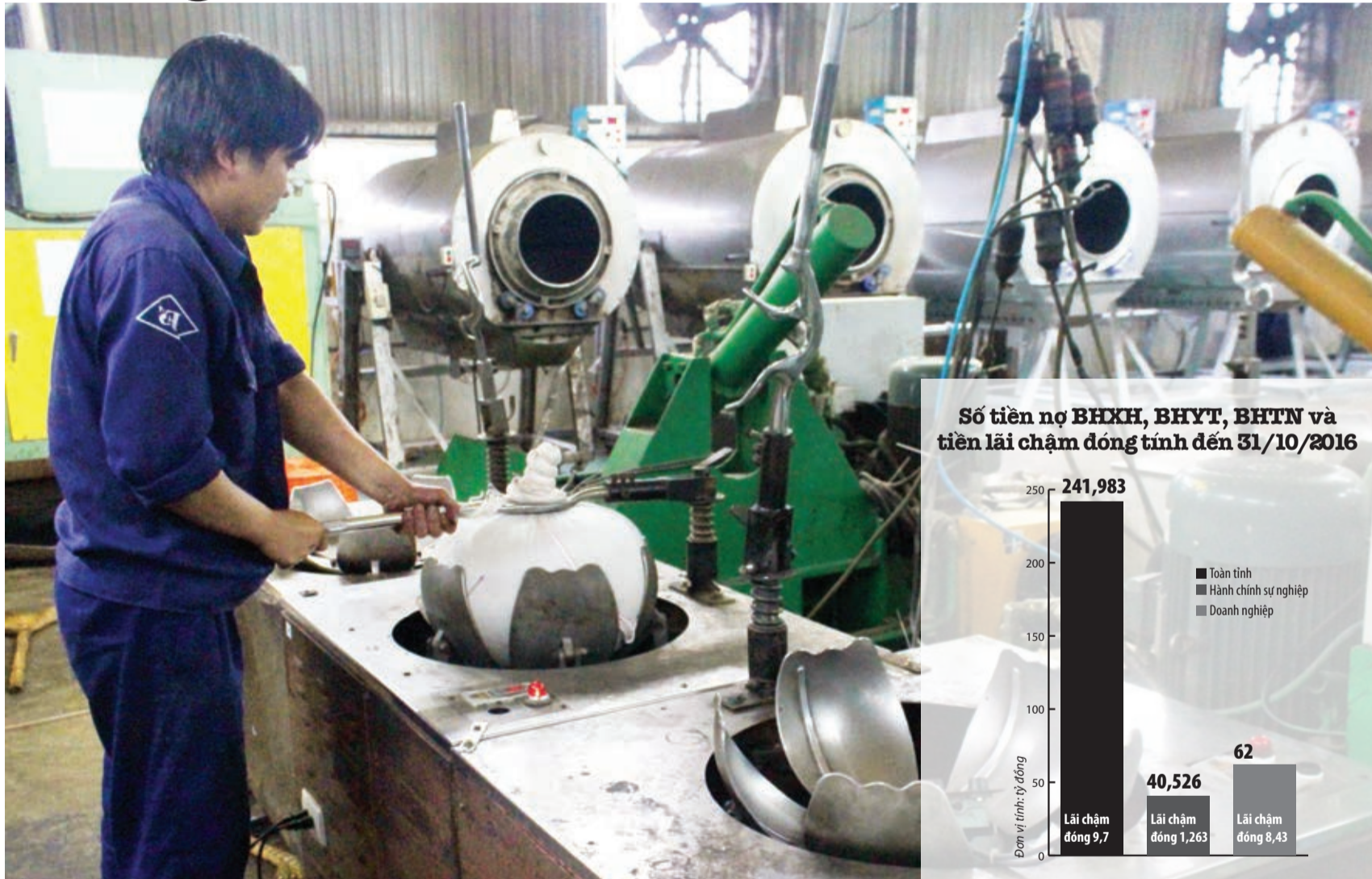
Doanh nghiệp nợ BHXH sẽ ảnh hưởng tới quyền lợi chính đáng của người lao động