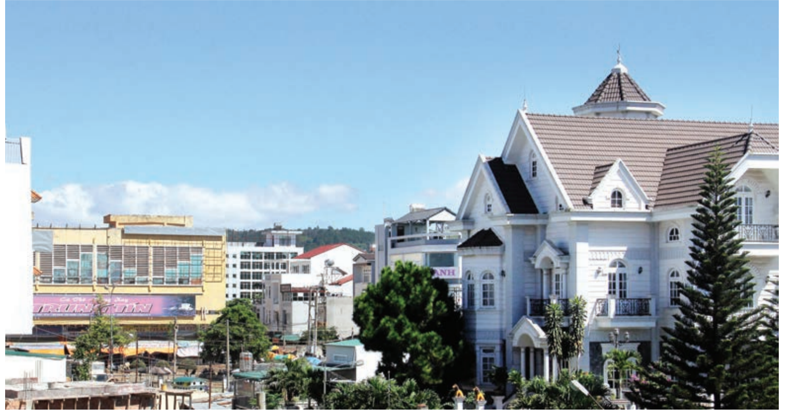
Một góc trung tâm huyện Đức Trọng hôm nay.

Với vị trí thuận lợi và tụ hội nhiều điều kiện, huyện Đức Trọng không chỉ là một trung tâm kinh tế lớn của tỉnh Lâm Đồng, mà còn hướng đến trở thành thị xã. Xu hướng phát triển này cũng đã được nguyên Thủ tướng Chính phủ Nguyễn Tấn Dũng đồng ý về chủ trương, và đang là quyết tâm chính trị của tỉnh, huyện - phù hợp với nguyện vọng người dân.