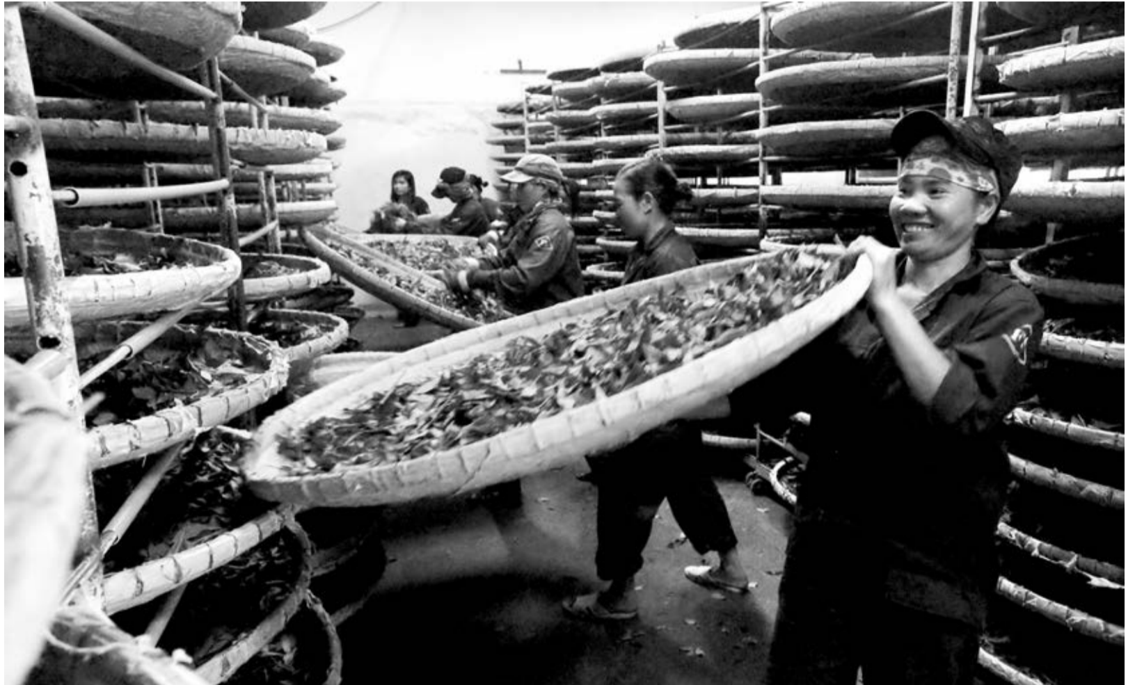
Doanh nghiệp nợ BHXH sẽ ảnh hưởng tới quyền lợi chính đáng của người lao động.