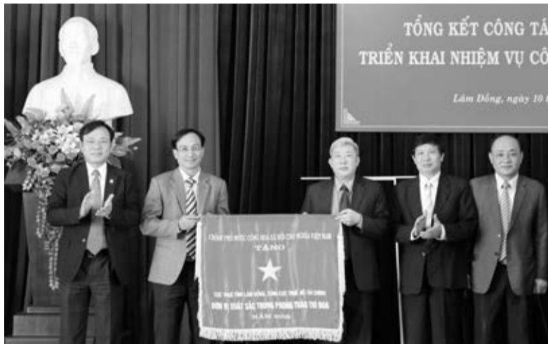
Lãnh đạo Cục Thuế nhận Cờ Thi đua của Chính phủ.