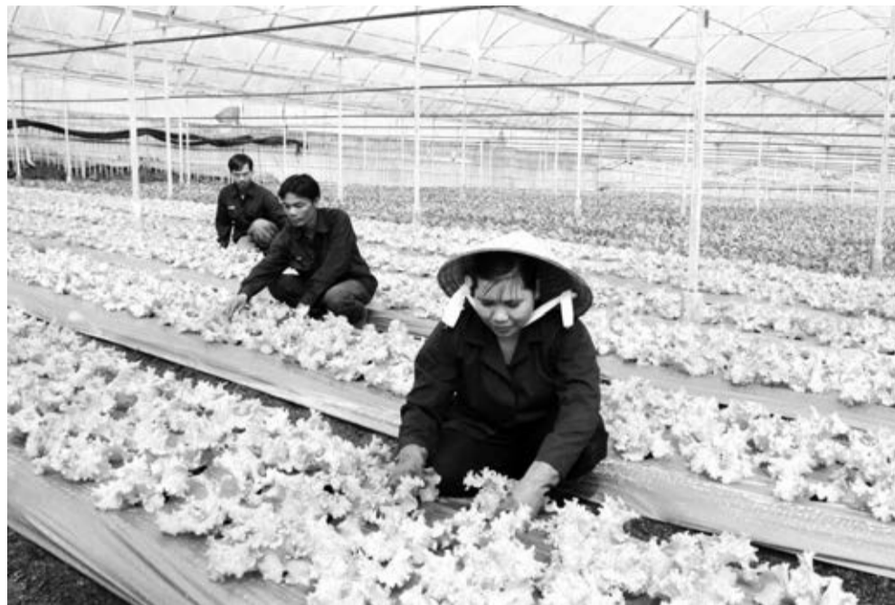
Sản xuất rau cao cấp tại Đà Lạt.

Bên cạnh đó, các vấn đề khác như, thiết chế văn hóa cơ sở chưa đáp ứng nhu cầu sinh hoạt của nhân dân; chất lượng giáo dục, chăm sóc y tế và các hoạt động văn hóa, thể thao có mặt chưa đạt yêu cầu, đời sống của một bộ phận