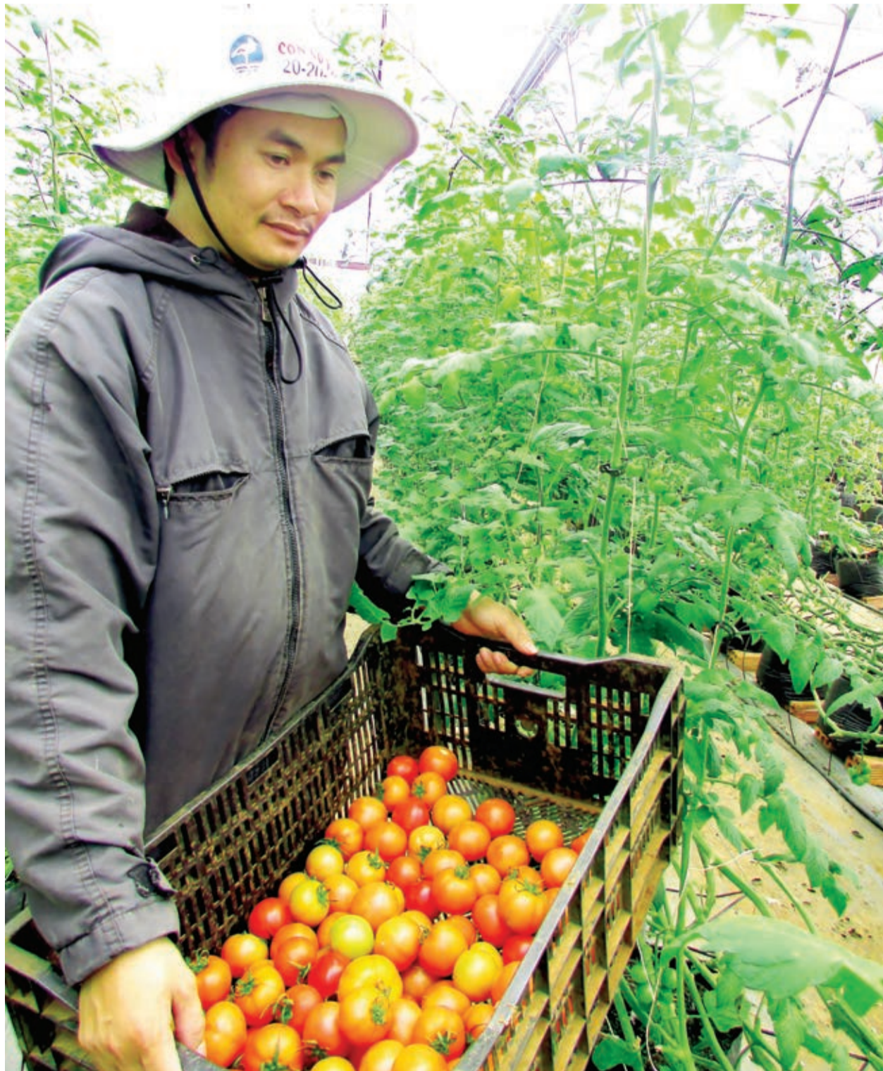
Gắn nhãn hiệu "Rau Đà Lạt", cà chua VietGAP ở Đơn Dương đang sản xuất theo chuỗi giá trị cung ứng cho siêu thị trong nước.