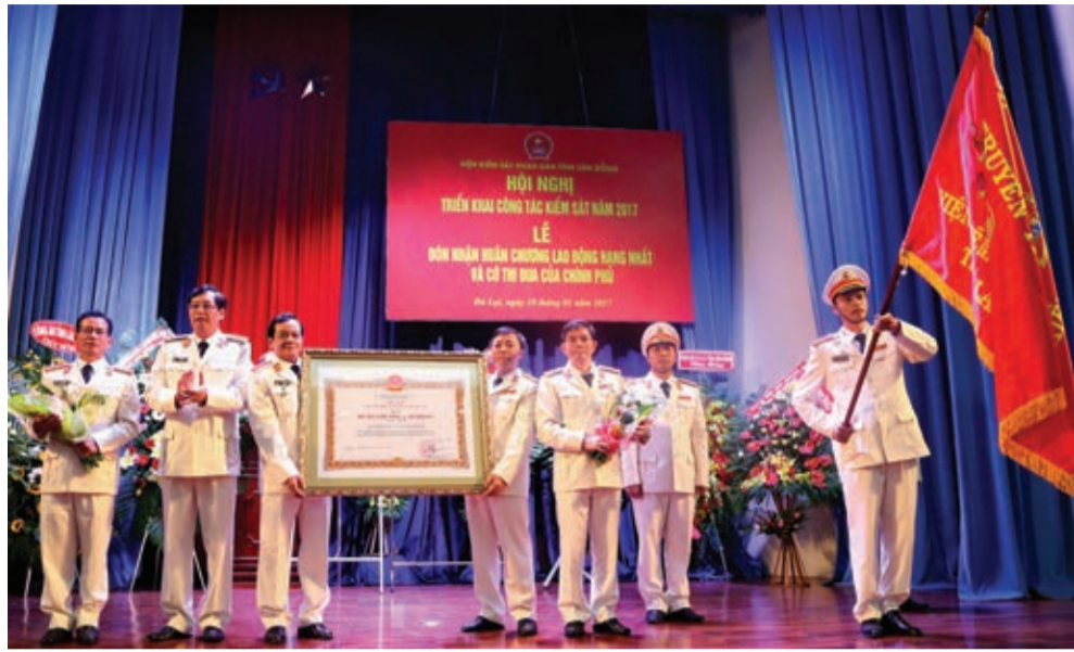
VKSND Lâm Đồng nhận Huân chương lao động hạng Nhất của Chủ tịch nước trao tặng sáng 10/1.

Triển khai kế hoạch công tác năm 2017, VKS đặt ra yêu cầu giữ vững các chỉ tiêu đơn vị hoàn thành tốt trong năm 2016 và phát huy các chỉ