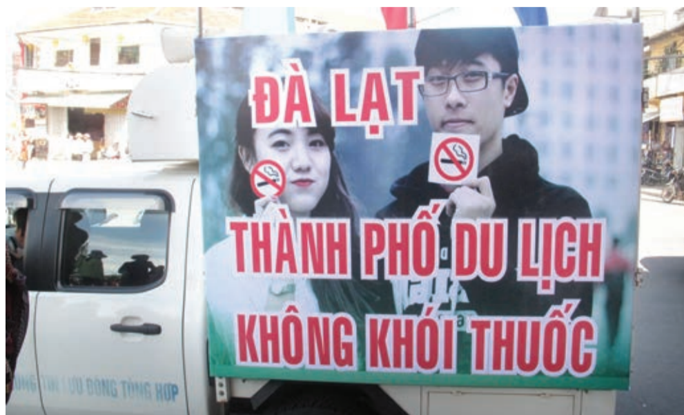
Xe loa cổ động kêu gọi mọi người chung tay xây dựng Đà Lạt - Thành phố du lịch không khói thuốc.