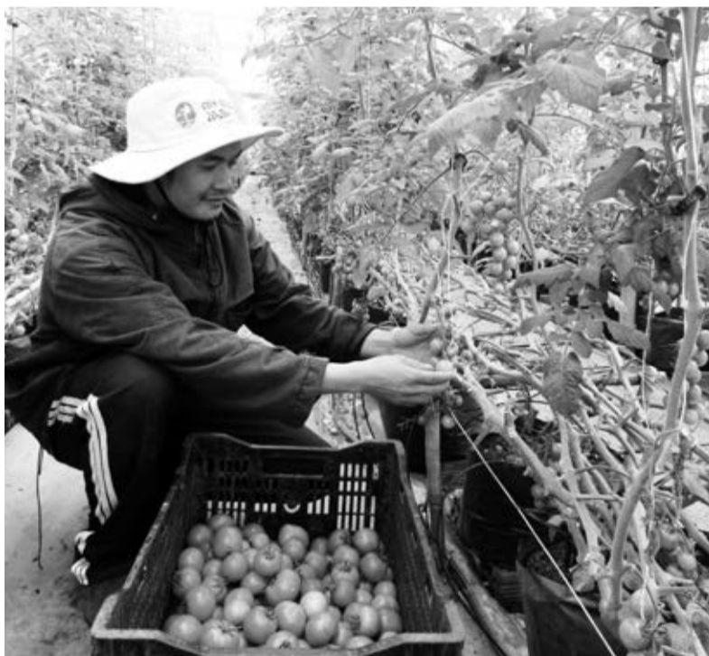
Gắn nhãn hiệu "Rau Đà Lạt", cà chua VietGAP ở Đơn Dương đang sản xuất theo chuỗi giá trị cung ứng cho siêu thị trong nước.

"Sau 10 năm khởi nghiệp sản xuất cà chua gắn với việc khai thác thị trường đầu ra - may mắn không chỉ mang lại nhuận cần bán sau mỗi chuyến hàng, mà còn được kết nối với bạn hàng lớn từ nhiều vùng miền trong nước đến cùng hộ gia đình chúng tôi trên đất Đa Ròn, Đơn Dương để khảo sát thực địa, ký kết hợp đồng theo chuỗi giá trị hơn 20 mặt hàng rau các loại. Trong đó đáng