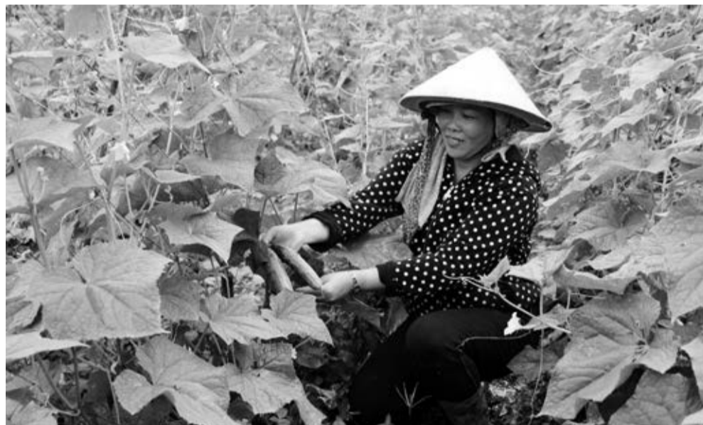
Chị em phụ nữ trồng dưa leo.