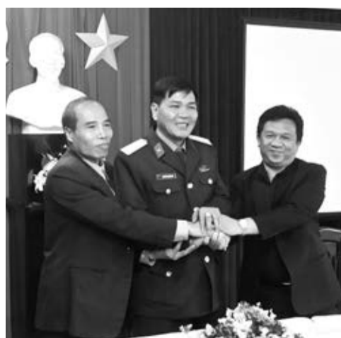
Lãnh đạo 3 cơ quan cam kết thực hiện tốt chương trình phối hợp. Ảnh: H.Hải

Thực hiện chương trình phối hợp, năm 2016, 3 đơn vị đã duy trì và thực hiện có hiệu quả các chuyên mục, chuyên trang, chuyên đề, các tin, bài về lĩnh vực quân sự