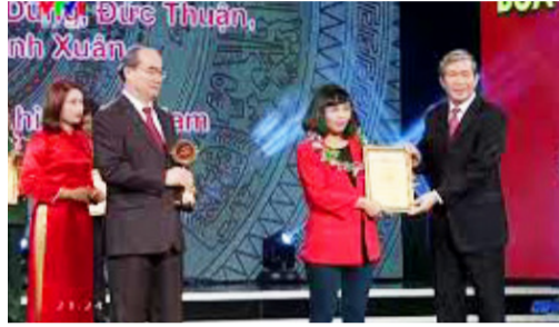
Trao giải cho tác giả đoạt giải nhất.

Giải báo chí toàn quốc về xây dựng Đảng do Ban Tổ chức TƯ, Tạp chí Cộng sản, Đài Truyền hình Việt Nam chủ trì phối hợp với Ban Tuyên giáo TƯ, Bộ TT&TT, Hội Nhà báo Việt Nam phát động nhân kỷ niệm 126 năm ngày sinh Chủ tịch Hồ Chí Minh.