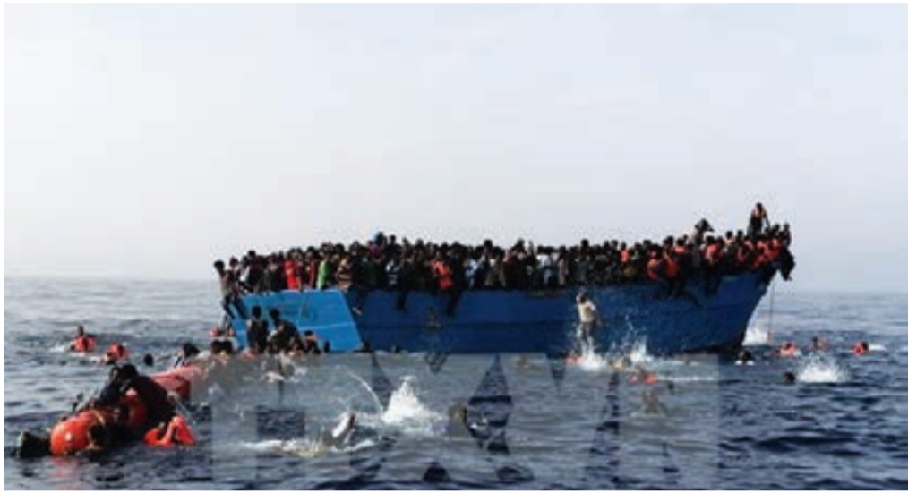
Người di cư chờ được cứu trên Địa Trung Hải.

Lực lượng bảo vệ bờ biển Italy ngày 2/2 cho biết hơn 1.400 người di cư đã được giải cứu ở Địa Trung Hải chỉ trong vòng 24 giờ, giữa lúc các nhà lãnh đạo Liên minh châu Âu (EU) đang chuẩn bị cho một cuộc gặp thượng đỉnh tại thủ đô Valletta của Malta vào ngày 3/2 để thảo luận về việc ngăn chặn dòng người di cư từ Bắc Phi đến châu Âu.