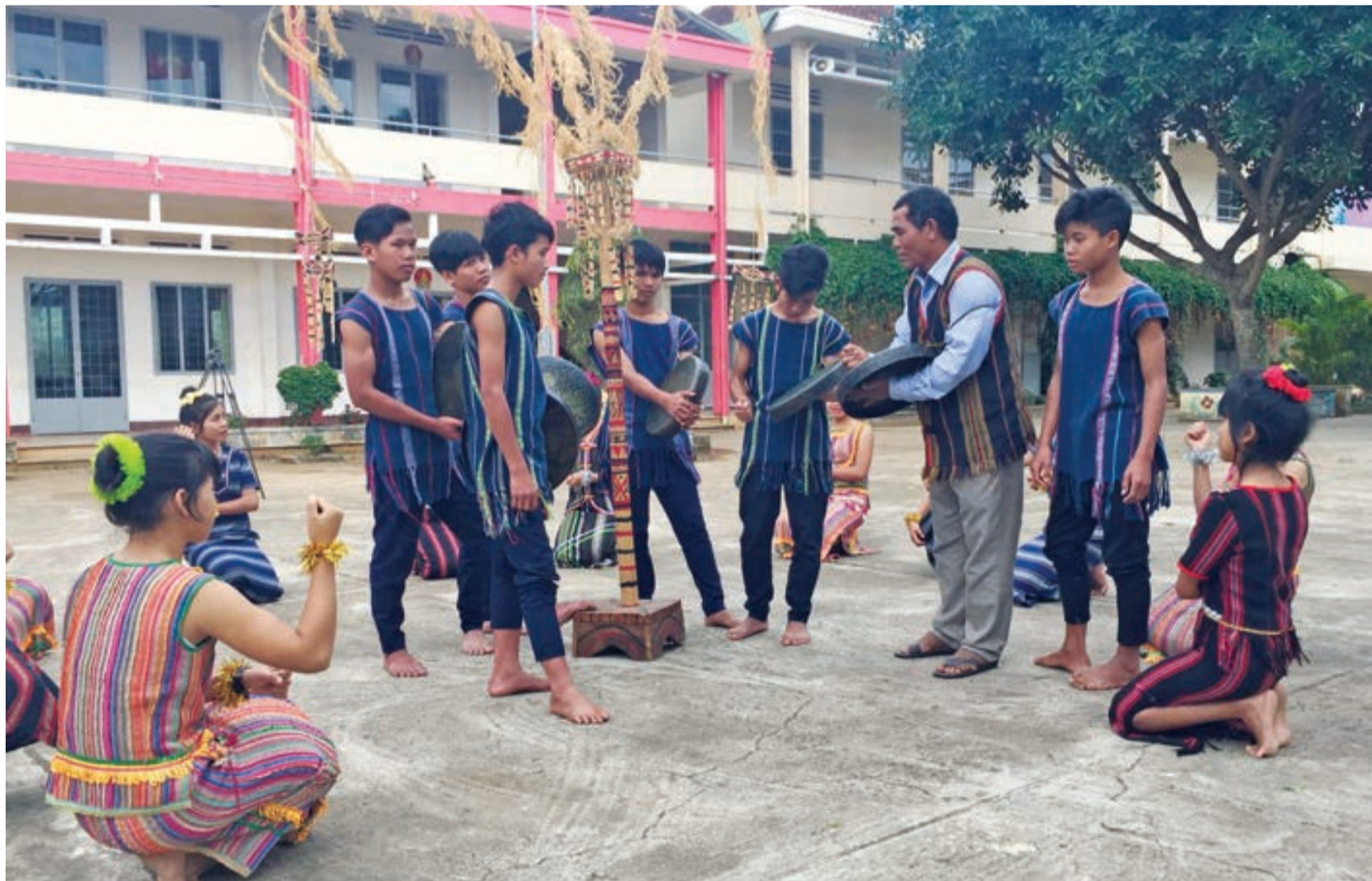
Già làng K'Bon hướng dẫn nhóm học sinh tập lại bài chiêng ngay giữa sân Trường Dân tộc nội trú Di Linh.