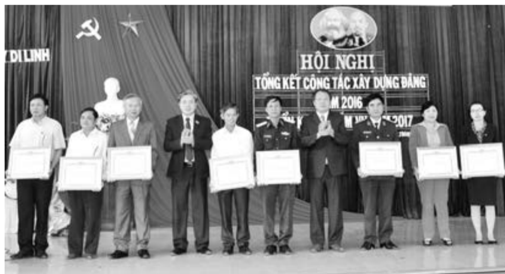
Huyện ủy Di Linh trao Giấy khen 8 TCCSD TSVM tiêu biểu năm 2016 tại Hội nghị tổng kết công tác xây dựng Đảng năm 2016.