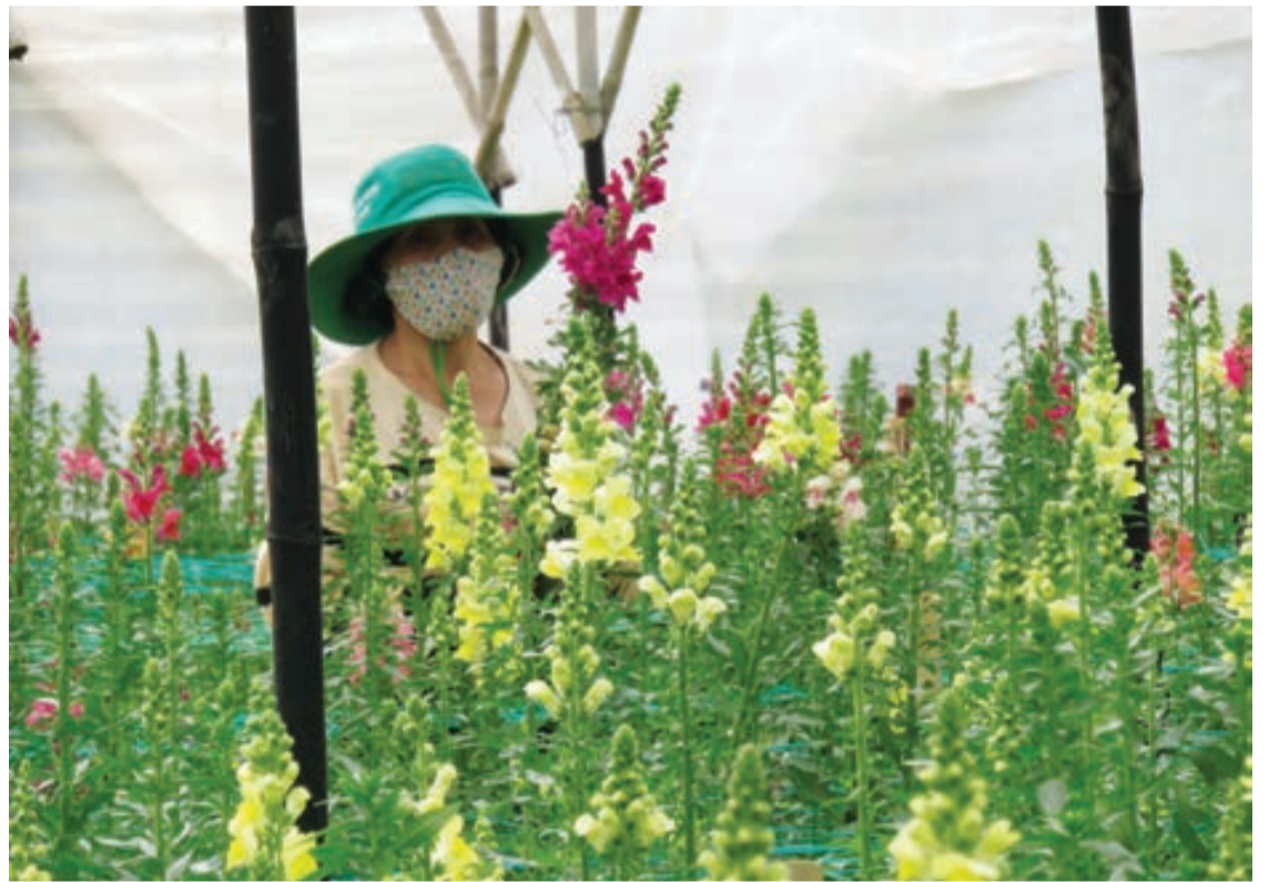
Sản xuất hoa công nghệ cao tại xã nông thôn mới Lộc An, huyện Bảo Lâm.

Ở cấp huyện, Ban Dân vận Huyện ủy phối hợp với Mặt trận và các tổ chức đoàn thể chính trị xây dựng kế hoạch triển khai thực hiện phong trào thi đua “Dân vận khéo” gắn với các phong trào thi đua của mặt trận, các đoàn thể và các cuộc vận động lớn do Đảng-Nhà nước phát động, chẳng hạn như: Phong trào BVANTQ, phong trào Toàn dân đoàn kết xây dựng đời sống văn hóa, phòng chống tệ nạn xã hội của mặt trận, hoặc phong trào “Tuổi