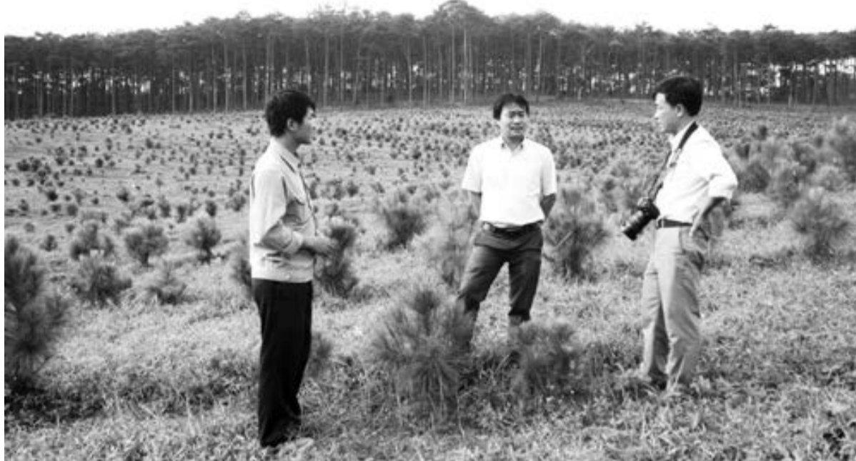
Rừng thông 5 năm tuổi đang lên xanh tốt của Công ty TNHH MTV Bảo Lâm.

"Hiệu quả của rừng trồng sau khai thác phụ thuộc rất lớn vào thời gian sinh trưởng và phát triển dài hay ngắn của giống cây trồng, chính vì vậy trên diện tích lớn, công ty chúng tôi đã lựa chọn cây thông, cây keo để trồng. Công ty trực tiếp