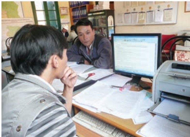
Giải quyết thủ tục hành chính tại một xã vùng ven Đà Lạt.

Trong khối 16 phường, xã (gồm 12 phường, 4 xã) của thành phố, tổng cộng có 328 CBCCVC gồm 167 cán bộ chuyên trách, 161 công chức, người lao động, trong số này có 61 hợp đồng lao động. Phần lớn CBCCVC cấp phường, xã của Đà Lạt đã qua bậc đại học với 218 người, có 4 người tốt nghiệp cao đẳng, trung cấp 91 người và vẫn còn 13 người chưa