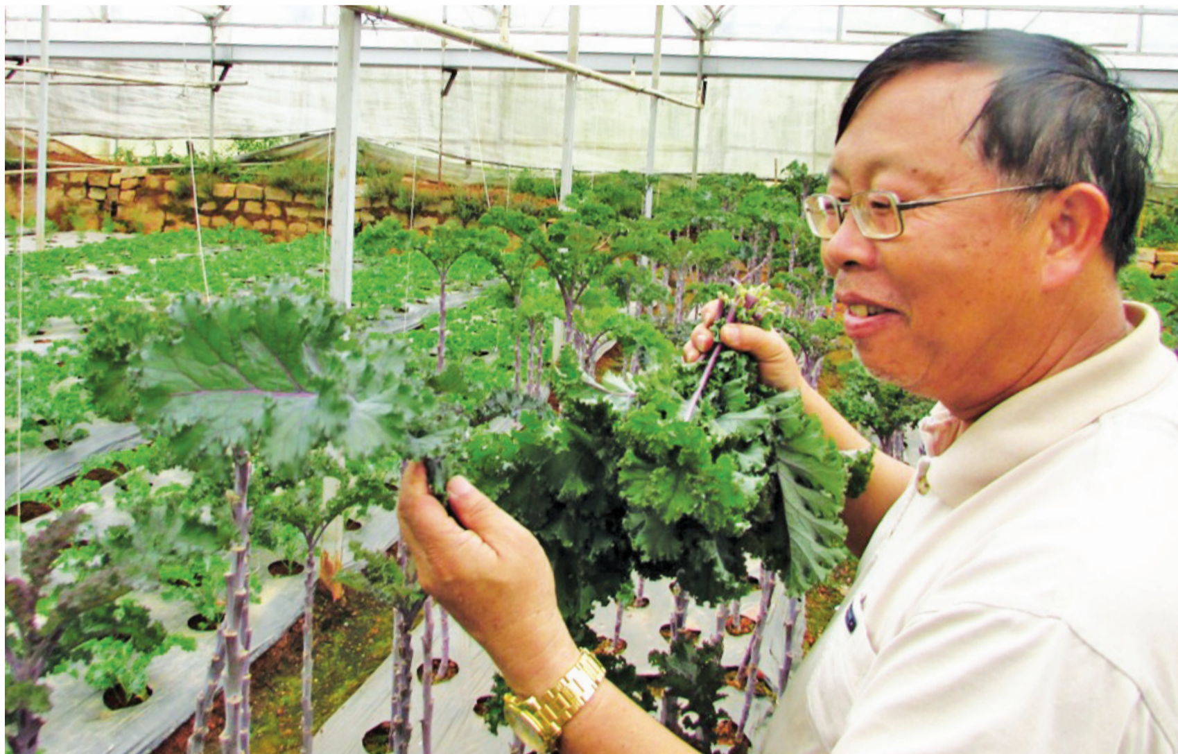
Hoạt động theo mô hình kiểu mới, HTX Xuân Hương Đà Lạt đảm bảo lợi nhuận cho hộ gia đình thành viên khoảng 500 triệu đồng/ha/năm.