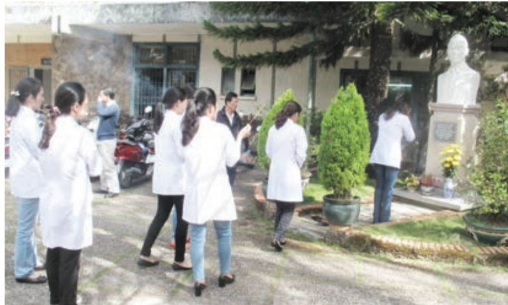
Cán bộ y tế Bệnh viện YHCT Phạm Ngọc Thạch dâng hương tại tượng BS Phạm Ngọc Thạch - Người đã kế thừa phát triển thành tựu YHCT của hai vị danh y nổi tiếng Tuệ Tĩnh và Hải Thượng Lãn Ông.

Tuệ Tĩnh là vị danh y của Việt Nam đã mở đường cho sự nghiên cứu thuốc Nam, xây dựng nền móng cho y học dân tộc của nước nhà, xây dựng một quan điểm y học độc lập, tự chủ, sát với thực tế Việt Nam: "Thuốc Nam Việt chữa người Nam Việt" được nhân dân tôn xưng ông là "Vị thánh thuốc Nam". Về mặt y học, ông là thầy thuốc đầu tiên trong