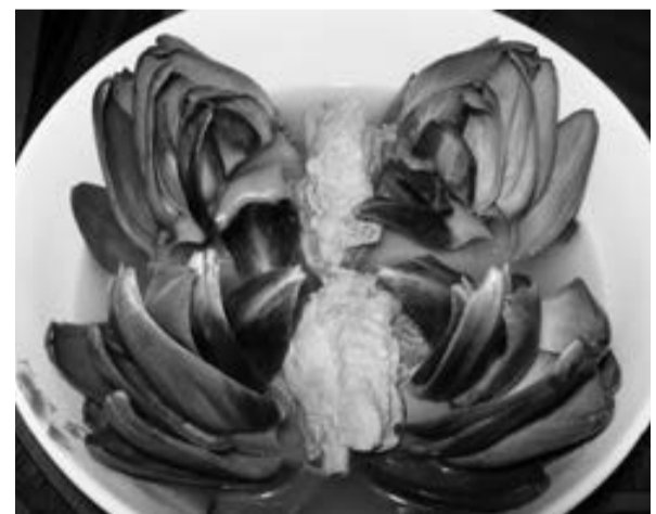
Canh Atiso hầm giò heo.

Món canh Atiso hầm giò heo là món ăn riêng có của Lâm Đồng - Đà Lạt, bông Atiso bổ dưỡng có công dụng an thần, thanh nhiệt, khử độc được hầm nhừ hòa vào vị béo ngậy của giò heo sẽ mang đến cho người dùng hương vị khác lạ. Bánh ướt lòng gà là món ăn bình dân được chế biến khéo léo kết hợp với các loại rau thơm - xả lách Đà Lạt hòa vào nước chấm,