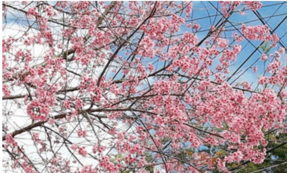
Hoa Anh đào Đà Lạt.

Thân cành cây này giống cây Đào, hoa giống cây Mai nên người Đà Lạt gọi tên là Mai anh đào. Cây Anh đào là loại cây gỗ nhỏ, rụng lá, nhánh không lông, cao đến 10 m; lá hình trái xoan mũi nhọn, phiến lá mỏng, mép