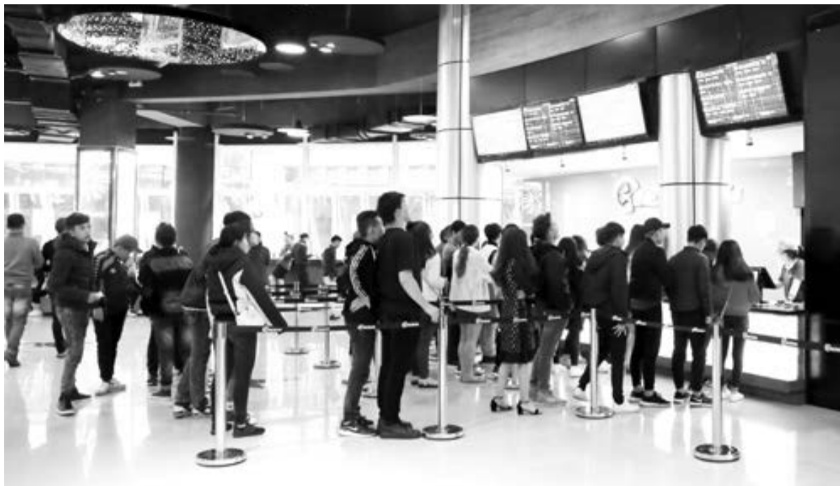
Khán giả tới xem phim đông đúc tại Cụm rạp chiếu phim mới mở tại tầng hầm Quảng trường Lâm Viên.

Theo nhiều khán giả xem phim tại đây, người Đà Lạt mê điện ảnh từ xưa, nhưng khoảng hơn chục năm trở lại đây, người dân muốn thưởng