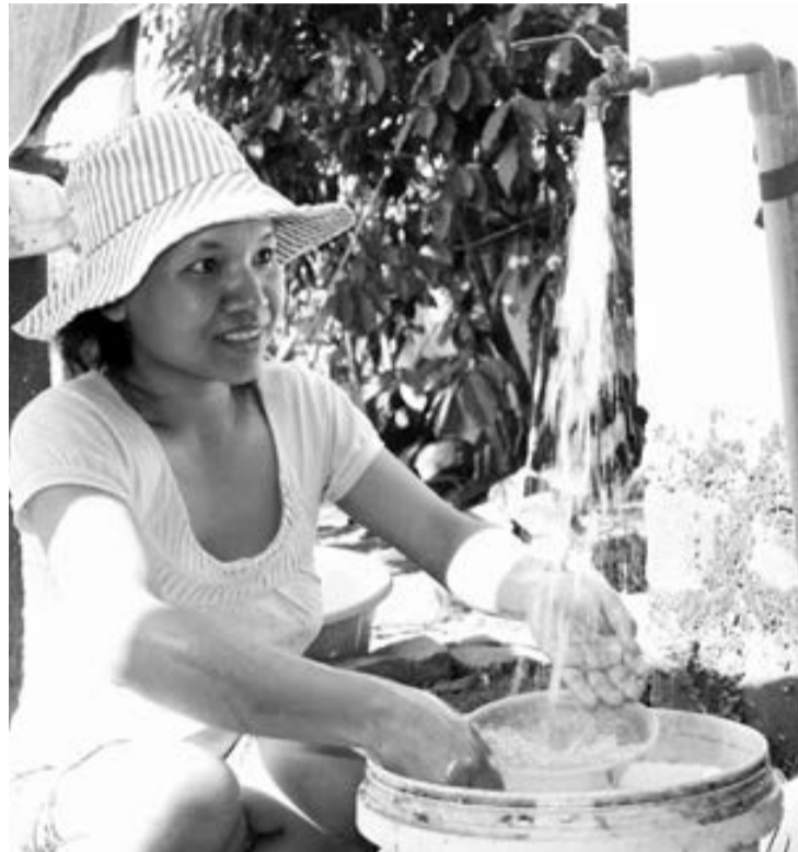
Nước sinh hoạt hợp vệ sinh đã về đến tận nhà các hộ dân đồng bào DTTS tại buôn B' Lao Srê.

Trước thực trạng trên, vào tháng 10/2016, bằng sự hỗ trợ nguồn vốn của Nhà nước, công trình giếng khoan đã được khởi công xây dựng để phục vụ nguồn nước sinh hoạt cho bà con nơi đây. Giếng khoan được thiết kế với 1 bồn chứa nước 5.000 lít và 3 hệ thống ống dẫn nước về tới nhà các hộ dân trong buôn. Sau hơn 2 tháng thi công, công trình giếng khoan này đã được hoàn