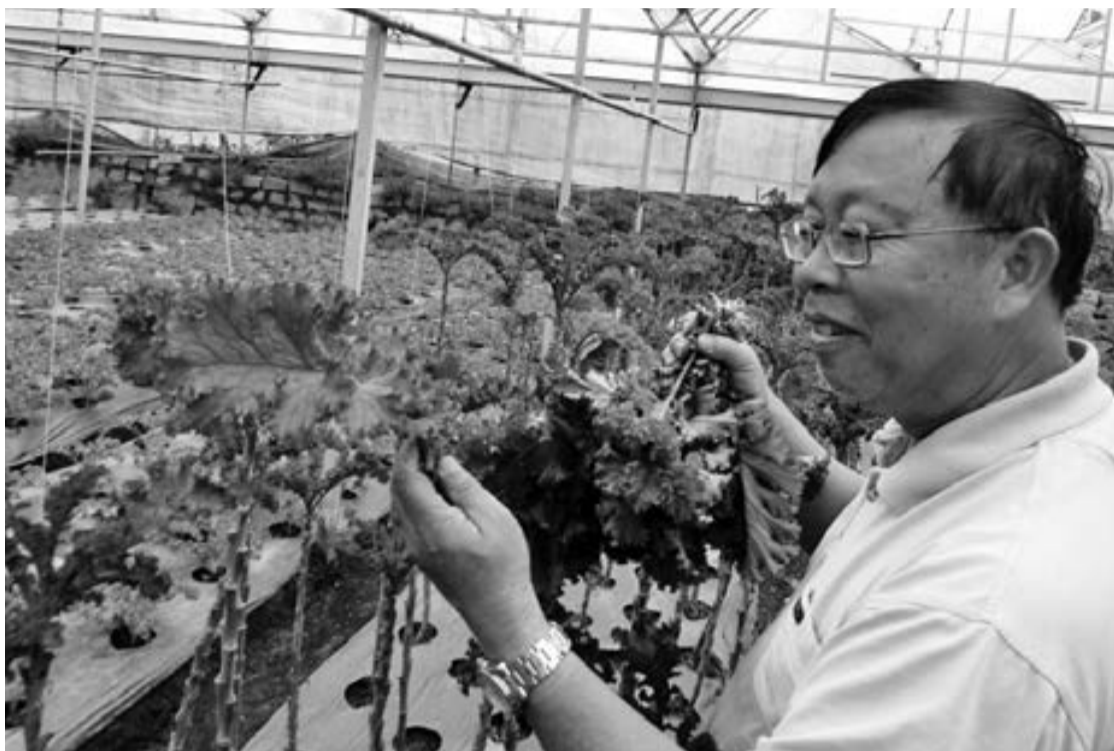
Hoạt động theo mô hình kiểu mới, HTX Xuân Hương Đà Lạt đảm bảo lợi nhuận cho hộ gia đình thành viên khoảng 500 triệu đồng/ha/năm.

Theo đó, ở khâu đầu vào, HTX Anh Đào cung cấp cây giống, vật tư nông nghiệp, thuốc bảo vệ thực vật trong danh mục cho phép và phân công kỹ sư nông nghiệp trực tiếp hướng dẫn, theo dõi hộ gia đình thành viên canh tác các loại rau đạt tiêu chuẩn VietGAP, sản phẩm thu hoạch đảm bảo an toàn