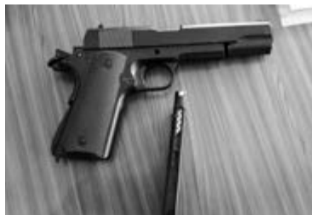
Khẩu súng thanh niên tên Huy dùng để đòi nợ.

Sáng ngày 10/2, Đội Cảnh sát 113 - Phòng Cảnh sát quản lý hành chính về trật tự xã hội, Công an Lâm Đồng cho biết, đơn vị vừa thu một khẩu súng của một thanh niên đi đòi nợ bất thành xây ra tại phường 6 TP Đà Lạt sáng ngày 9/2.