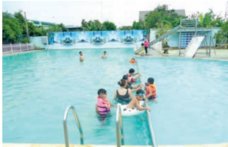
Tại hồ bơi Phương Anh ở thị trấn Đa Têh.

Đầu tư cao, chi phí duy trì một bể bơi cũng tốn không ít tiền (từ tiền nước, hóa chất lọc nước, đến thuê huấn luyện viên (HLV), thuê nhân công bảo quản bể bơi...) nên giá vé vào cửa cho các bể bơi này thường không rẻ. Để bơi được, theo một HLV bơi, người học phải tham dự một khóa học ít nhất chừng 10