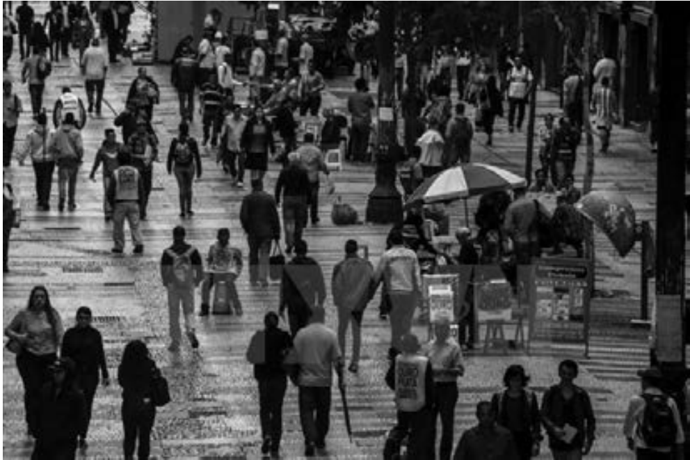
Người dân tại thành phố Sao Paulo, Brazil.

Nhân Ngày Tim mạch thế giới 29/9, Hiệp hội Tim mạch Israel đã công bố tỷ lệ tử vong ở bệnh nhân do mắc các bệnh lý tim mạch ở quốc gia này giảm 50% trong vòng 15 năm qua, đưa Israel trở thành một trong những quốc gia đi đầu về phát hiện, ngăn ngừa và điều trị các bệnh về tim mạch.