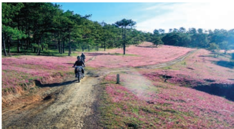
Khu vực diễn ra Mùa hội cỏ hồng Đà Lạt 2017.