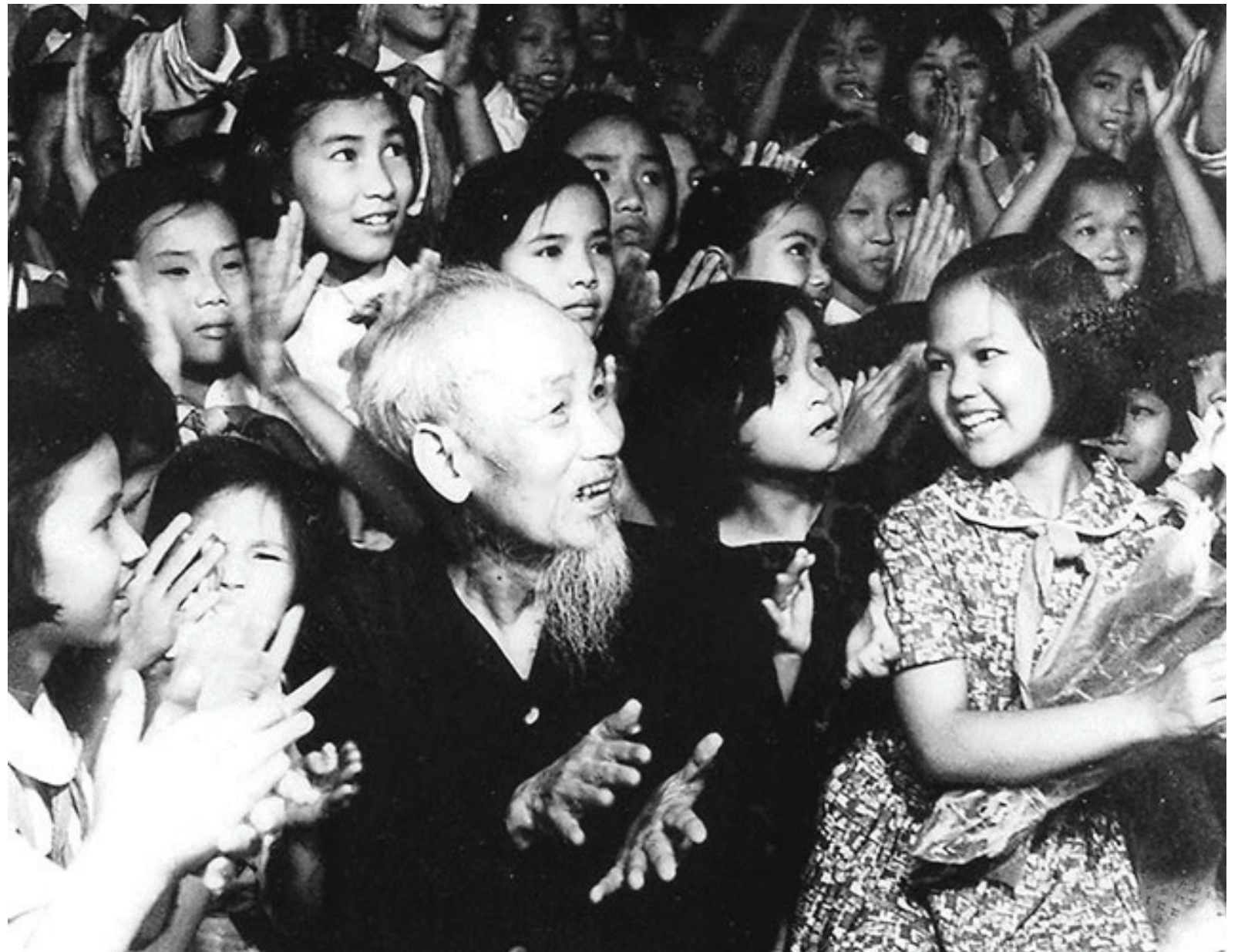
Bác đón Tết Trung thu cùng các em thiếu nhi. Ảnh tư liệu