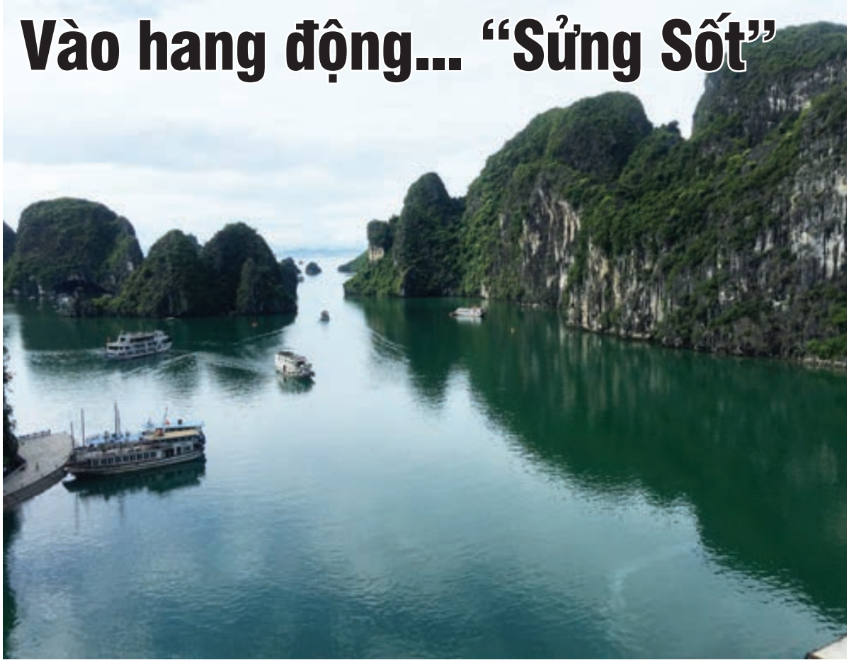
Từ trên cao của hang Sung Sốt, toàn cảnh Hạ Long hiện ra như một thiên đường.