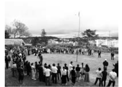
Ném còn là trò chơi dân gian mang tính cộng đồng cao đang được phát huy trong các ngày hội lớn.

Nhằm bảo tồn và phát triển các môn thể thao dân tộc và một số trò chơi dân gian, trong 10 ngày qua, Sở VH-TT-DL Lâm Đồng đã tổ chức tập huấn cho 236 cán bộ văn hóa xã, cán bộ Đoàn xã, thôn, tổ dân phố thuộc vùng đồng bào dân tộc thiểu số ở 12/12 huyện, thành trong tỉnh tại 3 cụm Di Linh, Lâm Hà và Đà Lạt.