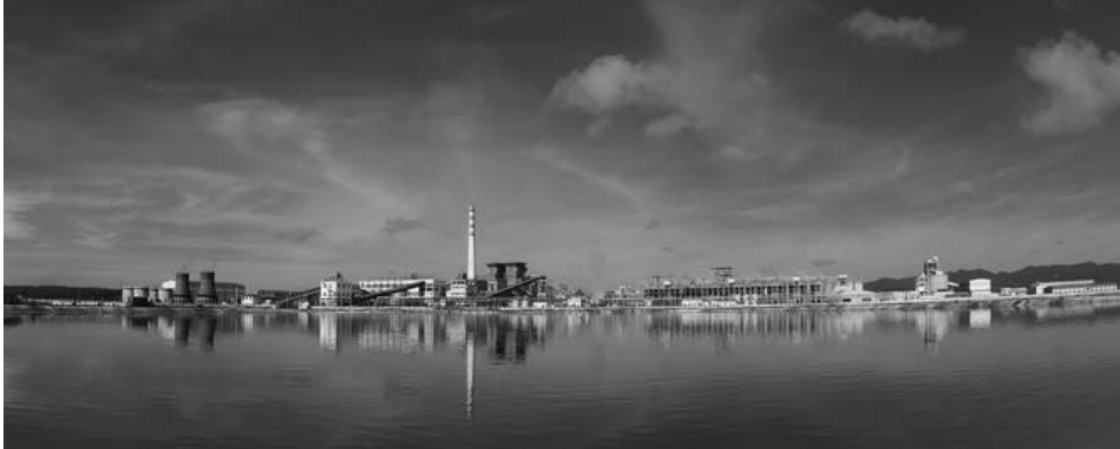
Toàn cảnh Nhà máy nhôm nhìn từ hồ bùn đỏ.

10 năm kể từ ngày khởi công xây dựng, 5 năm bắt đầu cho ra sản phẩm nhôm, 4 năm chính thức vận hành thương mại, Tổ hợp Bauxite - Nhôm Lâm Đồng đã trải qua nhiều khó khăn thử thách. Tuy nhiên, với quyết tâm "làm cho được và làm cho có hiệu quả" của tập thể cán bộ và công nhân trong Tổ hợp, đến nay, dự án này đã từng bước đem lại những kết quả bước đầu và đang vươn đến thành công trong tương lai không xa.