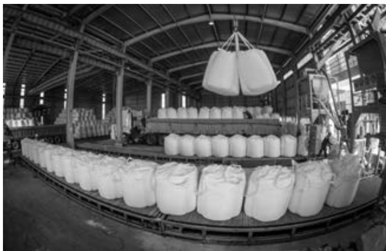
Đóng bao nhôm tại Nhà máy nhôm.

Những khó khăn, thử thách trong thời gian đầu đặt những "viên gạch" nền tảng rồi cũng qua đi. Ba hợp phần chính của tổ hợp gồm: Khai thác quặng bauxite nguyên khai, tuyển quặng và luyện nhôm đến thời điểm hiện tại đều đã vận hành trên 95% công suất. Mỏ bauxite Tây Tân Rai được Bộ Tài nguyên và Môi trường cấp giấy phép vào ngày 21/6/2010 với tổng diện tích khu vực khai thác rộng hơn 1.600 ha, được áp dụng công nghệ khai thác lộ thiên. Tổng trữ lượng khai thác gần 120 triệu tấn quặng. Công suất khai thác trung bình mỗi năm khoảng 4,3 triệu tấn. Từ năm 2011 đến nay, tổng sản lượng quặng đã được khai thác là hơn 15 triệu tấn. Quặng nguyên khai sau khi khai thác sẽ được đưa vào nhà máy tuyển quặng với công suất tuyển quặng tinh trung bình gần 1,8 triệu tấn/năm. Đến nay, nhà máy đã tuyển rửa được 6,6 triệu tấn quặng tinh để phục vụ cho việc sản xuất nhôm. Công tác sản xuất nhôm được lựa chọn theo công nghệ Bayer của Châu Mỹ. Hiện nay, đa số các nhà máy nhôm trên thế giới đều sử dụng phương pháp Bayer này. Thực tế sản xuất thời gian qua tại tổ hợp cho thấy, công nghệ sản xuất nhôm đang áp dụng là hợp lý. Trong quá trình vận hành, chất lượng sản phẩm nhôm luôn