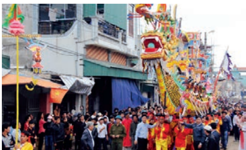
Lễ hội Cầu ngư (xã Ngư Lộc, huyện Hậu Lộc, tỉnh Thanh Hóa).

Bộ Văn hóa - Thể thao và Du lịch vừa ban hành Quyết định về việc công bố Danh mục Di sản văn hóa phi vật thể quốc gia, đợt 20.