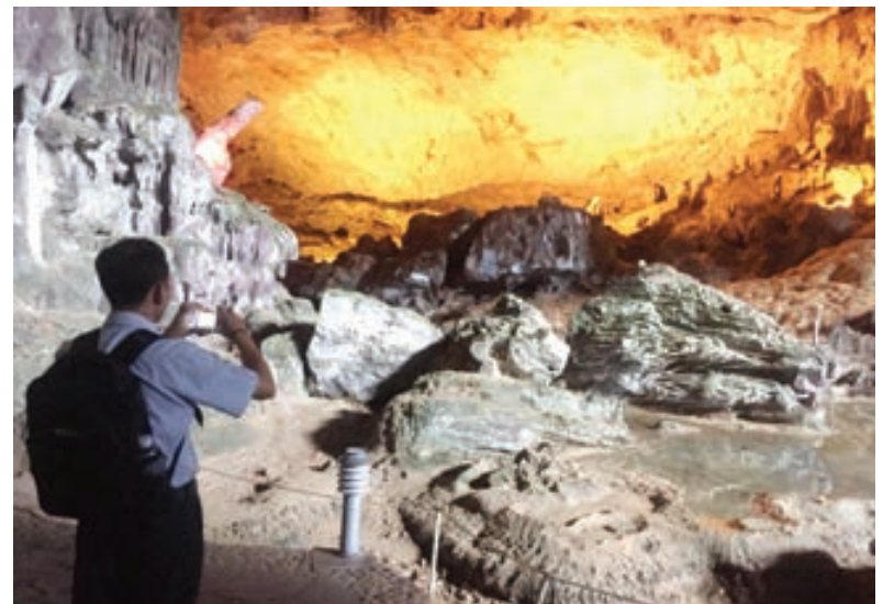
Măng đá mang nhiều hình thù khác nhau.

khoảng 10.000 m 2 , cao khoảng 30 m và được chia thành 2 khu vực chính. Khu vực thứ nhất khá rộng, có nhiều măng đá mang những hình thù khác nhau như: voi, hải cẩu, mâm xôi, hoa lá...; trần hang có nhiều nhũ đá rủ xuống giống