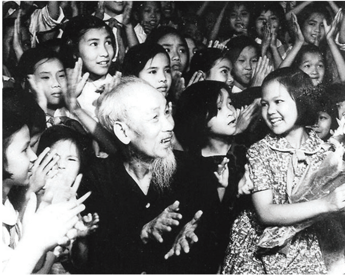
Bác đón Tết Trung thu cùng các em thiếu nhi. Ảnh tư liệu

ảnh các trẻ mục đồng vắt vẻo lưng trâu hát xướng với nhau - một hình ảnh rất nông thôn Việt Nam: “ Chăn trâu mấy trẻ con con/ Cùng nhau xướng hát véo von trên gò ”. Và khi nghe các em hỏi: “ Vì ai cha mẹ nghèo nàn/ Vì ai nhà cửa giang san tan tành ”, mượn một hình thức đối đáp, Bác Hồ đã vạch cho các em thấy nguyên nhân: “ Ấy là vì Nhật, vì Tây/ Ra tay vợ vệt đọa đầy chúng ta ”. Đây là một sự sáng tạo trong lối diễn xướng sân khấu truyền thống dân tộc làm cho các em dễ hiểu với không khí sinh động gần gũi với cuộc sống thôn quê mộc mạc hằng ngày để từ đó Người nhắn gửi với các em: “ Nhi đồng cứu quốc Hội ta/ Ấy là lực lượng/ Ấy là cứu sinh ”.