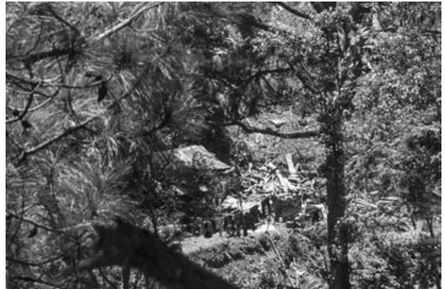
Cửa hầm chính vào địa đạo thiếc ở Núi Cao.