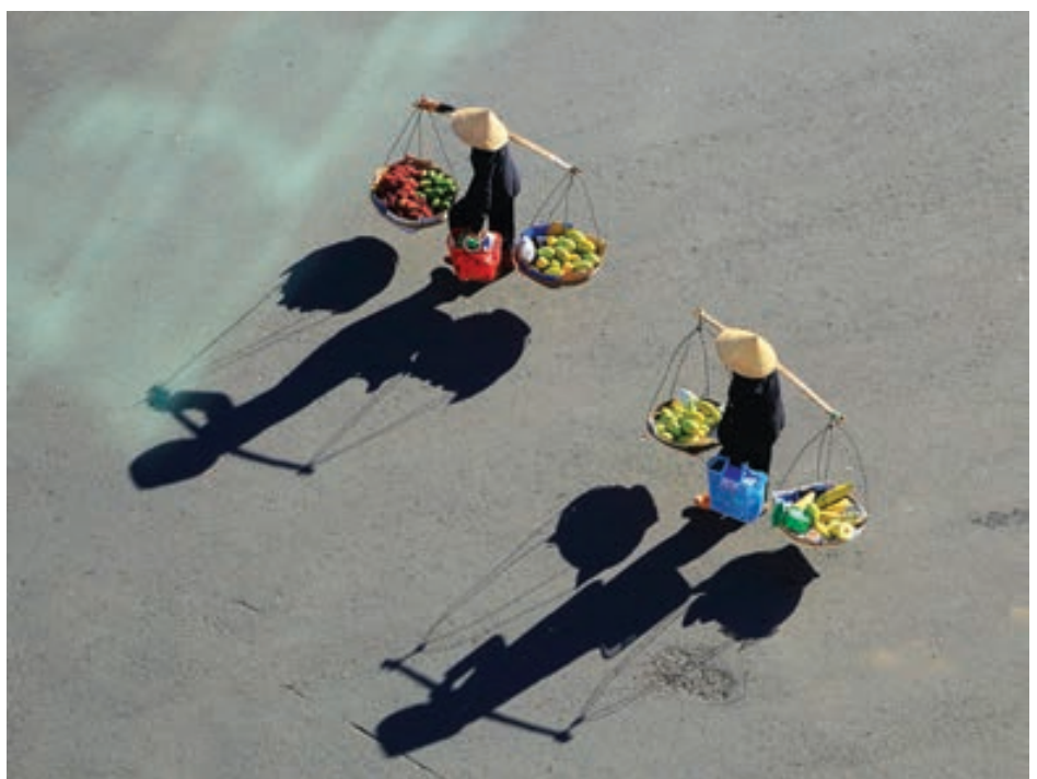
Đồng hành.