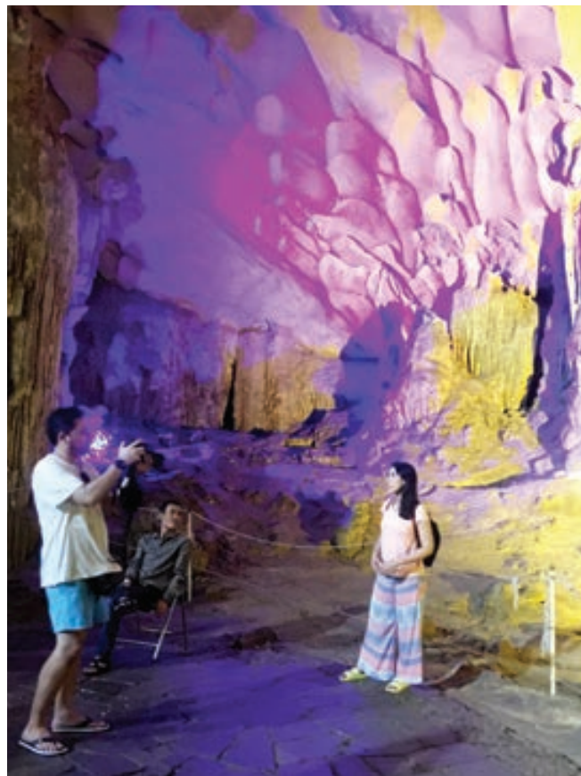
Du khách chụp hình lưu niệm với các nhũ đá phía trong hang.

Hang Sung Sốt nằm trên đảo Bồ Hòn thuộc khu vực trung tâm của Di sản thiên nhiên thế giới vịnh