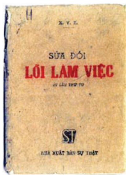
Tác phẩm “Sửa đổi lối làm việc” được Chủ tịch Hồ Chí Minh viết năm 1947.

Cùng với việc chỉ ra và phân tích rõ khuyết điểm, Hồ Chủ tịch cũng tập trung nêu lên những biện pháp toàn diện, đúng đắn và có tính hệ thống, đồng bộ để khắc phục khuyết điểm với phương hướng cơ bản là phải “Sửa đổi lối làm việc của Đảng”; mỗi cán bộ, đảng viên phải