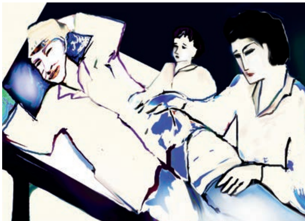
Minh họa: Thanh Toàn

quanh một chữ Nợ. Thời chiến, không có bố thì người đồng chí ấy đã nằm lại vĩnh viễn nơi cánh rừng đất phương Nam. Về lại thời bình, không có người bạn mạnh mẽ ấy chung một nỗi đau thì bố không thể nào vực dậy khi vợ chết, con đại.