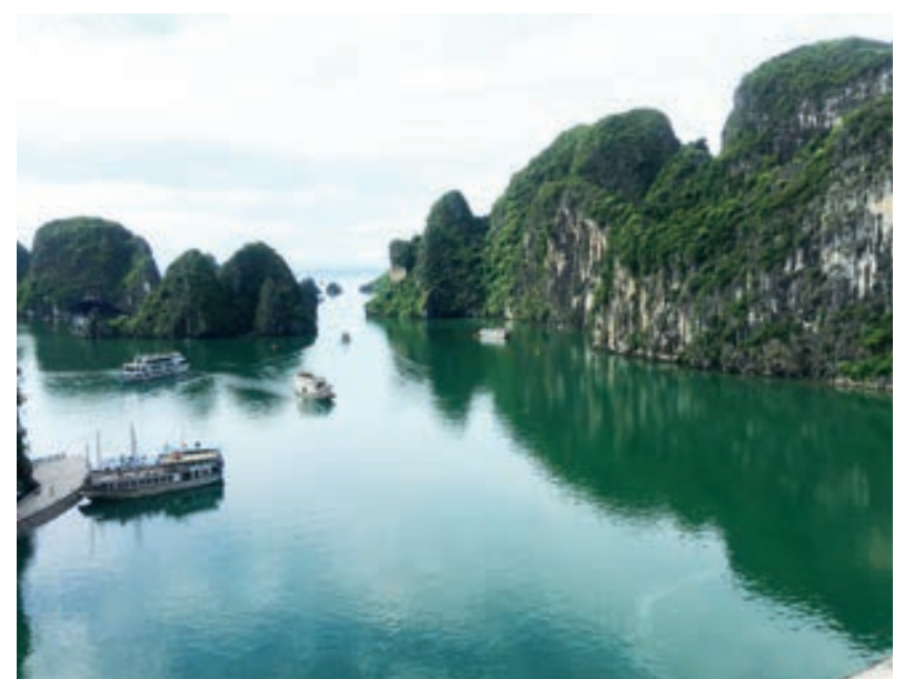
Từ trên cao của hang Sừng Sốt, toàn cảnh Hạ Long hiện ra như một thiên đường.