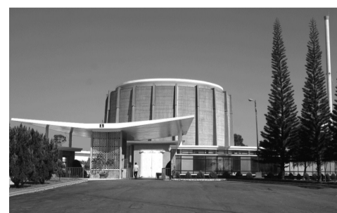
Lò phản ứng hạt nhân duy nhất của Việt Nam sản xuất ra nhiều sản phẩm ứng dụng đồng vị phóng xạ trong y học đã vươn ra thế giới.

và Khoa Y học hạt nhân của Bệnh viện Calmette (Campuchia) đã thống nhất về hợp tác xuất khẩu dược chất phóng xạ - một trong những sản phẩm được sản xuất trực tiếp trên lò phản ứng của Viện Nghiên cứu hạt nhân. Qua đó, Viện Nghiên cứu hạt nhân đã thống nhất ký kết hợp đồng xuất khẩu các sản phẩm Tc-99m Generator, I-131 viên nang và dung dịch của Viện sang Campuchia trong thời gian sớm nhất, bắt đầu từ cuối tháng 10/2017 với tần suất 2 tuần 1 lần. Ngoài việc đảm nhận dịch vụ vận chuyển đồng vị phóng xạ ứng dụng trong y học sang nước bạn, Viện Nghiên cứu hạt nhân Đà Lạt còn giúp Campuchia đào tạo cán bộ về kỹ thuật phóng xạ trong y học hạt nhân, đồng thời cử cán bộ của Viện sang