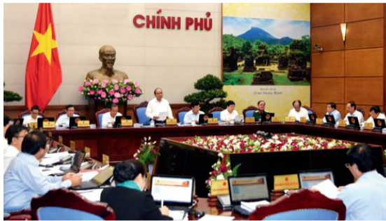
Quang cảnh phiên họp Chính phủ.