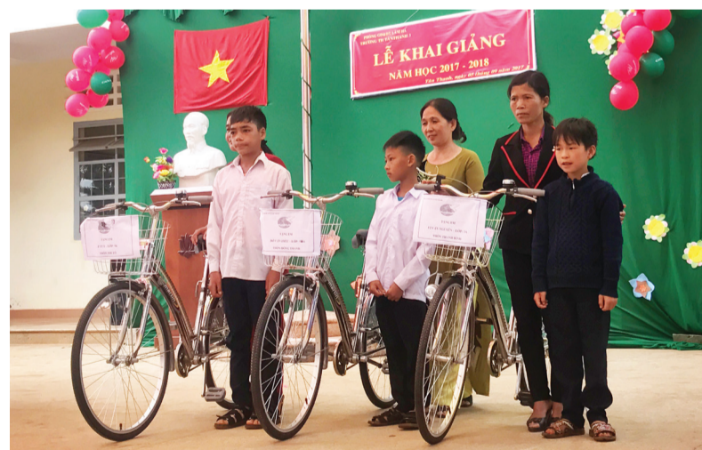
Trao xe đạp cho các học sinh có hoàn cảnh khó khăn trong Lễ Khai giảng năm học mới.

Năm học 2009-2010, thôn Đoàn Kết là thôn đầu tiên trong xã Tân Hà xây dựng Quỹ khuyến học. Anh