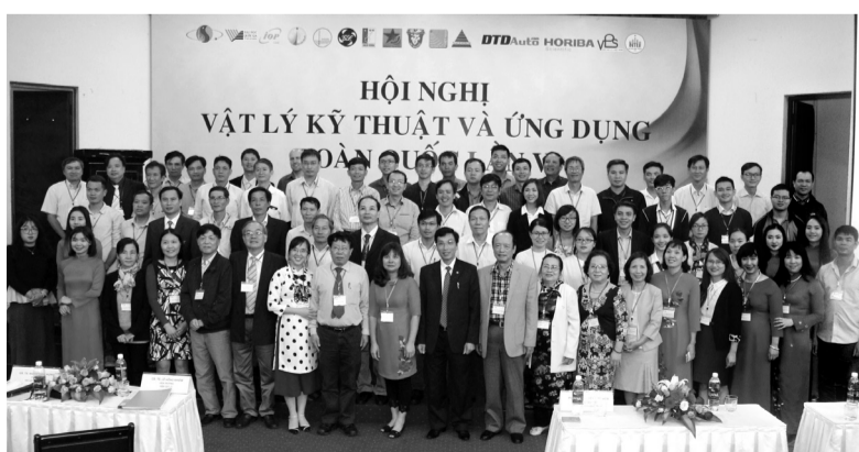
Các đại biểu Hội nghị chụp ảnh lưu niệm.

nhiều tham luận khoa học có hàm lượng chất xám cao được trình bày và thảo luận sôi nổi. Ở báo cáo “Phát