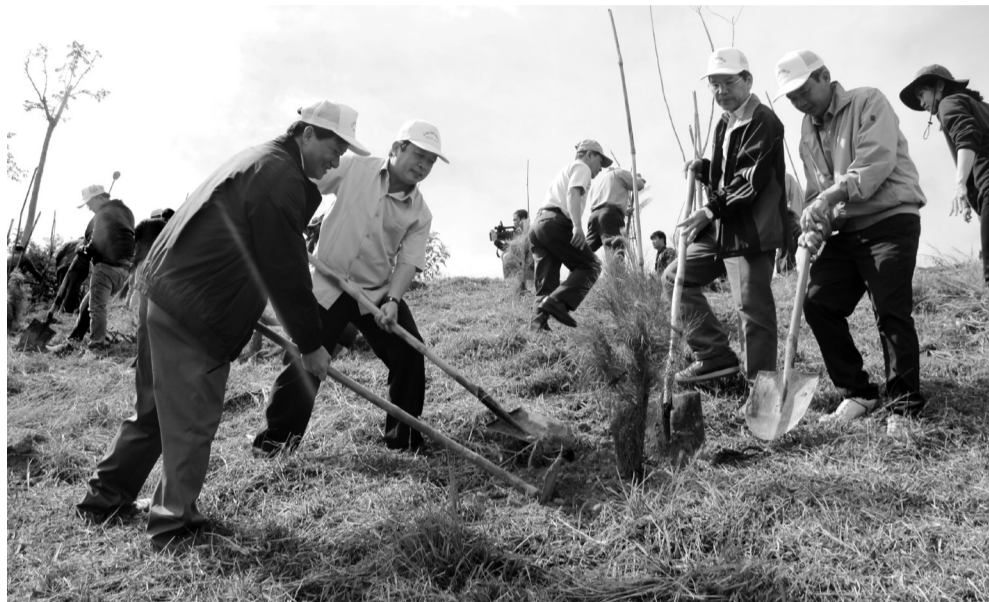
Lãnh đạo tỉnh tham gia trồng cây xanh và cây phân tán tại Bệnh viện Nhi Lâm Đồng.

Trong quá trình triển khai thực hiện Nghị quyết số 03, Đảng ủy Khối Các cơ quan tỉnh đã lãnh đạo, thực hiện theo đúng phân cấp quản lý cán bộ, đảm bảo nguyên tắc tập trung dân chủ, ổn định, có tính kế thừa. Cán bộ, công chức được bổ nhiệm, bổ nhiệm lại có đủ tiêu chuẩn, thực hiện đúng