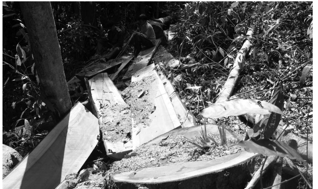
Một trong những nguyên nhân lớn dẫn đến BĐKH mạnh là do xâm hại tài nguyên thiên nhiên.

Tại Đà Lạt, nhiệt độ trung bình trong khoảng thời gian từ năm 2005 đến năm 2010 là 18,23°C; trong khoảng thời gian từ 2011 đến 2014 là 18,3°C; từ 2012 đến 2014, nhiệt độ có xu hướng giảm qua từng năm. Theo Báo cáo Xây dựng kế hoạch hành động ứng phó với BĐKH tỉnh Lâm Đồng năm 2012, nhiệt độ trung bình năm ở Bảo Lộc từ 1980 đến 2011 có xu thế tăng với tốc độ khoảng