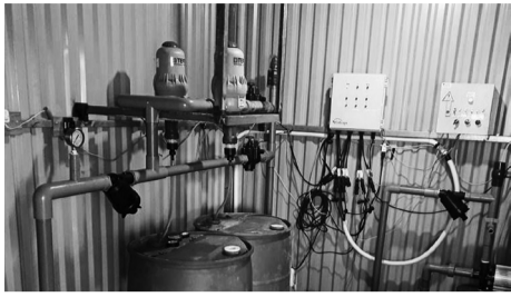
Hệ thống tưới thông minh Zero.agri đầu tiên được lắp đặt tại Định Farm Đà Lạt.

Sở NN&PTNT Lâm Đồng đang phối hợp với Công ty Routrek Networks (Nhật Bản) triển khai lắp đặt 50 hệ thống tưới thông minh Zero.agri đầu tiên tại Đà Lạt và một số địa phương lân cận của tỉnh.