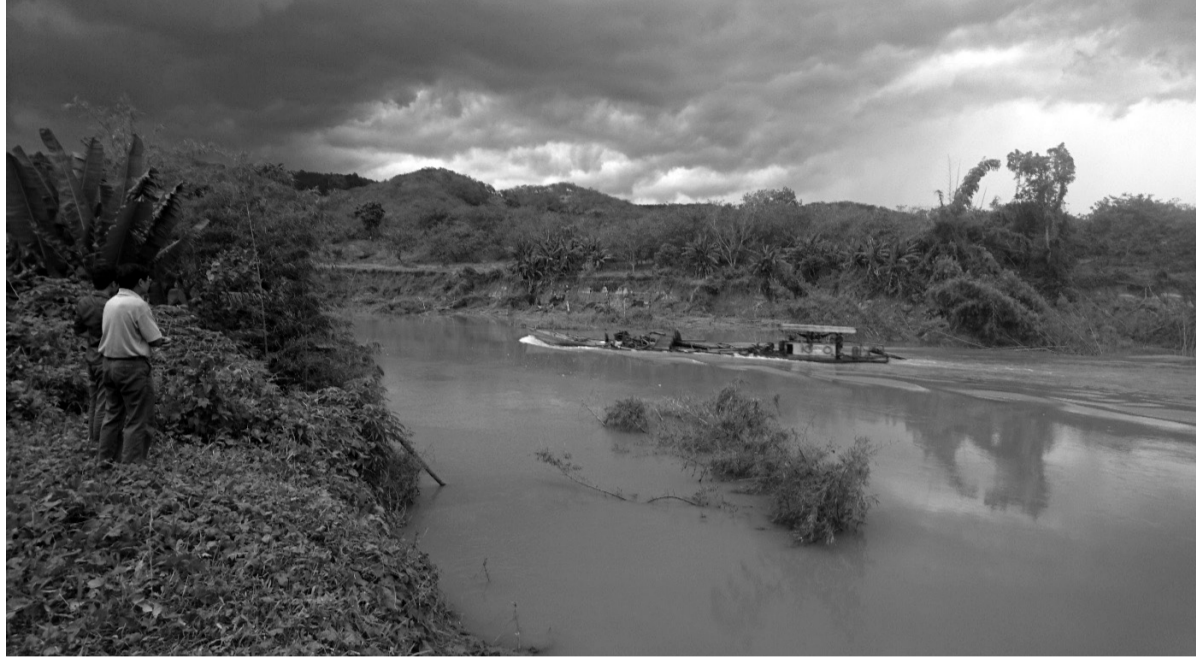
Một tàu hút cát đang chạy qua một đoạn bờ sông bị sạt lở.

Điều đáng nói là dù trữ lượng khai thác theo giấy phép mà tỉnh Bình Phước cấp cho công ty là