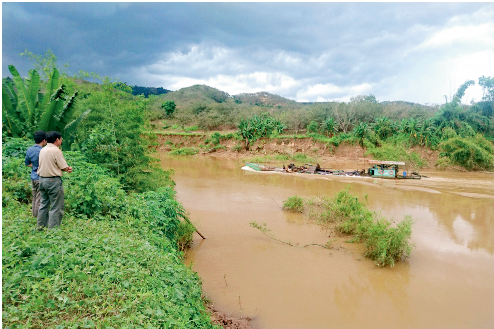
Một tàu hút cát đang chạy qua một đoạn bờ sông bị sạt lở.