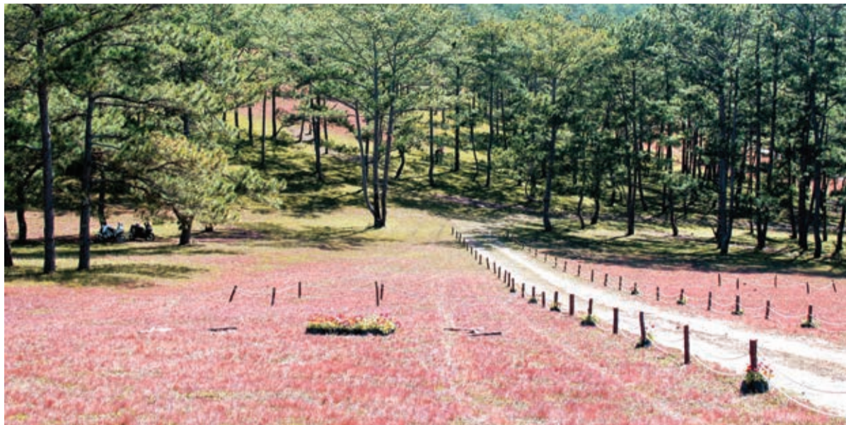
Cỏ hồng như một "đặc sản" của vùng đất Lang Biang.

Cũng bởi lẽ đó, đồi cỏ hồng thực sự trở thành một "đặc sản" của huyện Lạc Dương. Mùa hội Cỏ hồng Lang Biang lần thứ III - năm 2019 sẽ dựng lại truyền thuyết Cỏ hồng bằng những