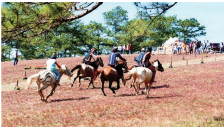
Đua ngựa không yên sẽ trở thành sản phẩm du lịch mới của Lạc Dương.

Truyền thuyết về loại cỏ hồng được người Lạch - chủ nhân của vùng đất Lang Biang ngàn đời kể về một môi tình bất diệt, ngang trái song thủy chung, son sắt của chàng trai và cô gái miền sơn cước: "Ngày xưa, tại một buôn làng trù phú dưới dãy Lang Biang bên hồ Đan Kia có một vị tù trưởng giàu có, quyền lực và có cả trăm gia nhân, tráng đinh dưới tay. Ông tù trưởng có một người