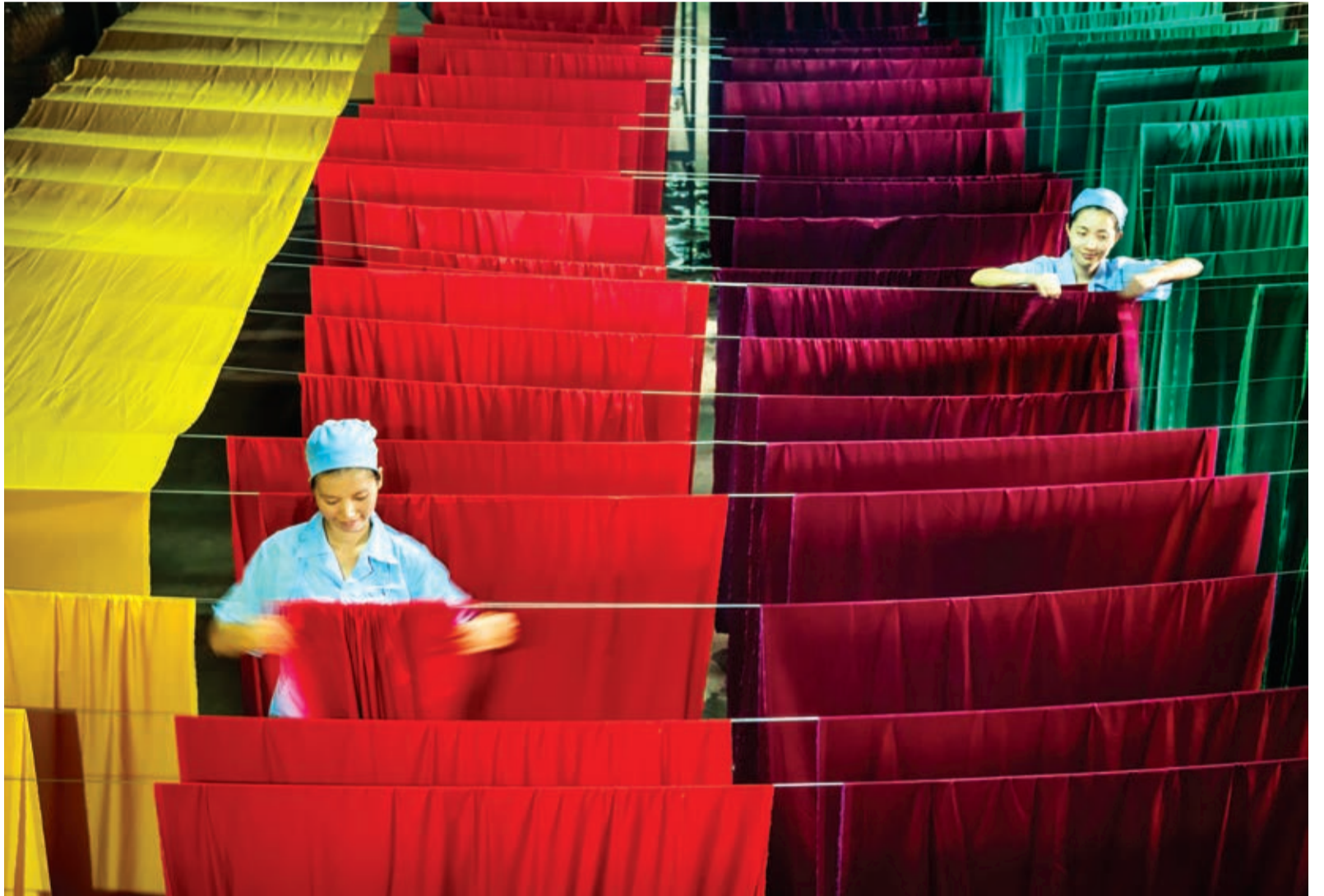
Phơi lụa.