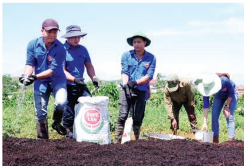
Các đội viên TTTTTN hướng dẫn và giúp đỡ bà con thực hiện mô hình ủ vò cà phê.