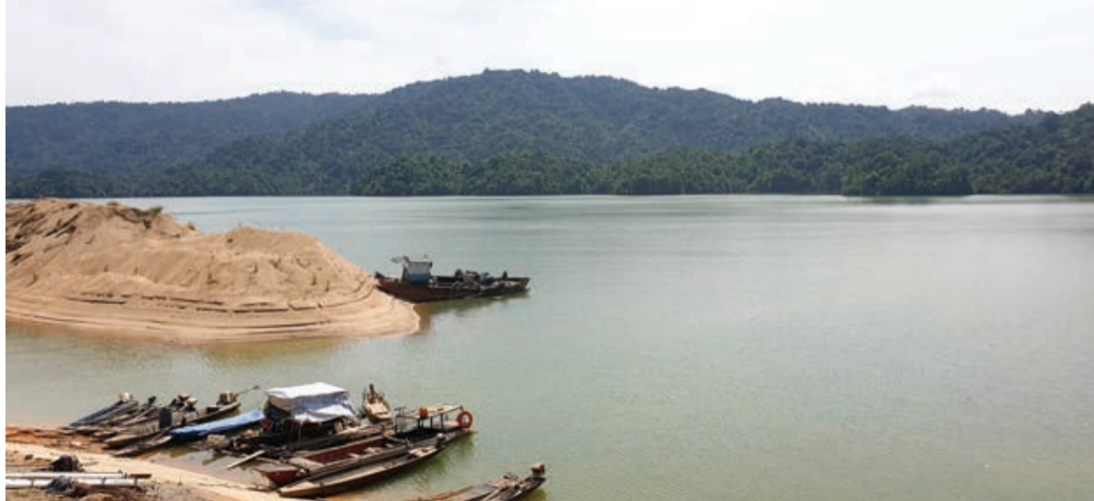
Hồ Đa Têh (huyện Đa Têh) là danh thắng cấp Quốc gia được công nhận năm 2004.

vào tài khoản ngân hàng để đảm bảo. Trong vòng 6 tháng, công ty sẽ làm thủ tục giấy phép đầu tư, giấy chứng nhận quyền sử dụng với thời hạn 50 năm. Để thuyết phục khách hàng, ông Mẫn khẳng định: "Đây là dự án của một sếp lớn ở ngoài Trung ương. Hồ nước này không chỉ có thể làm du lịch mà còn khai thác cát dưới lòng hồ. Dưới lòng hồ Đa Têh có trữ lượng cát nhiều lắm, trên 7 triệu khối toàn cát 1.8 trở lên. Ngoài ra, có rất nhiều gỗ dưới lòng hồ. Khách