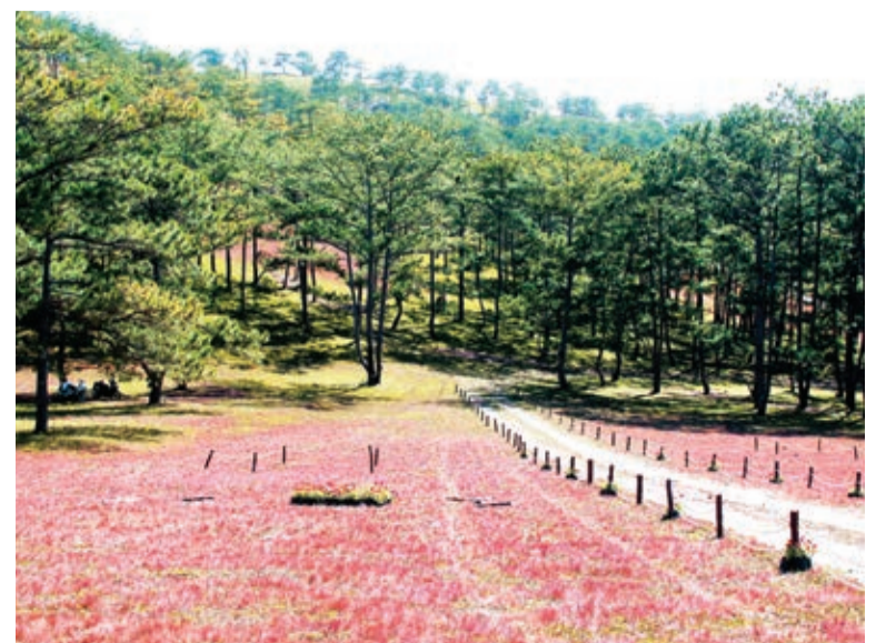
Cỏ hồng như một “đặc sản” của vùng đất Lang Biang.