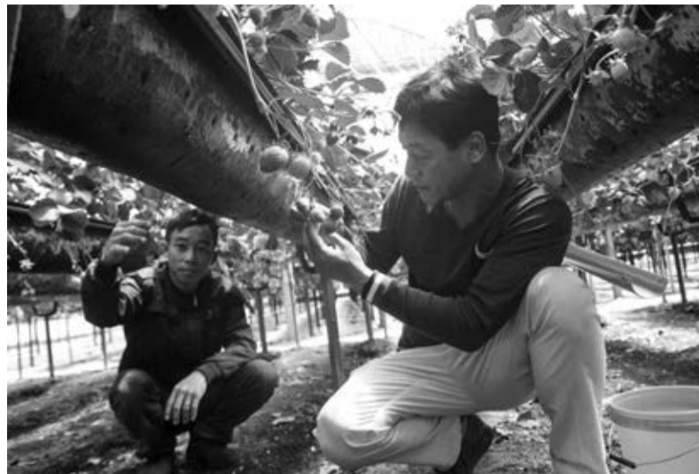
Doanh nghiệp trồng dâu tây ở Khu NNCNC Ấp Lát.

Ở Lạc Dương, các năm gần đây việc ứng dụng sản xuất nông nghiệp công nghệ cao gia tăng,