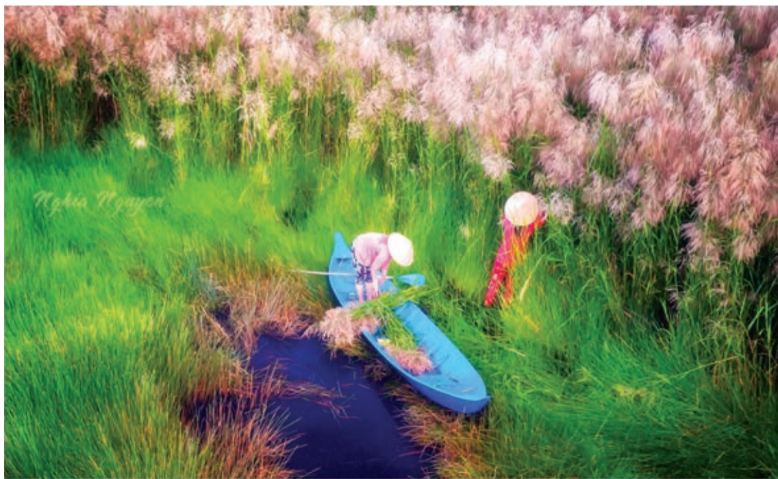
Thu hoạch cỏ lau.