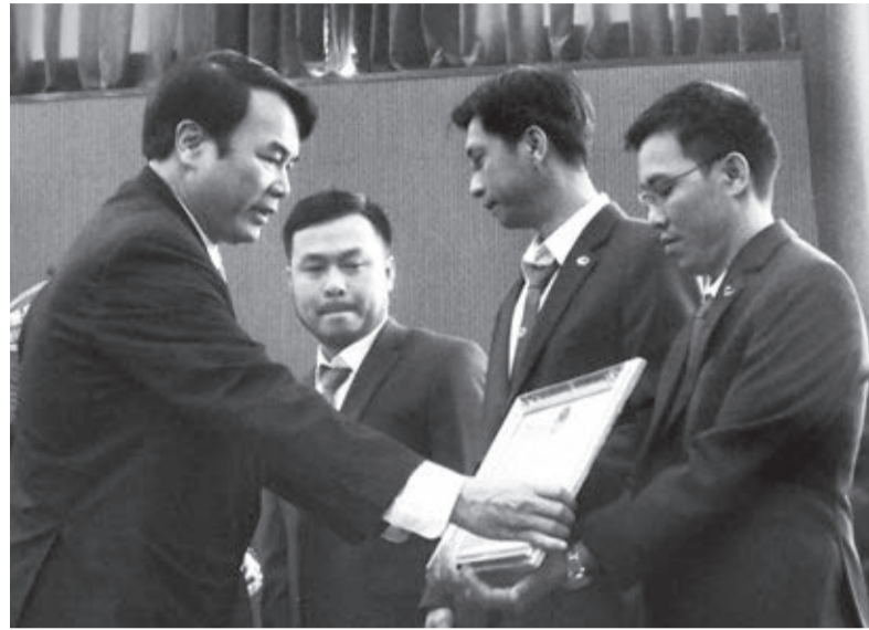
Trao giải nhất Hội thi Sáng tạo kỹ thuật cho nhóm tác giả Công ty Nhôm Lâm Đồng.

Ban tổ chức Hội thi Sáng tạo kỹ thuật đã nhận được 34 giải pháp của 61 tác giả thuộc các lĩnh vực: Công nghệ thông tin, điện tử, viễn thông; cơ khí tự động hóa, xây dựng, giao thông vận tải; nông lâm ngư nghiệp, tài nguyên, môi trường; y dược - chăm sóc sức khỏe cộng đồng; giáo dục đào tạo. Ban tổ chức Cuộc thi Sáng tạo thanh thiếu niên, nhi đồng đã nhận được 86 giải pháp của 137 tác giả thuộc các lĩnh vực: Đồ dùng dành cho học tập; phần mềm tin học; sản phẩm thân thiện với môi trường; dụng cụ sinh hoạt gia đình và đồ chơi trẻ em; bảo vệ môi trường và phát triển kinh tế. Nhìn chung, các giải pháp dự thi lần này đạt chất lượng khá, các mô hình có sự đầu tư công phu, có thể