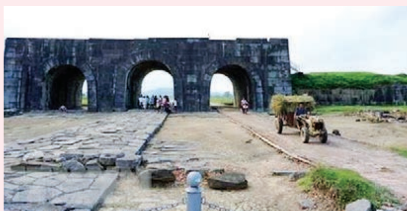
Quý Bảo tồn văn hóa của Đại sứ Hoa Kỳ (AFCP) hỗ trợ tu sửa Di tích cổng Nam thành nhà Hồ (tỉnh Thanh Hóa).