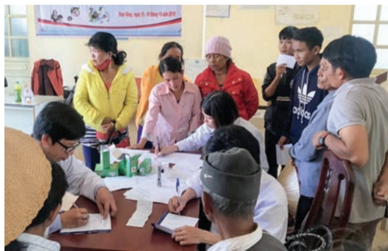
Chăm sóc mắt miễn phí cho bà con DTTS huyện Đam Rông.

Công tác phòng chống mù lòa xuất hiện những thách thức mới như tỷ lệ mắc bệnh võng mạc ở trẻ đẻ non, bệnh võng mạc do đái tháo đường, bệnh glôcôm cũng ngày càng tăng cao... Đáng chú ý, tật khúc xạ (cận thị, viễn thị, loạn thị) đang ngày càng phổ biến trong thanh thiếu niên, với tỷ lệ mắc khoảng 15 - 20% ở học sinh nông thôn, 30 - 40% ở học sinh thành thị. Nếu tính riêng nhóm trẻ từ 6 - 15 tuổi (lứa tuổi cần ưu tiên được chỉnh kính) cả nước có khoảng