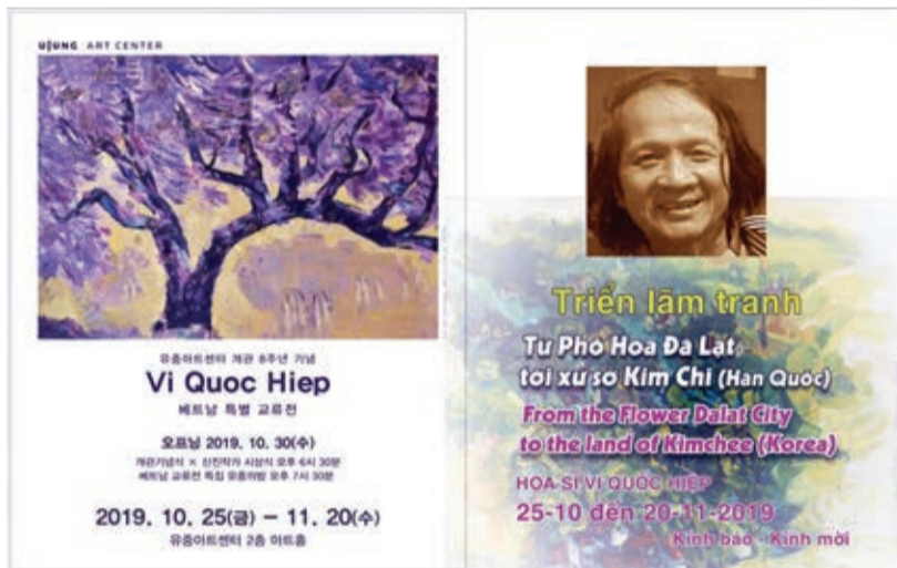
Giấy mời dự triển lãm phòng tranh tại Hàn Quốc.

kết quả hơn 40 năm mày mò học hỏi, say mê không ngừng vẽ. Đó cũng là quá trình đạt được sự cảnh giới để "phản quang tự kỷ" (quay vào bên trong, quay về chính mình).