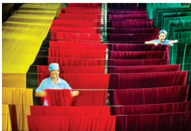
Phơi lụa.