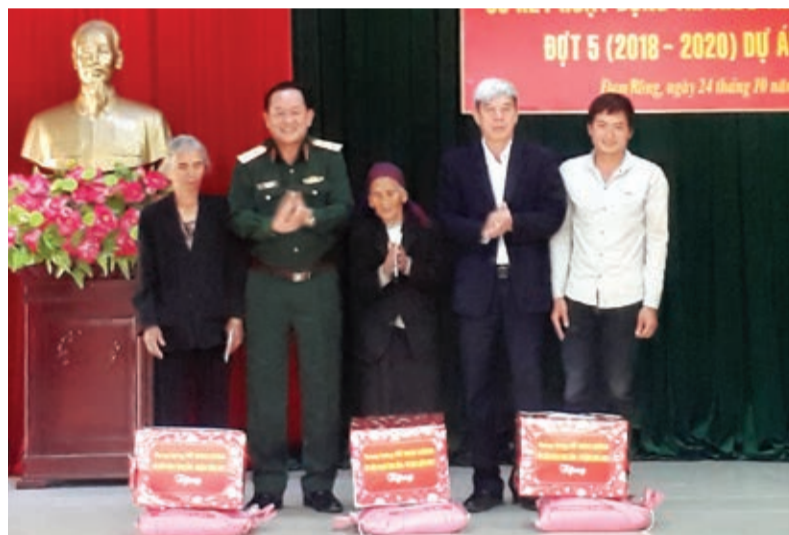
Trao quà cho các gia đình chính sách nhân sơ kết hoạt động trí thức trẻ tình nguyện đợt 5 vừa qua.