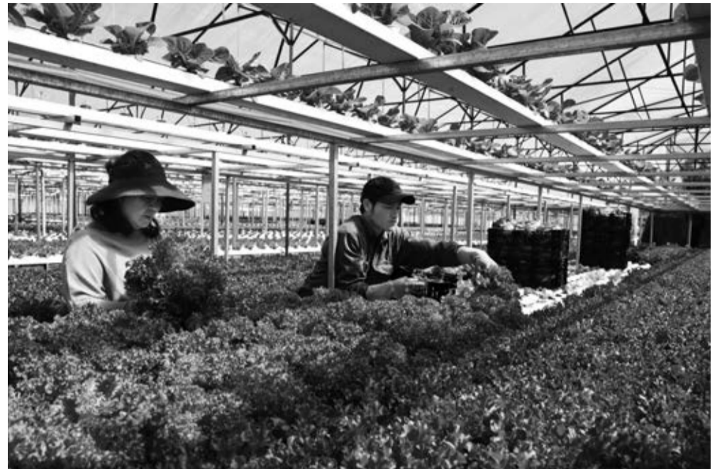
Cách làm độc đáo tăng thêm 50% năng suất rau thủy canh trên cùng diện tích.