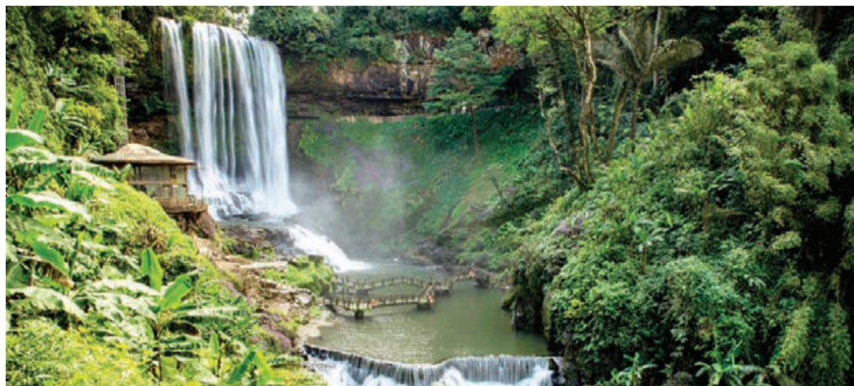
Thác Đamb'ri.