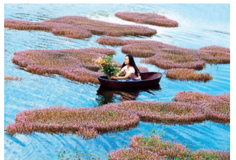
Như những thảm lụa hồng trôi trên màu xanh hồ nước.