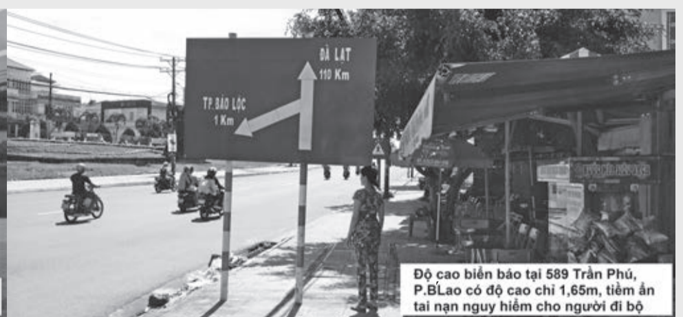
Độ cao biển báo tại 589 Trần Phú, P.B.Lao có độ cao chỉ 1,65m, tiềm ẩn tai nạn nguy hiểm cho người đi bộ

Nhiều biển báo giao thông đường bộ trên vỉa hè TP Bảo Lộc chỉ cao ngang đầu người.