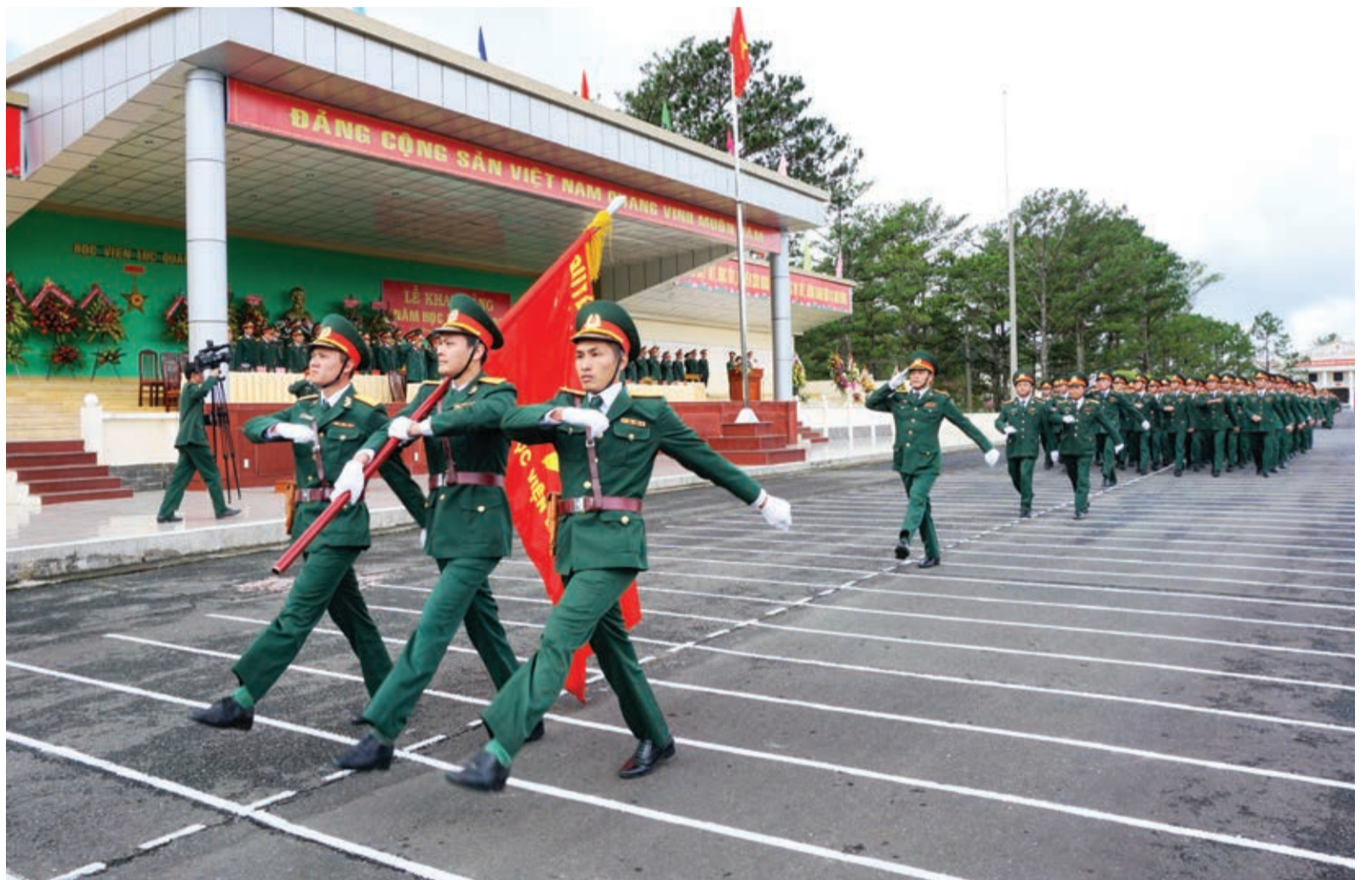
Duyệt đội hình trong Lễ khai giảng năm học 2019-2020.