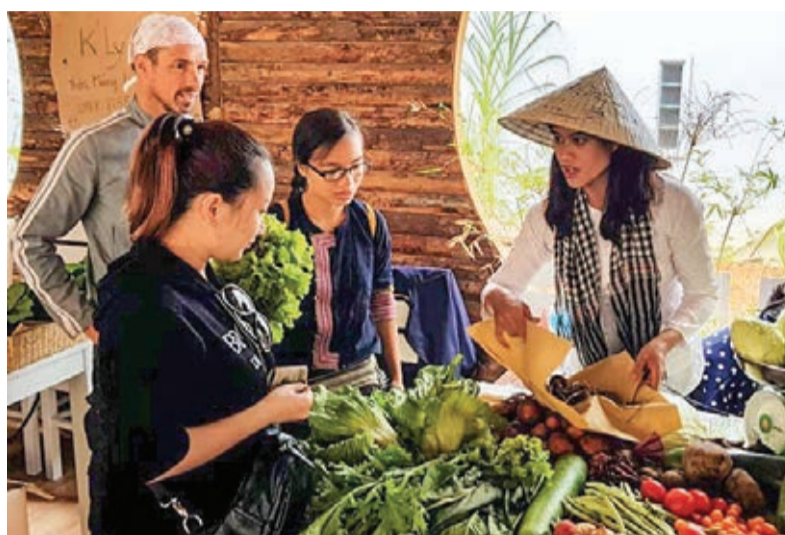
Phiên chợ hữu cơ của những nhà nông trẻ.

Quan niệm “sống xanh” được nhiều bạn trẻ hiện nay cụ thể hóa bằng những việc làm như không tạo ra thêm rác thải nhựa, thay vào đó là những vật dụng dùng được nhiều lần và không có tác động xấu tới môi trường. Một số siêu thị chọn thay thế túi nhựa bằng túi vải, túi nilon thân thiện với môi trường, đóng gói thực phẩm bằng lá chuối, dây lát, lá lục bình... đã góp phần lan tỏa xu hướng sống xanh cho khách hàng.