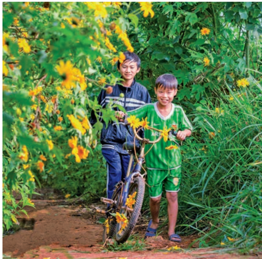
Đà Lạt mùa hoa quỳ vàng.