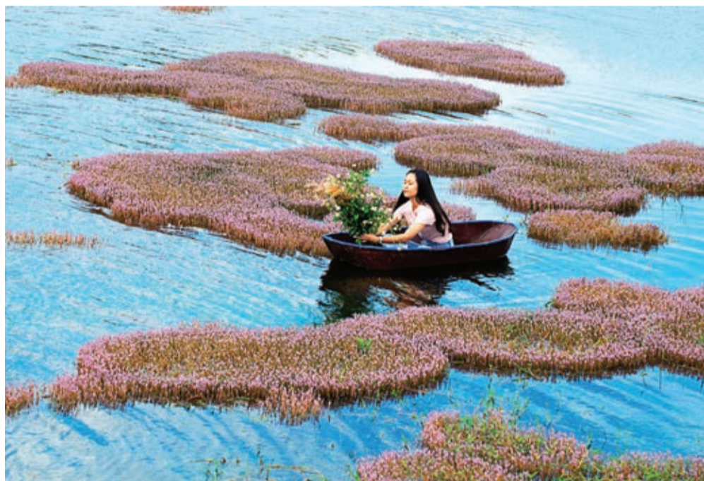
Như những thảm lụa hồng trôi trên màu xanh hồ nước.