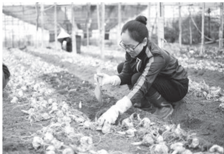
Người dân Phường 12, TP Đà Lạt xuống giống hoa để chuẩn bị cho thị trường tết năm nay.