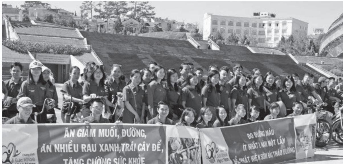
Ngành Y tế Lâm Đồng tuyên truyền về chương trình sức khỏe Việt Nam, phòng chống bệnh tật, nhất là các bệnh không lây nhiễm.

Nhóm bệnh nhân mắc các bệnh không lây nhiễm ở Việt Nam là nhóm có tỷ lệ tử vong cao nhất, chiếm khoảng 73%, bao gồm: các bệnh tăng huyết áp, đái tháo đường, ung thư, tim mạch. Theo thống kê hiện nay, tỷ lệ mắc bệnh đái tháo đường ở Việt Nam ước chiếm khoảng trên 4% dân số và khoảng 10% dân số khác mắc tiền đái tháo đường, thực trạng này vẫn đang gia