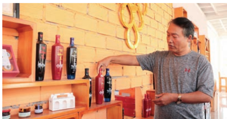
Những sản phẩm từ Phúc bồn tử sẽ là tiềm năng mới để người dân địa phương phát triển kinh tế.

Việc trồng và chiết xuất ra nhiều sản phẩm từ trái Phúc bồn tử, đặc biệt là sản phẩm Rượu vang của Công ty TNHH Langbian.f Dầu rừng, góp phần đưa sản phẩm của địa phương phát triển theo hướng hàng hóa, đem lại lợi ích kinh tế cao cho người sản xuất.