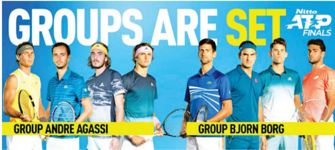
Kết quả bốc thăm hấp dẫn ở 2 bảng đấu tại ATP Finals 2019.

Roger Federer và Novak Djokovic sẽ phải cạnh tranh quyết liệt tấm vé vào bán kết với 2 đối thủ đáng gờm tại ở bảng Bjorn Borg ATP Finals năm nay. Còn Rafael Nadal cũng chẳng dễ dàng gì khi đối đầu 3 đối thủ tại bảng Andre Agassi của giải “bát hùng” này.