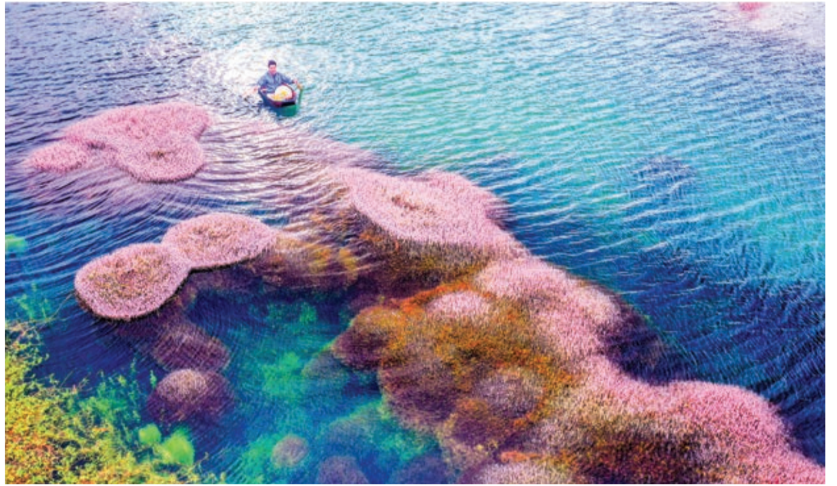
Vào buổi sớm, hay chiều về là thời điểm tảo hồng hiện ra đẹp nhất.

Dưới đây là một số hình ảnh đẹp của hồ tảo hồng ở Bảo Lộc.