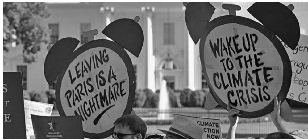
Biểu tình chống biến đổi khí hậu bên ngoài Nhà Trắng.

Sau khi lên nắm quyền, Tổng thống Mỹ Trump đã ngay lập tức thực hiện lời hứa tranh cử. Vào ngày 1/6/2017, ông đã tuyên bố Mỹ rút khỏi Hiệp định Paris về biến đổi khí