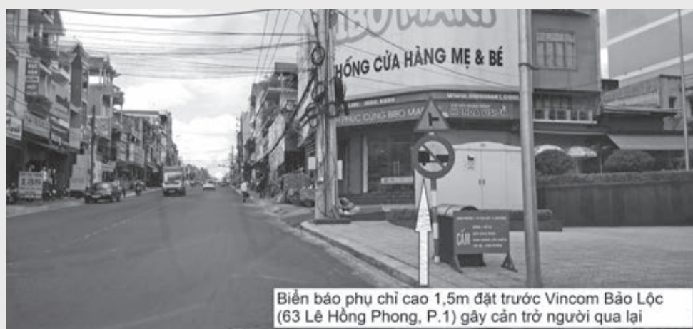
Biển báo phụ chỉ cao 1,5m đặt trước Vincom Bảo Lộc (63 Lê Hồng Phong, P.1) gây cản trở người qua lại