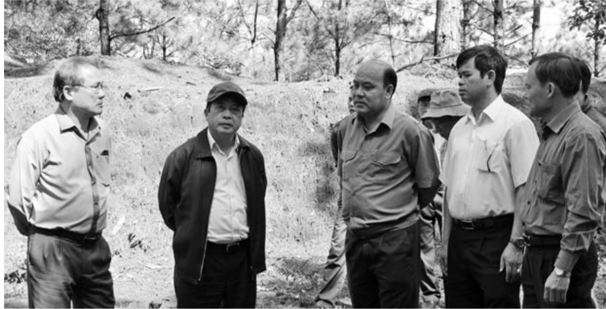
Phó Bí thư Tỉnh ủy, Chủ tịch UBND tỉnh, Trưởng Đoàn Đại biểu Quốc hội tỉnh Lâm Đồng Đoàn Văn Việt kiểm tra rừng tại Tiểu khu 716, thuộc xã Sơn Điền, huyện Di Linh, lâm phần do Công ty Lâm nghiệp Di Linh quản lý.

“Công tác quản lý, bảo vệ rừng ở một vài địa phương trên địa bàn tỉnh thời gian qua có những diễn biến phức tạp, nhưng tại huyện Di Linh làm tốt công tác giữ rừng. Tôi đánh giá rất cao công tác quản lý, bảo vệ rừng của huyện Di Linh, nhất là sự phối hợp rất tốt trong việc nhận khoán, chăm sóc, bảo vệ, giao khoán của Công ty Lâm nghiệp Di Linh với những người nhận khoán bảo vệ rừng”. Đó là nhận xét của Phó Bí thư Tỉnh ủy, Chủ tịch UBND tỉnh, Trưởng Đoàn Đại biểu Quốc hội tỉnh Lâm Đồng Đoàn Văn Việt, sau khi kiểm tra thực tế địa bàn huyện Di Linh.