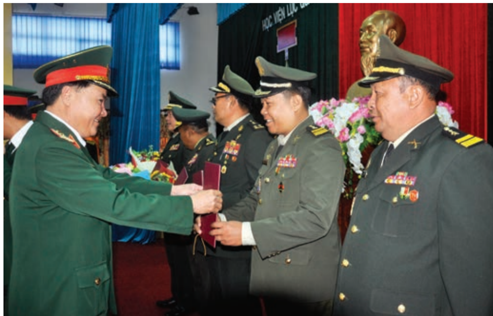
Trao Bằng Tiến sĩ cho các nghiên cứu sinh quốc tế.

Đồng thời, đẩy mạnh các hoạt động thi đua “Dạy tốt, học tốt, nghiên cứu khoa học và phục vụ tốt”; tổ chức thực hiện nghiêm túc nội dung 3 khâu đột phá: “Chất lượng giảng dạy tốt nhất - Quản lý, rèn luyện, học tập nghiêm nhất - Kết quả đào tạo, nghiên cứu khoa học cao nhất”. Trong đó tập trung đột phá vào khâu: “Quản lý, rèn luyện, học tập nghiêm nhất - Kết quả đào tạo, nghiên cứu khoa học cao nhất”, nâng cao chất lượng học tập, rèn luyện của các đối tượng học viên. Kết quả học tập, thi tốt nghiệp của các đối tượng học viên ngày càng được nâng lên. Trong giai đoạn 2014-2019, chỉ duy nhất năm học 2014-2015 có học viên đạt trung bình khá, các năm học còn lại 100% học viên tốt nghiệp đạt khá, giỏi. 100% học viên cao học, nghiên cứu sinh bảo vệ thành công Luận văn Thạc sỹ Quân sự, Luận án Tiến sỹ Quân sự ở cấp cơ sở và cấp Học viện. Các đợt luyện tập, tham quan được tổ chức chặt chẽ, bảo đảm an toàn. Hoàn thành xuất sắc nhiệm vụ nghiên cứu khoa học, công tác thông tin khoa học