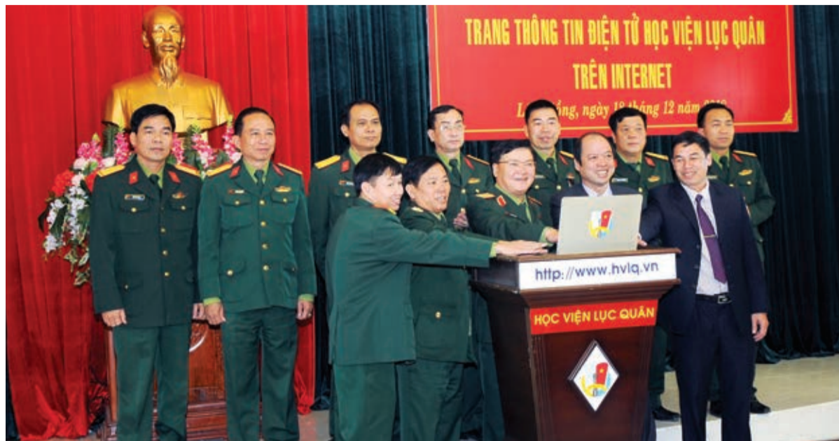
Khai trương Trang Thông tin điện tử Học viện Lục quân tháng 12/2018.

Giai đoạn từ 2021 - 2025, xây dựng, hoàn thiện đầy đủ các thành tố còn lại, bao gồm: