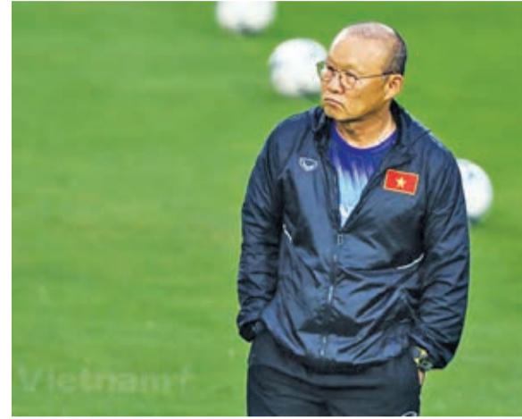
HLV Park Hang-seo theo dõi học trò trên sân tập chuẩn bị cho vòng loại World Cup 2022.

Liên đoàn Bóng đá Việt Nam cho biết lễ công bố gia hạn hợp đồng giữa VFF và huấn luyện viên Park Hang-seo được tổ chức vào ngày 7/11 tại Hà Nội.