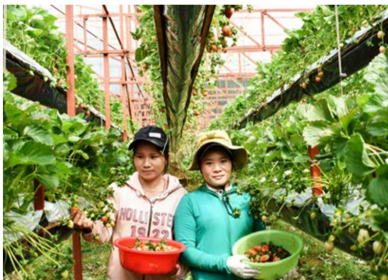
Vườn dâu tây treo “lưu động” bên đường phố Hùng Vương, Đà Lạt đạt mật độ 50.000 cây/2.500 m 2 .

Đ ầu tháng 10/2019, phóng viên khá bất ngờ khi lần đầu tiên tiếp xúc với vườn dâu tây “lưu động” trong nhà kính chỉ cách mặt tiền đường phố Hùng Vương, Đà Lạt hơn 150 m, thuộc Hẻm 64, có thể đậu xe ô tô sát ngay sân một khách sạn liền kề. Lúc này mới đầu giờ buổi sáng, người chủ vườn và người lao động cùng thao tác nhẹ nhàng những chiếc tay quay kéo từng luống dâu tây lên cao, xuống thấp với đường kính khoảng 1,2 m, tạo lối đi thuận lợi trong việc thu hoạch. Nếu tính từ mặt đất lên đến độ cao nhất của luống dâu “lưu động” thì khoảng cách hơn 2,2 m. Nhìn bao