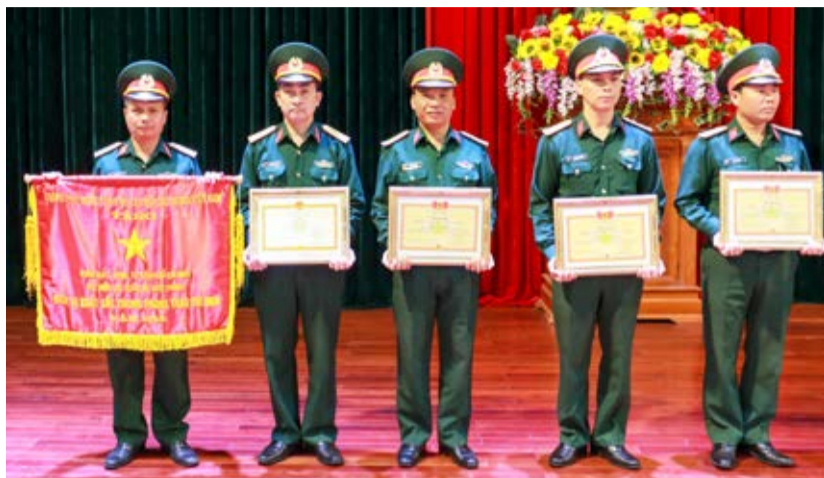
Khoa Mác - Lênin, tư tưởng Hồ Chí Minh dẫn đầu trong phong trào thi đua.

Đội ngũ cán bộ, giảng viên trong Khoa luôn chấp hành nghiêm kế hoạch huấn luyện, quy định và quy chế giáo dục - đào tạo. Xây dựng và phát huy mối quan hệ tốt đẹp giữa thầy và trò trong suốt quá trình đào tạo. Tổ chức tốt các cuộc hội thảo khoa học ở Khoa và tích cực tham gia các cuộc hội thảo ở Học viện Lục quân, ở các đơn vị bạn. Bám