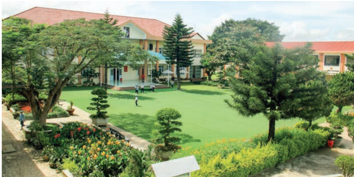
Quang cảnh Trường TH Quảng Lập.

Trên toàn tỉnh Lâm Đồng, số lượng trường tiểu học (TH) đạt chuẩn quốc gia mức độ 2 chỉ đếm trên đầu ngón tay. Trong số này, có lẽ Trường TH Quảng Lập, huyện Đơn Dương, tuy là trường vùng xa nhưng lại có cơ sở khang trang bậc nhất.