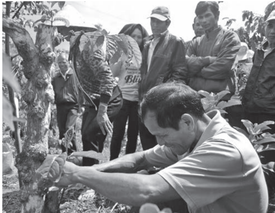
Hỗ trợ nông dân tái canh cà phê.

Hỗ trợ người nông dân vùng đồng bào dân tộc thiểu số là một trong những ưu tiên của Di Linh bởi huyện có rất đông bà con người dân tộc thiểu số bản địa sinh sống. Để đảm bảo nguồn vốn hỗ trợ cây trồng đến được tận vườn cho bà con, Hội Nông dân tỉnh vừa tổ chức giám sát "Việc thực hiện chính sách hỗ trợ đầu tư trực tiếp và trợ giá cây trồng" theo các quyết định của tỉnh.