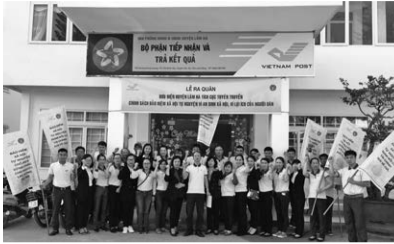
BHXH huyện Lâm Hà phối hợp với Bưu điện huyện ra quân tuyên truyền chính sách BHXH tự nguyện.

Về mức đóng, người tham gia BHXH tự nguyện hàng tháng đóng