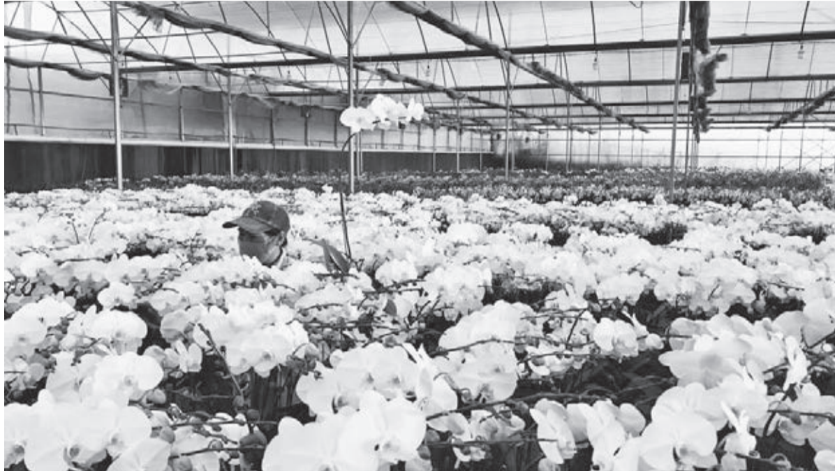
Hoa Đà Lạt có giá trị xuất khẩu ngày càng tăng nhờ bảo hộ thương hiệu “Đà Lạt - Kết tinh kỳ diệu từ đất lành”.

Được biết, Bộ Công thương đang xây dựng dự thảo Đề án Chương trình Thương hiệu quốc gia Việt Nam trong giai đoạn mới đến năm 2030, tầm nhìn đến năm 2045 để trình Thủ tướng Chính phủ xem xét, với gợi ý mở ra nhiều cơ hội hơn nữa cho DN, đặc biệt là các DN nhỏ và vừa. Nội dung của Chương trình Thương hiệu quốc gia Việt Nam trong giai đoạn mới sẽ có sự gắn kết thương hiệu sản phẩm của DN với các hoạt động thu hút đầu tư, quảng bá văn hóa, du lịch, từ đó xây dựng Thương hiệu quốc gia Việt Nam trở thành hình ảnh tích cực, hấp dẫn và thu hút đối với các nhà nhập khẩu, du khách, nhà đầu tư, người lao động, người tiêu dùng trên thị trường trong nước và quốc tế. Đề án cũng nêu lên cơ chế phối