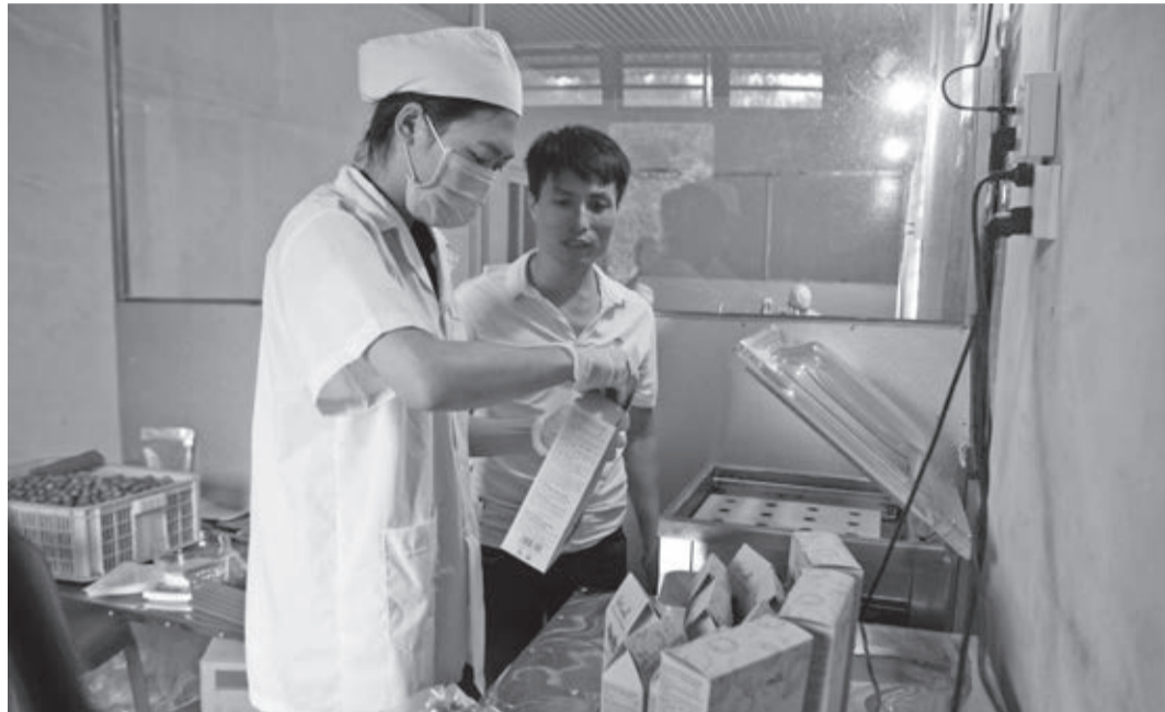
Quy trình đóng gói sản phẩm mắc ca sấy tại Công ty TNHH Nông sản Huy Hiếu.

Những năm gần đây, bên cạnh việc tập trung quy hoạch mở rộng diện tích mắc ca, huyện Lâm Hà cũng chú trọng xây dựng hình ảnh, thương hiệu cho hạt mắc ca qua chế biến, tạo chỗ đứng trên thị trường. Điều đáng phấn khởi là bước đầu đã có các cơ sở, doanh nghiệp tham gia chế biến sâu để đưa hạt mắc ca trở thành đặc sản mới của địa phương này.