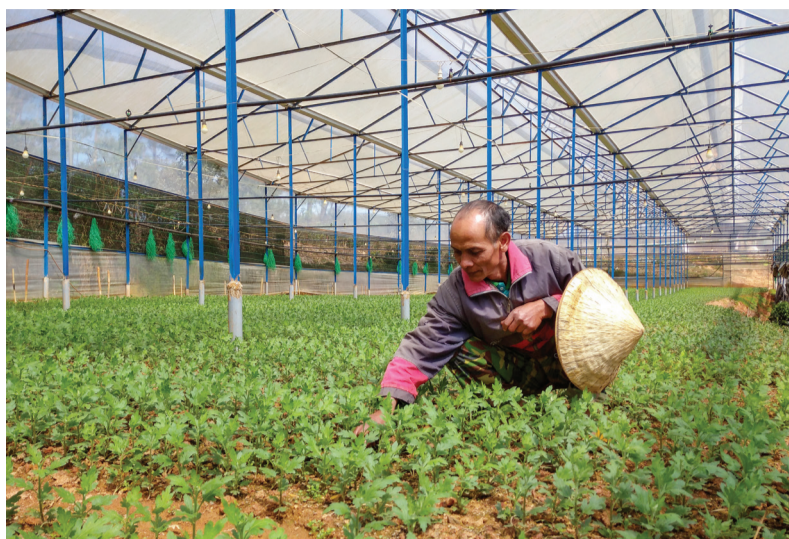
Đời sống của bà con nhân dân ở Phường 7 từng bước được cải thiện.

khăn của gia đình, UBMTTQVN Phường đã trích từ Quỹ “Vi người nghèo” hỗ trợ gia đình 30 triệu đồng, vận động thêm nhà hảo tâm xây lại căn nhà cho ông Thảo. Đầu tháng 1/2020, ngôi nhà chính thức được bàn giao cho gia đình, với kinh phí 150 triệu đồng. Có được căn nhà, vợ chồng ông cũng mạnh dạn đăng kí thoát nghèo, có thêm động lực, yên tâm làm ăn.