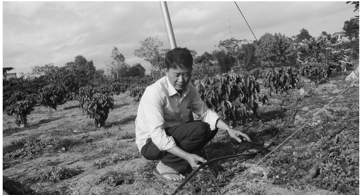
Nông dân Nam Hà áp dụng tưới nhỏ giọt giúp tiết kiệm nước.

Ông Toàn cho biết, Nam Hà nằm trong vùng phát triển công nghệ cao của tỉnh nên được các cấp, ngành quan tâm đầu tư đường sá, cử cán bộ xuống tập huấn, chuyên giao các khoa học kỹ thuật trong sản xuất cà phê. Nhờ đó mà tôi biết đến phát triển cà phê công nghệ cao là như