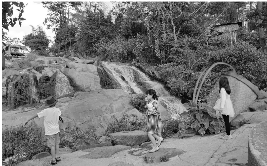
Du khách nhỏ tuổi đưa tay bịt mũi khi đến gần dòng thác.

Nằm giữa lòng Đà Lạt, thác Cam Ly một thời còn được gọi là thác Cẩm Lệ bởi vẻ đẹp của nó làm say đắm biết bao lũ khách. Cam Ly hôm nay không còn yêu kiều diễm lệ, mà dòng thác đang từng ngày nghẹn ngào rơi lệ vì sự ô nhiễm trầm trọng từ nguồn nước thải của cư dân thành phố.