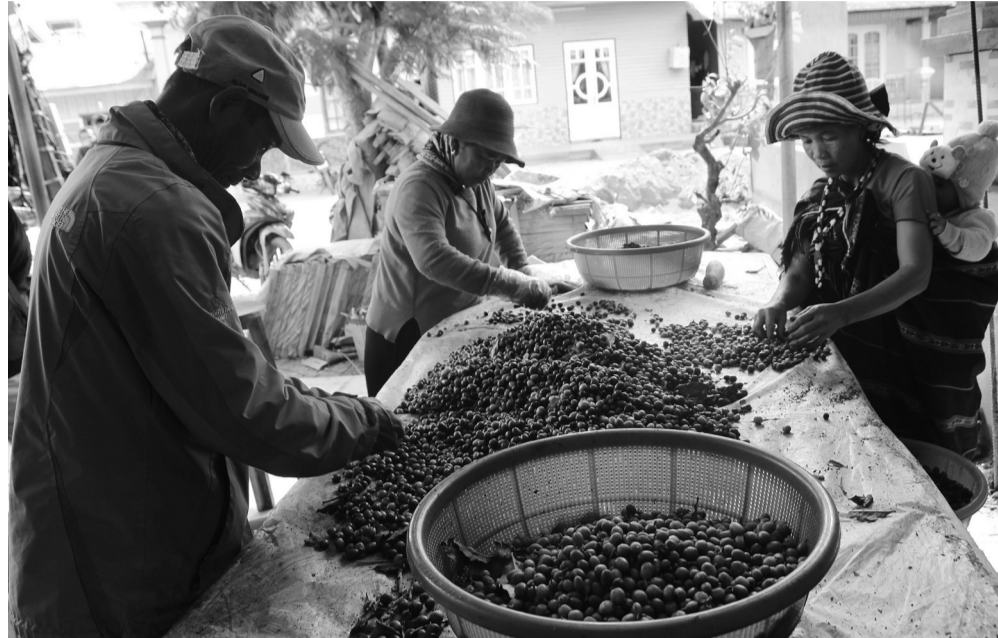
Chuỗi liên kết cà phê hữu cơ K'Ho Coffee của đồng bào DTTS thị trấn Lạc Dương, huyện Lạc Dương, vừa sạch vừa ngon đang được phân phối và tiêu thụ rộng rãi.

Tỉnh Lâm Đồng bắt đầu triển khai Đề án liên kết sản xuất, chế biến và tiêu thụ nông sản giai đoạn 2019 - 2023. Mục tiêu đặt ra cho Đề án này là xây dựng 200 chuỗi liên kết sản xuất, tiêu thụ nông sản với tổng kinh phí thực hiện đề án lên tới trên 270 tỷ đồng.