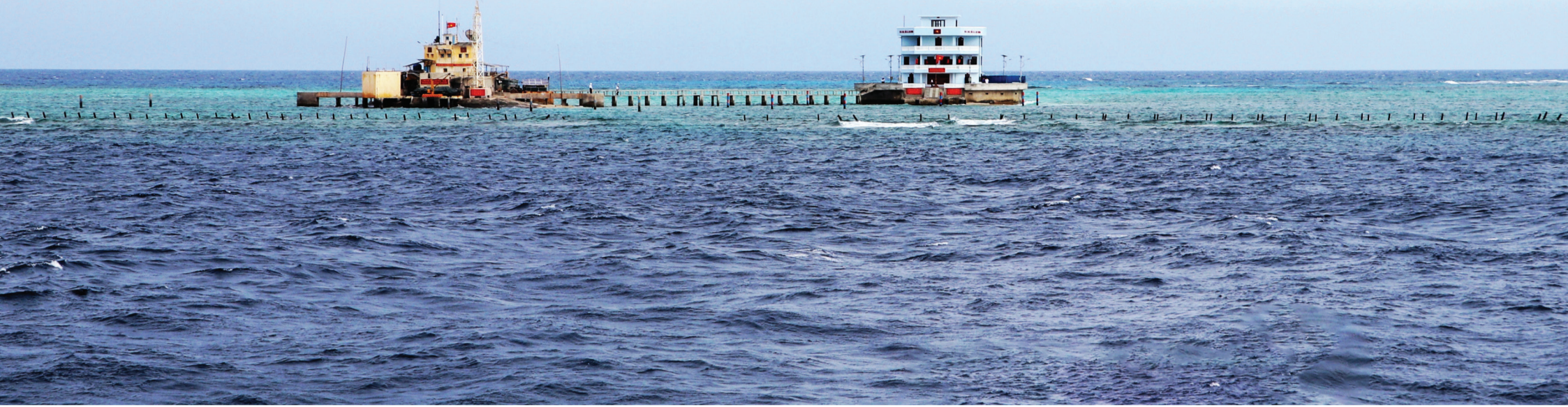
Đảo chìm Đá Nam hiện ngang giữa bốn bể sóng nước.