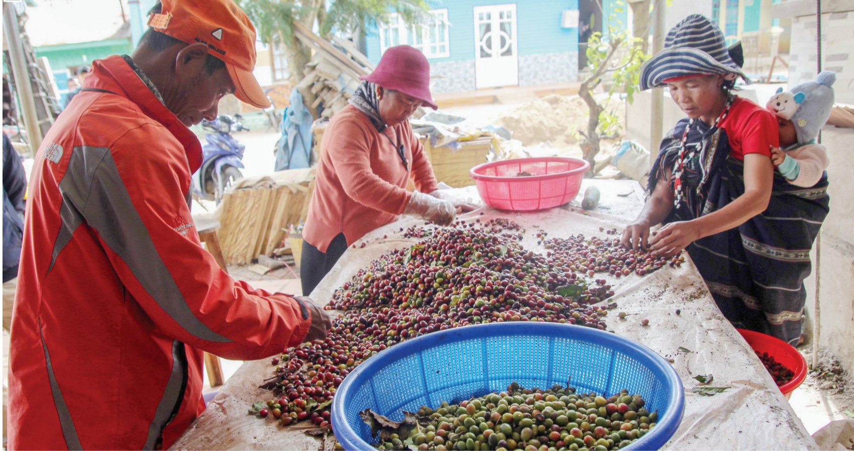
Chuỗi liên kết cà phê hữu cơ K'Ho Coffee của đồng bào dân tộc thiểu số thị trấn Lạc Dương, huyện Lạc Dương, vừa sạch vừa ngon đang được phân phối và tiêu thụ rộng rãi. TRANG 3