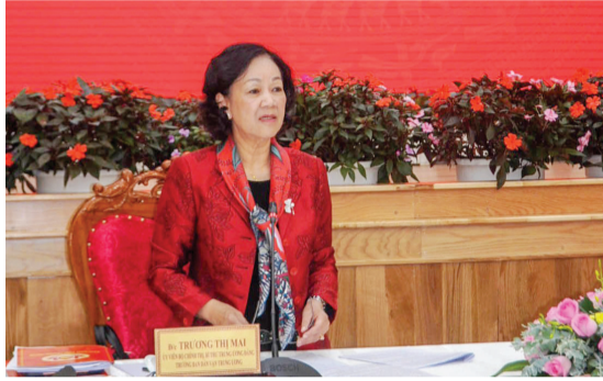
Đồng chí Trương Thị Mai - Ủy viên Bộ Chính trị, Bí thư Trung ương Đảng, Trưởng Ban Dân vận Trung ương, Trưởng đoàn công tác phát biểu kết luận buổi làm việc.

Ngày 17/3, Đoàn công tác của Ban Bí thư Trung ương Đảng do đồng chí Trương Thị Mai - Ủy viên Bộ Chính trị, Bí thư Trung ương Đảng, Trưởng Ban Dân vận Trung ương làm trưởng đoàn đã có buổi làm việc với Ban Thường vụ Tỉnh ủy Lâm Đồng. Nội dung buổi làm việc là để kiểm tra kết quả triển khai, tổ chức thực hiện Chỉ thị số 35 - CT/TW của Bộ Chính trị về đại hội Đảng các cấp, tiến tới Đại hội toàn quốc lần thứ XIII của Đảng.