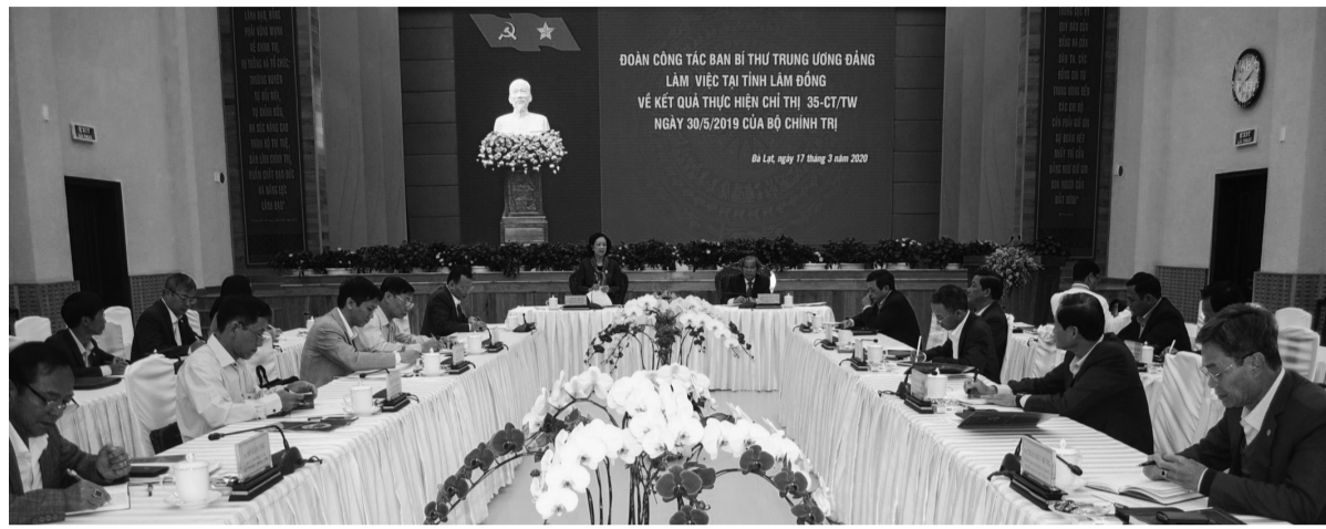
Các đại biểu tham dự buổi làm việc.

Nhìn chung, qua đại hội của 2.931 chi bộ trực thuộc đảng ủy cơ sở, 5 tổ chức cơ sở đảng và qua theo dõi công tác chuẩn bị đại hội nhiệm kỳ 2020-2025 của các cấp ủy từ tỉnh đến cơ sở thì tiến độ công tác chuẩn bị đại hội theo đúng kế hoạch đề ra. Công tác tuyên truyền, nắm tình hình, phân công tổ chức đại hội được các cấp ủy chuẩn bị chu đáo, đầu tư cơ sở vật chất, trang thiết bị để phục vụ đại hội; an ninh chính trị, trật tự xã hội được đảm bảo ổn định, tạo được không khí phấn khởi, lan tỏa trong các tầng lớp nhân dân. Qua khảo sát, làm việc với các địa phương, đơn vị thì việc chuẩn bị dự thảo văn kiện trình đại hội đã bám sát nhiệm vụ của từng địa phương, đơn vị, đánh giá được toàn diện, sâu sắc về sự lãnh đạo của đảng bộ trên các lĩnh vực, mở rộng và phát huy dân chủ; đề ra được những chỉ