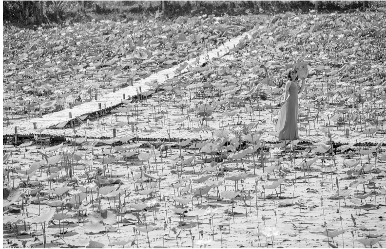
Check in ở Moon Farm - một điểm du lịch mới mở trên địa bàn xã Tà Nung.

Trước sự bùng nổ mạnh mẽ của hoạt động du lịch, dịch vụ trên địa bàn TP Đà Lạt cũng như xu hướng mở rộng ra ngoại ô, vùng phụ cận, xã Tà Nung đang hướng đến xây dựng nền tảng du lịch bền vững dựa trên những yếu tố văn hóa bản địa và con người.