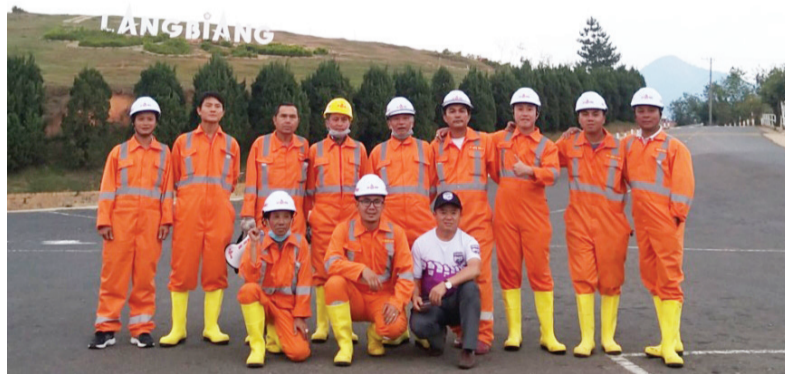
Đội PCCC - CNCH tự quản thị trấn Lạc Dương.

trấn Lạc Dương là một mô hình hoạt động có hiệu quả, phát huy vai trò 4 tại chỗ trong các hoạt động PCCC - CNCH. Đội luôn xác định nhiệm vụ “phòng là chính” nên đã phối hợp với các đài phát thanh truyền hình trong và ngoài tỉnh làm các phóng sự chuyên đề về “Ý nghĩa, mục đích toàn dân tham gia công tác PCCC”. Đồng thời,