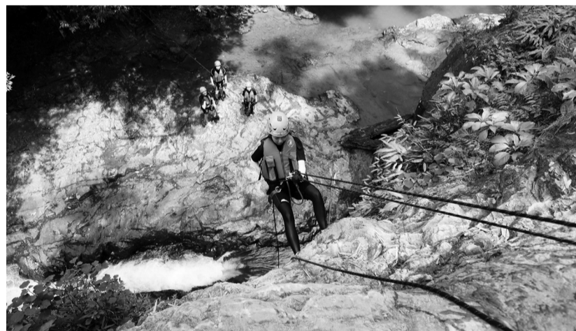
Du khách tới Đà Lạt du lịch ưa thích các tour du lịch khám phá thiên nhiên và vận động.

Các đơn vị kinh doanh du lịch trên địa bàn TP Đà Lạt đang đẩy mạnh các tour hướng tới du lịch canh nông, khám phá không gian núi rừng (trekking), cắm trại - dã ngoại và được nhiều du khách hưởng ứng.