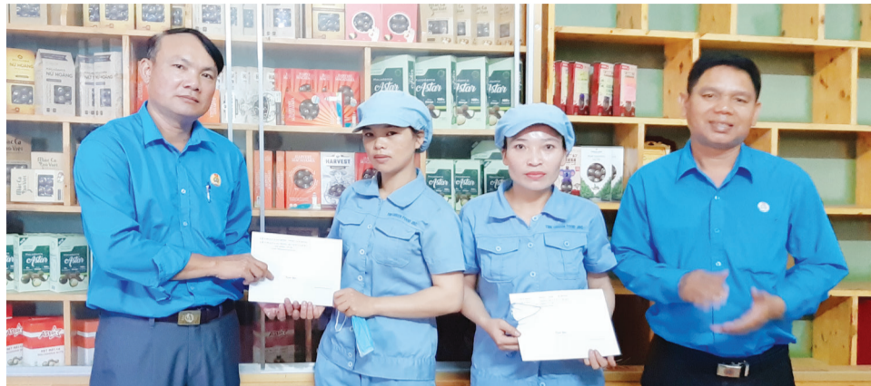
Thường trực LĐLD huyện Lâm Hà thăm và tặng quà đoàn viên, người lao động.

Nằm trong chuỗi các hoạt động chào mừng Tháng Công nhân 2020, Liên đoàn Lao động (LĐLD) huyện Lâm Hà vừa tổ chức đoàn đến thăm, động viên 28 đoàn viên công đoàn, người lao động có hoàn cảnh khó khăn tại 11 doanh nghiệp,