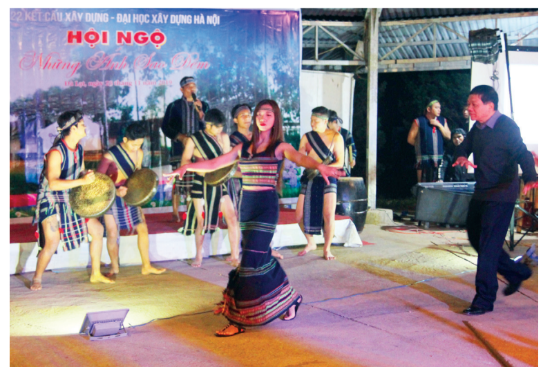
Du khách thưởng thức trọn vẹn đêm hội công chiêng ở Khu Du lịch Langbiang.