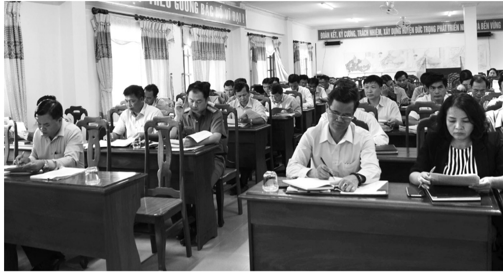
Các đại biểu tham dự hội nghị.

Để đạt và vượt các chỉ tiêu đã đặt ra trong năm 2020, UBND huyện chỉ đạo, tập trung một số nhiệm vụ, giải pháp cụ thể như: Các đơn vị liên quan cần rà soát, tham mưu các biện pháp tháo gỡ