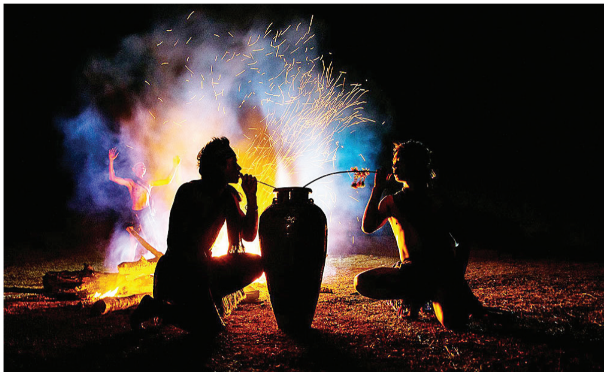
Xây dựng và tổ chức các hoạt động văn hóa ở các thôn là một trong những yếu tố giúp bảo tồn văn hóa truyền thống của người dân tộc thiểu số.

Phải ứng xử công bằng, khoa học, trên tinh thần tôn trọng các giá trị văn hóa của các dân tộc. Đồng thời, nghiêm khắc nhìn nhận, xử lý, ngăn chặn và dẹp bỏ tâm lý dân tộc hẹp hòi dẫn đến những định kiến, kỳ thị không đáng có trong một xã hội văn minh và một quốc gia lấy tinh thần đại đoàn kết toàn dân làm sức mạnh nội sinh.