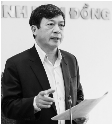
Chủ tịch UBND tỉnh Đoàn Văn Việt nhấn mạnh các giải pháp chủ chốt thực hiện các chỉ tiêu KT-XH trong tháng 6 và 6 tháng cuối năm 2020.