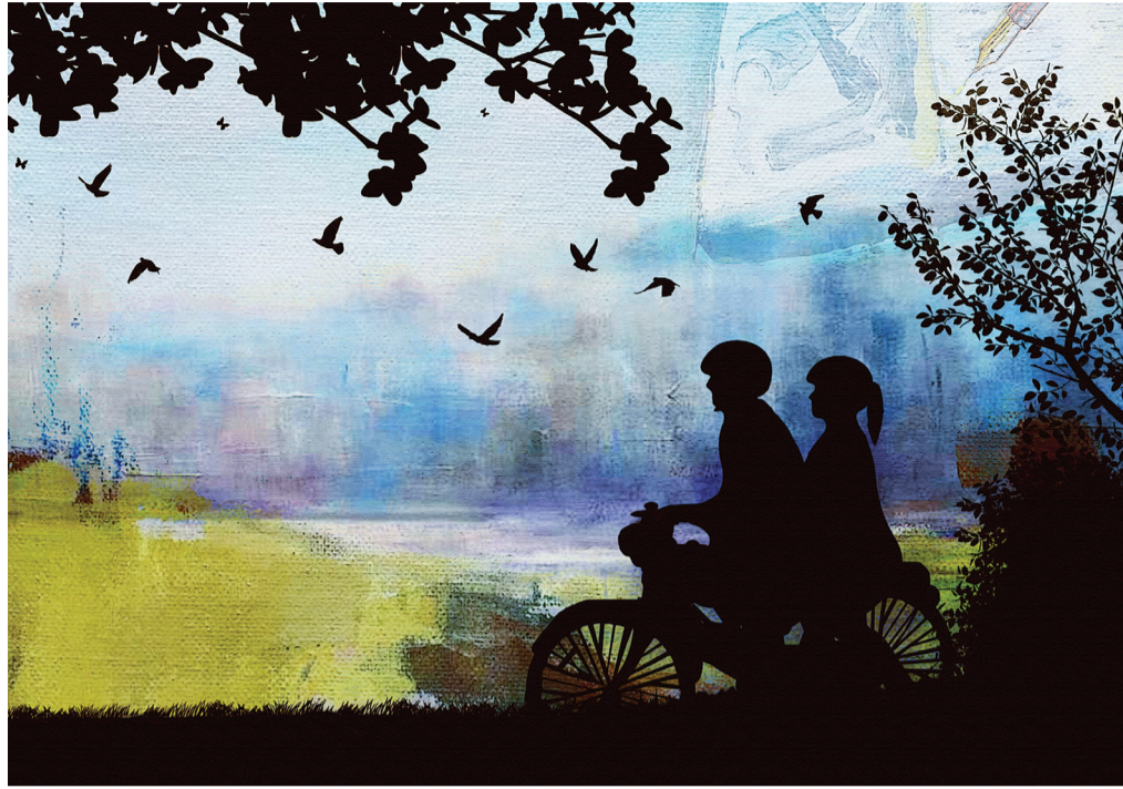
Minh họa: Phan Nhân