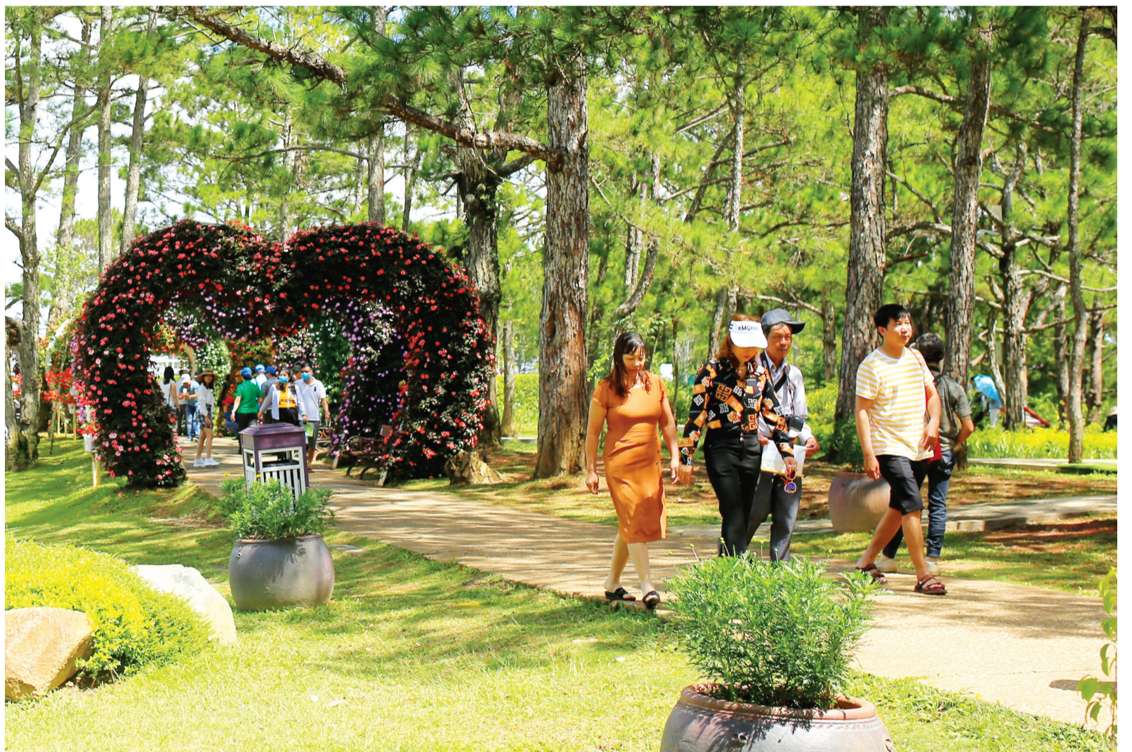
Tích cực xúc tiến, thu hút khách du lịch nội địa là một trong những nhiệm vụ cấp bách đang được tỉnh triển khai.