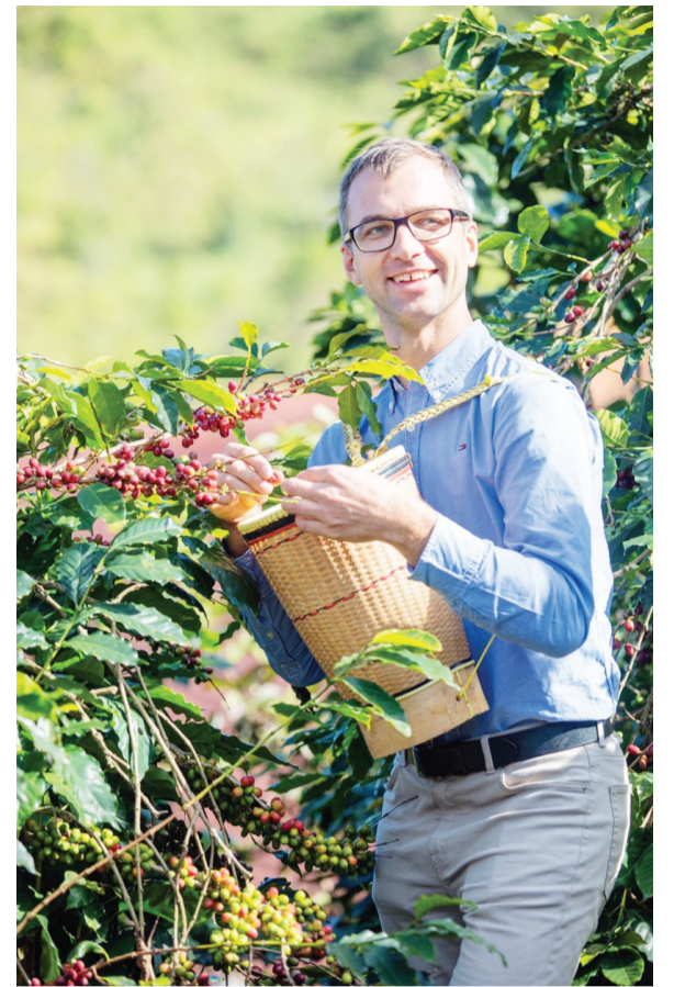
Khu Du lịch Chappi Moutains Coffee có thêm nhiều dịch vụ mới thu hút du khách.

Sau quãng thời gian tạm ngừng hoạt động tránh dịch bệnh, các dịch vụ du lịch tại Lạc Dương đã bắt đầu đón khách trở lại với những hoạt động kích cầu du lịch thiết thực nhằm thu hút du khách.