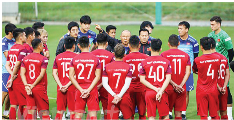
Việt Nam nhiều khả năng trở thành chủ nhà của AFF Cup 2020 với công tác phòng, chống dịch COVID-19 hiệu quả nhất khu vực.

Liên đoàn Bóng đá Đông Nam Á hoãn lễ bốc thăm vòng bảng AFF Cup 2020 mà chưa xác định ngày thay thế do ảnh hưởng của dịch COVID-19 lên nhiều quốc gia trong khu vực.