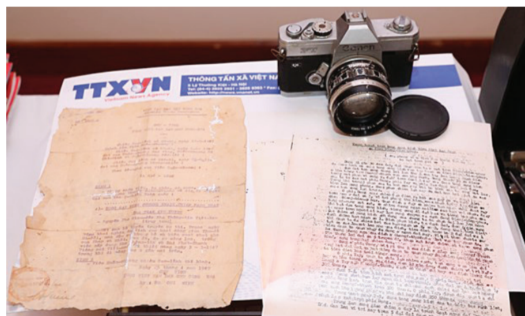
Các hiện vật tại buổi lễ bàn giao.

khoan Hải Dương 981 xâm phạm vùng đặc quyền kinh tế và thềm lục địa Việt Nam. Bức ảnh “Bác Hồ và cán bộ, phóng viên Thông tấn xã Việt Nam cùng con em trong cơ quan mừng sinh nhật lần thứ 60 của Người tại An toàn khu Việt Bắc (19/5/1890 - 19/5/1950)” được ép gỗ, kích