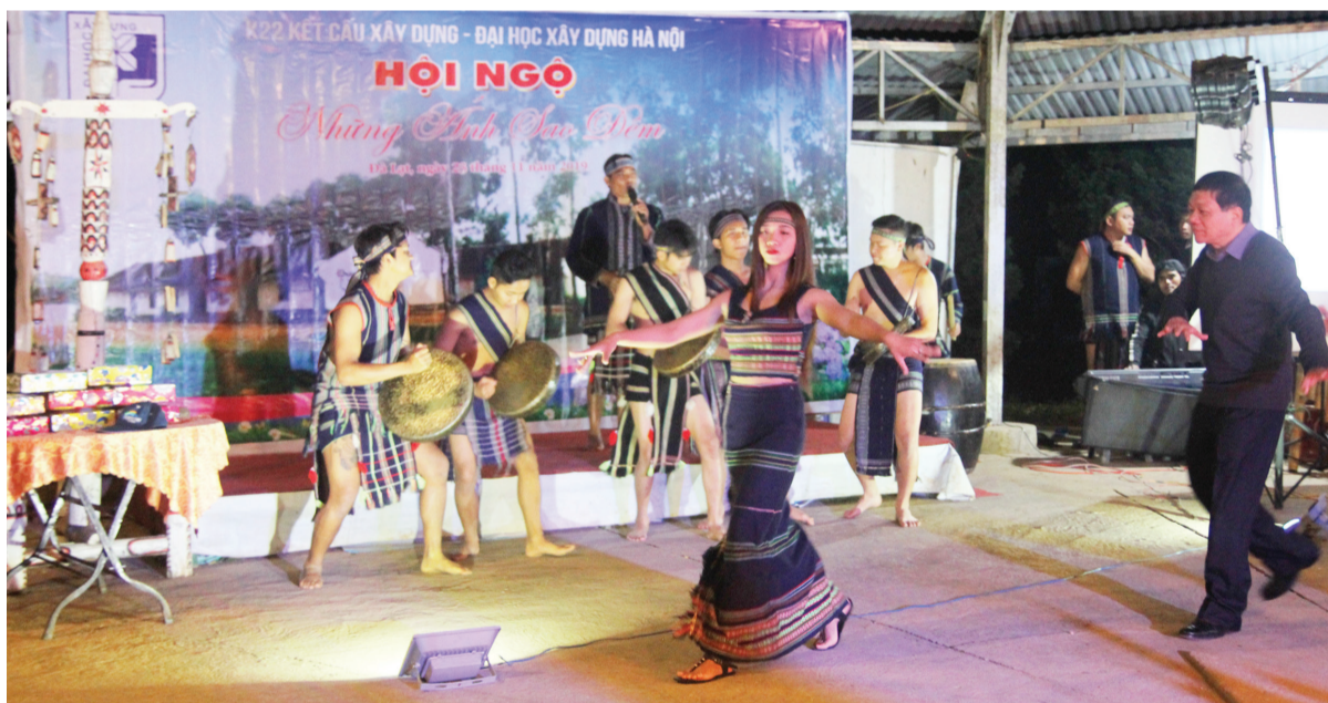
Du khách thưởng thức trọn vẹn đêm hội công chiêng ở Khu Du lịch Langbiang.