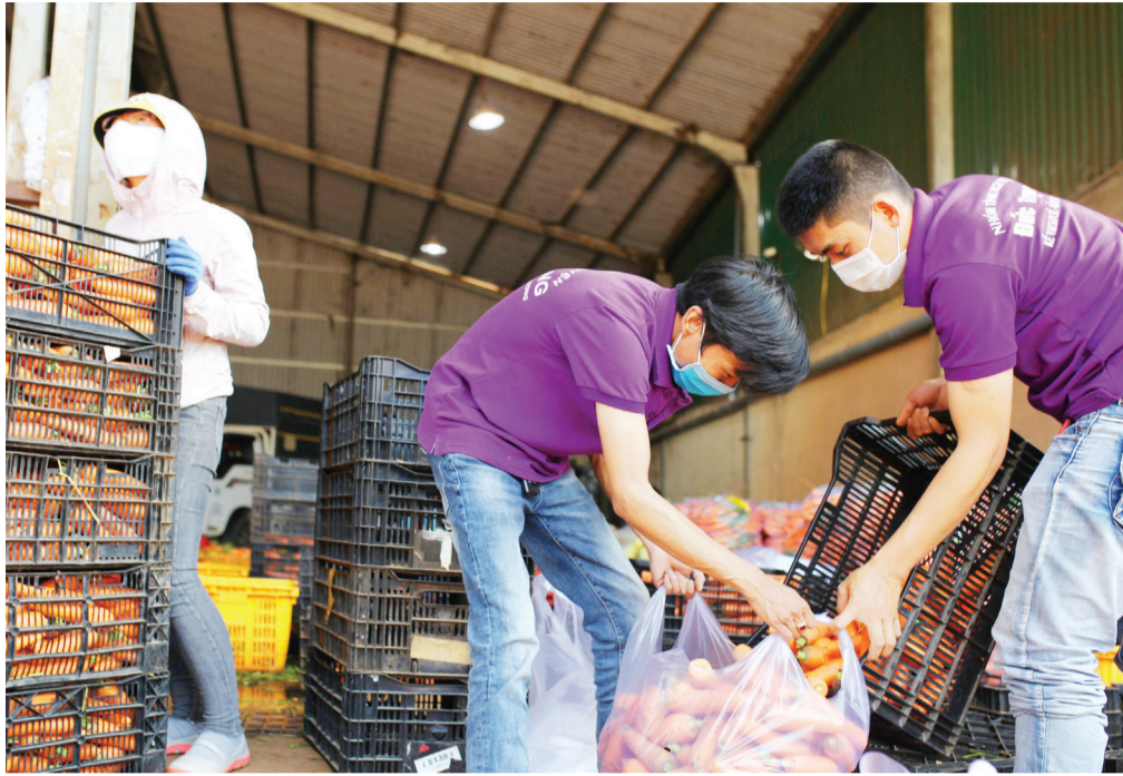
Các bạn trong Nhóm thiện nguyện Đức Trọng gom nông sản để đưa xuống vùng dịch Ninh Thuận.