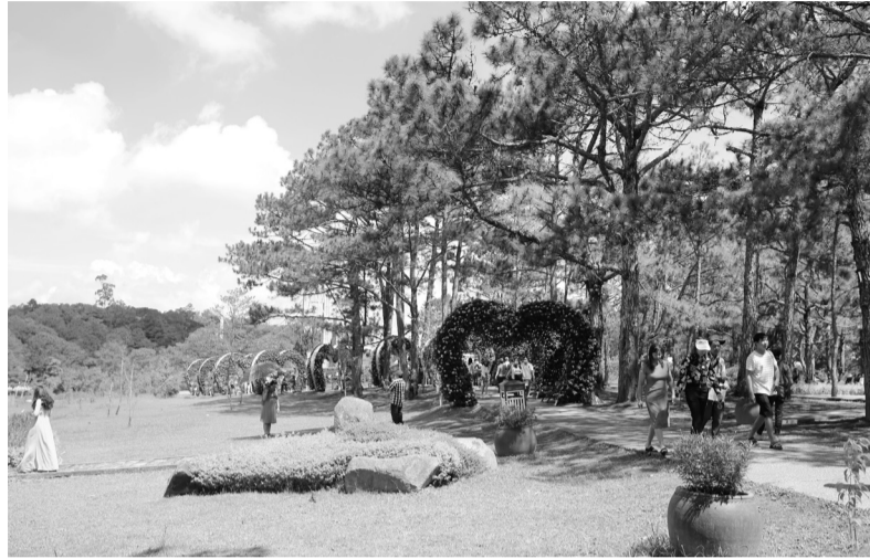
Tích cực xúc tiến, thu hút khách du lịch nội địa là một trong những nhiệm vụ cấp bách đang được tỉnh triển khai.

“Nhiệm vụ trọng tâm trong 6 tháng cuối năm đó là, các ngành, các cấp quyết tâm thực hiện “mục tiêu kép” - vừa tập trung thúc đẩy sản xuất, kinh doanh, tạo sức bật cho phát triển kinh tế - xã hội, phấn đấu đạt mức cao nhất các chỉ tiêu kế hoạch năm 2020; vừa tiếp tục phòng, chống dịch bệnh COVID-19”.