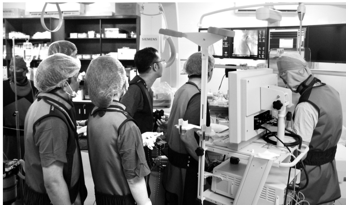
Các bác sĩ đang thực hiện kỹ thuật ERCP - nội soi mật tụy ngược dòng tại Bệnh viện Đa khoa Lâm Đồng dưới sự chỉ huy của GS Trịnh Đình Hỷ (Pháp).

Ngành Y tế Lâm Đồng thực hiện đạt và vượt các chỉ tiêu Nghị quyết Đại hội Đại biểu Đảng bộ tỉnh lần thứ X giao và Nghị quyết số 145/2015/NQ-HĐND của HĐND tỉnh về nhiệm vụ phát triển kinh tế - xã hội 5 năm 2016-2020.