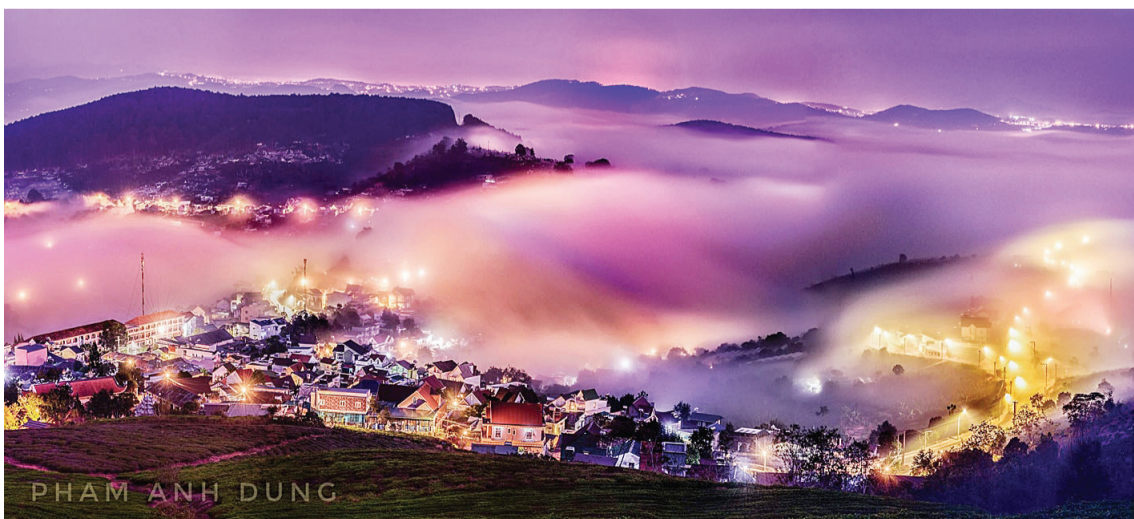
Sương khói Đà Lạt.