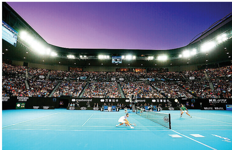
Một trận đấu tại Australian Open 2020 đầu năm nay. Ảnh Internet

Khi các giải bóng đá châu Âu lên lịch thi đấu trở lại sau một quãng dài bị hoãn vì đại dịch COVID-19, câu hỏi đặt ra là liệu các giải quần vợt Grand Slam còn lại trong năm 2020 có khởi động lại?