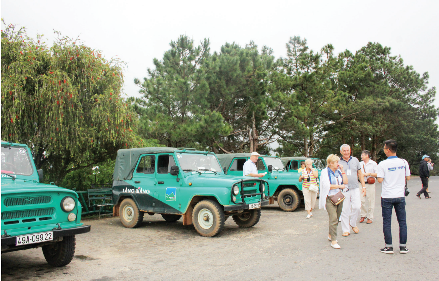
Khu Du lịch Langbiang thu hút đông đảo du khách đến tham quan.