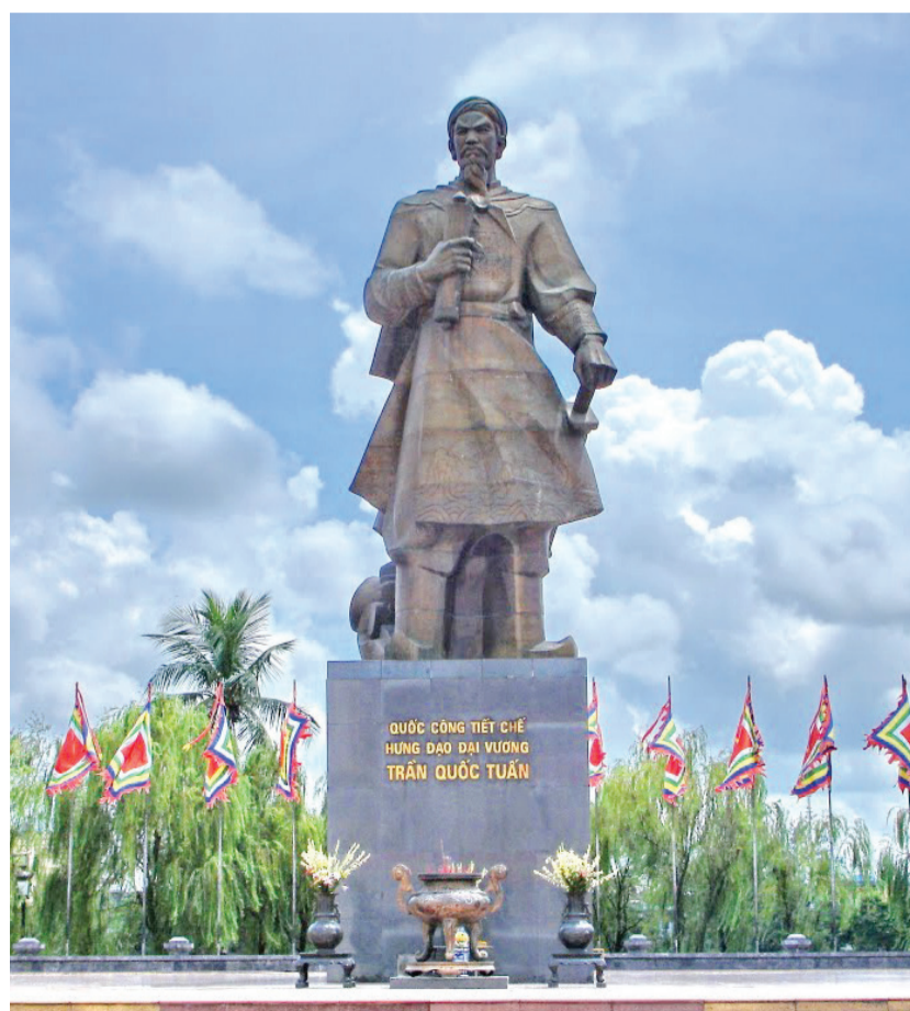
Tượng đài Hưng Đạo Đại Vương Trần Quốc Tuấn.

Năm 1237, tức 12 năm sau ngày cưới Lý Chiêu Hoàng, bởi Lý Chiêu Hoàng chưa sinh được con trai để nối ngôi, Thái sư Trần Thủ Độ đã bắt chị ruột của Lý Chiêu Hoàng là Thuận Thiên khi ấy đang là vợ của Trần Liễu - anh ruột Trần Cảnh - và gả cho Trần Cảnh trong lúc bà đang mang thai 3 tháng với Trần Liễu. Cũng bởi câu chuyện này mà Trần Liễu sau đó làm phản nhưng bị thua và suýt nữa bị Trần Thủ Độ chém đầu, chính người em ông là vua Trần Thái Tông đã đứng ra che chở và xin cho ông. Cuối cùng, ông được phong An Sinh Vương và ban cho thái ấp. Cũng bởi mối thâm thù này mà khi sinh ra Trần Quốc Tuấn,