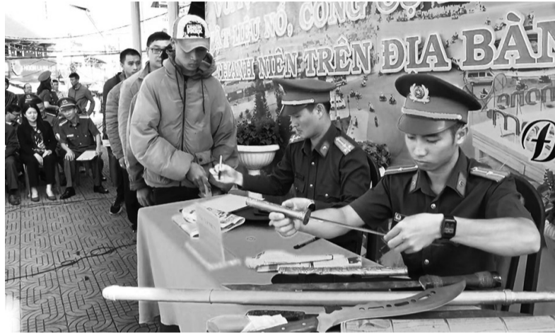
Người dân trên địa bàn TP Đà Lạt giao nộp vũ khí, vật liệu nổ.

Công an tỉnh đã chỉ đạo công an các đơn vị, địa phương tiến hành rà soát, xác định 5 tuyến đường, 63 địa bàn trọng điểm, 457 đối tượng nghi vấn có khả năng cao vi phạm về VK, VLN, CCHT. Đã tổ chức in 4.330 tài liệu tuyên truyền, treo 452 áp phích, băng rôn, phát 10.826 tờ rơi; tổ chức 49 buổi tuyên truyền trực tiếp với 10.165 lượt người tham gia, tập trung tuyên truyền, vận động đối với nhóm đối tượng là người đồng bào dân tộc thiểu số, người còn lưu giữ vũ khí làm kỷ vật, đối tượng trước đây được trang bị nay theo quy định không thuộc đối tượng được trang bị...; tổ chức cho 252 đối tượng nghi vấn cam kết không tàng trữ, sử dụng trái phép VK, VLN, CCHT; phối hợp xây dựng, phát sóng phóng sự tuyên truyền các quy định của Luật Quản lý, sử dụng VK, VLN, CCHT trên chuyên mục An ninh Lâm Đồng