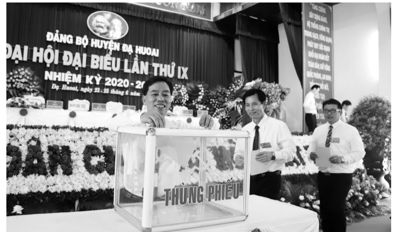
Bỏ phiếu bầu Ban Chấp hành Đảng bộ huyện Đa Huoai khóa mới.