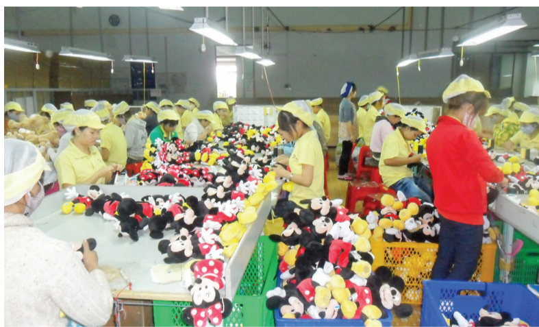
PTTD “Lao động giỏi, lao động sáng tạo” đã được các cấp công đoàn trong tỉnh cụ thể hóa thành các PTTD phù hợp với tính chất, đặc thù của từng ngành nghề, lĩnh vực.

Trong những năm qua, phong trào thi đua (PTTD) “Lao động giỏi, lao động sáng tạo” do Tổng Liên đoàn Lao động (LĐLĐ) Việt Nam phát động đã được các cấp công đoàn trong tỉnh triển khai sâu rộng, thu hút và khơi dậy niềm đam mê sáng tạo của người lao động trên nhiều lĩnh vực.