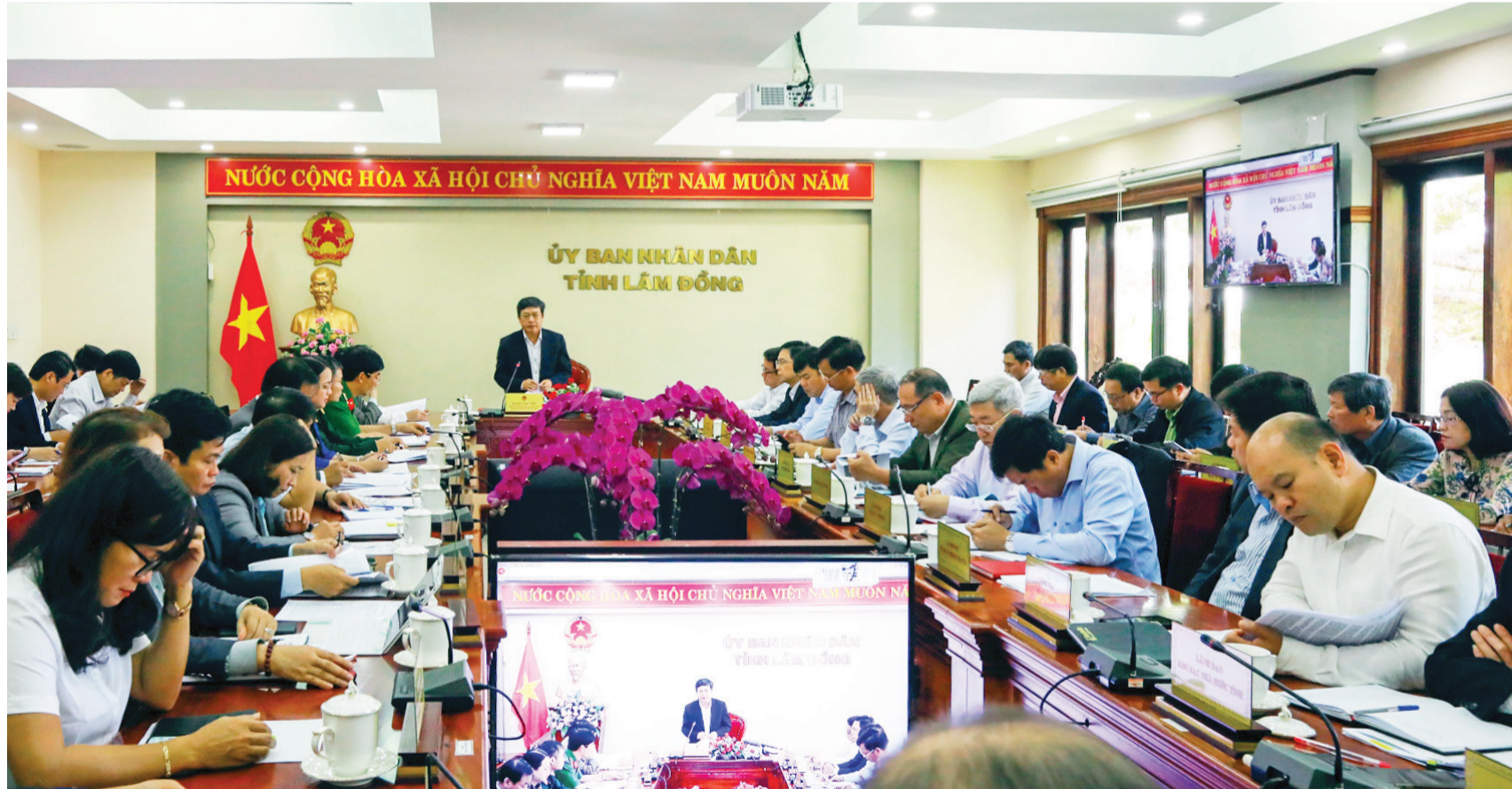
Toàn cảnh hội nghị.