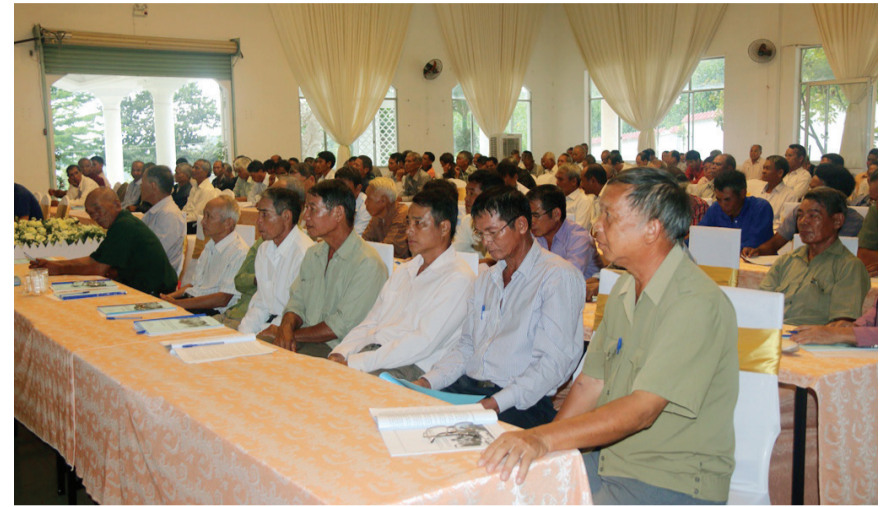
Người có uy tín tại buổi tập huấn.

Trong 2 ngày 24 và 25/6, tại thành phố Bảo Lộc, Ban Dân tộc tỉnh Lâm Đồng đã tổ chức tập huấn, bồi dưỡng kiến thức đối với người có uy tín trong đồng bào dân tộc thiểu số cho các huyện Đạ Huoai, Đạ Tẻh, Cát Tiên, Bảo Lâm, Di Linh và thành phố Bảo Lộc.