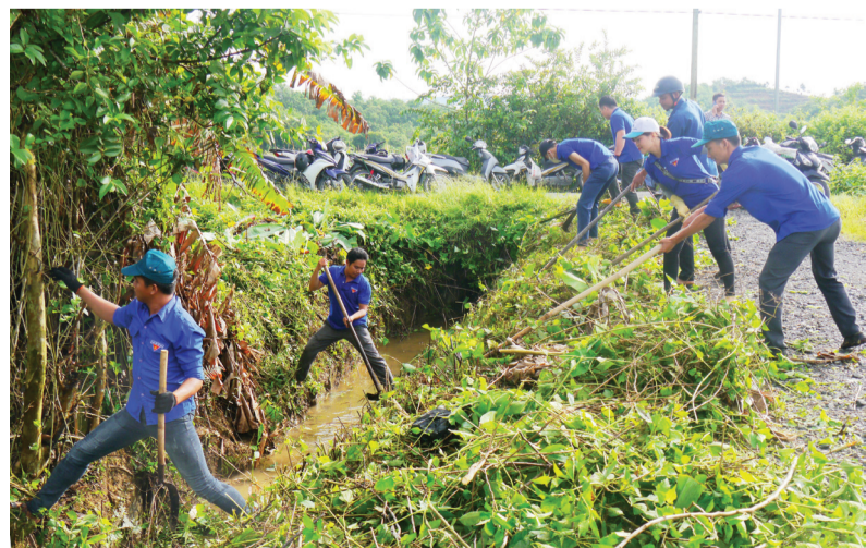
Vệ sinh môi trường, làm sạch không gian sống, góp phần phòng, chống dịch bệnh.

Tháng 6/2012, Thủ tướng Chính phủ chọn ngày 2/7 hàng năm là “Ngày Vệ sinh yêu nước, nâng cao sức khỏe Nhân dân”, ngày này có ý nghĩa rất quan trọng đối với công tác y tế dự phòng, nhằm mục đích kêu gọi toàn dân tích cực tham gia các hoạt động vệ sinh cá nhân, vệ sinh môi trường nâng cao hiệu quả phòng, chống dịch bệnh và cải thiện sức khỏe.