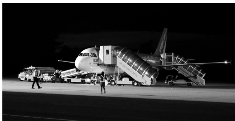
Cảng Hàng không Liên Khương.

Tình hình an ninh trật tự tại Cảng Hàng không Liên Khương thời gian qua cơ bản được đảm bảo; các lực lượng chức năng đã phối hợp thực hiện nghiêm công tác kiểm tra, giám sát an ninh hàng không nên đã kịp thời phát hiện, ngăn chặn những vụ việc vi phạm trong lĩnh vực hành chính.