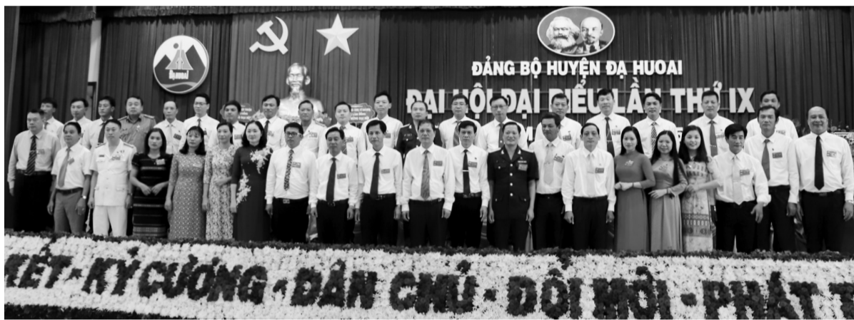
BCH Đảng bộ huyện Đa Huoai nhiệm kỳ 2020 - 2025 ra mắt đại hội.

được bầu vào BCH Đảng bộ huyện Đa Huoai nhiệm kỳ 2020 - 2025 là một tập thể đoàn kết, thống nhất về ý chí và hành động, có bản lĩnh chính trị vững vàng, phẩm chất đạo đức trong sáng, kiên định mục tiêu độc lập dân tộc và chủ nghĩa xã hội; tiêu biểu về trí tuệ, có tầm nhìn, tư duy đổi mới, sáng tạo; tiêu biểu cho toàn Đảng bộ về tính chiến đấu, tính kỷ luật, gắn bó mật thiết với Nhân dân, quy tụ được sự đoàn kết, thống nhất trong toàn Đảng bộ và đủ uy tín, năng lực lãnh đạo Đảng bộ huyện thực hiện thắng lợi Nghị quyết Đại hội Đảng bộ huyện nhiệm kỳ 2020 - 2025 đã đề ra.