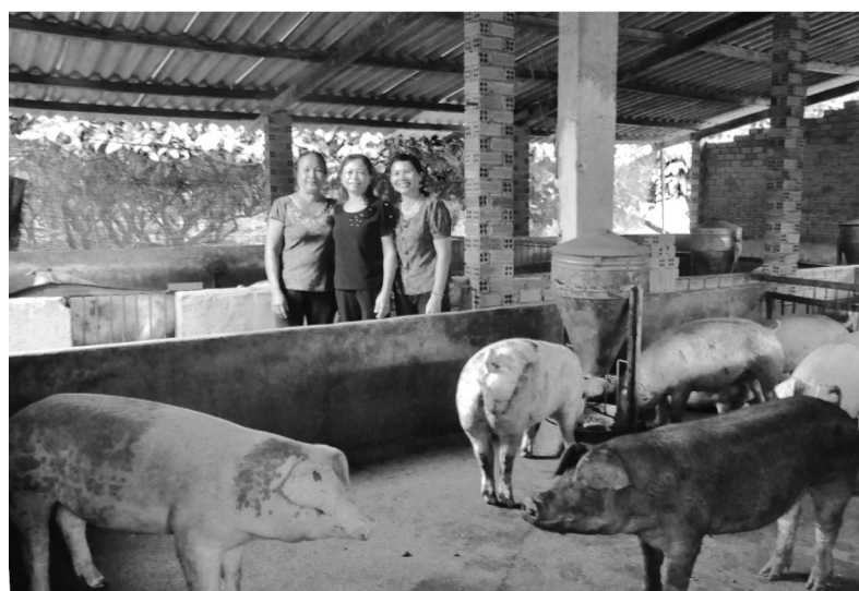
Các thành viên trong tổ hợp tác nuôi heo không sử dụng chất cấm tại xã Quảng Trị - Đạ Tẻh.

Để hỗ trợ hội viên thoát nghèo, ngay từ đầu năm Hội đã xây dựng