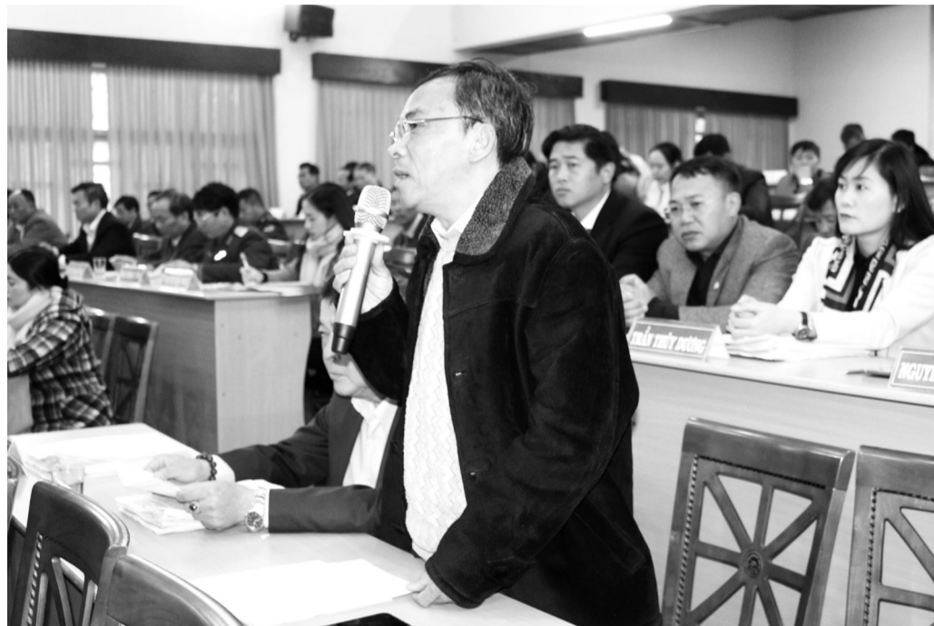
Đại biểu HĐND thành phố kiến nghị tại kỳ họp cuối năm về những vấn đề bất cập, tồn tại trong trật tự xây dựng, quy hoạch.

Cùng với sự phát triển chung của thành phố, năm 2020, Mặt trận Tổ quốc (MTTQ) Đà Lạt đã có nhiều đóng góp trong việc xây dựng chính quyền trong sạch, vững mạnh. MTTQ và các đoàn thể chính trị đã kịp thời lắng nghe, nắm bắt tâm tư, kiến nghị, đề xuất của Nhân dân về những mặt còn tồn tại, hạn chế để tham mưu cấp ủy, chính quyền thành phố chỉ đạo xử lý, giải quyết.