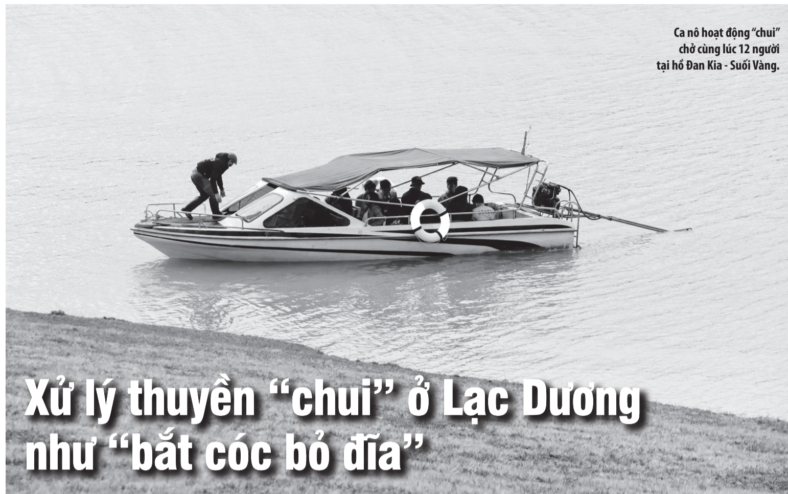
Ca nô hoạt động "chui" chờ cùng lúc 12 người tại hồ Đan Kia - Suối Vàng.