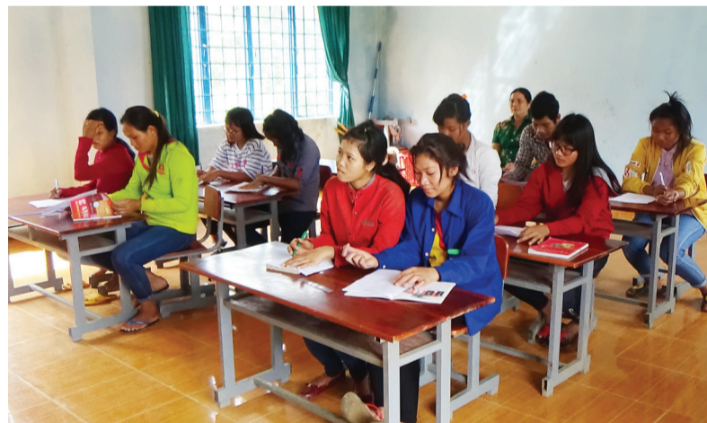
Tại Thôn 4, lớp học xóa mù chữ được đội ngũ giáo viên Trường Tiểu học Phước Cát 2 triển khai thực hiện đều đặn vào ngày thứ Hai, thứ Ba, thứ Tư hàng tuần.

Thầy Trà tâm sự: "Nói thì dễ nhưng những ngày đầu để vận động các học viên đi học đã khó, duy trì sĩ số lớp học lại càng khó hơn. Theo đó, ngoài việc dạy học chữ, hằng ngày, các thầy cô giáo còn kết hợp