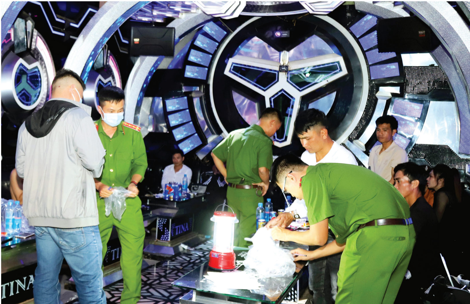
Công an TP Bảo Lộc đột kích vào quán karaoke Ti Na bắt quả tang 24 thanh niên đang sử dụng ma túy.