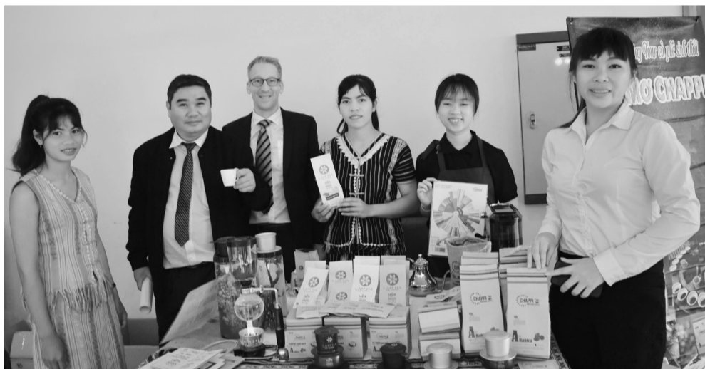
Mục tiêu 5 năm tới Lâm Đồng đạt khoảng 160 sản phẩm OCOP cấp tỉnh.