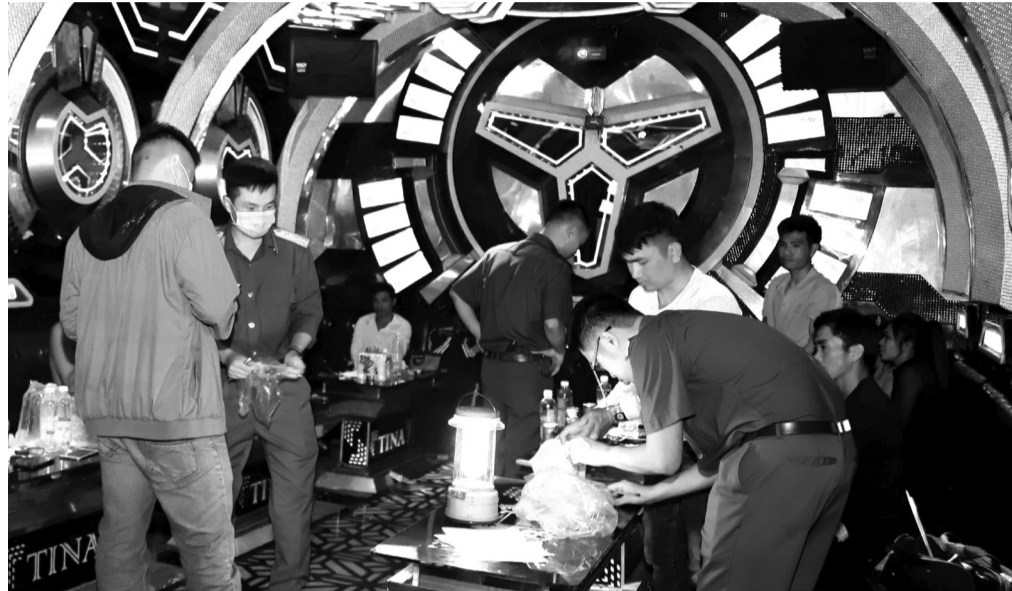
Công an TP Bảo Lộc đột kích vào quán karaoke Ti Na bắt quả tang 24 thanh niên đang sử dụng ma túy.

Với mục tiêu “Tất cả vì sự bình yên của Nhân dân”, Công an TP Bảo Lộc tập trung chỉ đạo đơn vị chủ động nắm chắc tình hình, thực hiện đồng bộ các biện pháp nghiệp vụ đấu tranh, phòng ngừa tội phạm, đảm bảo an ninh trật tự (ANTT), an toàn xã hội (ATXH) trên địa bàn. Qua đó, tạo sự tin tưởng, đồng thuận và ủng hộ trong Nhân dân địa phương.