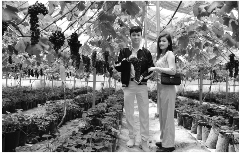
Lâm Đồng phấn đấu đến năm 2025 đạt thu nhập bình quân hơn 400 triệu đồng/ha/năm diện tích nông nghiệp ứng dụng công nghệ cao.

có tất cả 19 vùng sản xuất, 20 doanh nghiệp và 108 hợp tác xã đạt các tiêu chí ứng dụng công nghệ cao; 30% diện tích đất canh tác đạt các tiêu chuẩn chứng nhận an toàn bền vững; 99% mẫu nông sản kiểm nghiệm an toàn. Đồng thời phấn đấu đạt các tỷ lệ 60% sản lượng nông sản tiêu thụ theo hợp đồng, 40% sản phẩm chế biến và 20% nông sản tươi được gắn tem truy xuất nguồn gốc trước