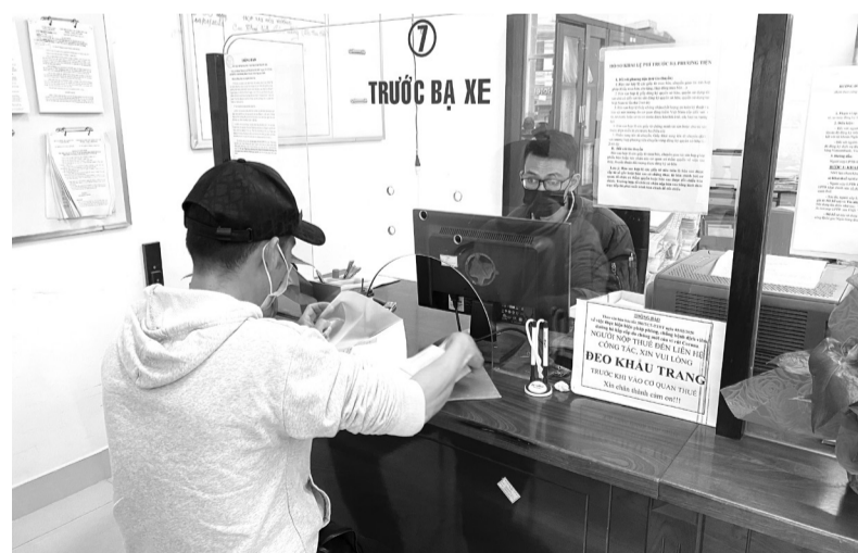
Ngành thuế Lâm Đồng phấn đấu hoàn thành xuất sắc nhiệm vụ công tác thuế đồng thời phải đảm bảo nuôi dưỡng nguồn thu.

Để vận dụng và cụ thể hóa từng nội dung chuyên đề toàn khóa “Học tập và làm theo tư tưởng, đạo đức, phong cách Hồ Chí Minh về ý chí tự lực, tự cường và khát vọng phát triển đất nước phồn vinh, hạnh phúc” vào thực tiễn công tác thuế, Đảng ủy Cục Thuế Lâm Đồng đã triển khai đến từng đảng viên, đoàn viên, công chức thực hiện, đưa việc học tập và làm theo Bác đi vào chiều sâu.