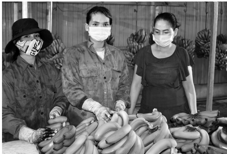
HTX Laba Banana Đạ K'Nàng đang tạo việc làm ổn định cho hàng chục lao động đồng bào DTTS địa phương.

"Nhìn chung trong những năm qua, thực hiện Đề án tái cơ cấu ngành nông nghiệp trên địa bàn tỉnh