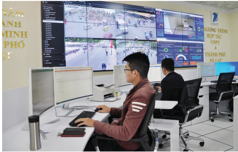
Quan sát hệ thống giao thông trên đường phố tại Trung tâm điều hành thông minh thành phố Đà Lạt.

Đà Lạt cũng đang phát huy khá hiệu quả hệ thống văn phòng điện tử, thư điện tử công vụ; tích cực đưa các phần mềm như phần mềm quản lý việc thực hiện các văn bản chỉ đạo, điều hành của UBND thành phố, quản lý việc giải quyết các chỉ đạo của UBND thành phố