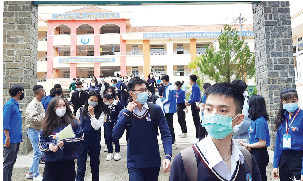
Thí sinh kết thúc làm bài thi tại điểm thi ở thành phố Đà Lạt.