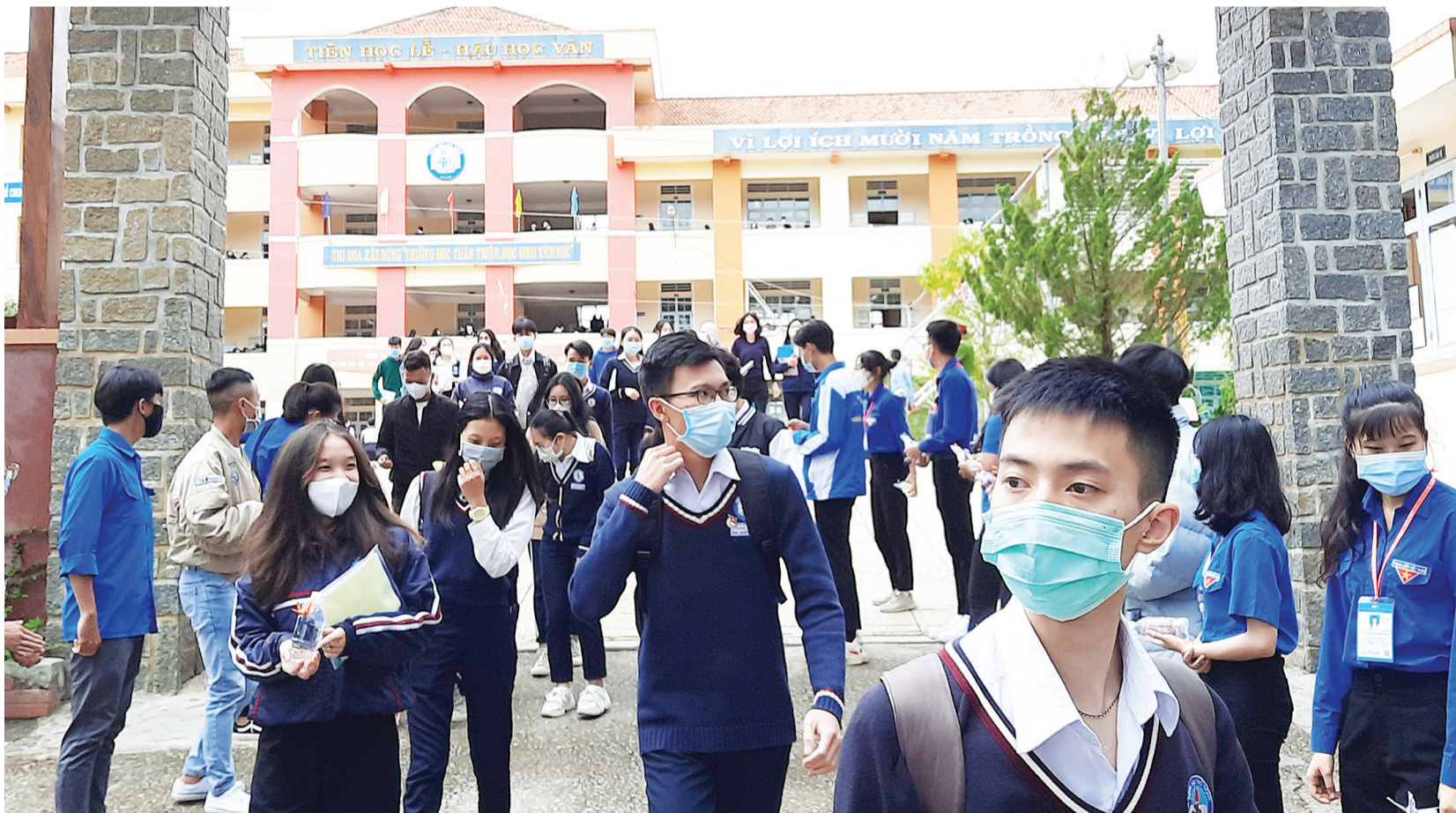
Thí sinh kết thúc làm bài thi tại điểm thi ở thành phố Đà Lạt.