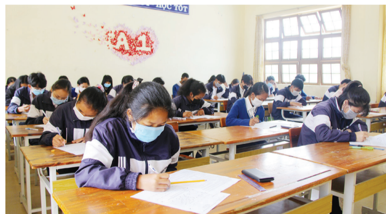
Môn thi cuối năm học đối với học sinh lớp 11 Trường THPT LangBian (Lạc Dương).

Ngày 30/6, Giám đốc Sở Giáo dục và Đào tạo (GDĐT) Lâm Đồng ký chuẩn y kết quả tốt nghiệp THCS năm học 2020 - 2021 tỉnh Lâm Đồng là 19.876 học sinh hệ phổ thông. Cùng với đó, các lớp THCS và THPT đã kết thúc một năm học chạy đua với đại dịch COVID-19 nhiều thành công.