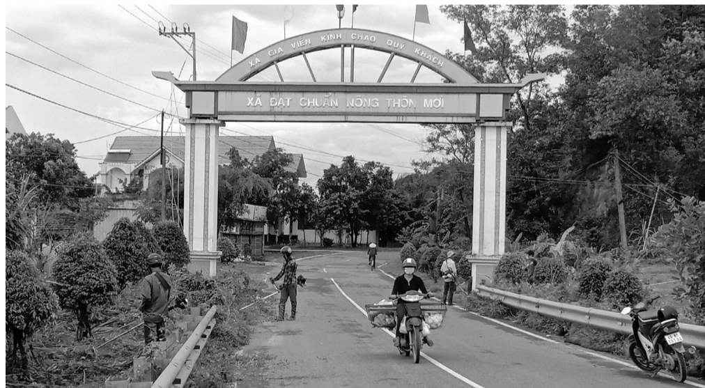
Xây dựng nông thôn mới kiểu mẫu, diện mạo xã Gia Viễn ngày càng phát triển và đẹp hơn.

Với những cách làm hay, hiệu quả, có sự chung sức, đồng lòng của Nhân dân, sau khi đạt chuẩn nông thôn mới (NTM), xã Gia Viễn - Cát Tiên tiếp tục triển khai nhiều giải pháp nhằm giữ vững và nâng cao chất lượng, hiệu quả các tiêu chí theo hướng bền vững, với đích đến là NTM kiểu mẫu.