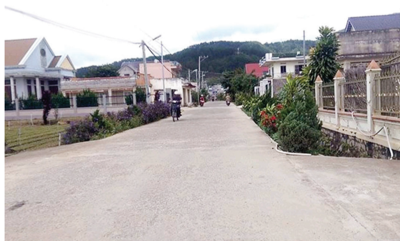
Qua công tác tuyên truyền, vận động với phương châm “5 khéo”, người dân Lạc Lâm đã chung tay góp sức làm cho bộ mặt nông thôn trên địa bàn khởi sắc từng ngày.

Lạc Lâm là một xã thuần nông, Lạc Lâm có gần 2 ngàn hộ dân với gần 9.900 nhân khẩu, trong đó có hơn 87% người dân theo đạo Thiên chúa. Về xã Lạc Lâm hôm nay, bộ mặt nông thôn đã khởi sắc, cơ sở hạ tầng được đầu tư xây dựng phục vụ dân sinh; đường làng, ngõ xóm được bê tông hóa sạch sẽ; những vườn rau, hoa sản xuất theo hướng công nghệ cao được nhiều nhà nông áp dụng; mọi mặt đời sống người dân không ngừng được nâng lên. Có