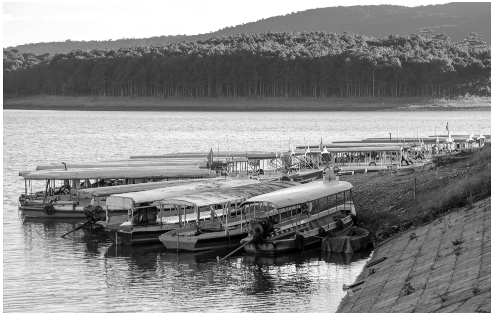
Hồ Tuyên Lâm đang được gia cố, tu sửa trước mùa mưa lũ năm 2021.

Việc chỉnh chỉnh nhà cửa, chặt tỉa cành cây, an toàn hệ thống lưới điện, hệ thống thông tin liên lạc và khả năng chống bão ở địa phương