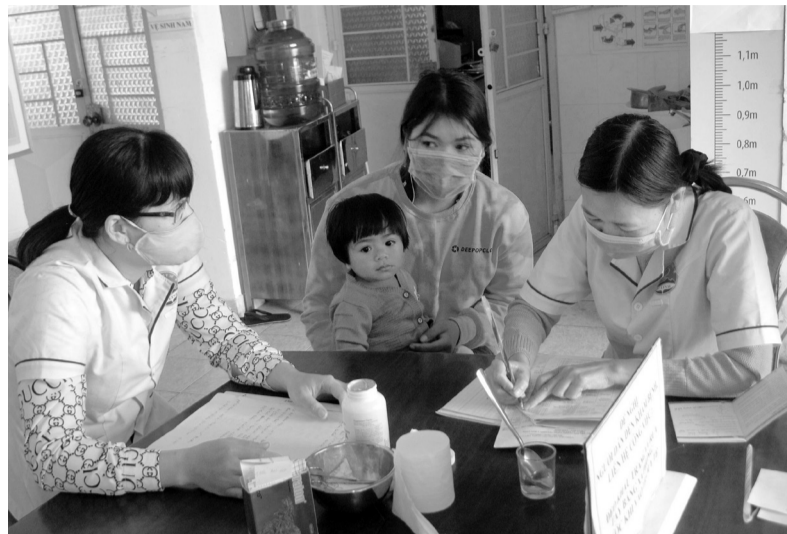
Chăm sóc sức khỏe trẻ em ở Trạm Y tế xã Đình Lạc, huyện Di Linh.

Chi cục Dân số - Kế hoạch hóa gia đình Lâm Đồng hướng dẫn các hoạt động truyền thông hưởng ứng Ngày Dân số thế giới 11/7 năm 2021 với mục đích nâng cao nhận thức, trách nhiệm của các cấp ủy đảng, chính quyền các cấp; các ban, ngành, đoàn thể và toàn xã hội về vai trò, tầm quan trọng và định hướng về công tác dân số trong tình hình mới.