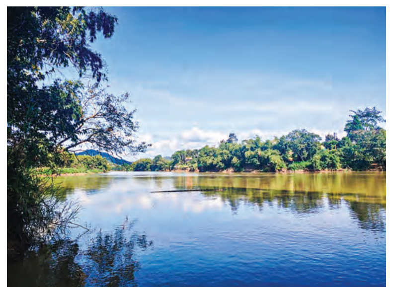
Sáng trên sông Đồng Nai.