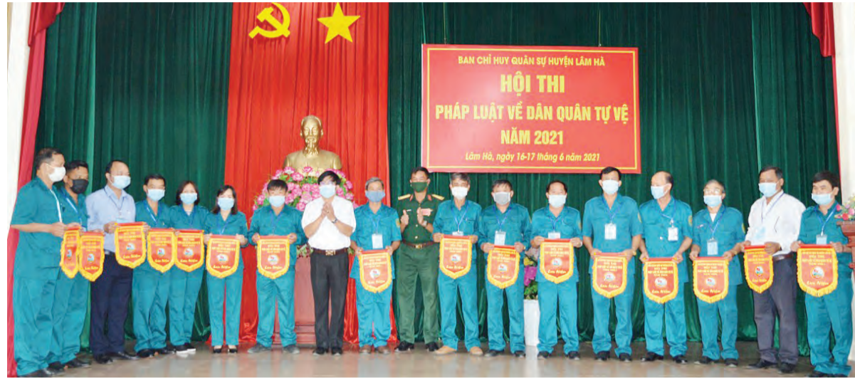
Kiện toàn cán bộ quân sự cơ sở là vấn đề thường xuyên được các địa phương chú trọng.

Quy hoạch, bồi dưỡng, đào tạo cán bộ ngành quân sự cơ sở; kiểm tra việc tuyển dụng, sử dụng Chỉ huy trưởng, Phó Chỉ huy trưởng Ban Chỉ huy Quân sự cấp xã; tuyên truyền, phổ biến chủ trương của Đảng, chính sách, pháp luật của Nhà nước về dân tộc, tôn giáo trên địa bàn tỉnh... là những hoạt động trọng tâm của Sở Nội vụ, góp phần xây dựng nền quốc phòng địa phương vững mạnh toàn diện.