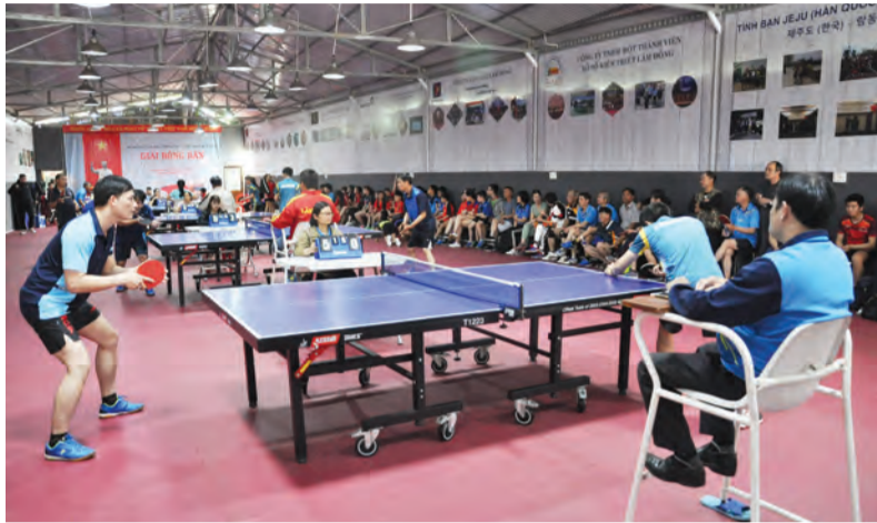
Một giải bóng bàn cấp thành phố do Đà Lạt tổ chức trong tháng 7/2020.

Là một liên đoàn tích cực tổ chức rất nhiều hoạt động trong năm, trong đó có những giải lớn của tỉnh, Liên đoàn Bóng bàn Lâm Đồng đang vận động các hội, các câu lạc bộ (CLB) cơ sở trong tỉnh thích ứng với thực tế, duy trì tập luyện, giữ vững phong trào trong bối cảnh dịch bệnh COVID-19 hoành hành hiện nay.