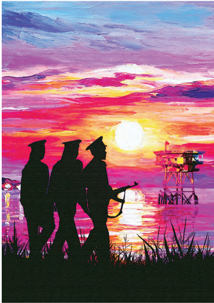
Minh họa: Phan Nhân

Những ngày tiếp sau, anh thường xuyên tìm gặp chị, tình nguyện làm