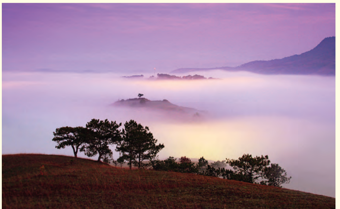
Bình minh đồi Trường lái Đà Lạt.