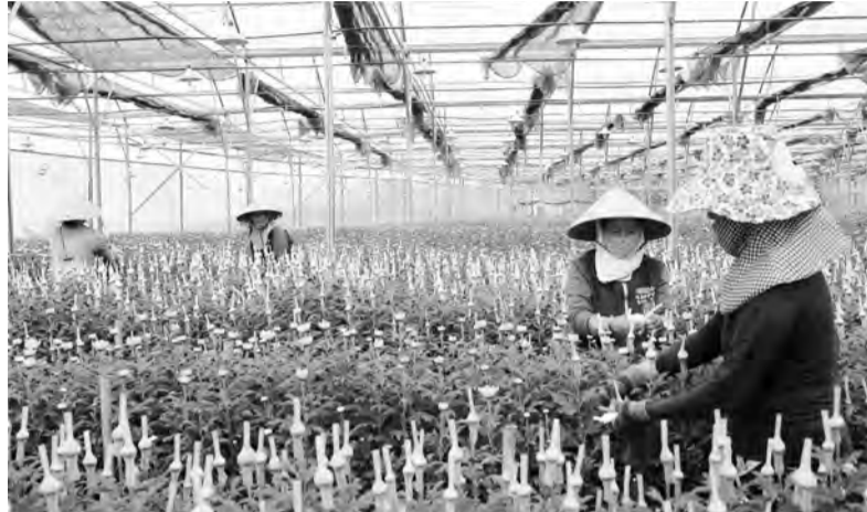
Trang trại sản xuất hoa tại Khu Du lịch canh nông Mai Khôi.

Theo số liệu thống kê, lượng khách (khi chưa có dịch COVID-19) đến