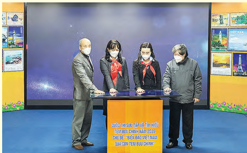
Đại diện Ban Tổ chức, Ban Giám khảo thực hiện nghi thức phát động trực tuyến cuộc thi.