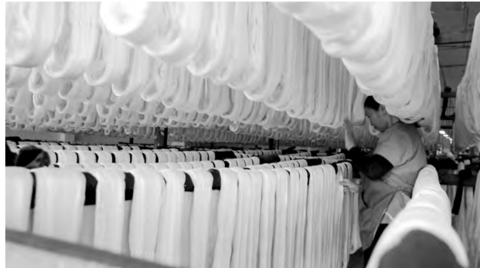
Tơ sợi - nguyên liệu dệt lụa.

Theo Đề án Phát triển bền vững ngành Dâu tằm tơ Lâm Đồng giai đoạn 2019 - 2023, đến nay, Lâm Đồng đã phát triển gần 9 ngàn ha dâu, cho sản lượng dâu hơn 180 ngàn tấn, sản lượng kén tằm hơn 12,5 ngàn tấn... Tuy nhiên, nguồn trứng giống tằm hiện nay hầu như phải nhập khẩu từ Trung Quốc theo đường tiểu ngạch và đang báo động những rủi ro, nguy cơ đứt gãy sản xuất do không tự chủ được nguồn giống chất lượng.