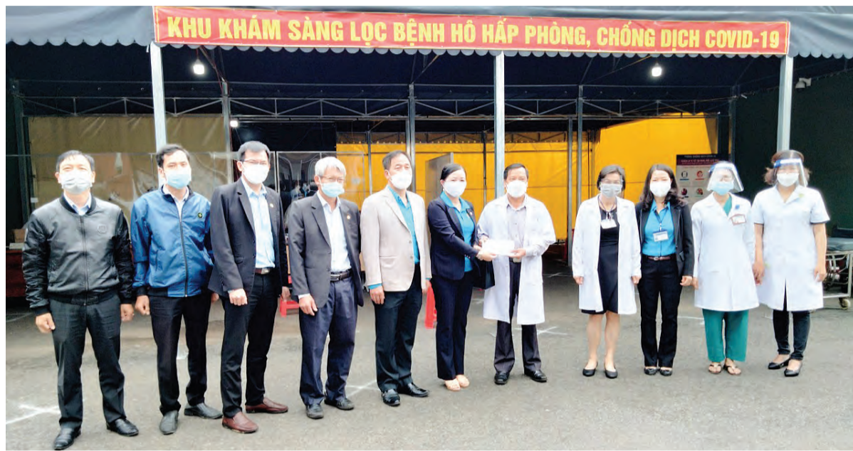
Liên đoàn Lao động tỉnh tặng quà tuyến đầu chống dịch.

(NLD). Các cấp công đoàn trong tỉnh đã khẩn trương vào cuộc, phối hợp với các cấp, các ngành và doanh nghiệp thực hiện quyết liệt, hiệu quả các biện pháp phòng, chống dịch, gắn với khôi phục sản xuất, kinh doanh, thích ứng linh hoạt trong tình hình mới.