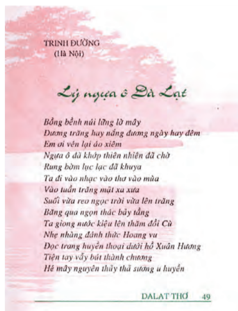
Bài thơ "Lý ngựa ô Đà Lạt" của nhà thơ Trình Đường trong tập thơ "Dalat thơ" xuất bản năm 1996.

Nhà thơ Trình Đường không sinh ra ở Đà Lạt, không sống cùng Đà Lạt qua những năm tháng chiến tranh, nhưng mạch cảm của ông dành cho thành phố này đã làm cho