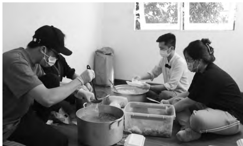
Nhóm bạn trẻ nấu cơm 0 đồng cho những người khó khăn trên địa bàn TP Đà Lạt.