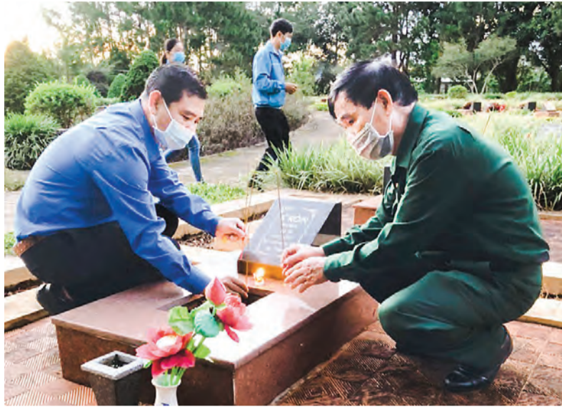
Tuổi trẻ Bảo Lộc tri ân các Anh hùng liệt sĩ.

Đề khơi dậy, kích thích bầu nhiệt huyết, tinh thần xung kích, tình nguyện vì cuộc sống cộng đồng của tuổi trẻ, Thành đoàn Bảo Lộc xác định giáo dục truyền thống yêu nước, giáo dục chính trị tư tưởng cho thế hệ trẻ là nhiệm vụ trọng tâm, xuyên suốt. Trong năm 2021, Thành đoàn Bảo Lộc tiếp tục triển khai Cuộc vận động “Tuổi trẻ Bảo Lộc học tập và làm theo lời Bác”, gắn việc học tập, nghiên cứu, tìm hiểu về những hành động, việc làm, lời dạy của Bác với các nội dung, chương trình hoạt động Đoàn. Trong đó, Thành đoàn đặc biệt chú trọng đến vấn đề nêu gương. Với việc đẩy mạnh ứng dụng công nghệ thông tin, các cấp bộ Đoàn thiết lập, quản lý website: tuoitrebalooc.vn và fanpage: Tuổi trẻ Bảo Lộc, đồng thời xây dựng các chuyên mục: Theo dấu chân Bác, Mỗi ngày một tin tốt - mỗi tuần một câu chuyện đẹp... để tuyên truyền, giáo dục đoàn viên, thanh niên, bên cạnh tổ chức cho tuổi trẻ học tập, tìm hiểu các chủ trương, nghị quyết của Đảng, chính sách, pháp luật của Nhà nước, giáo dục chủ