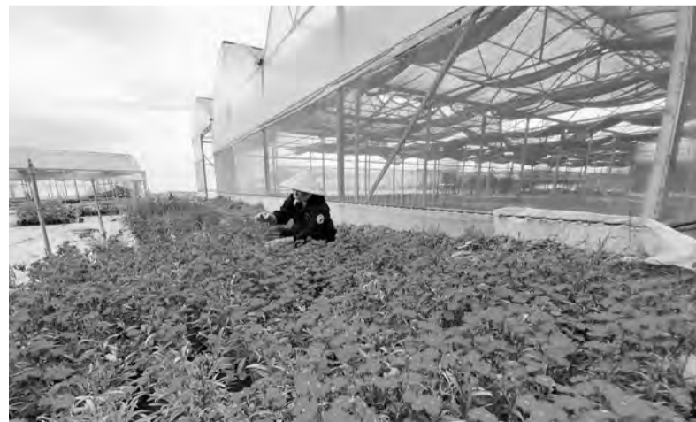
Ứng dụng công nghệ cao trong nông nghiệp đã và đang là hướng đi bền vững cho Đà Lạt và các địa phương.

Bên cạnh đó, công nghệ màng bao phủ nhà kính bằng plastic 3 - 5 lớp có tác dụng chống tia UV (tia cực tím), khuếch tán ánh sáng, chống