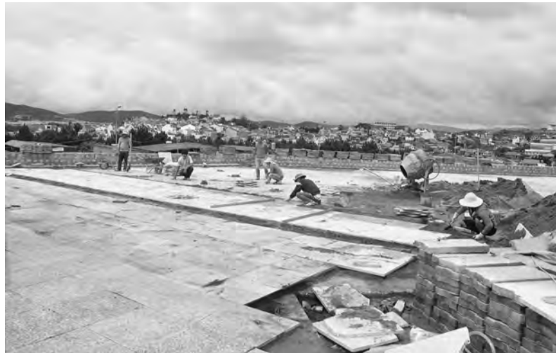
Thi công tại công trình Sân vận động 20 nghìn chỗ ngồi thuộc Dự án đầu tư xây dựng Khu Liên hợp Văn hóa - Thể thao tỉnh Lâm Đồng tại Đà Lạt - một công trình trọng điểm của Lâm Đồng.

Trong năm 2021 vừa qua, Trung tâm được giao gần 20 công trình, dự án thực hiện công tác bồi thường, hỗ trợ, giải phóng mặt bằng khi thu hồi đất trên địa bàn tỉnh. Có thể kể tên các công trình dự án này như: các hạng mục xây dựng đường tránh ngập, nạo vét kênh sau tràn xả lũ của Dự án hồ chứa nước Đa Sĩ - Cát Tiên; Dự án đường gom cao tốc Liên Khương - Prenn; Dự án hồ chứa nước Đông