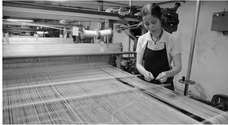
Giá trị sản xuất công nghiệp năm 2021 tăng 10,7% so với cùng kỳ năm trước và đạt 103,8% kế hoạch năm.

Năm 2021 là năm đầy biến động! Nhưng với sự đoàn kết, thống nhất, linh hoạt của cả hệ thống chính trị từ Trung ương đến địa phương; đặc biệt là sự đồng thuận, ủng hộ và tham gia tích cực của toàn thể Nhân dân và doanh nghiệp nên tình hình kinh tế - xã hội của tỉnh Lâm Đồng vẫn giữ được ổn định và phát triển, với 10/18 chỉ tiêu đạt và vượt kế hoạch.