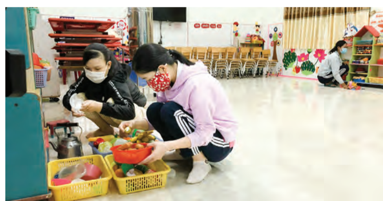
Các cô giáo Trường Mầm non Hoa Hướng Dương làm vệ sinh đồ chơi cho các cháu.

người lao động và được LĐLĐ huyện Lâm Hà vận động thành lập công đoàn cơ sở từ nhiều năm, tất cả người lao động trong trường đều tham gia tổ chức công đoàn. Công đoàn cơ sở trường đã phối hợp với Ban Giám hiệu thúc đẩy phong trào dạy và học của cô và bé. Giáo viên được tạo điều kiện học tập, nâng cao trình độ cũng như các kỹ năng. Trường thường xuyên tham gia các hoạt động của ngành Giáo dục, của LĐLĐ cũng như các phong trào của thị trấn, của huyện. Và niềm vui rất lớn với đội ngũ cán bộ, giáo viên nơi đây là nhà trường luôn đạt thành tích cao trong các hội thi, hội diễn. Nâng cao trình độ, kỹ năng của các cô cũng là nâng cao chất lượng chăm sóc, dạy dỗ các bé. Các bé tới trường được chăm sóc, dạy dỗ tốt, khỏe mạnh, ngoan ngoãn. Các bé lớp Lá của Trường Mầm non Hoa Hướng Dương tốt nghiệp mầm non, vào lớp 1 đều đạt chuẩn, tiếp cận nhanh chóng với kiến thức tiểu học, chăm ngoan và tiến bộ.