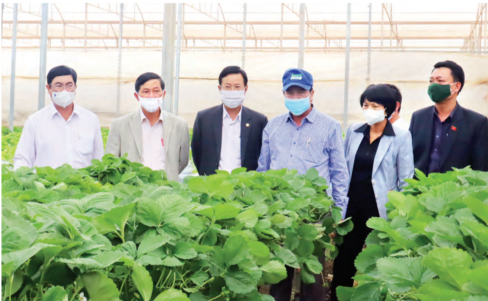
Thường trực Tỉnh ủy thường xuyên kiểm tra thực tế và làm việc trực tiếp ở cơ sở đã tạo nên nhiều hiệu quả trong triển khai, thực hiện các nhiệm vụ. TRANG 2