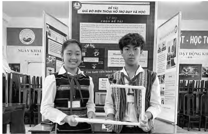
Học sinh dân tộc thiểu số huyện Lạc Dương tham dự Cuộc thi Khoa học kỹ thuật dành cho học sinh trung học.