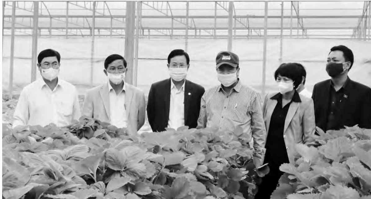
Thường trực Tỉnh ủy thường xuyên kiểm tra thực tế và làm việc trực tiếp ở cơ sở đã tạo nên nhiều hiệu quả trong triển khai, thực hiện các nhiệm vụ.

Nghị quyết Trung ương (NQTU) 4, khóa XII về “Tăng cường xây dựng, chỉnh đốn Đảng; ngăn chặn, đẩy lùi sự suy thoái về tư tưởng chính trị, đạo đức, lối sống, những biểu hiện “tự diễn biến”, “tự chuyển hóa” trong nội bộ” được ban hành, thể hiện rõ quyết tâm chính trị của Đảng trong tiến hành công cuộc xây dựng, chỉnh đốn Đảng. Sau 5 năm (2016-2021) triển khai thực hiện, NQTU 4 thực sự là chiếc gương soi để những vấn đề còn tồn tại được khắc phục, dần tạo nên dấu ấn của sự chuyển biến trong cả nước nói chung, Lâm Đồng nói riêng.