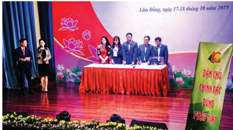
Một tiết mục tại Hội thi Tìm hiểu về CCHC của Lâm Đồng được sân khấu hóa trong năm 2019.

Do ảnh hưởng của đại dịch COVID-19, Cuộc thi Tìm hiểu Cải cách hành chính của Lâm Đồng trong năm 2021 được tổ chức vào tháng 11 qua mạng Internet. Thay vì chỉ có cán bộ, công chức, viên chức tham gia như những năm trước thì năm nay, cuộc thi đã được tổ chức rộng rãi với đông đảo tầng lớp Nhân dân tham gia.