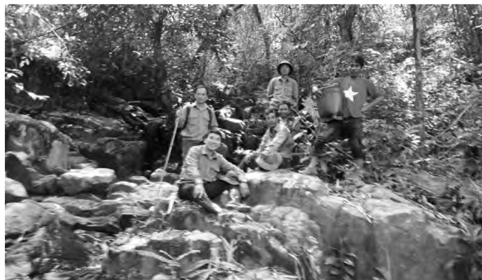
Các lực lượng phối hợp tuần tra, bảo vệ rừng.

Ban Quản lý Rừng phòng hộ (QLRPH) Hòa Bắc - Hòa Nam hiện quản lý diện tích rừng và đất rừng là 8.789,3 ha, phân theo chức năng gồm rừng phòng hộ 5.468,2 ha, rừng sản xuất 3.321,1 ha; diện tích rừng phân bố xen kẽ với các khu dân cư trên 5 xã phía Nam của huyện Di Linh, gồm các xã Hòa Bắc, Hòa Nam, Hòa Trung, Liên Đầm, Sơn Điền. Theo đánh giá, năm 2021, Ban QLRPH Hòa Bắc - Hòa Nam đã bảo vệ rừng khá tốt, kể cả ở những vị trí khó khăn.