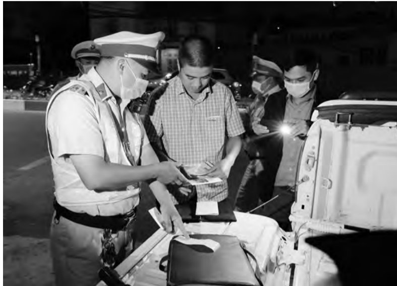
Lực lượng Cảnh sát Giao thông TP Đà Lạt kiểm tra nồng độ cồn tài xế tham gia giao thông.

Trong báo cáo kết quả thực hiện công tác phòng, chống tác hại của rượu, bia năm 2021 của UBND huyện Đơn Dương mới đây, cơ