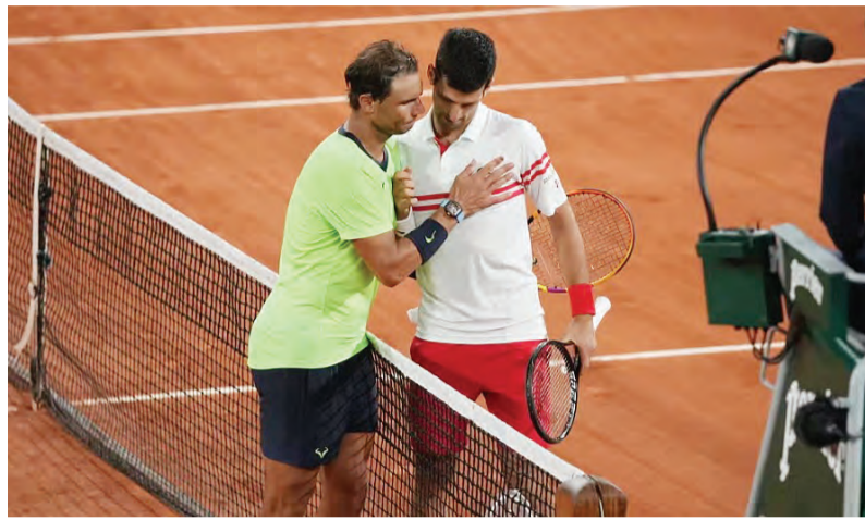
Rafael Nadal và Novak Djokovic từng gặp nhau nhiều lần trên sân đất nện.

Như mọi Grand Slam, Roland Garros năm nay bên cạnh giải chính dành cho các nội dung đơn nam, đơn nữ, đôi nam, đôi nữ và đôi nam nữ còn có giải dành cho lứa tuổi trẻ và giải cho người khuyết tật. Sau 2 năm ảnh hưởng dịch bệnh, lượng người vào sân