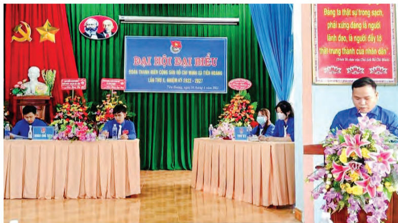
Đến nay, 100% cơ sở đoàn trực thuộc Huyện Đoàn Cát Tiên đã tổ chức thành công đại hội Đoàn cấp cơ sở nhiệm kỳ 2022-2027.

Việc tổ chức thành công đại hội cấp cơ sở thời gian vừa qua là