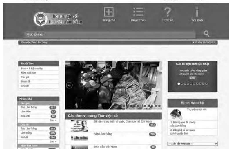
Giao diện thư viện số của Thư viện Lâm Đồng cho phép độc giả đọc sách mọi lúc, mọi nơi.