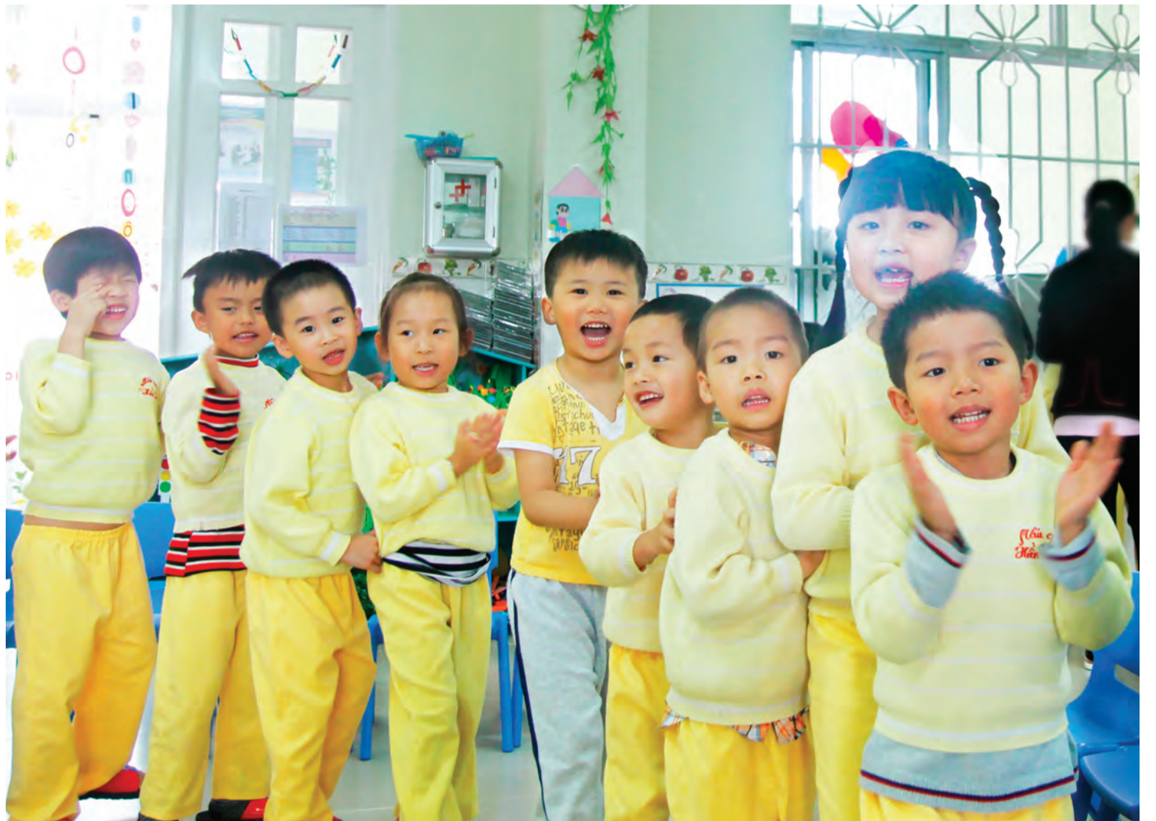
Nụ cười trẻ thơ.