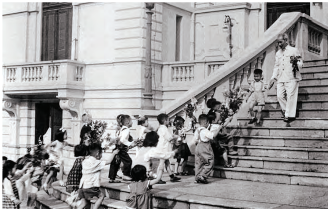
Chủ tịch Hồ Chí Minh với thiếu nhi Việt Nam.

Trong bài thơ “Kêu gọi thiếu nhi” viết năm 1941, Chủ tịch Hồ Chí Minh đã thấu cảm nỗi cực khổ của trẻ em Việt Nam khi đất nước bị cai trị dưới ách thực dân phong kiến: “Chẳng may vận nước gian nan/ Trẻ em cũng phải lấm than cực lòng/ Học hành giáo dục đã không/ Nhà nghèo lại phải làm công cày bừa/ Sức còn yếu tuổi còn thơ/ Mà đã khó nhọc cũng như người già/ Có khi lia mẹ lia cha/ Để làm tôi tớ người ta bên ngoài”. Bởi vậy, trong bức thư gửi thiếu nhi toàn quốc nhân Ngày Quốc tế Thiếu nhi (Báo Sự Thật số 134 ra ngày 1/6/1950), Người đã mong muốn trẻ em Việt Nam đều được no ấm, được vui chơi, được học hành như trẻ em ở Liên Xô.