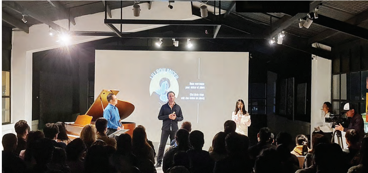
Các nghệ sĩ trao đổi với khán giả sau khi biểu diễn.

Sau hai đêm diễn nhạc cổ điển khá thành công được tổ chức trong vòng 1 tháng qua tại không gian nghệ thuật Phố Bền Đồi, có vẻ như khán giả Đà Lạt và những du khách yêu nghệ thuật đang mong ngóng tiếp tục có những buổi biểu diễn nhạc cổ điển tiếp theo ở không gian này.