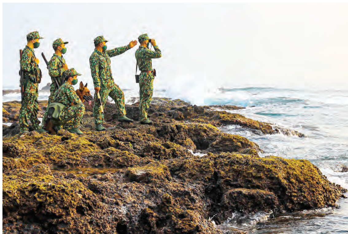
Bộ đội Biên phòng tuần tra bảo vệ vững chắc chủ quyền, an ninh biên giới quốc gia.