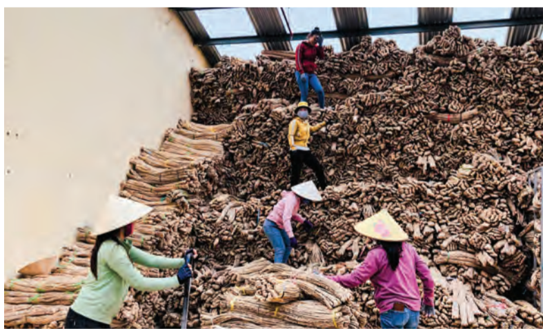
Người lao động của Hado đang sắp xếp kho nguyên liệu.

Một doanh nghiệp đặt giữa vùng đất Đạ Lây, xa vùng xa của huyện Đạ Tẻh đã tổ chức một lễ ra mắt công đoàn cơ sở thật giản dị và trang trọng. Những người công nhân, lao động trở thành đoàn viên công đoàn giữa những cơn mưa đầu mùa và niềm hi vọng vào một tập thể phát triển.