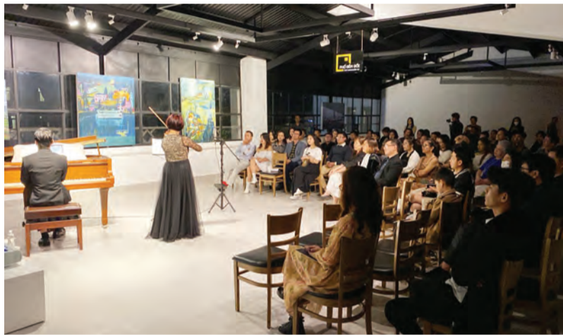
Đêm nhạc cổ điển ở Phố Bền Đồi đang ngày càng hấp dẫn và thu hút sự quan tâm của đông đảo người dân Đà Lạt và du khách.

Phố Bền Đồi đặt ra như vậy thì trong khuôn khổ một chương trình có thời lượng hơn 1 giờ là phù hợp với đa số đối tượng người tham dự mà không cảm thấy khó khăn hay quá tải. Ông cũng đánh giá cao nỗ lực của đơn vị tổ chức và nhận xét rằng, những chương trình âm nhạc như thế này nếu tiếp tục được duy trì với chất lượng tương tự hoặc nâng cao hơn nữa thì chắc chắn sẽ kéo được nhiều người dân đến với không gian này.