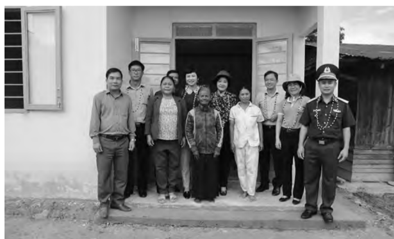
Ban Chỉ đạo 502 của tỉnh và Ban Chỉ đạo 502 của huyện chụp hình lưu niệm với bà con trước căn nhà mới được hỗ trợ xây dựng.

Năm 2022, Ban Chỉ đạo 502 tỉnh đã thống nhất chọn địa bàn xã Đạ Tông và xã Đạ M' Rông, huyện