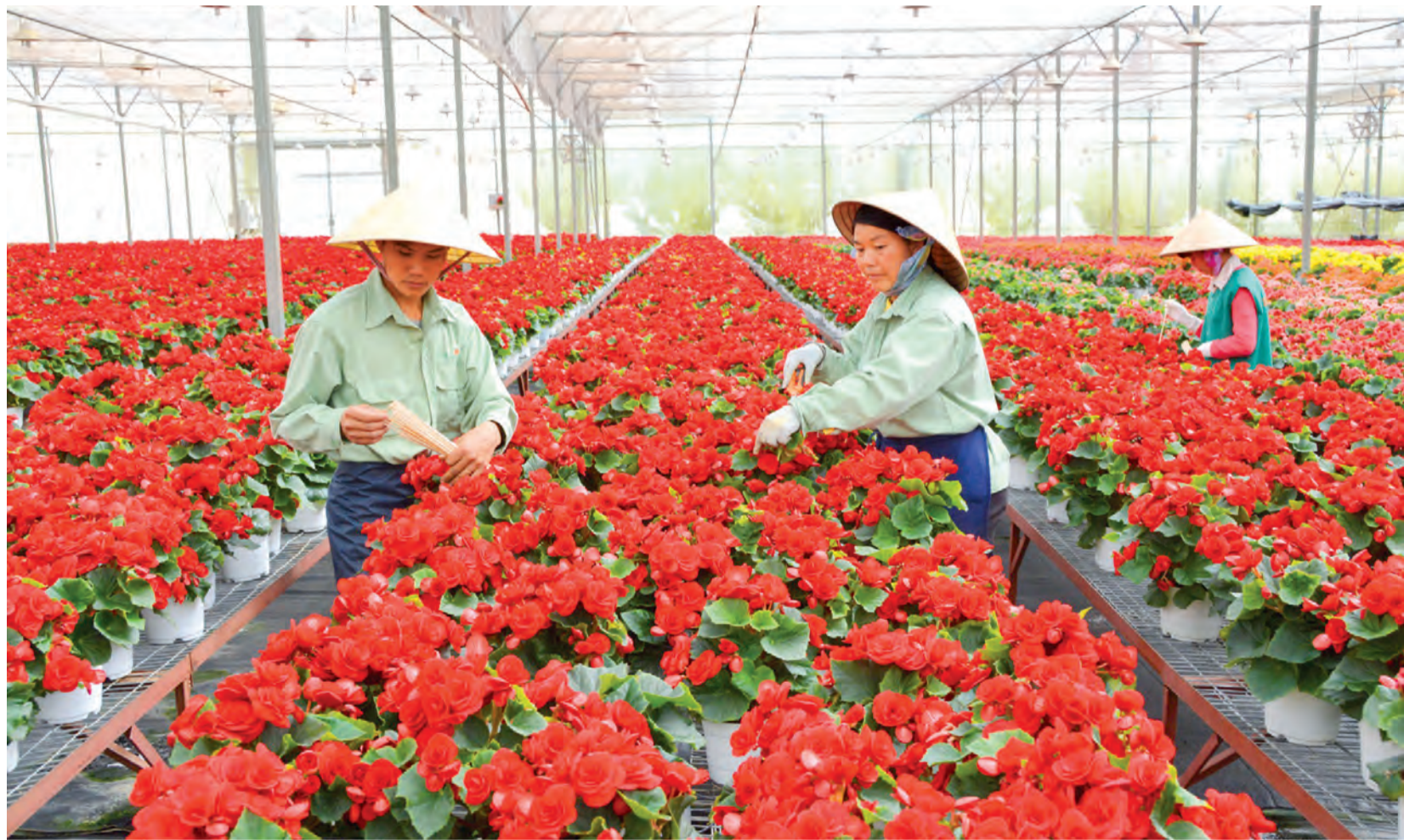
Tiếp tục phát huy lợi thế cạnh tranh theo từng khu vực đặc trưng thổ nhưỡng, khí hậu để chuyển đổi cơ cấu cây trồng phù hợp.