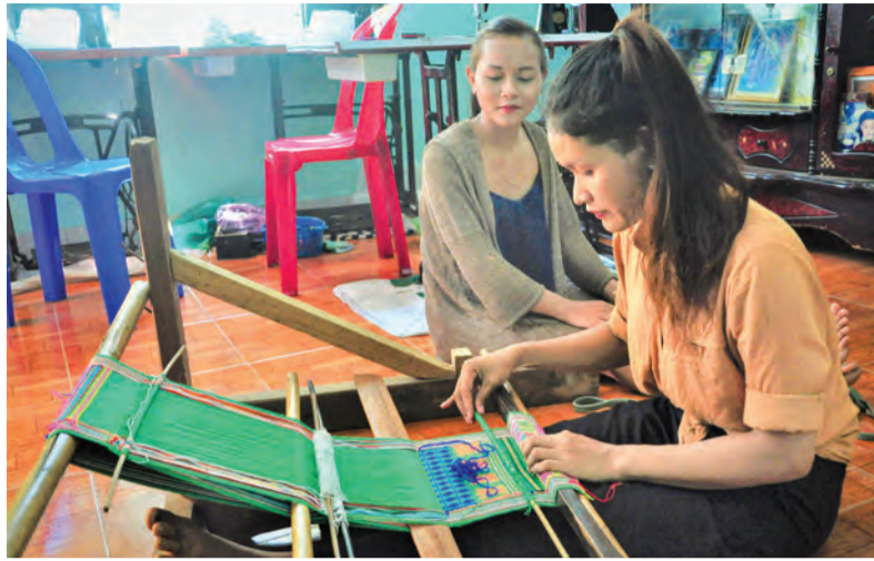
Dệt thổ cẩm tại xã Phước Lộc - Đa Huoai.

Trong năm 2010, K'Úk đã đầu tư hơn 100 triệu đồng để mua bò sữa, làm chuồng, rồi từng bước mua dần các máy móc thiết bị cần thiết cho chăn nuôi bò sữa như mọi người, ông còn trồng cỏ, trồng bắp cho bò ăn. Cho đến nay, chuồng ông đã có trên 10 con bò sữa trong đó có 8