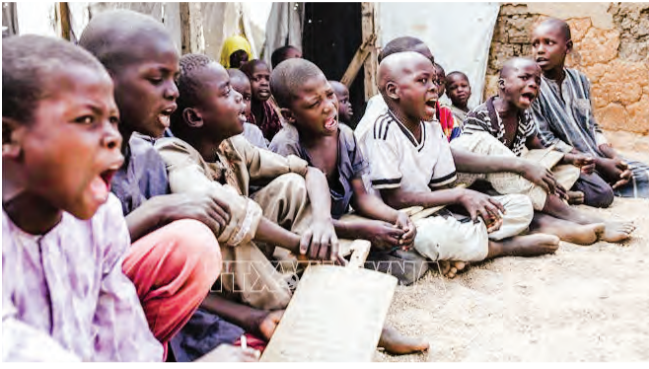
Trẻ em tị nạn tại một trại tạm ở gần Gadala, Cameroon ngày 4/3/2020.

Theo một nghiên cứu được Ngân hàng Thế giới (WB) công bố hôm 31/5, đại dịch COVID-19 đã khiến thêm 400.000 người ở Cameroon rơi vào cảnh bấp bênh, nơi hơn 25% dân số vốn đã sống dưới mức nghèo khổ.