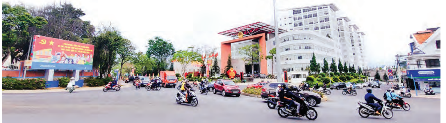
Từ việc xây dựng Khu dân cư tiêu biểu, khu dân cư kiểu mẫu, bộ mặt đô thị ngày càng khang trang hơn.

Lâm Đồng đang tiếp tục triển khai thực hiện tiêu chí mới về xây dựng “Khu dân cư tiêu biểu, khu dân cư kiểu mẫu” (KDCTB, KDCKM) hướng đến nâng cao chất lượng sống cho Nhân dân từ nông thôn đến thành thị. Thời điểm này, các địa phương trong tỉnh đang tăng tốc thi đua và bắt tay vào thực hiện xây dựng đạt các tiêu chí mới, tạo khí thế sôi nổi sau khi dịch COVID-19 đã tạm được kiểm soát, cuộc sống “bình thường mới” đã trở lại, nhằm thúc đẩy KT - XH địa phương ngày càng phát triển.