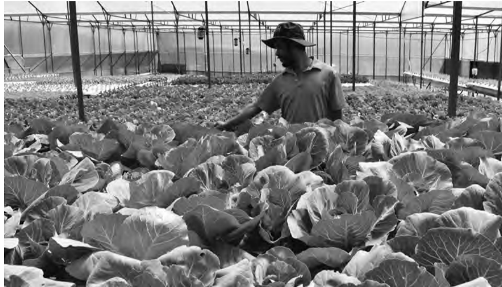
Rau công nghệ cao tiếp tục mở rộng diện tích trên địa bàn Đà Lạt và các vùng phụ cận.

Đến năm 2025, Lâm Đồng phấn đấu đạt tỷ trọng trồng trọt 75-80% trong cơ cấu nội bộ ngành Nông nghiệp, đạt giá trị thu nhập bình quân 220 triệu đồng/ha/năm. Hướng đến mục tiêu này, Lâm Đồng xác định giải pháp cơ cấu ngành Nông nghiệp cần triển khai toàn diện, hiện đại và bền vững.