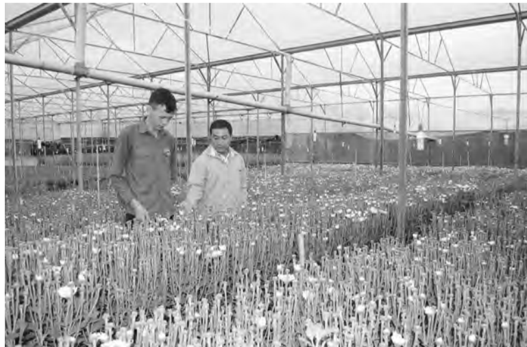
Mô hình khởi nghiệp tiêu biểu của tuổi trẻ Lâm Hà.

Nhiều thanh niên Lâm Hà sau khi rời ghế nhà trường tại địa phương hoặc các giảng đường đại học ở những thành phố lớn đã quyết định lập nghiệp, khởi nghiệp trên quê hương. Từ đó, góp phần tạo công ăn việc làm, thu nhập ổn định, nâng cao đời sống cho đoàn viên, thanh niên cũng như thúc đẩy sự phát triển kinh tế - xã hội, xây dựng nông thôn mới.