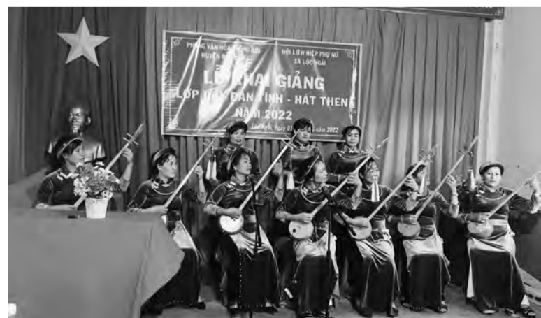
Các học viên học kỹ thuật hát then - đàn tính.

Phòng Văn hoá và Thông tin huyện Bảo Lâm cho biết, Phòng đã phối hợp với Hội Liên hiệp Phụ nữ xã Lộc Ngãi tổ chức lớp hát then - đàn tính cho 35 học viên người Tày - Nùng hiện đang sinh sống trên địa bàn xã Lộc Ngãi.