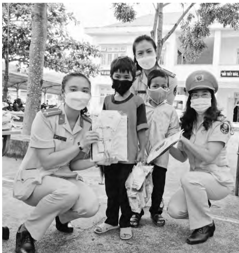
Các cấp Hội Phụ nữ Công an tỉnh Lâm Đồng có nhiều hoạt động hướng về cơ sở.

Song song đó, thực hiện phần việc "Tuyên truyền pháp luật trong học sinh, cán bộ, hội viên phụ nữ tại địa bàn dân cư", Hội Phụ nữ Công an tỉnh đã phối hợp với các đơn vị chức năng tổ chức nhiều đợt tuyên truyền pháp luật về an toàn giao thông, vệ sinh an toàn thực phẩm, về phòng, chống tội phạm liên quan đến ma túy và tin dụng đen, tảo hôn, hôn nhân cận huyết, bạo lực gia đình và trẻ em... tại các thôn, xã vùng sâu, vùng xa, vùng dân tộc thiểu số trên địa bàn tỉnh. Đồng thời, đã chỉ đạo các Hội Phụ nữ cơ sở đẩy mạnh công tác tuyên truyền, góp phần nâng cao nhận thức cho cán bộ, hội viên, học sinh tại các khu dân cư. Thực hiện phần việc "Phụ nữ công an tỉnh Lâm Đồng chung tay phòng, chống dịch COVID-19", Hội Phụ nữ Công an tỉnh đã phối hợp với Đoàn Thanh niên Công an tỉnh pha 600 chai gel và nước rửa tay khô, làm 4.700 tấm chắn giọt bắn, vận động quyên góp các nhu yếu phẩm với số tiền gần 100 triệu đồng hỗ trợ các lực lượng trực tiếp làm nhiệm vụ, các chốt kiểm soát phòng, chống dịch COVID-19, khu cách ly y tế...; đồng thời, phối hợp tổ chức 19 Chuyến xe yêu thương