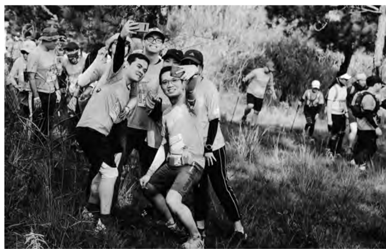
Đà Lạt có một ưu thế rất lớn trong việc tổ chức các giải thể thao trải nghiệm đồng người kết hợp du lịch. Trong ảnh: Các VĐV đến từ khắp nơi trong nước tham gia Giải Siêu Marathon Dalat Ultra Trail.

Cùng du lịch, Đà Lạt còn là trung tâm sản xuất nông nghiệp tiên phong về nông nghiệp công nghệ cao trong cả nước. Hiện, diện tích sản xuất nông nghiệp ứng dụng công nghệ cao trên địa bàn thành phố Đà Lạt