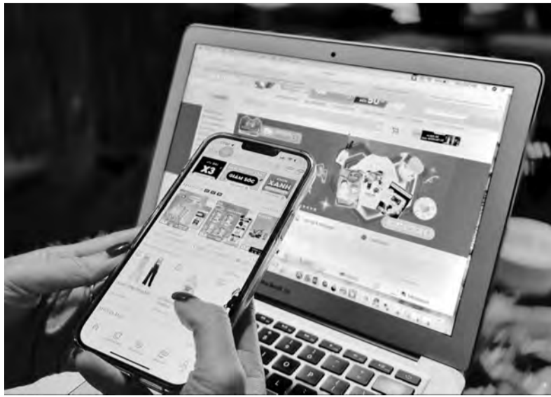
Tỉnh Lâm Đồng sẽ tăng cường công tác quản lý thu thuế đối với hoạt động kinh doanh trên nền tảng số, cũng như các hoạt động kinh doanh thương mại điện tử.

Chủ tịch UBND tỉnh Lâm Đồng-Trần Văn Hiệp vừa có chỉ thị về triển khai công tác quản lý thuế đối với hoạt động kinh doanh trên nền tảng số, cũng như các hoạt động kinh doanh thương mại điện tử trên địa bàn tỉnh Lâm Đồng. Trong đó, yêu cầu các huyện, thành phố, sở, ngành có liên quan phối hợp triển khai các nội dung: Cục thuế tỉnh