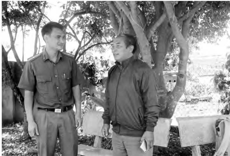
Lực lượng công an thường xuyên trao đổi với người có uy tín để tuyên truyền vận động đoàn viên, hội viên và Nhân dân tham gia bảo vệ ANTO.

Cùng với các phong trào thi đua sôi nổi của địa phương, thời gian qua, Công an huyện Di Linh phối hợp với cấp ủy, chính quyền xã Tân Châu tập trung xây dựng xã là điển hình toàn diện trong Phong trào Toàn dân bảo vệ an ninh Tổ quốc (ANTQ). Qua đó, tình hình an ninh trật tự (ANTT), vi phạm pháp luật của người dân trên địa bàn được giữ vững.