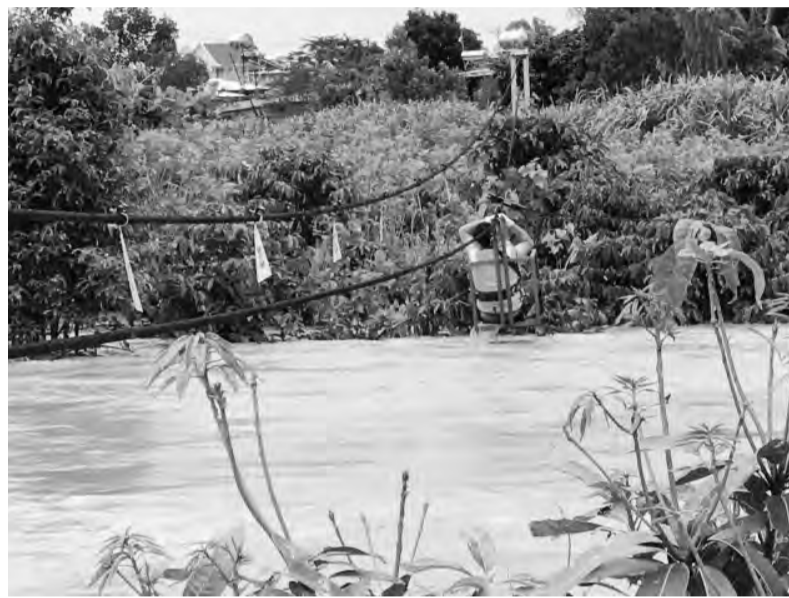
Nước lũ dâng cao trên sông Cam Ly, xã Bình Thạnh (huyện Đức Trọng) vào đợt lũ năm 2021.

Lâm Đồng đang dần bước vào thời kỳ giao mùa nên hiện tượng mưa đá kèm mưa lớn thường xảy ra bất chợt với tần suất tăng dần. Vì vậy, thời gian gần đây, Đài Khí tượng Thủy văn tỉnh Lâm Đồng càng thêm chú ý cảnh báo, túc trực quan trắc 24/24 thông báo lượng mưa lớn về Đài tỉnh và khu vực để kịp thời phát các bản tin cảnh báo mưa lũ đến chính quyền và Nhân dân chủ động phòng, chống thiên tai trong mùa mưa lũ năm nay.