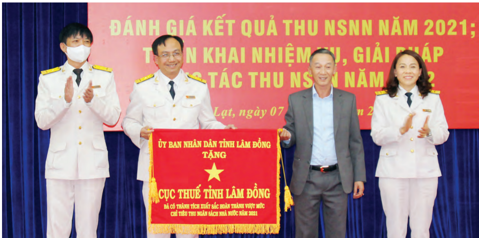
Với những thành tích nổi bật, năm 2021 Cục Thuế tỉnh Lâm Đồng vinh dự nhận Cờ thi đua của UBND tỉnh.