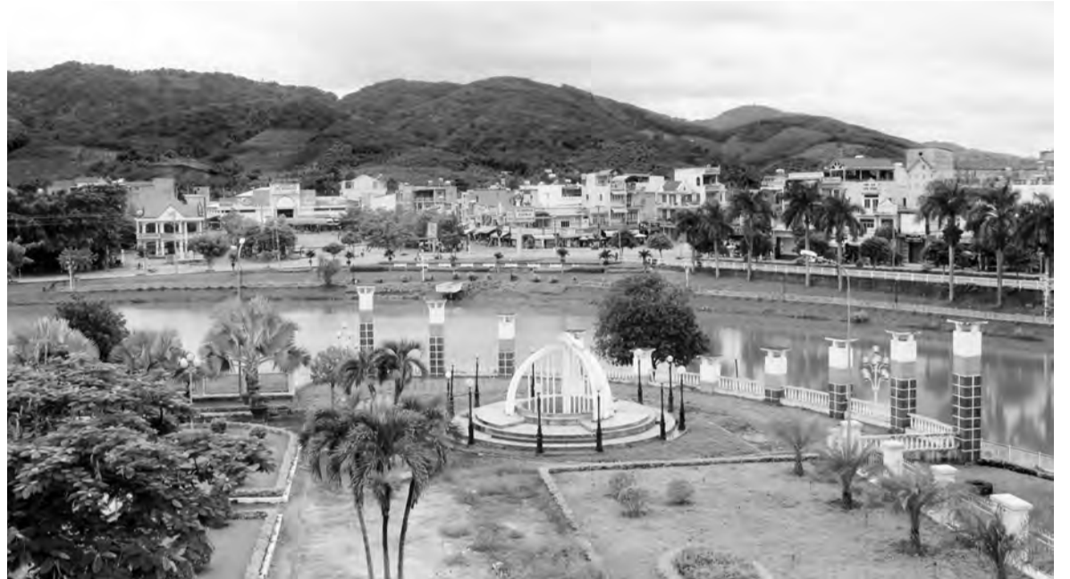
Diện mạo huyện Đạ Huoai đổi thay rõ nét từng ngày nhờ thực hiện đồng bộ các giải pháp.