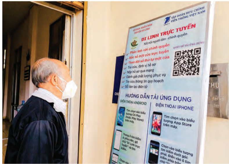
Triển khai kế hoạch phát triển chính quyền số là một trong những nội dung CCHC ở huyện Di Linh.

Công tác kiểm soát thủ tục hành chính (TTHC) trên địa bàn đã được