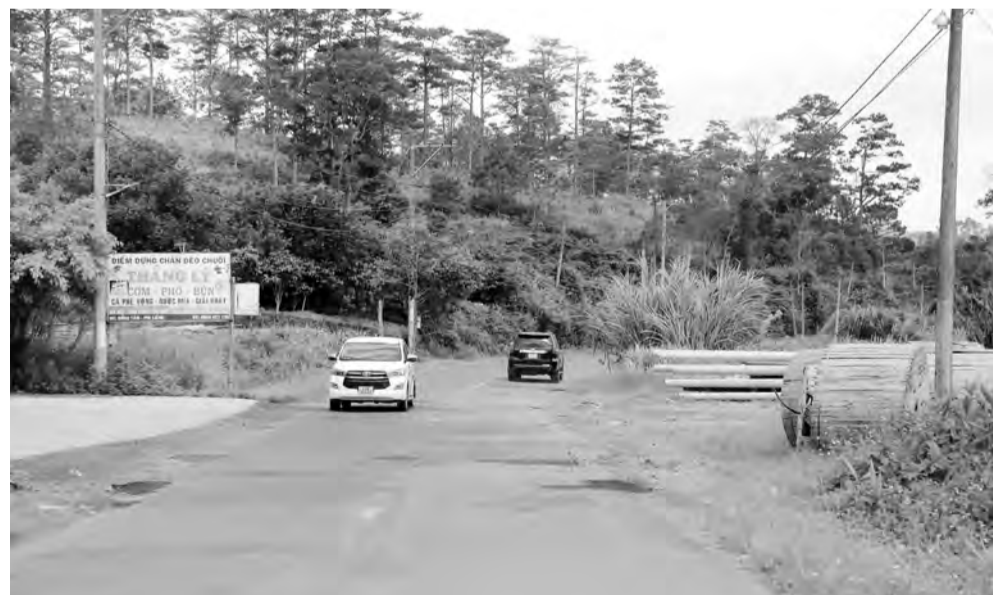
Quốc lộ 27.

Thời gian qua, các ngành chức năng tỉnh Lâm Đồng đã tăng cường nhiều giải pháp, tổ chức kiểm tra, ngăn chặn xe quá tải, tuy nhiên, thực trạng này vẫn tiếp tục tái diễn. Phải chăng, lợi nhuận từ chở quá tải, quá khổ là nguyên nhân khiến các chủ doanh nghiệp vận tải hiện nay bất chấp quy định trong kinh doanh.