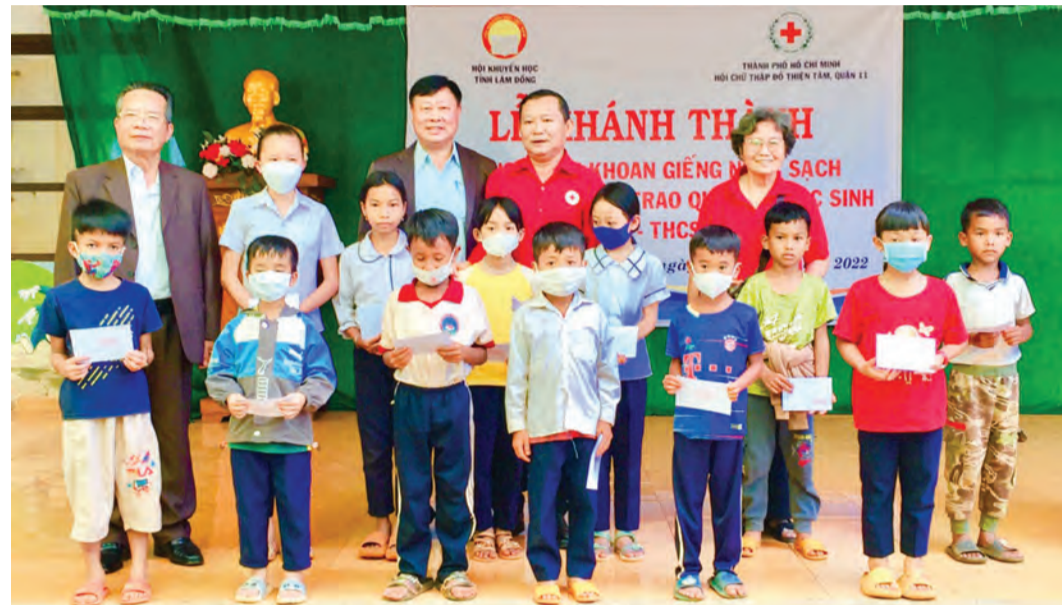
Trao học bổng cho học sinh dân tộc K'Ho xã Gia Bắc, huyện Di Linh.