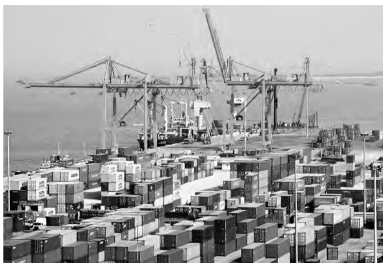
Tăng cường quản lý hoạt động Thương mại điện tử (TMĐT) đối với thương nhân, tổ chức nước ngoài.

phòng đại diện hoặc nội dung ủy quyền phải đảm bảo các trách nhiệm: Phối hợp với cơ quan quản lý nhà nước trong việc ngăn chặn các giao dịch hàng hóa, dịch vụ vi phạm pháp luật Việt Nam; Thực hiện các nghĩa vụ về bảo vệ quyền lợi người tiêu dùng, chất lượng sản phẩm, hàng hóa theo quy định của pháp luật Việt Nam; Thực hiện nghĩa vụ báo cáo theo quy định tại Điều 57 Nghị định 52/2013/NĐ-CP.