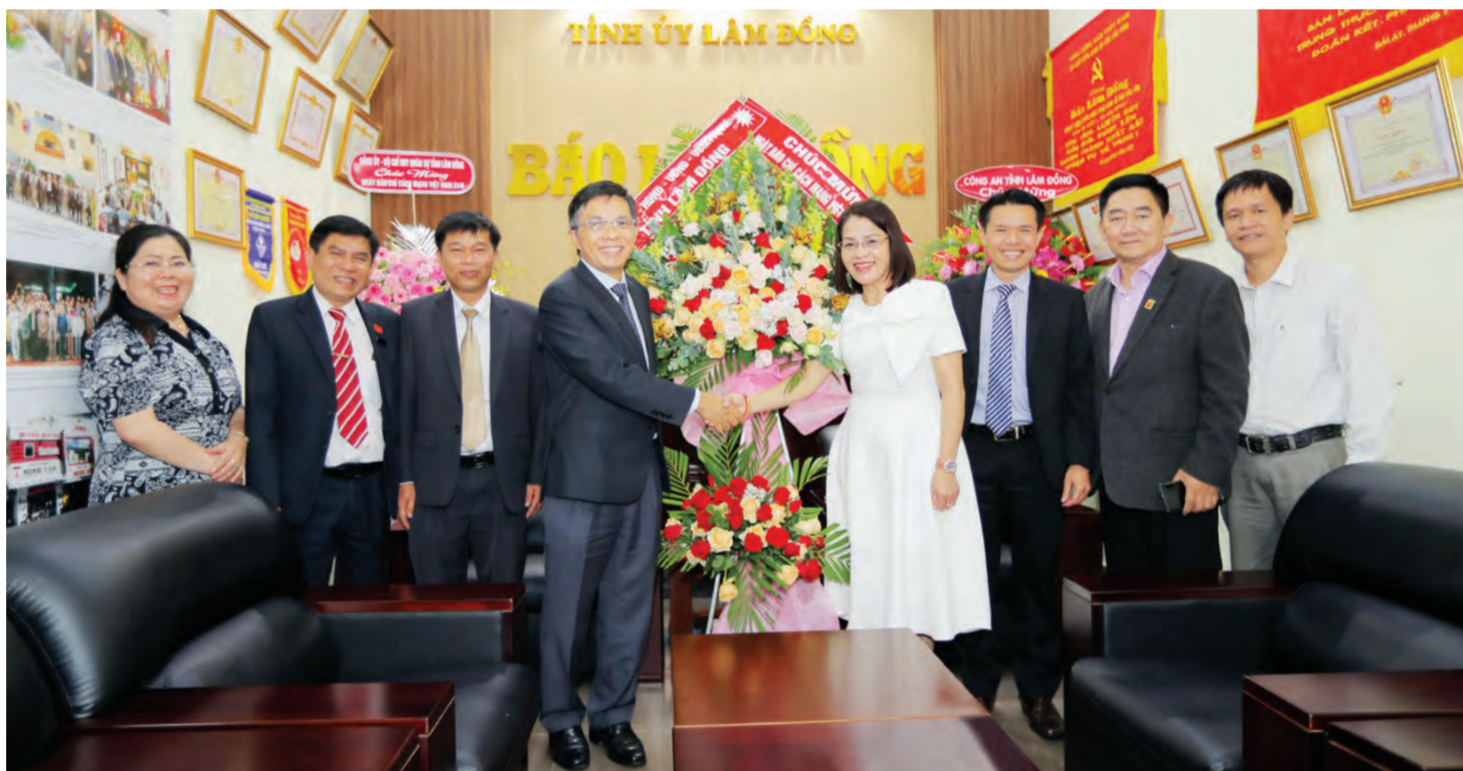
Đóng chí Đặng Trí Dũng - Ủy viên Ban Thường vụ Tỉnh ủy, Phó Chủ tịch UBND tỉnh chúc mừng Báo Lâm Đồng nhân Kỷ niệm 97 năm Ngày Báo chí Cách mạng Việt Nam. TRANG 2