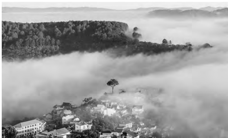
Lâm Đồng luôn là một trong những điểm thu hút hàng đầu về đầu tư, kinh doanh bất động sản..

Đặc biệt, Cục Thuế cũng đưa ra "Cảnh báo một số hành vi vi phạm