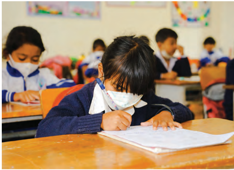
Học sinh Trường Tiểu học Liên Đám, Di Linh làm bài kiểm tra học kỳ II, năm học 2021-2022.

Để các mục tiêu nêu trên thực sự đạt hiệu quả, cần nhiều điều kiện.