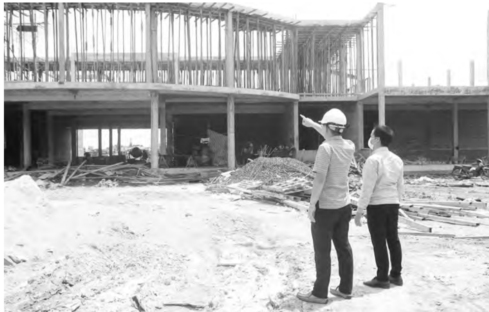
Công trình Nhà thiếu nhi huyện Bảo Lâm thi công vượt tiến độ đề ra.

Ghi nhận tại công trình xây dựng đường từ xã B' Lát - huyện Bảo Lâm đi xã Đam Bristh thành phố Bảo Lộc, công trình có tổng mức