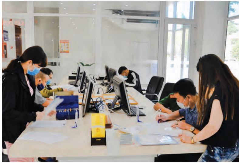
Người dân đang chờ làm thủ tục hành chính tại Trung tâm Phục vụ Hành chính công tỉnh Lâm Đồng tại Đà Lạt.

Kế tiếp là Sở Văn hóa - Thể thao và Du lịch, đứng ba (đạt 97,46%, tụt hạng từ hạng nhất năm trước xuống hạng ba năm nay); Sở Khoa học Công nghệ, đứng tư (97,17%, tăng lên 1 bậc so với năm trước); Sở Thông tin - Truyền thông, đứng 5 (96,79%, tụt 3 bậc); Sở Giáo dục Đào tạo, đứng 6 (96,24%, tăng 2 bậc); Sở Nội vụ, đứng 7 (96,07%,