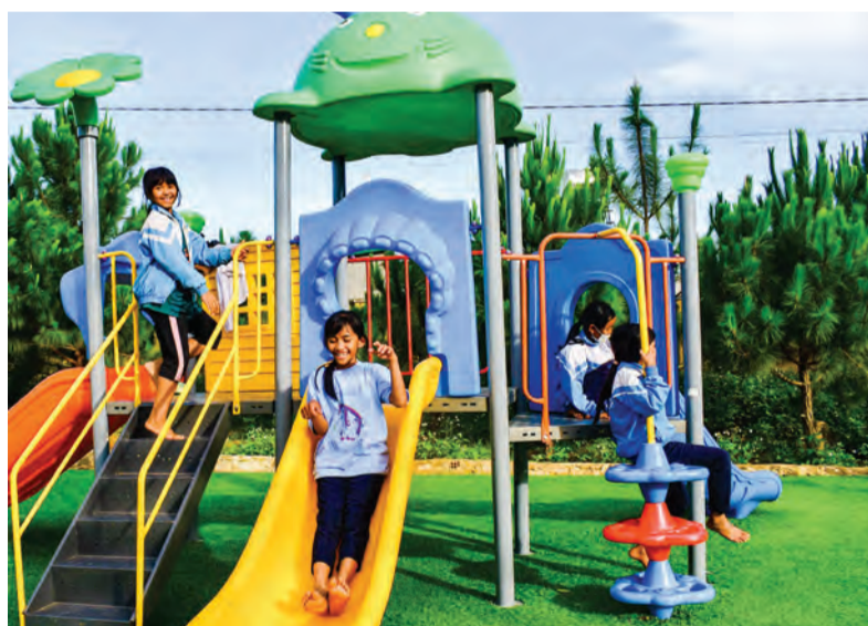
Cảnh quan sư phạm được trường quan tâm đầu tư, tạo môi trường học tập thoải mái cho học sinh.

Trường tập trung phát triển các chuyên đề nhằm đổi mới phương pháp, hình thức dạy học. Đặc biệt chú trọng phát hiện và bồi dưỡng năng lực, năng khiếu học sinh. Lồng ghép các phương pháp mới như “Bàn tay nặn bột”, tiết học thư viện, thảo luận nhóm. Để các em mạnh dạn phát biểu ý kiến, tranh luận học hỏi từ bạn bè, trường bố trí nhiều buổi học kỹ năng mềm, kỹ năng sống... Ngoài ra, để tạo sự đồng đều trong chất lượng giáo dục, những học sinh có hoàn cảnh khó khăn, học lực yếu, có thể theo kịp các bạn từ các buổi phụ đạo do trường tổ chức.