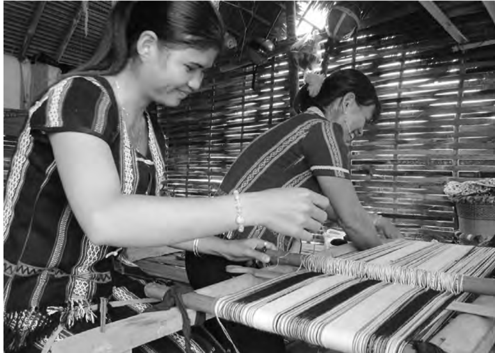
Tỉnh Lâm Đồng tiếp tục thực hiện nhiều giải pháp để phát triển vùng đồng bào DTTS.

Phát triển vùng đồng bào dân tộc thiểu số (DTTS) là một trong những vấn đề trọng tâm được tỉnh Lâm Đồng tập trung thực hiện suốt thời gian qua. Sự đổi thay trong vùng đồng bào DTTS là điều có thể thấy rõ. Tuy nhiên, trong quá trình phát triển chung của xã hội, vẫn còn nhiều vấn đề trong phát triển vùng đồng bào DTTS được đặt ra, đòi hỏi Lâm Đồng cần tập trung thực hiện.