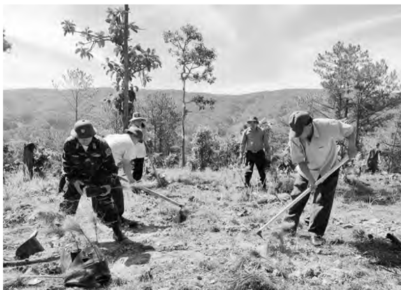
Lãnh đạo huyện Đức Trọng và các lực lượng ra quân trồng 1 ha rừng tại Tiểu khu 267.

Thực hiện Nghị quyết số 10 ngày 17/2/2022 của Ban Thường vụ Tỉnh ủy về tăng cường sự lãnh đạo của Đảng trong công tác quản lý, bảo vệ và phát triển rừng trên địa bàn tỉnh Lâm Đồng giai đoạn 2021 - 2025, định hướng đến năm 2030, huyện Đức Trọng đã tích cực tuyên truyền người dân nâng cao ý thức bảo vệ rừng, duy trì tỉ lệ che phủ rừng, phát triển sản xuất, làm giàu từ rừng một cách bền vững.