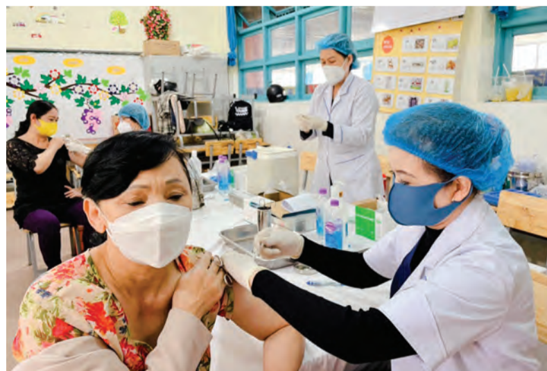
Tiêm vắc xin phòng COVID-19 tại TP Đà Lạt.

Thời gian qua, Lâm Đồng được cấp 1.220.280 liều vắc xin Vero Cell và đã tiêm mũi 1 cho 614.442 người, mũi 2 là 610.572 người, do đó số lượng người tiêm liều bổ sung rất lớn, toàn tỉnh đã tiêm liều bổ sung cho hơn nửa triệu người, tuy nhiên khi tiếp tục tiêm liều nhắc lại lần 1 (mũi 4) thì người dân ngại không muốn tiêm. Hơn nữa, số đối tượng này đang trong độ tuổi lao động (18