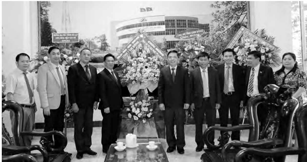
Lãnh đạo tỉnh thăm, chúc mừng Đài Phát thanh - Truyền hình Lâm Đồng.

Tại Báo Lâm Đồng, Phó Chủ tịch UBND tỉnh Đặng Trí Dũng đã gửi lời chúc mừng tới tập thể lãnh đạo, cán bộ, phóng viên, người lao động Báo Lâm Đồng. Đồng thời, ghi nhận, đánh giá cao hoạt động của Báo Lâm Đồng trong việc thông tin tuyên truyền các chủ trương, đường lối của Đảng và chính sách, pháp luật của Nhà nước đến với các tầng lớp Nhân dân. Những đổi mới trong hoạt động của Báo Lâm Đồng trong thời gian gần đây cũng đã tạo ra những hiệu quả tích cực, ngày càng tạo dựng được lòng tin đối với các cơ quan, đơn vị và các tầng lớp Nhân dân. Chính sự sâu