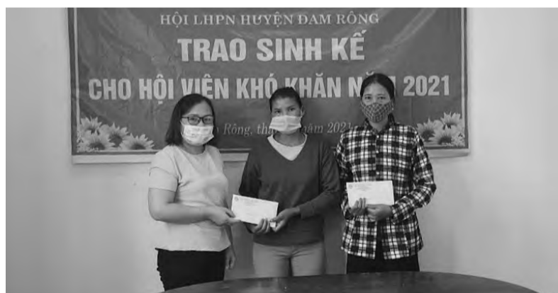
Để hỗ trợ chị em hội viên phát triển kinh tế, Hội LHPN huyện Đam Rông đã tích cực trao sinh kế cho hội viên.

Trong giai đoạn 2016 - 2021, Hội LHPN huyện Đam Rông đã trao 16 sinh kế cho hội viên khó khăn trị giá 80 triệu đồng từ nguồn đóng góp của cán bộ, hội viên, phụ nữ. Đồng thời, hưởng ứng Cuộc vận động "Hỗ trợ 90 phương tiện sinh kế cho hội viên phụ nữ nghèo, phụ nữ dân tộc thiểu