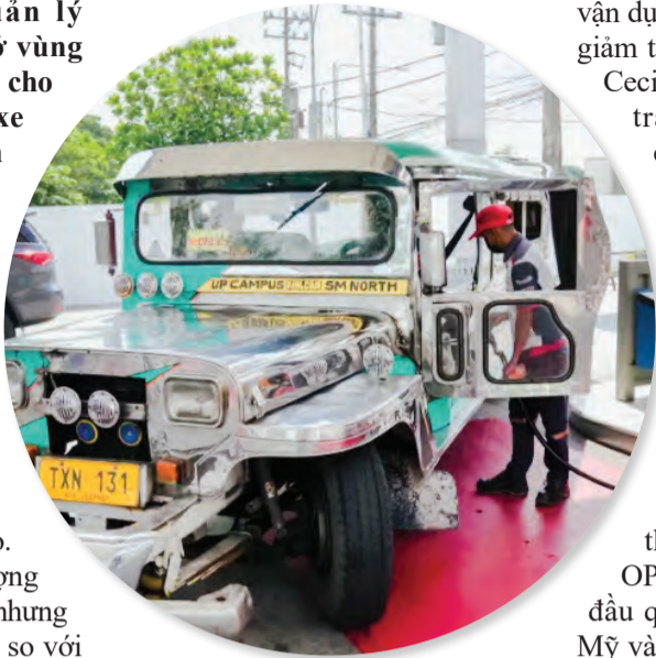
Một tài xế xe jeepney đổ xăng ở thành phố Quezon, Philippines ngày 20/6/2022.

Tại một trạm xăng gần sân bay Cologne, Đức, ông Bernd Mueller nhìn chăm chăm vào các con số vùn vụt chạy trên bảng điện tử: 22 euro, 23 euro, 24 euro. Những con số cho thấy lượng xăng đổ vào bình đang tăng, nhưng với tốc độ chậm hơn nhiều so với trước. Ông cảm thấy như bị móc túi. Cụ ông 80 tuổi cho biết: "Tôi sẽ bỏ xe ô tô vào tháng 10, tháng 11 này".