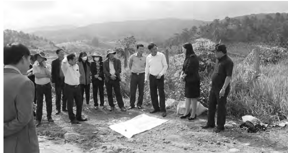
Đoàn giám sát UBMTTQ đi khảo sát thực tế tại khu vực triển khai Dự án Hồ Ta Hoét.