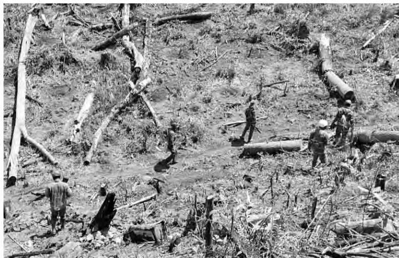
Ban Quản lý rừng Phi Liêng tổ chức truy quét, giải tỏa các điểm nóng về lấn chiếm đất lâm nghiệp trên địa bàn.

Những năm qua, tình trạng lấn chiếm đất lâm nghiệp để sản xuất nông nghiệp diễn ra khá nhức nhối trên lâm phần do Ban Quản lý rừng Phi Liêng quản lý. Hiện, đơn vị đã có nhiều nỗ lực ngăn chặn, xử lý giải tỏa, thu hồi đất để trồng lại rừng.