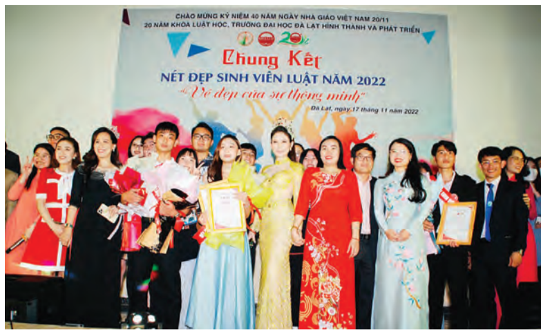
Trao giải cho các thí sinh.

Khoa Luật học, Trường Đại học Đà Lạt vừa tổ chức vòng chung kết Cuộc thi Nét đẹp sinh viên Luật lần thứ nhất với chủ đề "Vì đẹp của sự thông minh". Đây là một sự kiện trong chuỗi các hoạt động kỷ niệm 40 năm Ngày Nhà giáo Việt Nam; 20 năm Khoa Luật học, Trường Đại học