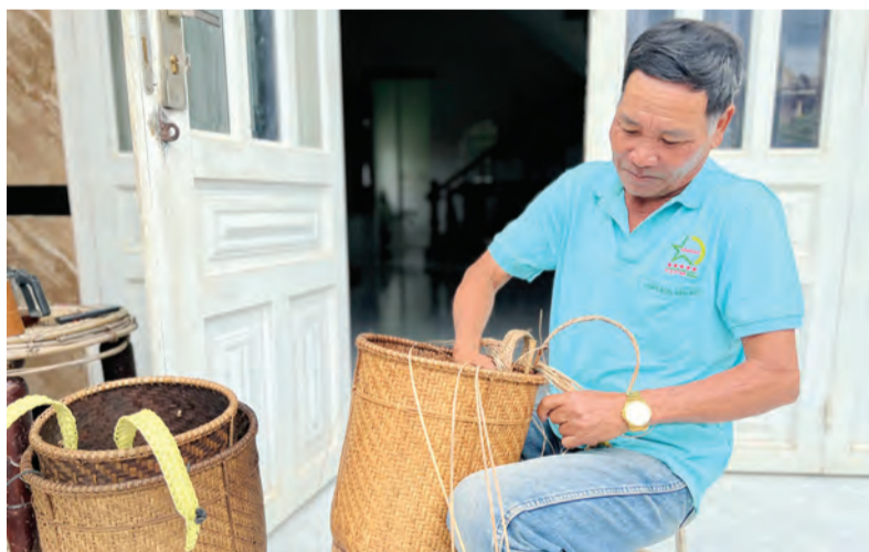
Chương trình mục tiêu quốc gia Phát triển kinh tế - xã hội vùng đồng bào DTTS đang được triển khai có hiệu quả trên địa bàn huyện Di Linh.

Hiện tại, trong thực hiện Chương trình mục tiêu quốc gia xây dựng Nông thôn mới, đa số các tiêu chí đều đạt và vượt kế hoạch đề ra. Kết cấu hạ tầng kinh tế - xã hội nông thôn đang từng bước phát triển đồng bộ. Trong năm, các đơn vị, địa phương đã tiến hành sửa chữa, xây dựng mới trên 60 km đường giao thông nông thôn với tổng vốn đầu tư trên 87 tỷ đồng. Về thủy lợi, tiếp tục hoàn thành các công trình chuyên tiếp và nạo