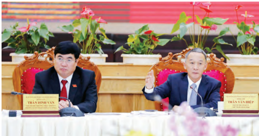
Phó Bí thư Thường trực Tỉnh ủy và Chủ tịch UBND tỉnh chủ trì hội nghị.