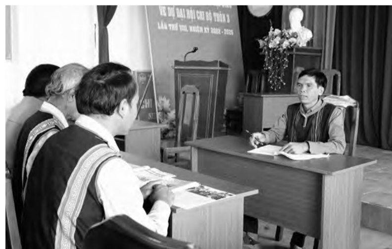
Đảng viên Chi bộ Thôn 3, xã Tân Thượng luôn đi đầu, làm gương trong mọi việc để tạo sự đồng thuận trong Nhân dân.

Cùng với việc lãnh đạo thực hiện nhiệm vụ phát triển kinh tế - xã hội, Đảng ủy xã Tân Thượng (huyện Di Linh) đặc biệt chú trọng đến công tác xây dựng, chỉnh đốn Đảng trong vùng đồng bào dân tộc thiểu số (DTTS). Xác định mỗi đảng viên phải là một tấm gương đi đầu trong mọi phong trào, hoạt động, tạo nên sức mạnh nội tại của địa phương.