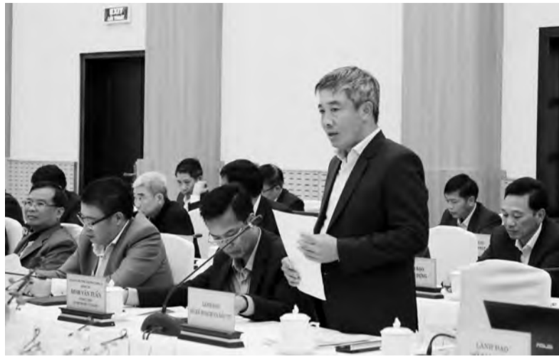
Giám đốc Sở Kế hoạch và Đầu tư báo cáo tại hội nghị.

Trong bối cảnh đó, tỉnh Lâm Đồng tiếp tục bám sát Nghị quyết Đại hội Đảng bộ tỉnh lần thứ XI, và chủ đề của Tỉnh ủy năm 2023 là: "Quyết liệt, đồng bộ, đột phá, hiệu quả; kỷ cương, nêu gương, bản lĩnh, trách nhiệm, quyết tâm thực hiện thắng lợi Nghị quyết Đại hội Đảng bộ tỉnh lần thứ XI"; cụ thể hóa các quan điểm, mục tiêu và nhiệm vụ tại Nghị quyết số 23-NQ/TW ngày 06/10/2022 của Bộ Chính trị về phương hướng phát triển kinh tế - xã hội, bảo đảm quốc phòng, an ninh vùng Tây Nguyên đến năm 2030, tầm nhìn đến năm 2045 và các nghị quyết của Quốc hội, Chính phủ, Tỉnh ủy và HĐND tỉnh để hành động quyết liệt, hiệu quả và phấn đấu thực hiện thành công, toàn diện các mục