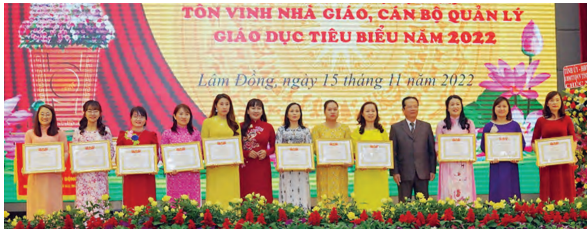
Những nhà giáo tiêu biểu của Lâm Đồng năm học 2021-2022.

Với sự nghiệp GDĐT tỉnh Lâm Đồng, thời gian qua đã đạt được nhiều kết quả quan trọng. Quy mô, mạng lưới trường lớp, đội ngũ nhà giáo và cán bộ quản lý giáo dục (QLGD) được sắp xếp, kiện toàn theo hướng hợp lý, tinh gọn, hiệu lực, hiệu quả; cơ sở vật chất trường lớp được củng cố và tăng cường, số trường đạt chuẩn quốc gia đến nay là 496/607 trường (đạt tỷ lệ 81,7%). Chất lượng giáo dục có chuyển biến tích cực, các chỉ số về phát triển giáo dục đạt khá; công