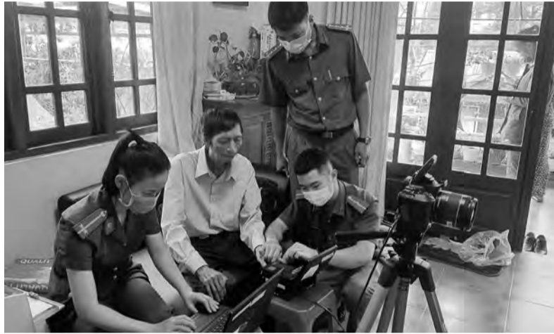
Công an TP Đà Lạt đến làm căn cước công dân tại nhà cho người già yếu không đi lại được.

Thời gian qua, Công an tỉnh Lâm Đồng đã đẩy mạnh công tác tuyên truyền, phổ biến, giáo dục pháp luật (PBGDPL) trong phòng ngừa vi phạm pháp luật và tội phạm. Qua đó, góp phần nâng cao nhận thức, ý thức trách nhiệm của các cấp, các ngành và người dân trong công tác phòng, chống tội phạm, thực hiện có hiệu quả Phong trào Toàn dân bảo vệ an ninh Tổ quốc.