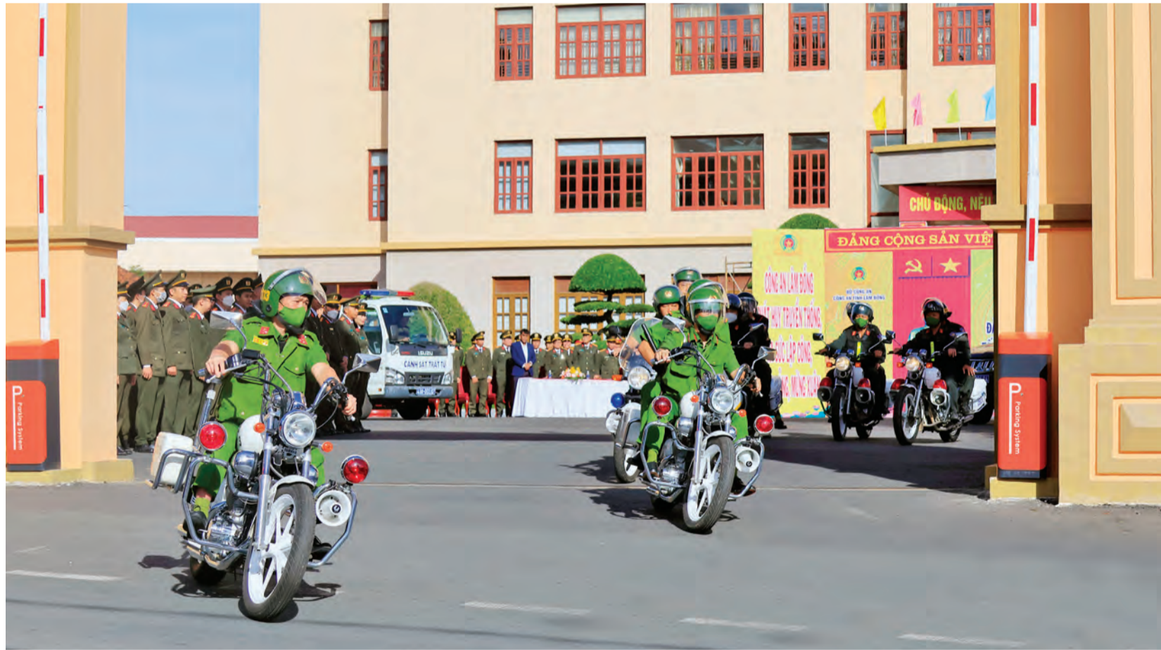
Công an tỉnh ra quân đợt cao điểm đảm bảo an ninh, an toàn Festival Hoa Đà Lạt năm 2022, Tết Dương lịch và Tết Nguyên đán Quý Mão.