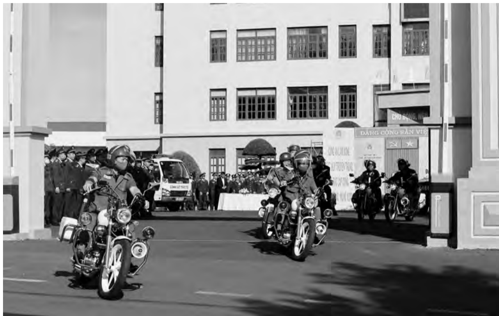
Công an tỉnh ra quân đợt cao điểm đảm bảo an ninh, an toàn Festival Hoa Đà Lạt năm 2022, Tết Dương lịch và Tết Nguyên đán Quý Mão.

Theo đó, từ nhiều tuần qua, Công an tỉnh Lâm Đồng đã tăng cường triển khai các biện pháp nghiệp vụ, cùng với những kế hoạch chi tiết, cụ thể nhằm đảm bảo công tác an ninh trật tự, đặc biệt là khoảng thời gian trước, trong và sau Festival Hoa Đà Lạt. Tăng cường phối hợp theo dõi sự di chuyển của các băng nhóm tội phạm để có hướng phòng ngừa ngay từ đầu, khoanh vùng những đối tượng có nguy cơ thực hiện hành vi phạm tội cao, siết chặt công tác quản lý lưu trú, đặc