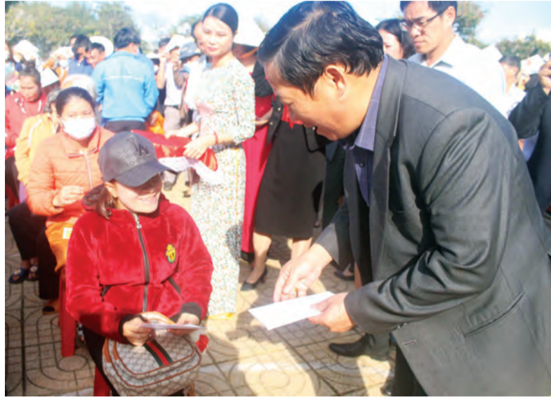
Lãnh đạo Sở Lao động - Thương binh và Xã hội trao quà cho phụ nữ khuyết tật tiêu biểu thuộc hộ nghèo, cận nghèo huyện Lâm Hà.

15 năm qua, chính sách chăm lo, bảo vệ bà mẹ, trẻ em, xây dựng gia đình ấm no, bình đẳng, tiến bộ, hạnh phúc đã đạt được những kết quả nhất định, tạo điều kiện cho sự phát triển toàn diện của phụ nữ, nhất là phụ nữ vùng nông thôn, vùng đồng bào dân tộc thiểu số. Các hoạt động hỗ trợ phụ nữ phát triển kinh tế, hỗ trợ vay vốn, dạy nghề, tạo việc làm, giáo dục đào tạo, chăm sóc sức khỏe, xây dựng gia đình hạnh phúc, ngày càng phát huy hiệu quả. Điều này đã góp phần vào việc thực hiện có hiệu quả công tác BĐG, vì sự tiến bộ của phụ nữ, tạo điều kiện phát huy mọi tiềm năng, trí tuệ của phụ nữ vào sự phát triển chung của đất nước. Vai trò, vị trí của phụ nữ ngày càng được