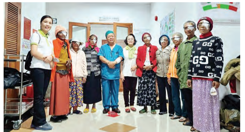
Hội Bảo trợ Bệnh nhân nghèo, Người tàn tật và Trẻ mồ côi Lâm Đồng chúc mừng các bệnh nhân sau khi được phẫu thuật thay thủy tinh thể nhân tạo miễn phí.

Hội Bảo trợ Bệnh nhân nghèo, Người tàn tật và Trẻ mồ côi tỉnh Lâm Đồng vừa phối hợp với đoàn bác sĩ Nhân Ái - Bệnh viện Mắt và Bệnh viện Nguyễn Trãi (TP Hồ Chí Minh) tổ chức khám sàng lọc các bệnh về mắt cho hơn 1.100 người và phẫu thuật cắt mộng thịt và thay thủy tinh thể nhân tạo theo phương pháp phaco hiện đại cho hơn 400 trường hợp. Chương trình được tổ chức tại Bệnh viện Đa khoa II