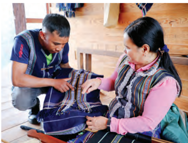
Tìm hiểu về nghề dệt thổ cẩm của người dân tộc thiểu số K'Ho.