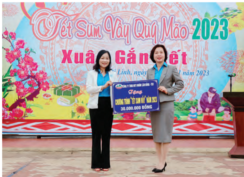
LĐLĐ tỉnh nhận tài trợ từ Công ty Nhôm Lâm Đồng.