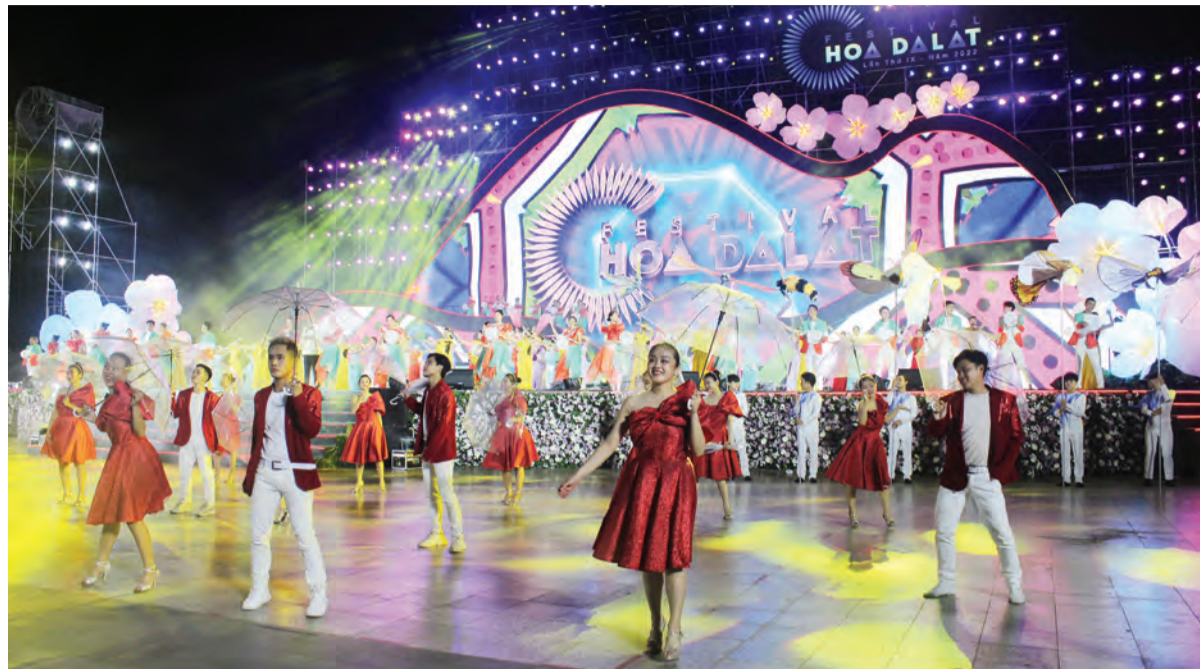
Đêm hội khai mạc Festival Hoa để lại dấu ấn đẹp.

Gây ấn tượng mạnh nhất là Không gian triển lãm Thiên đường Tây Nguyên và con đường di sản bên hồ Xuân Hương. Tinh tế, sâu sắc về ý tưởng, đẹp về hình thức, là sự kết hợp tuyệt vời của văn hóa các dân tộc anh em Nam và Bắc Tây Nguyên. Ra mắt ngay từ đầu tháng 11 với sân khấu nổi và sân catwalk trên mặt hồ cùng những cây khô mùa đông, nhà sàn ẩn chứa những giá trị văn hóa truyền thống đã