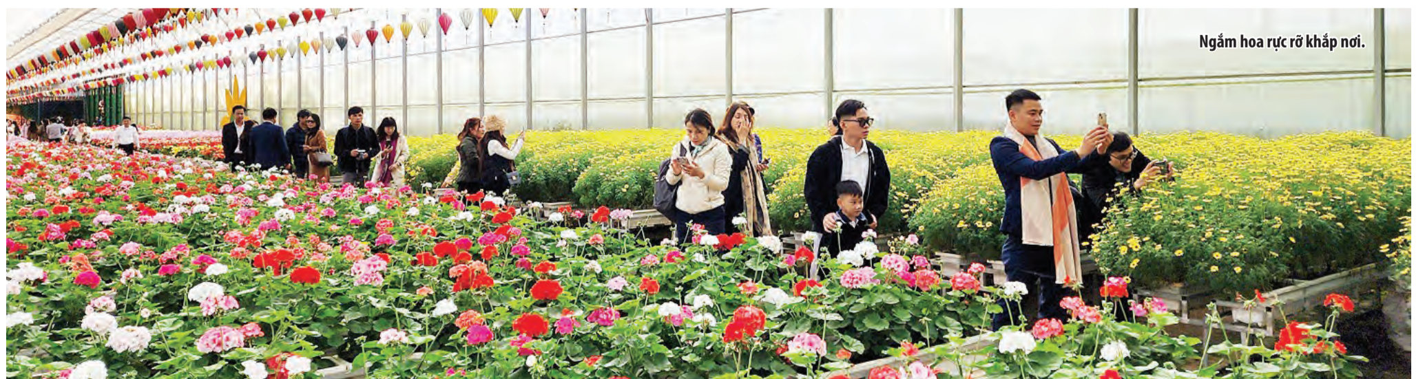
Ngắm hoa rực rỡ khắp nơi.

Festival Hoa khép lại, mở ra một năm mới rực rỡ sắc xuân. “Đà Lạt - Thành phố bốn mùa hoa” sẽ không chỉ là một lễ hội ngập tràn sắc hoa, những khoảnh khắc tuyệt đẹp, mà còn là một thành phố tươi đẹp bốn mùa động mãi trong lòng du khách.