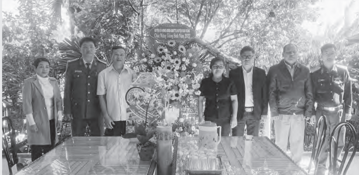
Huyện Đam Rông chú trọng phát huy tốt vai trò của đội ngũ chức sắc, chức việc trong các tôn giáo và người uy tín trong vùng đồng bào DTTS.

hiện sự quan tâm của cấp ủy, chính quyền đối với các tổ chức tôn giáo; đồng thời cũng là dịp để lãnh đạo các cấp kịp thời tìm hiểu tâm tư, nguyện vọng của chức sắc, chức việc và bà con giáo dân trong việc giải quyết dứt điểm những vấn đề phát sinh từ cơ sở.