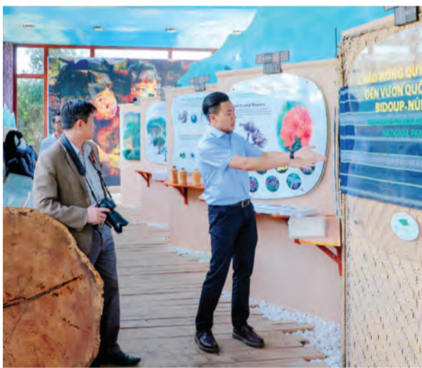
Nhân viên Vườn Quốc gia giới thiệu về sự liên kết và phụ thuộc lẫn nhau giữa con người và thiên nhiên.