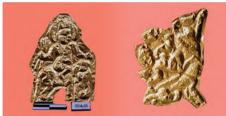
Một số ảnh hiện vật vàng có thể hiện tiểu tượng các vị thần và văn khắc phát hiện tại Di tích khảo cổ Cát Tiên.