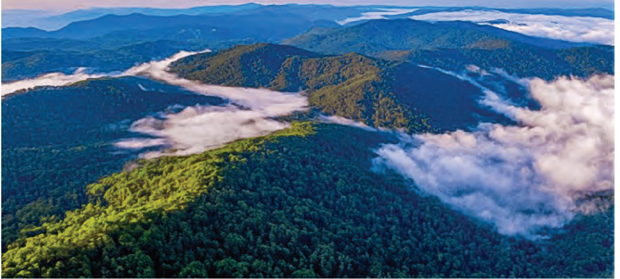
Vườn Quốc gia Bidoup - Núi Bà có diện tích khoảng 70.000 ha.