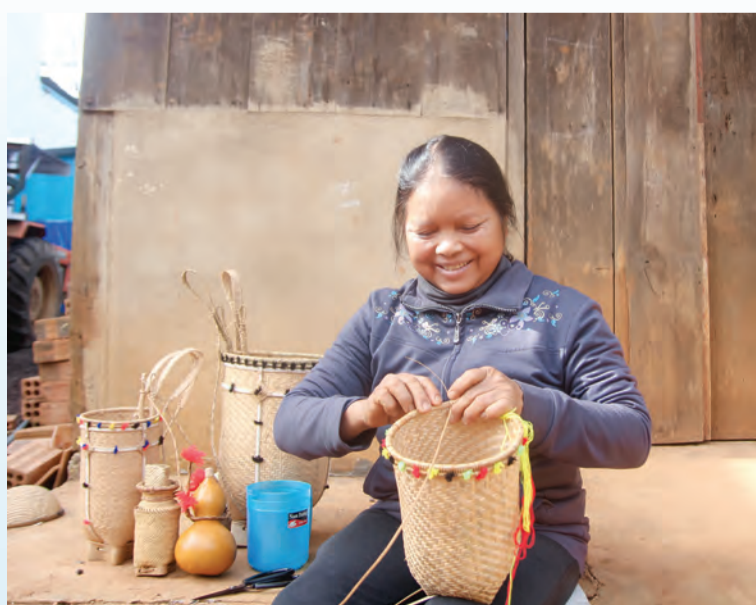
Người dân thôn Duệ giữ gìn nghề đan lát truyền thống.