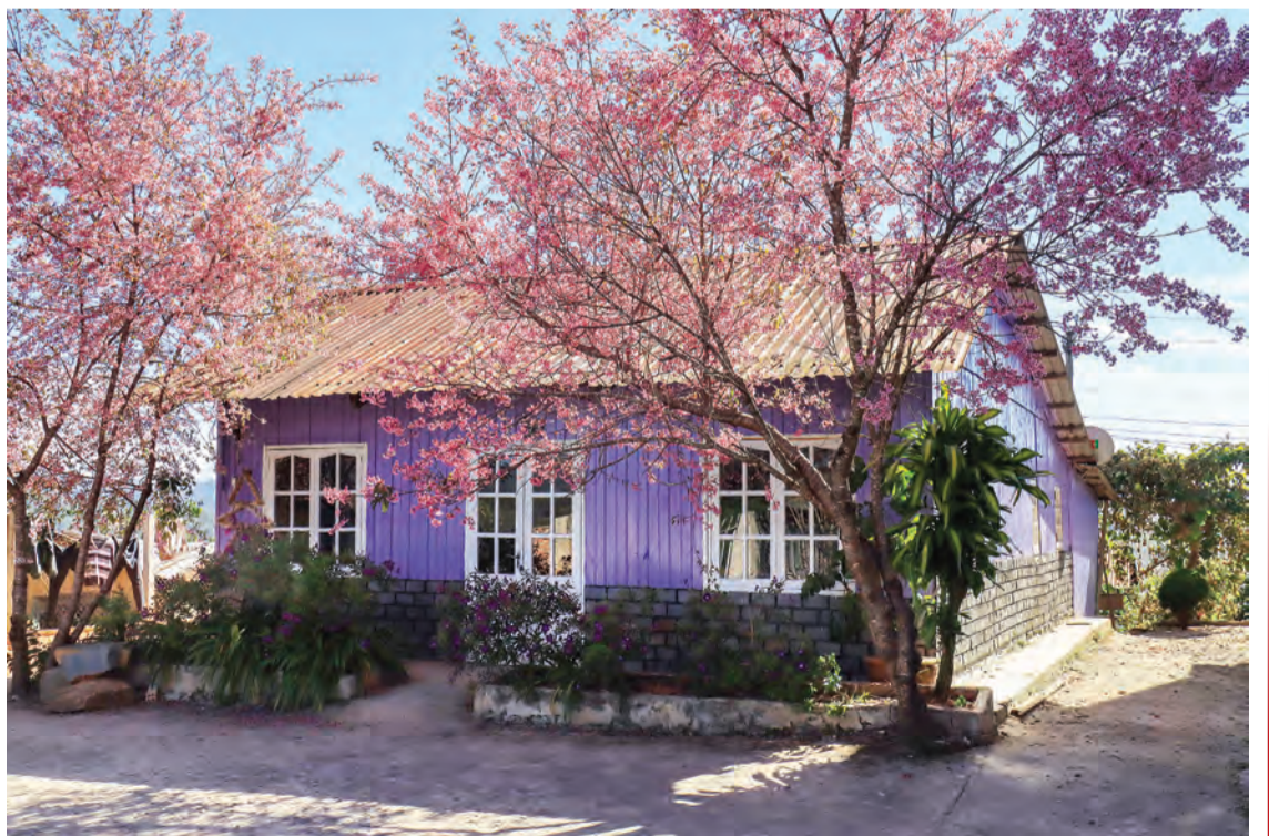
Ngôi nhà màu tím.