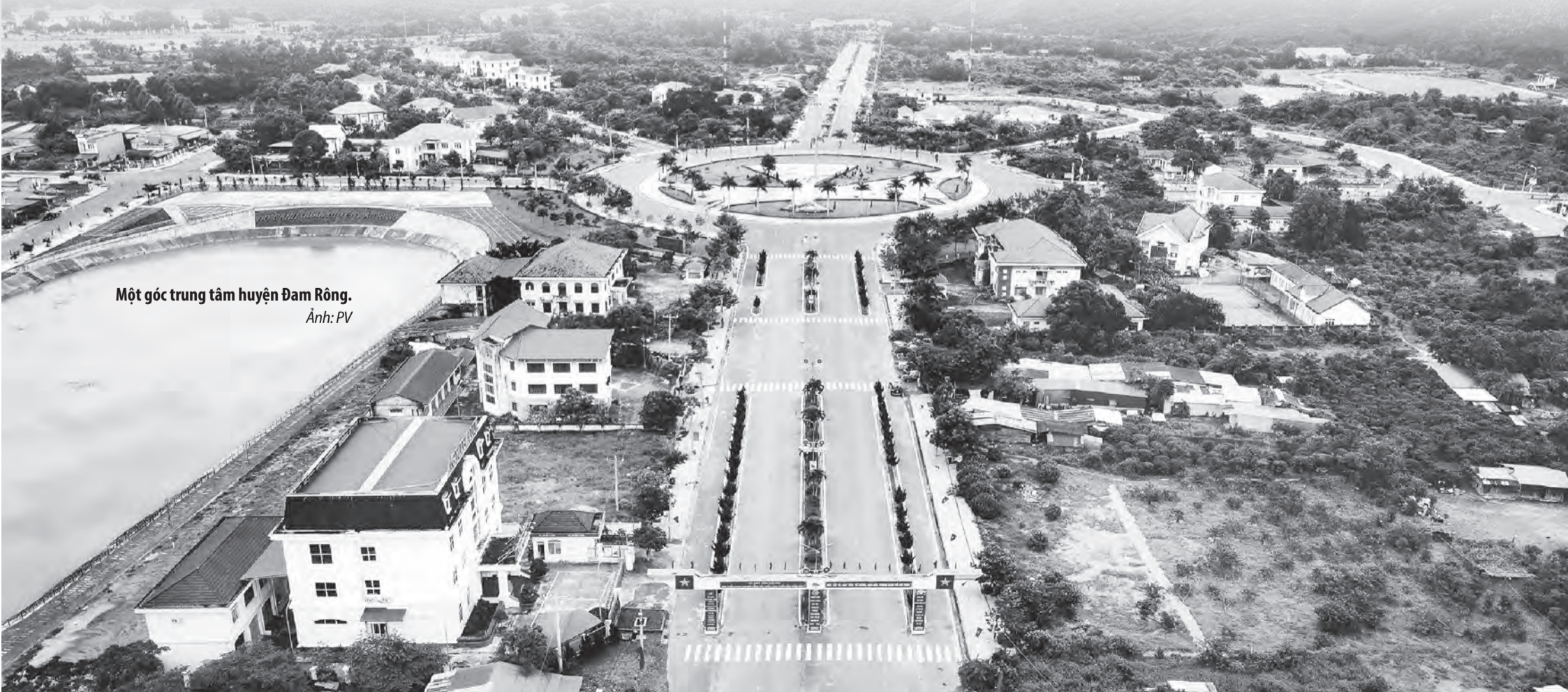
Một góc trung tâm huyện Đam Rông.

Những kết quả trên đã khẳng định phương thức lãnh đạo, điều hành của cấp ủy đảng, chính quyền các cấp đối với công tác tôn giáo và đội ngũ người uy tín trong vùng đồng bào dân tộc thiểu số trên địa bàn huyện Đam Rông trong thời gian qua là bước đi đúng đắn, hợp lòng dân, phù hợp với tình hình thực tiễn địa phương. Qua đó, thể hiện sự quan tâm của Đảng đối với công tác tôn giáo trong tình hình mới; từ đó đưa ra các giải pháp nhằm phát huy vai trò đội ngũ này hợp với “ý Đảng” và “lòng dân”.