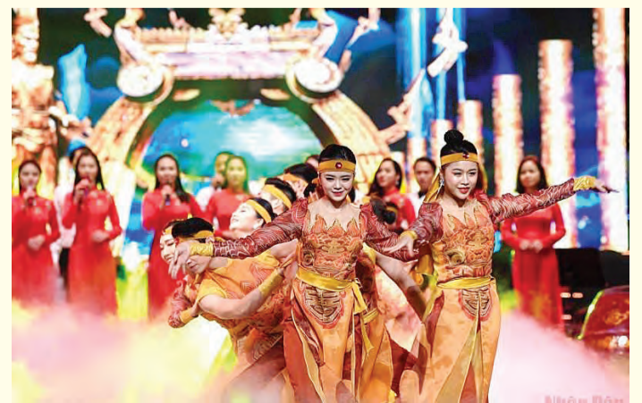
Chương trình biểu diễn nghệ thuật Xuân Quê hương 2022.