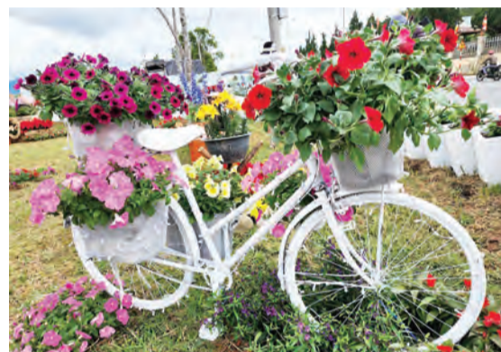
Một tiểu cảnh trong không gian hoa.

thu hút hàng ngàn du khách thưởng lãm. Cũng trong không gian mộng mơ, thời trang thổ cẩm Tây Nguyên và tơ lụa Bảo Lộc với những bộ thiết kế váy, áo dài bay bổng, như mơ, như mộng trong các cuộc trình diễn thời trang.