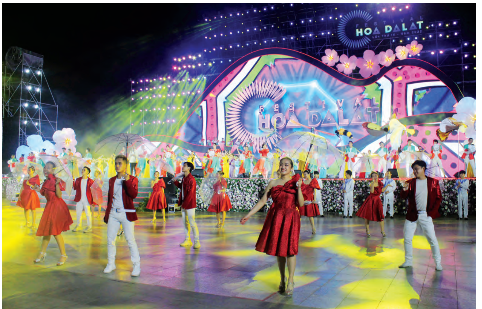
Đêm hội khai mạc Festival Hoa để lại dấu ấn đẹp.