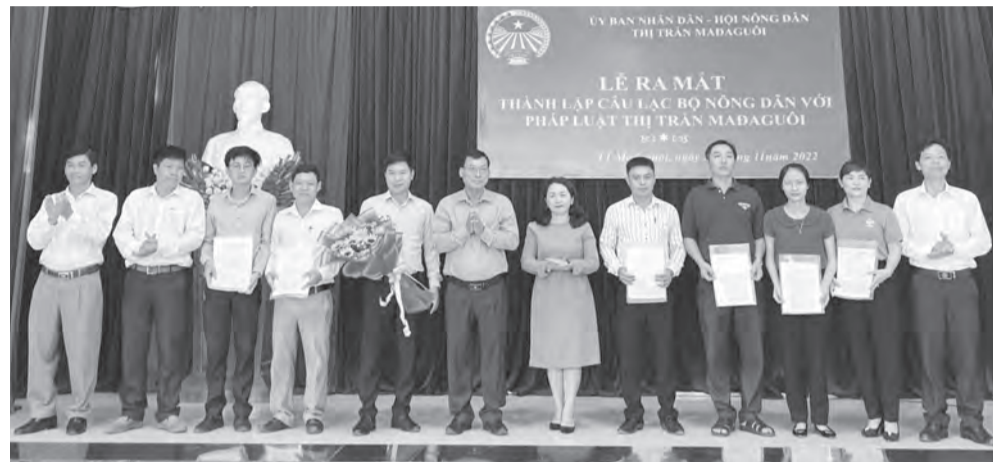
Đến nay, các xã, thị trấn của huyện Đạ Huoai đều thành lập CLB Nông dân với pháp luật.

Những năm qua, công tác tuyên truyền, phổ biến, giáo dục pháp luật cho cán bộ, hội viên luôn được Hội Nông dân huyện Đạ Huoai chú trọng thực hiện. Nhờ vậy, tình hình an ninh nông thôn luôn được đảm bảo, người dân được trang bị kiến thức, pháp luật, sẵn sàng cho những thương vụ buôn bán trong nước và xuất khẩu nông sản của địa phương ra nước ngoài.