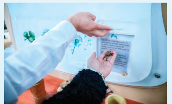
Thông qua các hoạt động tìm hiểu trải nghiệm tại trung tâm, cán bộ nhân viên Vườn Quốc gia mong muốn du khách sẽ nhận thức được vai trò của chính mình trong việc bảo vệ các giá trị tự nhiên và văn hóa bản địa.