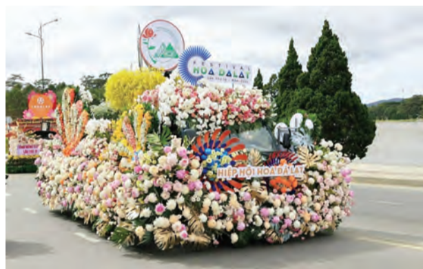
Diễu hành xe hoa trên hồ Xuân Hương.