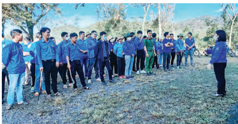
Tuổi trẻ Cát Tiên ra quân “Ngày Chủ nhật xanh” để trồng cây, thu gom rác thải.

Hưởng ứng Phong trào thanh niên Xung kích, tình nguyện vì cuộc sống cộng đồng, thời gian qua, tuổi trẻ huyện Cát Tiên đã có nhiều hoạt động thiết thực, ý nghĩa hướng về cộng đồng, chăm lo cho người nghèo, gia đình chính sách, chung tay xây dựng nông thôn mới.