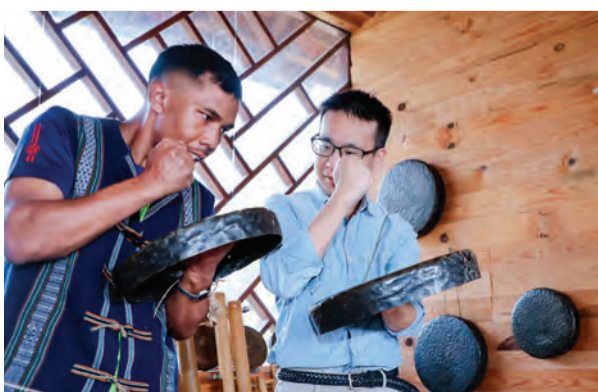
Khách học đánh chiêng.

Nằm cách TP Đà Lạt khoảng 40 km, Vườn Quốc gia Bidoup - Núi Bà là một trong những địa điểm du lịch trải nghiệm và khám phá thiên nhiên nổi tiếng nhất ở khu vực Tây Nguyên và phía Nam Việt Nam.