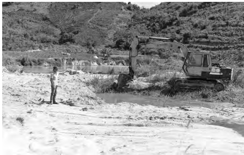
Tại xã Phúc Thọ, hoạt động khai thác khoáng sản cát, đá trái phép vẫn thường xuyên xảy ra.

chặn khai thác khoáng sản trái phép, đặc biệt là khai thác cát, sỏi lòng sông luôn được UBND huyện Lâm Hà quyết liệt chỉ đạo cho các đơn vị, ngành chức năng thực hiện. Tuy nhiên, hoạt động khai thác khoáng sản trái phép trên địa bàn huyện vẫn còn xảy ra. Khu vực hay xảy ra khai thác khoáng sản cát, đá trái phép tập trung chủ yếu tại địa bàn các xã Phúc Thọ, Phi Tô, Đan Phượng... Trước tình hình trên, UBND huyện Lâm Hà ban hành nhiều văn bản chỉ đạo công tác bảo vệ khoáng sản chưa khai thác để ngăn chặn, giải tỏa, xử lý các hoạt động khai thác khoáng sản trái phép. Đồng thời, thành lập đoàn liên ngành của UBND huyện kiểm tra phòng, chống tội phạm pháp luật về thuế trong hoạt động kinh doanh, khai thác, vận chuyển khoáng sản làm vật liệu xây dựng thông thường. Bên cạnh đó, UBND huyện cũng đã chỉ đạo UBND các xã, thị trấn lập đoàn liên ngành của từng đơn vị để thường xuyên tuần tra, kiểm tra, theo dõi, bảo vệ khoáng sản chưa khai thác trên địa bàn mình quản lý.