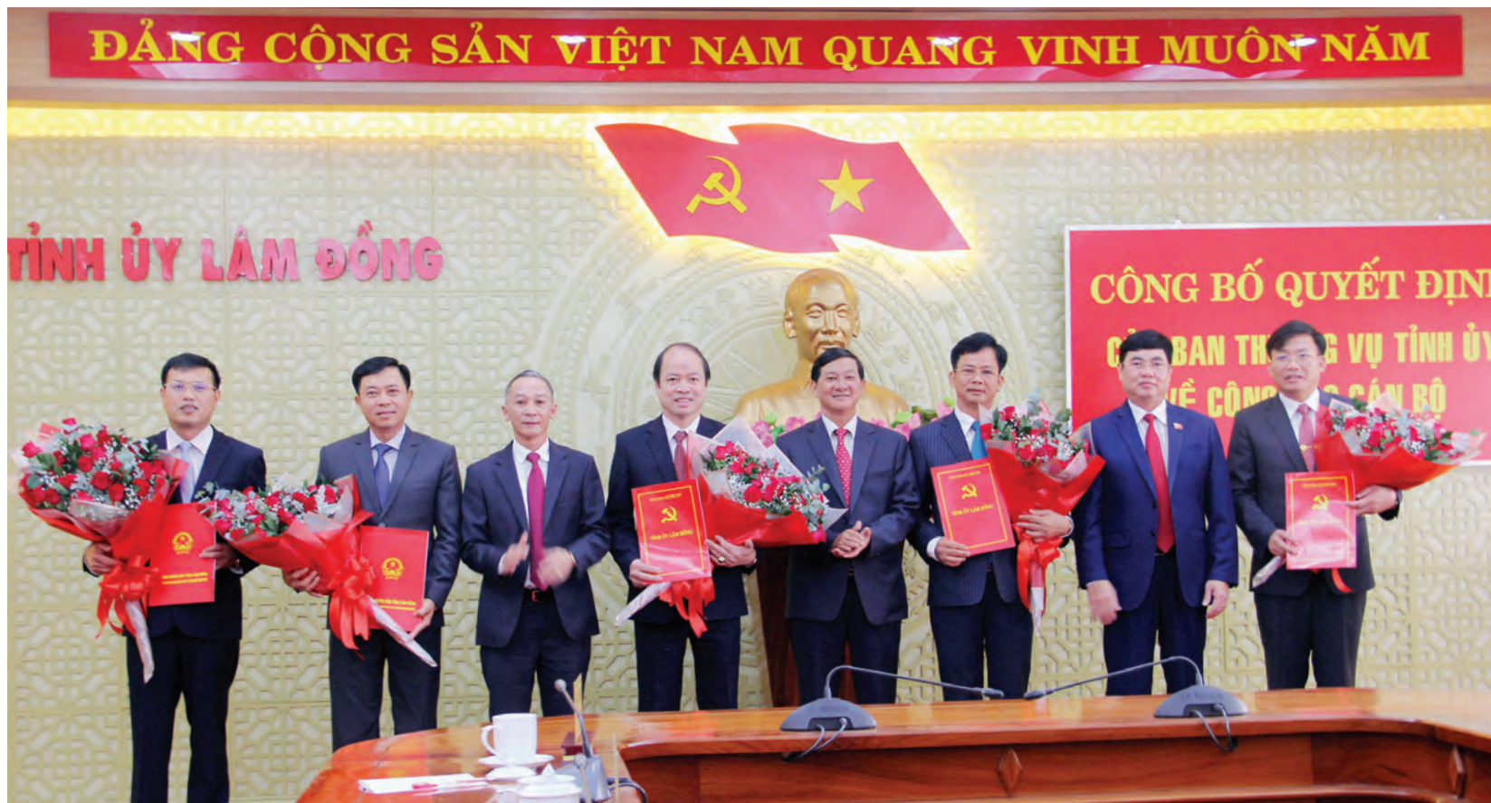
Thường trực Tỉnh ủy trao quyết định và tặng hoa chúc mừng các đồng chí được điều động nhận nhiệm vụ mới.