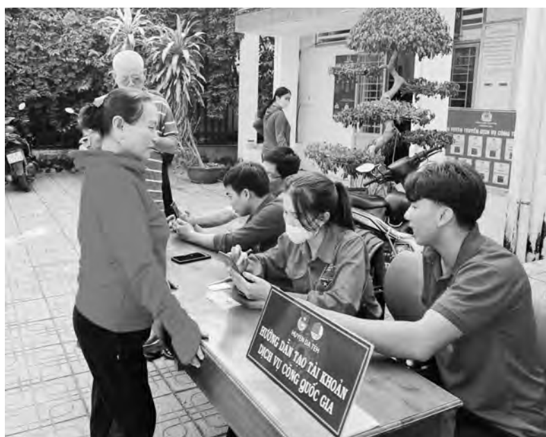
Đoàn viên, thanh niên Lâm Đồng luôn xung kích trong tuyên truyền, vận động, hướng dẫn người dân thực hiện chuyển đổi số.

Phát huy kết quả đạt được trong học và làm theo Bác, thời gian qua, Ban Thường vụ Tỉnh Đoàn Lâm Đồng tiếp tục có nhiều cách làm mới, sáng tạo nhằm góp phần thực hiện hiệu quả Kết luận 01 ngày 18/5/2021 của Bộ Chính trị khóa XIII về tiếp tục thực hiện Chỉ thị 05 khóa XII về "Đẩy mạnh học tập và làm theo tư tưởng, đạo đức, phong cách Hồ Chí Minh" (Kết luận 01).