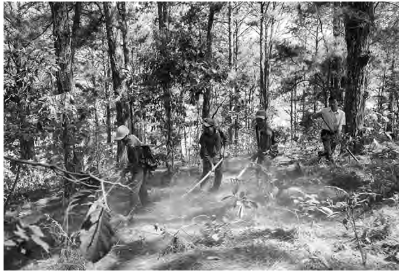
Chủ rừng và các thành viên tổ nhận khoán tổ chức thu dọn thực bì phòng cháy rừng mùa khô.

Trao đổi với chúng tôi về công tác phòng cháy, chữa cháy rừng mùa khô, các cán bộ kiểm lâm huyện Đơn Dương cho biết: công tác phòng cháy, chữa cháy rừng (PCCCR) trên địa bàn huyện đang được đặt ở mức cảnh báo rất cao. Bởi cứ vào tháng 2 hàng năm, vùng này lại bắt đầu bước vào mùa khô, cái nắng và nóng gay gắt kéo dài cho đến hết tháng 4. Thời điểm này, lượng mưa trong vùng luôn ở mức rất thấp, vì vậy đối với những người làm công tác quản lý bảo vệ rừng, việc canh chừng “giặc lửa” luôn phải thường trực 24/24.