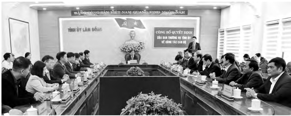
Các đại biểu tham dự hội nghị.