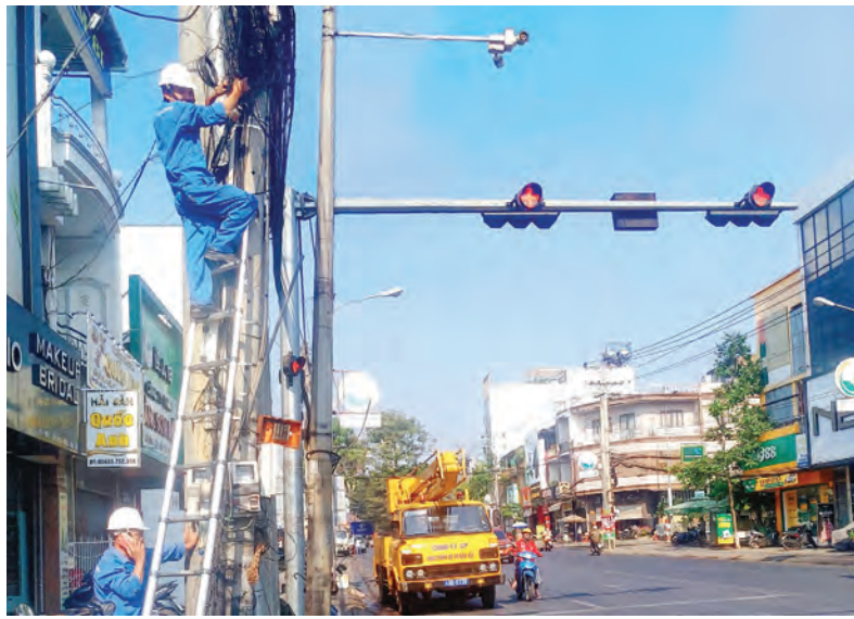
TP Bảo Lộc lắp đặt camera an ninh trên các trục đường chính phục vụ Trung tâm IOC.

Trên cơ sở đó, TP Bảo Lộc chú trọng đầu tư hạ tầng thông tin và truyền thông hướng tới xu hướng truyền thông hội tụ; đồng thời, thiết lập hệ thống công nghệ thông tin đồng bộ, thống nhất sử dụng chung. Đến hiện tại, 100% cơ quan hành chính nhà nước từ thành phố đến cơ sở đảm bảo công tác quản lý và điều hành qua môi trường mạng; hình thành nền tảng họp trực tuyến. Qua đó, chính quyền địa phương và các ngành chức năng thường xuyên tổ chức phổ biến, quán triệt chủ trương của Đảng, chính sách của Nhà nước để nâng cao nhận thức của các cấp ủy đảng, chính quyền, Nhân dân và doanh nghiệp về sự cần thiết và tính