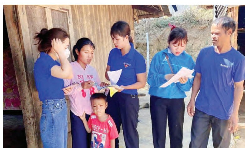
Tuổi trẻ Đam Rông thực hiện nhiều phần việc ý nghĩa trong Tháng Thanh niên.

Trong chuỗi các hoạt động kỷ niệm 92 năm Ngày Thành lập Đoàn (26/3/1931 - 26/3/2023), Huyện Đoàn Đam Rông đã tổ chức Ngày Đoàn viên gắn với Ngày Chủ nhật xanh lần thứ I, năm 2023 tại xã Đạ K’nàng. Tại Chương trình, Huyện Đoàn đã trao tặng 10 suất học bổng cho các em học sinh có hoàn cảnh khó khăn vươn lên trong học tập. Sau chương trình đã diễn ra các hoạt động đồng loạt như đổi rác thải nhựa lấy quà hưởng ứng Chương trình 1 triệu ly sữa - nâng cao tầm vóc Việt - Vì một Việt Nam xanh; Ra quân gom rác thải, dọn dẹp vệ sinh