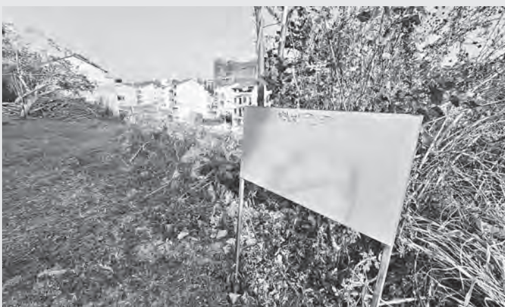
Bờ taluy đất cao 10 m, không có tường rào chắn, Ban Quản lý ga Đà Lạt chỉ để 1 biển cảnh báo tạm thời.

Ga Đà Lạt, công trình kiến trúc Pháp nổi tiếng ở Lâm Đồng (thuộc địa giới hành chính Phường 10, TP Đà Lạt) được xếp hạng di tích văn hóa Quốc gia từ năm 2001, thu hút hàng nghìn du khách trong và ngoài nước đến tham quan mỗi năm.