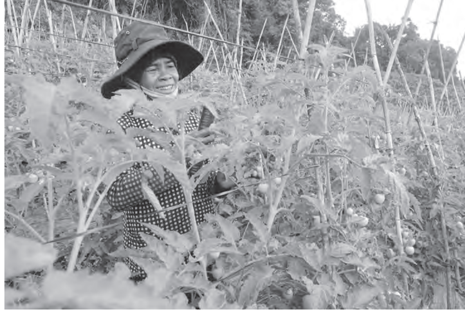
Giảm nghèo trong vùng đồng bào DTTS là một trong những hướng đi trọng tâm của huyện Di Linh.

Giảm nghèo bền vững nói chung và đặc biệt là giảm nghèo trong khu vực đồng bào dân tộc thiểu số nói riêng là một trong những nhiệm vụ chính trị đặc biệt quan trọng mà huyện Di Linh tập trung thực hiện suốt nhiều năm qua.