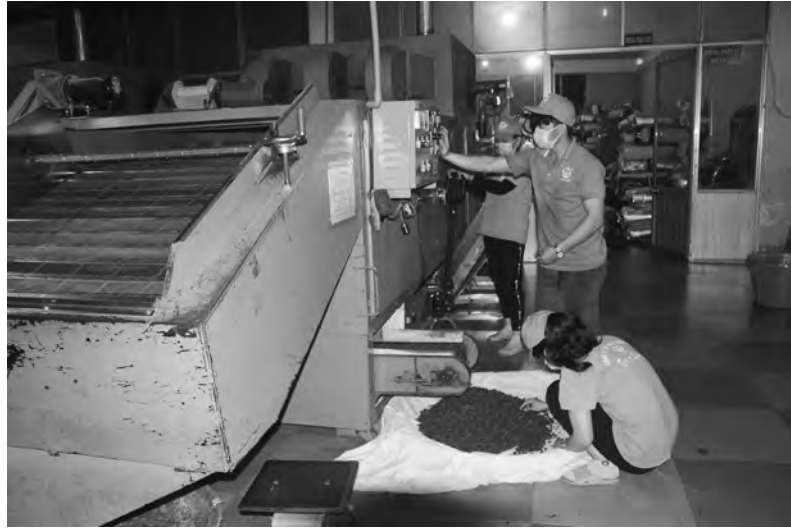
Cơ sở chế biến nông sản tại Lâm Hà.

Lâm Hà là địa phương có nhiều tiềm năng, lợi thế để phát triển nông nghiệp. Tuy nhiên, năng suất, hiệu quả của nền nông nghiệp địa phương chưa tương xứng với tiềm năng lợi thế sẵn có. Chính vì vậy, huyện Lâm Hà đã triển khai nhiều biện pháp để đẩy mạnh kết nối nông nghiệp với công nghiệp chế biến nhằm nâng cao giá trị hàng hóa nông sản; tạo việc làm, nâng cao thu nhập, góp phần ổn định đời sống cho người dân.