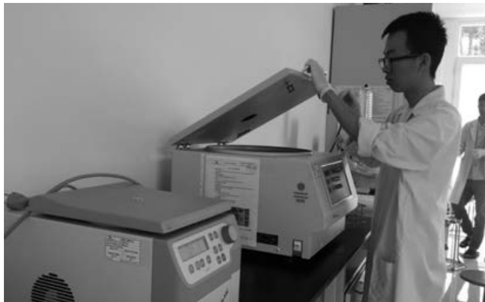
Ứng dụng kỹ thuật bức xạ, hạt nhân phục vụ công nghiệp hóa, hiện đại hóa. Ảnh chụp tại Trung tâm Ứng dụng kỹ thuật hạt nhân trong công nghiệp (thuộc Viện Năng lượng nguyên tử Việt Nam) trụ sở tại Đà Lạt.

Năm qua, hoạt động khoa học và công nghệ tiếp tục có nhiều đóng góp quan trọng trên tất cả các lĩnh vực kinh tế, văn hóa, xã hội của tỉnh. Khoa học công nghệ không ngừng khẳng định vai trò là “đòn bẩy”, là động lực quan trọng thúc đẩy sự phát triển bền vững, trong đó phát triển nông nghiệp ứng dụng công nghệ cao là “nét son” của ngành KH-CN địa phương.