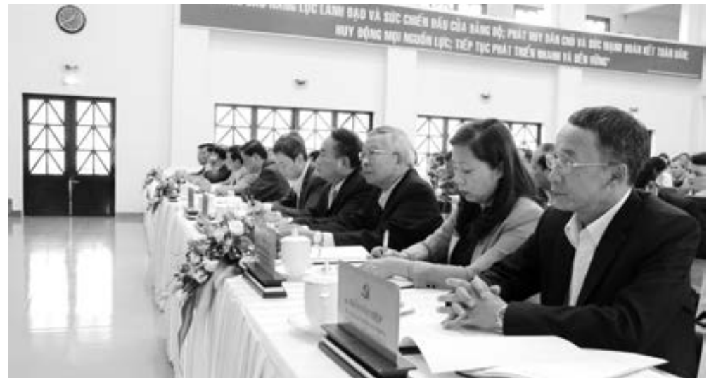
Các đồng chí là UVBT Tỉnh ủy có mặt đầy đủ tại hội nghị.