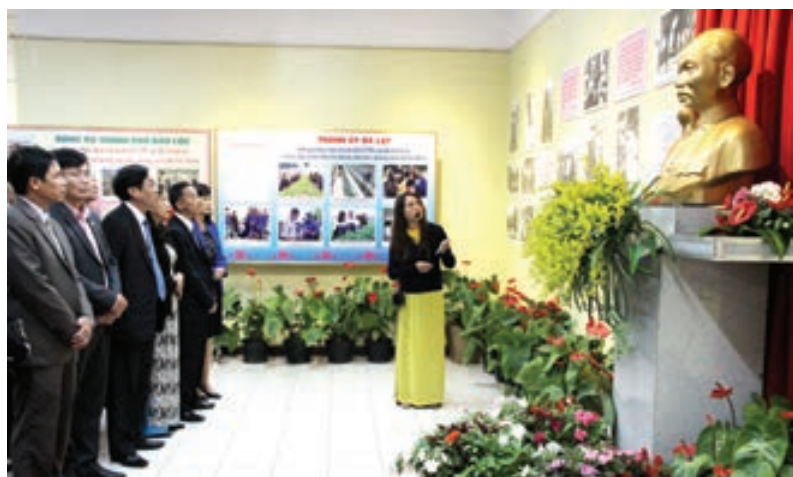
Các đại biểu nghe thuyết minh về cuộc đời hoạt động cách mạng và sự hy sinh, cống hiến của Bác vì sự nghiệp đấu tranh giải phóng dân tộc, vì hòa bình, độc lập, tiến bộ xã hội.

Chiều 17/5, tại Nhà thông tin triển lãm (Rạp 3/4, khu Hòa Bình, TP Đà Lạt), Ban Tuyên giáo Tỉnh ủy phối hợp với Sở Văn hóa - Thể thao và Du lịch tỉnh đã tổ chức triển lãm chủ đề “Học tập và làm theo tư tưởng, đạo đức, phong cách Hồ Chí Minh”.