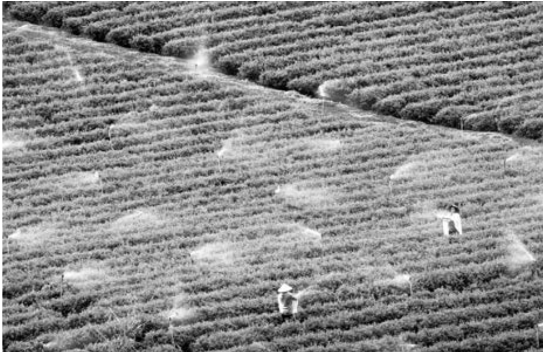
Ứng dụng hệ thống tưới tự động trên cây chè.

Hình thành vùng chè công nghệ cao hướng đến sản phẩm chất lượng là xu hướng tất yếu để phát triển cây chè một cách bền vững và mở đường xuất khẩu đem lại kinh tế cao hơn cho người nông dân.