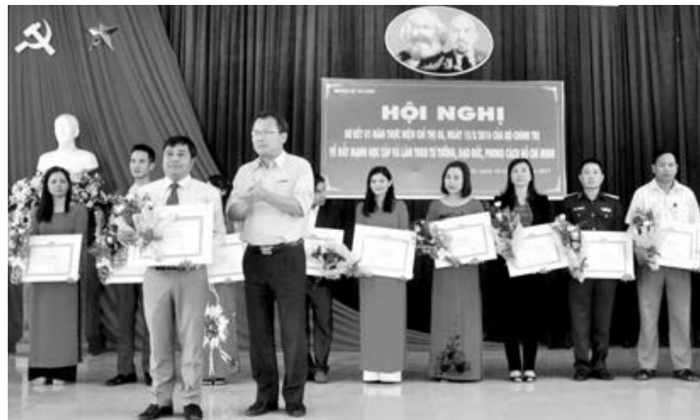
Huyện ủy Di Linh khen thưởng những nhân tố tích cực trong thực hiện Chỉ thị 05 - CT/TW.

Sau hơn một năm thực hiện Nghị quyết Trung ương 4 (khóa XII) về "Tăng cường xây dựng, chỉnh đốn Đảng; ngăn chặn, đẩy lùi sự suy thoái về tư tưởng chính trị, đạo đức, lối sống, những biểu hiện "tự diễn biến", "tự chuyển hóa" trong nội bộ", Đảng bộ huyện Di Linh đã tạo được bước chuyển biến tích cực trong công tác xây dựng Đảng. Đây là cơ sở giúp Đảng bộ huyện ngày càng trong sạch vững mạnh hơn.