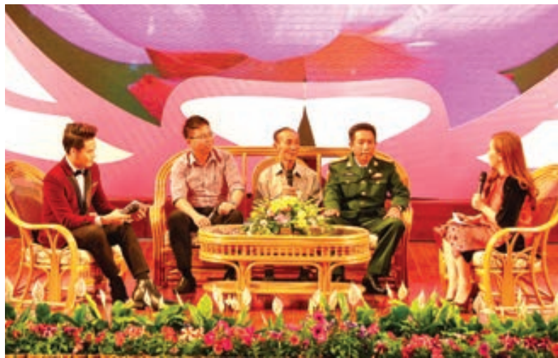
Giao lưu với các gương điển hình tiêu biểu trong học tập và làm theo Bác.