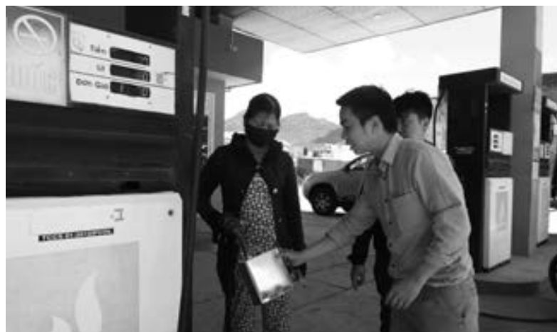
Mua mẫu xăng ngẫu nhiên tại các cây xăng bán lẻ thực hiện công tác đo lường, kiểm định.

Chương trình quốc gia về nâng cao năng suất và chất lượng sản phẩm hàng hóa của doanh nghiệp đã tạo ra phong trào tăng năng suất, chất lượng một cách bền vững qua việc áp dụng các hệ thống quản lý chất lượng, công