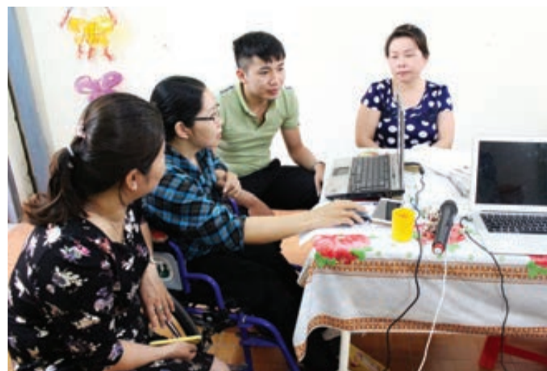
Các học viên khuyết tật đang trao đổi những kỹ năng bán hàng online.

Công nghệ phát triển mở ra những ngành nghề mới. Nghề bán hàng online có thể xem là một điển hình. Nhiều người đã chọn nghề này để khởi sự kinh doanh, trong đó có cả người khuyết tật.