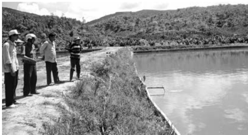
Lâm Đồng tiếp tục triển khai Đề án phát triển hệ thống ao, hồ nhỏ, góp phần giảm thiểu thiệt hại do thiên tai gây ra. Ảnh: V.V