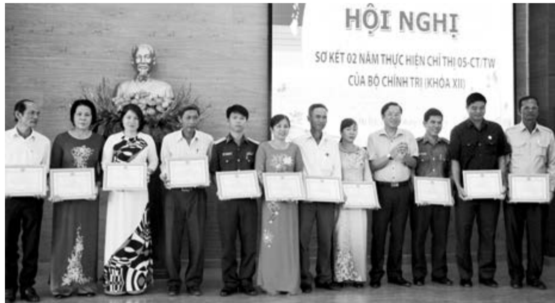
Các gương điển hình trong thực hiện Chỉ thị 05 trên địa bàn huyện Đạ Tẻh được biểu dương, khen thưởng để nhân rộng.

Đó là phương châm của Huyện ủy Đạ Tẻh trong triển khai thực hiện Chỉ thị 05 về "Đẩy mạnh học tập và làm theo tư tưởng, đạo đức, phong cách Hồ Chí Minh". Nhờ vậy mà các đơn vị, địa phương trong huyện đã triển khai mạnh mẽ nhiều biện pháp, góp phần tạo sự chuyển biến nhất định trong hai năm thực hiện Chỉ thị.