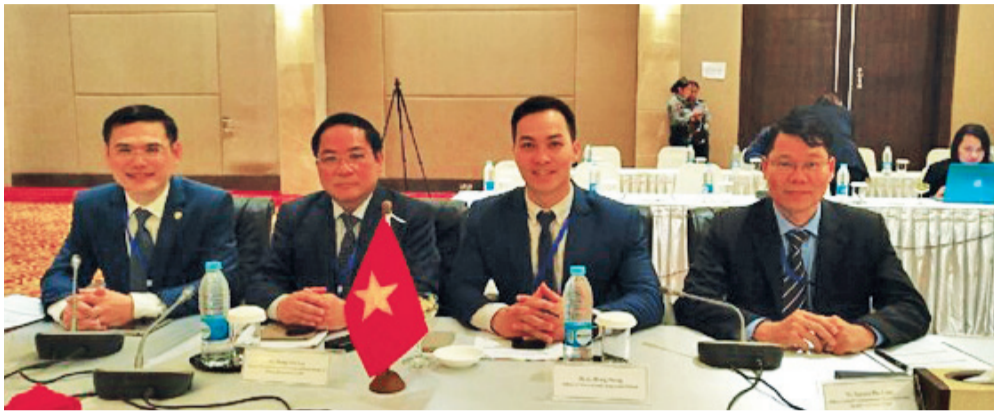
Các đại diện của Việt Nam tham dự hội nghị.

Ngày 21/5, Myanmar tổ chức Hội nghị quan chức cấp cao các nước tiểu vùng sông Mekong, Việt Nam và Cơ quan phòng chống ma túy và tội phạm của Liên hợp quốc UNODC nhằm đấu tranh phòng chống ma túy.