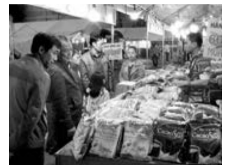
Các gian hàng được bày bán tại Lạc Dương.

Từ ngày 21-25/5, nằm trong khuôn khổ chương trình xúc tiến thương mại Quốc gia năm 2018, Phiên chợ hàng Việt về miền núi được tổ chức tại thị trấn Thanh Mỹ, huyện Đơn Dương. Chương trình do Trung tâm Xúc tiến Đầu tư, Thương mại và Du lịch tỉnh Lâm Đồng tổ chức.