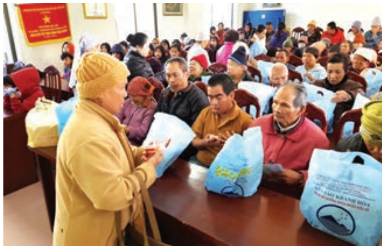
Tặng quà từ thiện tại Trung tâm Bảo trợ xã hội Lâm Đồng.

nhiều chùa, thiền viện mở các đợt sinh hoạt văn hóa Phật giáo cho phật tử trong các dịp lễ, tết như các hoạt động biểu diễn văn nghệ, tổ chức vui trung thu, múa lân, phát quà cho thiếu nhi..., tổ chức triển lãm cây cảnh, thư pháp, thu hút đông đảo quan khách tham quan.