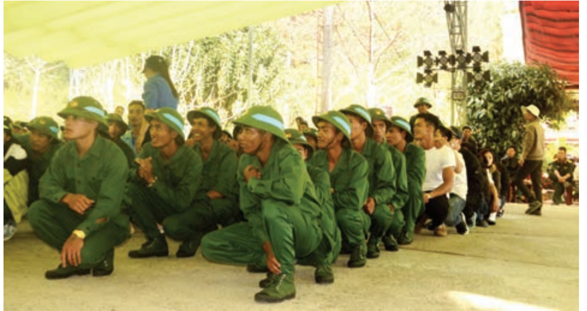
Thanh niên DTTS huyện Lạc Dương hào hứng tham gia các trò chơi trong ngày hội tổng quân.

Những năm gần đây, trong các đợt giao nhận quân ở Lạc Dương, tỷ lệ tân binh là người dân tộc thiểu số (DTTS) nhập ngũ ngày càng tăng. Đặc biệt, năm 2018 tỷ lệ này đạt 100% và đa số đều viết đơn tình nguyện lên đường nhập ngũ với khí thế hăng hái được trở thành bộ đội Cụ Hồ.