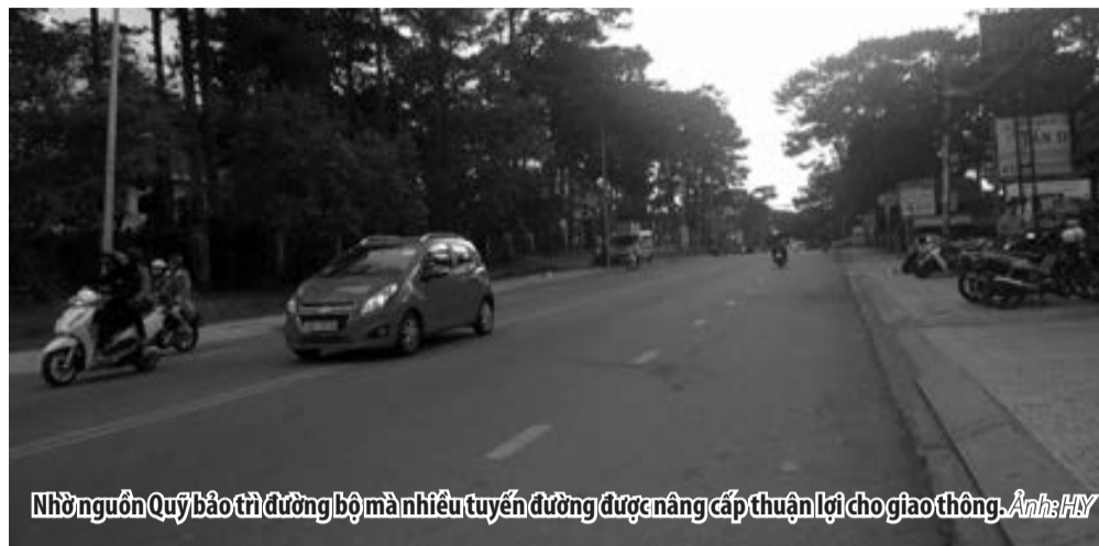
Nhờ nguồn Quý bảo trì đường bộ mà nhiều tuyến đường được nâng cấp thuận lợi cho giao thông.

Ông Nguyễn Hữu Thành, Trưởng Phòng Quản lý kết cấu hạ tầng giao thông - Sở GTVT cho biết, Quý bảo trì đường bộ đi vào hoạt động từ năm 2013 đã đóng góp quan trọng vào việc duy tu, bảo trì, kéo dài tuổi thọ hệ thống đường, đặc biệt là giảm chi thường xuyên trực tiếp từ ngân sách nhà nước cho hoạt động này. Có thể kể đến một số kết quả cụ thể trong quản lý, bảo trì hệ thống quốc lộ, đường tỉnh giai đoạn 2013 đến nay đã triển khai thực hiện sửa chữa 22 công trình trên mạng lưới đường tỉnh với giá trị 121 tỷ đồng; bảo dưỡng thường xuyên mạng lưới đường tỉnh hàng năm với giá trị 25 tỷ đồng/năm. Duy tu, bảo dưỡng thường xuyên 4 tuyến quốc lộ với 187 km và 250 km tỉnh lộ được bảo dưỡng bằng nguồn vốn của Quý bảo trì đường bộ. Đó là chưa kể đến các tuyến đường trong nội thị thành phố Đà Lạt được sửa chữa từ nguồn kinh phí Quý bảo trì đường bộ để bảo trì và vận hành khai thác an toàn.