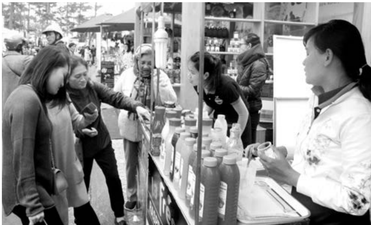
Thức uống từ trái cây Đà Lạt thương hiệu La Fresh đã được trưng bày tại phố trà, rượu vang, đặc sản trong Festival Hoa Đà Lạt 2017.

Theo tính toán, tổng nhu cầu vốn đầu tư giai đoạn 2016-2020 khoảng