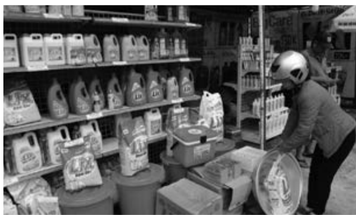
Đưa các hàng hóa có thương hiệu Việt, với giá cả hợp lý đến tận tay người tiêu dùng, nhằm phục vụ nhân dân trên địa bàn tiếp cận với nguồn hàng Việt có chất lượng đảm bảo.

Ông Bùi Thế - Phó Giám đốc Sở Công thương Lâm Đồng cho biết, Phiên chợ hàng Việt về xã Lộc Châu, TP Bảo Lộc là hoạt động tiếp nối trong chuỗi hoạt động chương trình xúc tiến thương mại quốc gia và đẩy mạnh hơn nữa Cuộc vận động "Người Việt Nam ưu tiên dùng hàng Việt Nam". Qua đó, Phiên chợ đưa hàng Việt về nông thôn diễn ra ở xã Lộc Châu lần này bao gồm các hoạt động chính là đưa các hàng hóa có thương hiệu Việt, với giá cả hợp lý đến tận tay người tiêu dùng, nhằm phục vụ nhân dân trên địa bàn tiếp cận với nguồn hàng Việt có chất lượng đảm bảo; đồng thời thông qua phiên chợ để giới thiệu, quảng bá, tìm kiếm thị trường tiêu thụ cho các sản phẩm hàng hóa được sản xuất chế biến trong tỉnh; tạo điều kiện cho các doanh nghiệp hiểu rõ hơn nhu cầu mua sắm và tiêu dùng hàng Việt trên thị trường để có kế