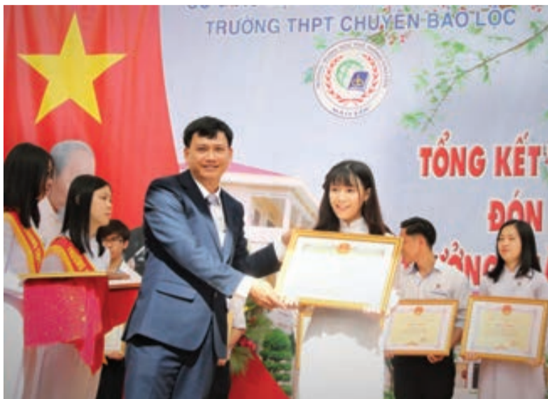
Trường THPT Chuyên Bảo Lộc trao thưởng cho học sinh xuất sắc.

Ngoài các môn văn hóa, thì những thành tích mà HS Trường