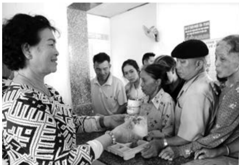
Phát cơm từ thiện cho bệnh nhân tại Bệnh viện YHCT Bảo Lộc.

Không chỉ các tổ chức cơ sở đảng, các ban, ngành, đoàn thể mà việc học tập và làm theo lời Bác đã thực sự lan tỏa đến với mọi tầng lớp nhân dân. Từ đó, đã có nhiều mô