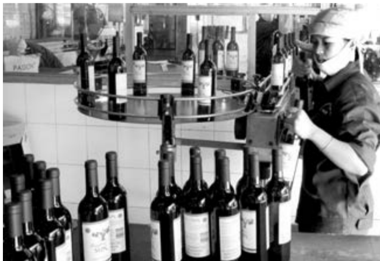
Dây chuyền sản xuất rượu vang của Đà Lạt Beco.

Khuyến khích các doanh nghiệp chủ động xây dựng vùng nguyên liệu chuyên canh tập trung có chất lượng cao, ổn định lâu dài trên cơ sở liên kết chặt chẽ với các nhà khoa học,