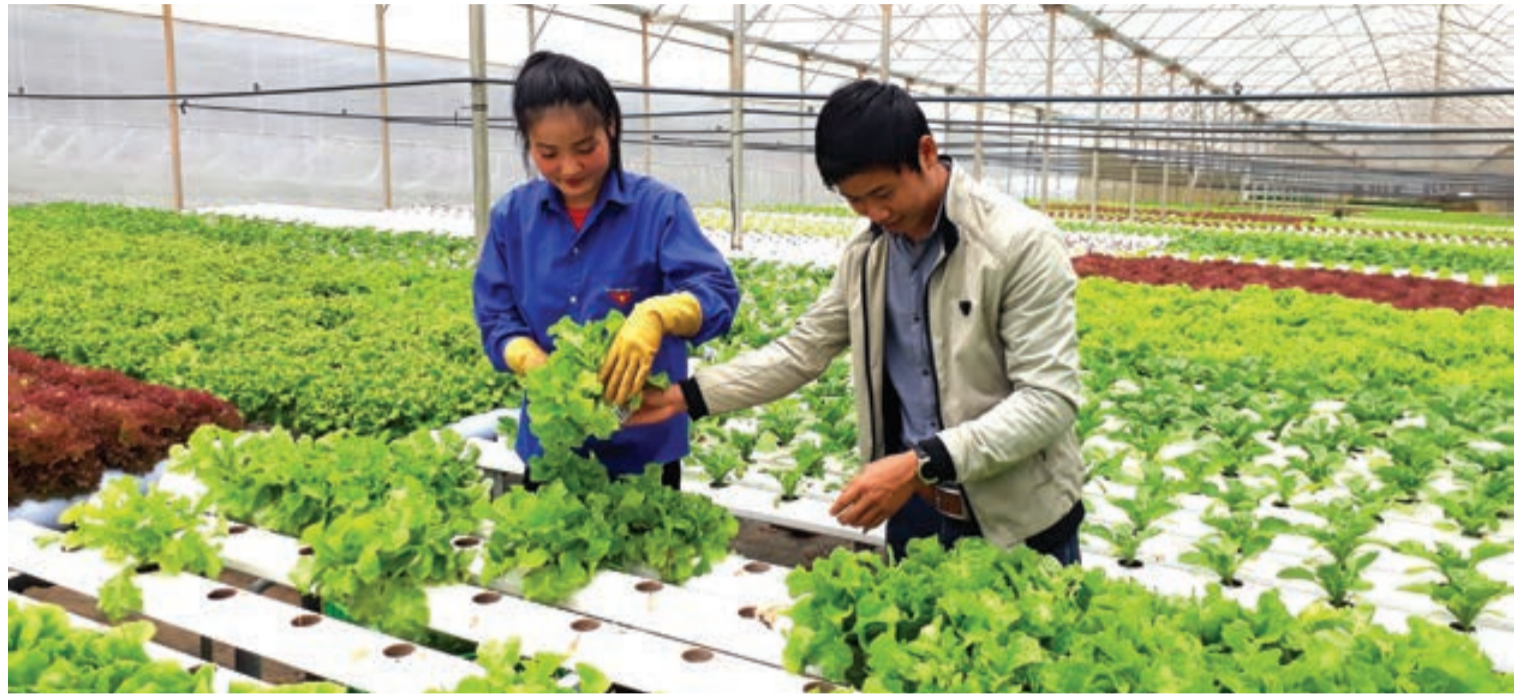
Nông nghiệp công nghệ cao là một trong những lĩnh vực KN được tỉnh Lâm Đồng ưu tiên.

Ngoài ra, ngày 22/9/2017, UBND tỉnh cũng đã ban hành Kế hoạch 6324/KH-UBND về Hỗ trợ KN đổi mới sáng tạo tỉnh Lâm Đồng đến năm 2020, với mục tiêu tạo lập môi trường thuận lợi để thúc đẩy quá trình hình thành và