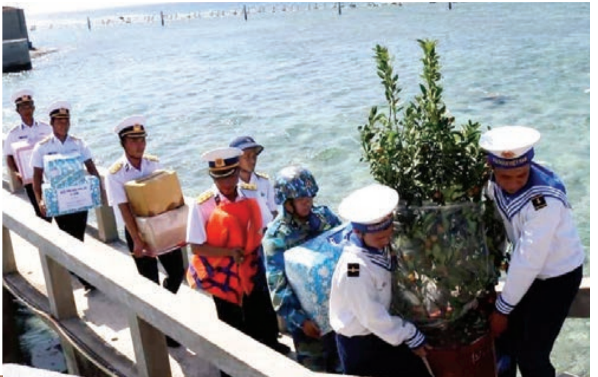
Không khí náo nức chuẩn bị Tết ở Trường Sa.