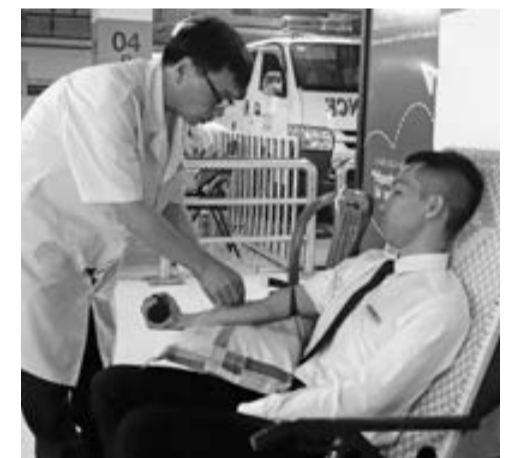
Cán bộ, nhân viên Trung tâm Thương mại Vincom và Thủy điện Hàm Thuận - Đa Mi tham gia cho máu.

Sáng 10/1, tại Trung tâm Thương mại Vincom Plaza Bảo Lộc, Ban chỉ đạo hiến máu tình nguyện TP Bảo Lộc phối hợp với Bệnh viện II Lâm Đồng đã tổ chức Chương trình “Lễ hội Xuân hồng 2019”. Với chủ đề, “Hạnh phúc là chia sẻ”, Lễ hội Xuân hồng 2019 đã thu hút đông đảo cán bộ, nhân viên Trung tâm Thương mại Vincom Bảo Lộc và Công ty Thủy điện Hàm Thuận - Đa Mi tham gia.