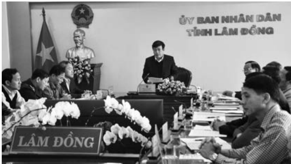
Chủ tịch UBND tỉnh Lâm Đồng phát biểu tại Hội nghị.

Tại Hội nghị, Ban Thi đua - Khen thưởng Trung ương cũng nêu ra những tồn tại, hạn chế hiện nay trong công tác thi đua, khen thưởng. Đó là việc một số phong trào thi đua chưa được triển khai thường xuyên, tiêu chí còn chung chung; công tác kiểm