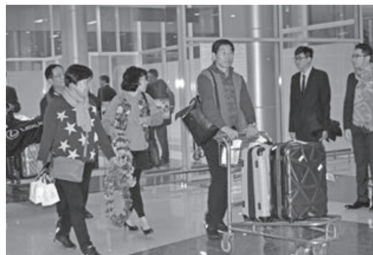
Khách du lịch Hàn Quốc thích chơi golf tại Đà Lạt.