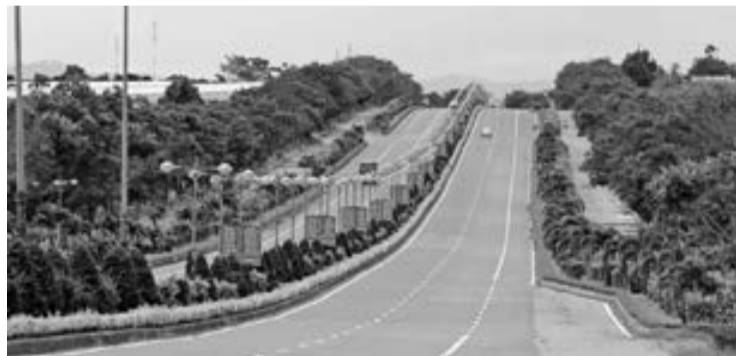
Hạ tầng trên địa bàn tỉnh được các bộ, ngành Trung ương quan tâm đầu tư, song chưa đồng bộ, chưa đáp ứng được nhu cầu liên kết giữa Lâm Đồng với các vùng kinh tế và các tỉnh lân cận.

Trong ảnh: Một đoạn cao tốc Liên Khương - Prenn.