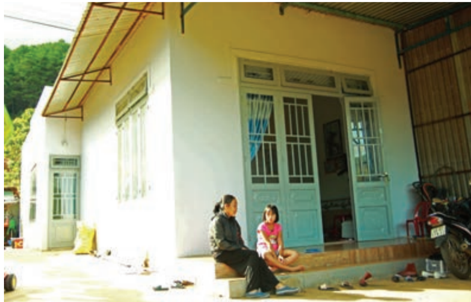
Nhiều căn nhà khang trang có được từ sự chung tay của cộng đồng và nỗ lực vươn lên của các gia đình còn đang gặp nhiều khó khăn.

Những căn nhà còn vương mùi sơn mới, những mái ấm dù còn đơn sơ nhưng lúc nào cũng vẹn nguyên tiếng cười và niềm hạnh phúc. Năm 2018, Ủy ban Mặt trận Tổ quốc (UBMTTQ) huyện Lâm Hà đã vận động đóng góp hỗ trợ xây dựng 44 căn nhà như thế cho những gia đình khó khăn.