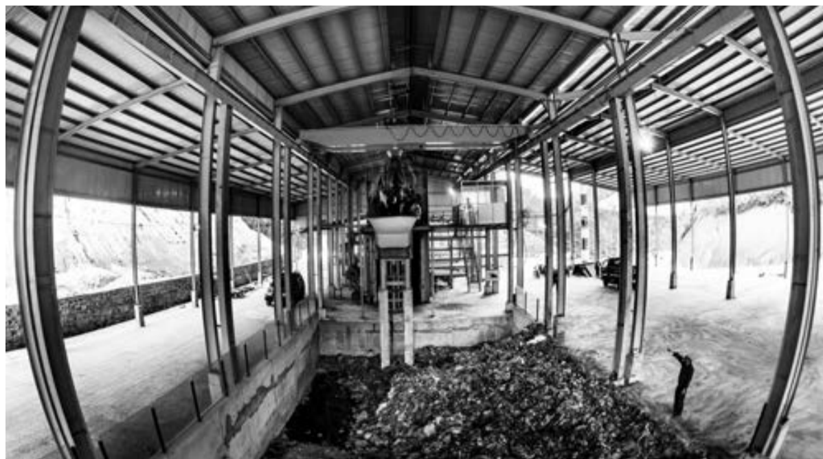
Xử lý chất thải rắn ở Bảo Lộc.

Theo Thành ủy Bảo Lộc, kể từ khi triển khai kế hoạch xây dựng đô thị loại II, các công trình trọng điểm của tỉnh và Trung ương đầu tư trên địa bàn thành phố đã có tổng mức đầu tư lên tới 2.300 tỷ đồng. Nguồn vốn này được ưu tiên đầu tư dự án cải tạo, nâng cấp QL 20 đoạn qua thành phố Bảo Lộc hiện đã hoàn thành; kế đó là dự án QL 20 đoạn tránh qua thành phố Bảo Lộc có tổng vốn đầu tư gần 750 tỷ đồng với chiều dài 15,457 km nay đã thông tuyến, cơ bản hoàn thành bồi thường giải phóng mặt bằng và dự kiến đưa vào sử dụng trong năm 2019. Riêng dự án xây dựng mới Bệnh viện II Lâm Đồng với tổng mức đầu tư hơn 495,2 tỷ đồng đã đưa vào sử dụng trong năm 2018. Bên cạnh đó, dự án cấp nước từ nguồn vốn ODA của Chính phủ Đan Mạch được Thủ tướng Chính phủ cho chủ trương hoàn thiện thủ tục lập dự án đầu tư với nguồn vốn dự kiến gần 448,5 tỷ đồng. Cùng với dự án ODA về xử lý nước thải, với tổng vốn đầu tư hơn 409 tỷ đồng do Vương quốc Bỉ cấp vốn. Trong đó,