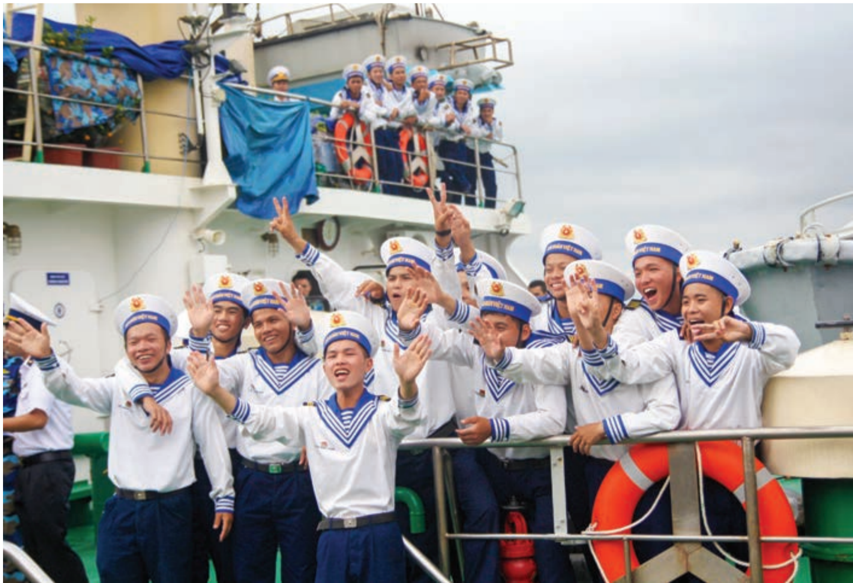
Chiến sĩ trẻ hải quân lên đường ra Trường Sa.