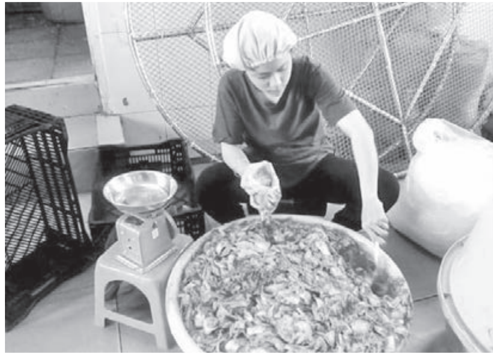
Sản xuất kim chi tại cơ sở Shin Sang.

Là món ăn truyền thống của người Hàn Quốc, kim chi nay đã trở nên quen thuộc trong bữa ăn của nhiều gia đình người Việt tại Đà Lạt và cả trong nước, nhất là trong mùa tết.