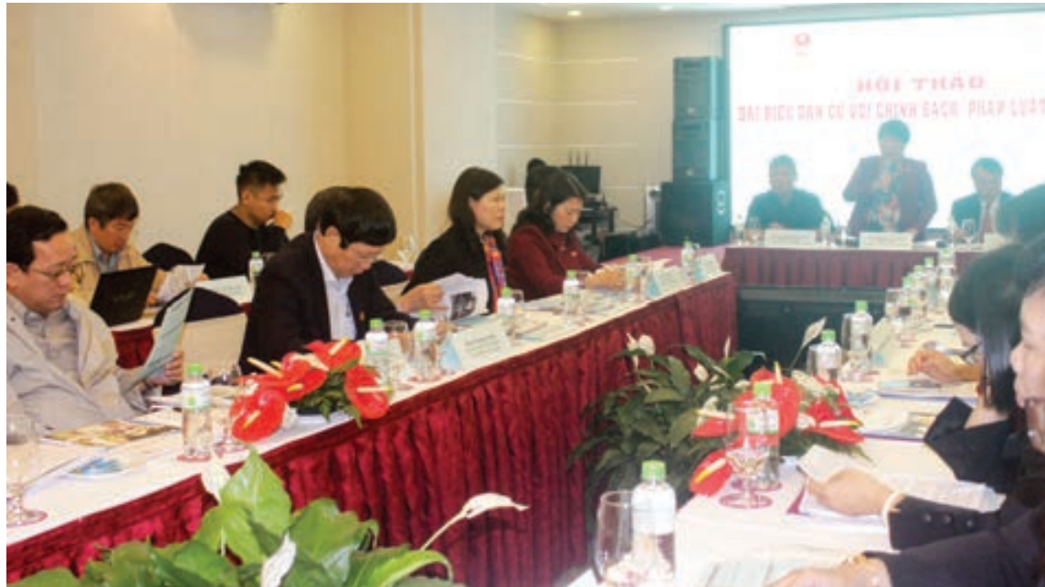
Toàn cảnh buổi hội thảo "Đại biểu dân cử với chính sách, pháp luật về di cư".

Di cư là một yếu tố tất yếu trong quá trình phát triển; di cư tạo cơ hội về kinh tế và giáo dục tốt hơn, góp phần cải thiện cuộc sống của người di cư và gia đình họ. Tuy nhiên, vấn đề này đặt ra thách thức và áp lực cho các cấp Trung ương và địa phương không hề nhỏ. Cần có nhiều chính sách phù hợp và đồng bộ để đảm bảo quyền tự do cư trú của công dân theo quy định của pháp luật, đảm bảo quyền bình đẳng trong tiếp cận dịch vụ xã hội cơ bản, đảm bảo môi trường sống, đất đai...; hướng đến đảm bảo trật tự an toàn xã hội.