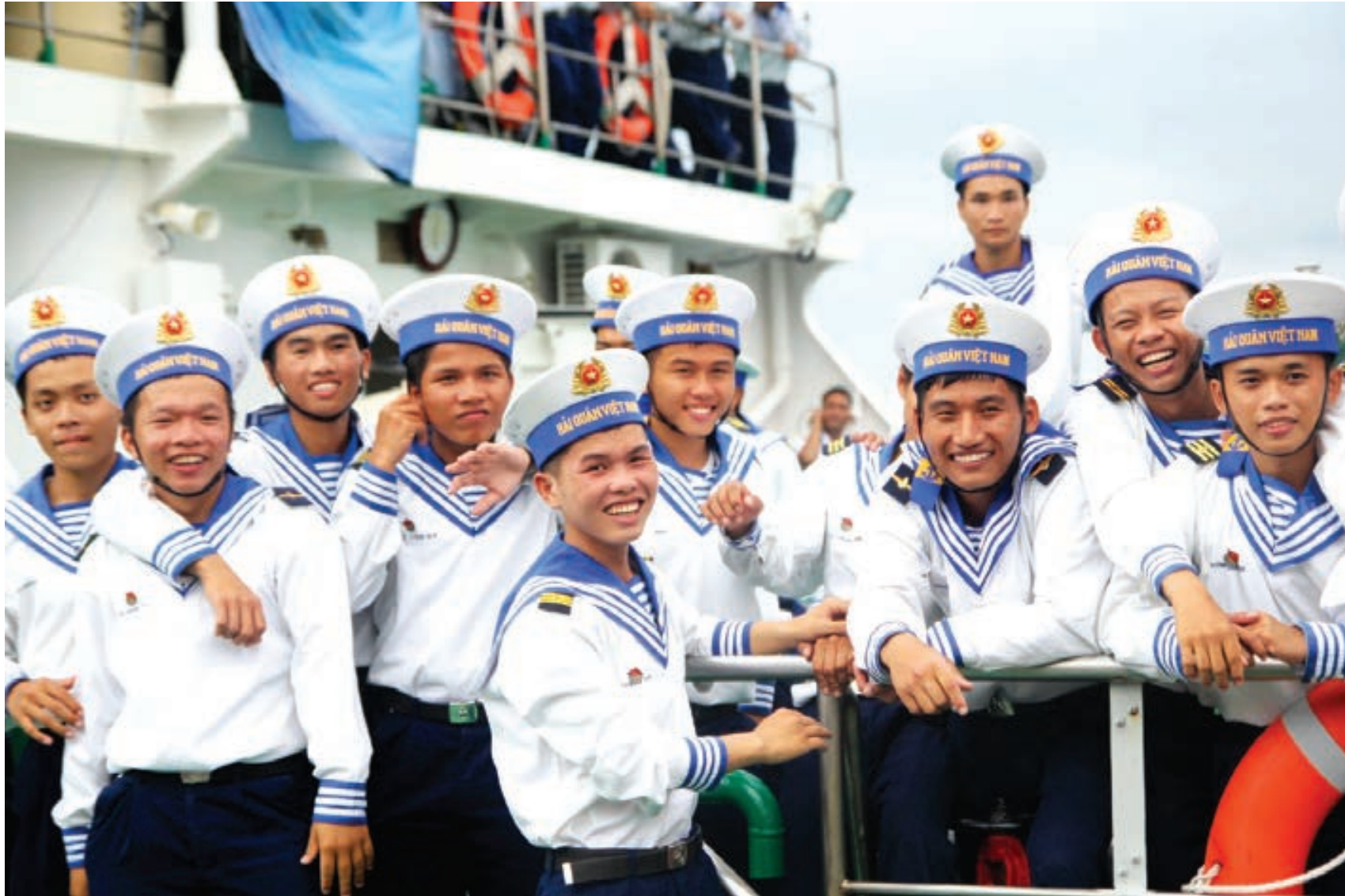
Những người lính trẻ tràn đầy sức trẻ và nhiệt huyết hành quân lên tàu nhận nhiệm vụ ngoài đảo xa.