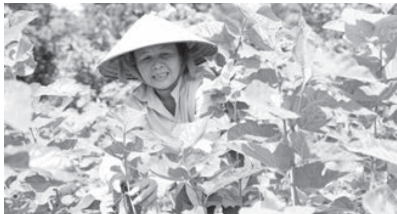
Từ quê hương Xuân Trường, Nam Định, cây dâu đem lại đời sống ấm no cho người dân ở Đạ Pal.

Ngược về phía núi, bắt gặp những mảng xanh nối tiếp nhau chạy dài đến tận chân đồi. Và không chỉ hình ảnh nương dâu nay đã xanh màu trên mảnh đất Mỹ Đức, Đạ Pal còn phải nói đến cả cây cao su đang mùa thay lá. Tất cả như gợi lên cảm nhận ban đầu của hai xã nông thôn mới (NTM) trên vùng đất hanh hao nắng cháy Đạ Tẻh.