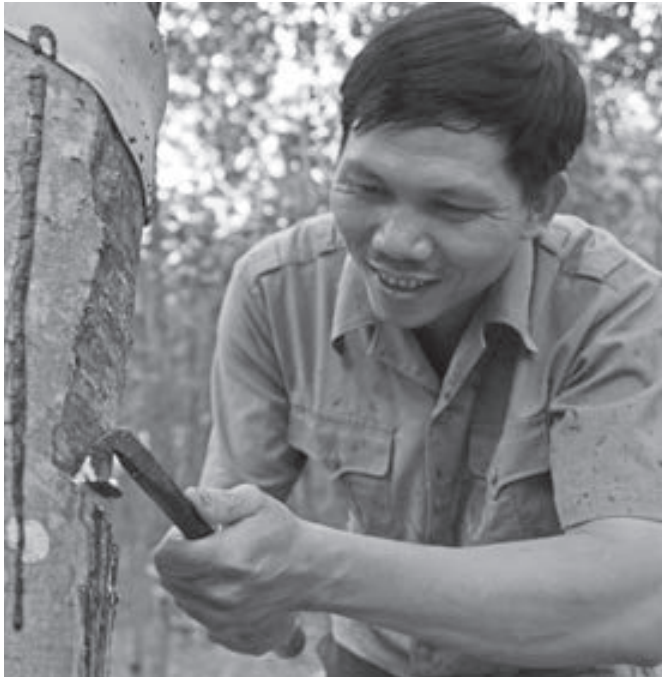
Cao su vẫn là cây trồng chủ lực với diện tích lớn ở Mỹ Đức.