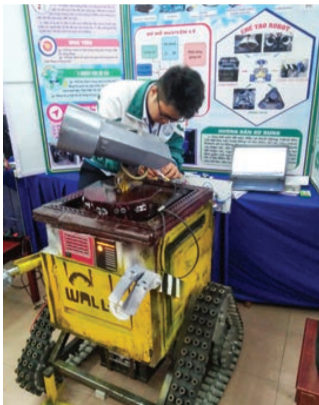
Học sinh Trường THPT Đơn Dương với đề tài “Robot tự động thu gom rác”.

Là thành viên Ban Giám khảo Cuộc thi Khoa học kỹ thuật (KHKT)