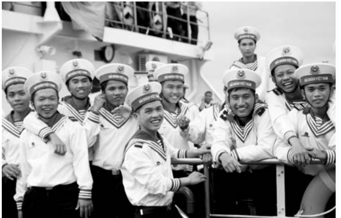
Những người lính trẻ tràn đầy sức trẻ và nhiệt huyết hành quân lên tàu nhận nhiệm vụ ngoài đảo xa.

Họ đến với đảo từ mọi miền của đất nước với những hoàn cảnh và tuổi đời khác nhau nhưng tất