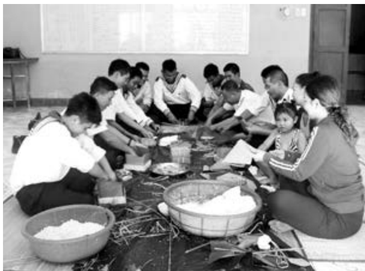
Lính trẻ làm bánh chưng để đón tết.