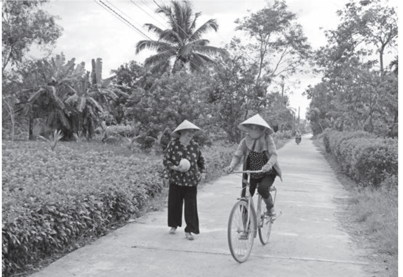
Chiều quê bình yên trên những con đường ở Mỹ Đức.