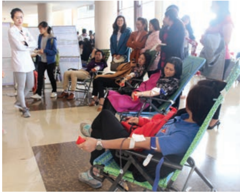
Đoàn viên, CNVCLĐ tham gia ngày hội hiến máu tình nguyện do LĐLĐ tỉnh tổ chức.

Cùng với LĐLĐ huyện Đức Trọng, theo LĐLĐ tỉnh, trong năm qua, các phong trào thi đua đã được các cấp công đoàn trong tỉnh phát động từ đầu năm phù hợp với đặc điểm của từng ngành, từng địa phương. Nội dung thi đua tập trung vào các phong trào như thi đua “Lao động giỏi”, “Lao động sáng tạo”, “Thi đua phục vụ công nghiệp hóa, hiện đại hóa nông nghiệp và phát