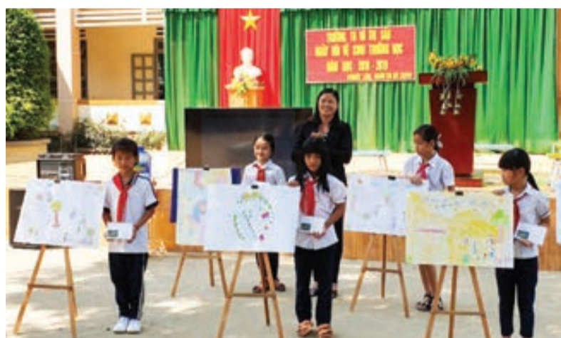
Trao giải tại cuộc thi vẽ của Trường Tiểu học Võ Thị Sáu.

Tiểu học Võ Thị Sáu hiện có 2 điểm trường, 1 điểm trường chính tại trung tâm xã và 1 điểm trường tại thôn Phước Bình cách đó 6 km. Năm học 2018-2019 này, trường có tổng cộng 289 học sinh từ lớp 1 đến lớp 5, trong đó điểm trường Phước Bình có 70 học sinh, 5 lớp học; số