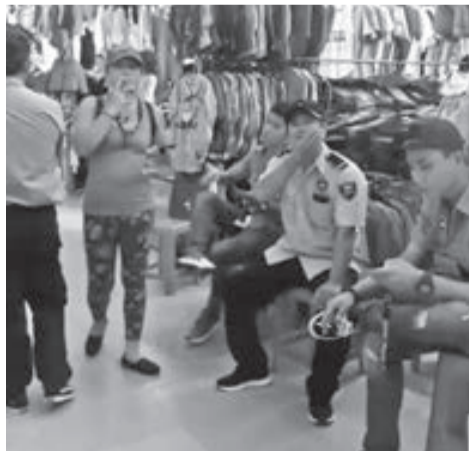
Nhóm người “đòi nợ thuê” dàn hàng ngang trước quầy sạp, đe dọa tiểu thương, thách thức cả chính quyền và gây cản trở nghiêm trọng việc kinh doanh của tiểu thương.

Trước đó, vào tối ngày 8/6, nhóm khoảng 10 người đã tìm đến nhà 3 tiểu thương đe dọa yêu cầu các tiểu thương phải đóng tiền. Một tiểu thương phản ánh: “Khi đến nhà tôi, nhóm người đòi nợ thuê đều bịt khẩu trang, rất hung hãn chửi bới gia đình tôi. Họ đe dọa