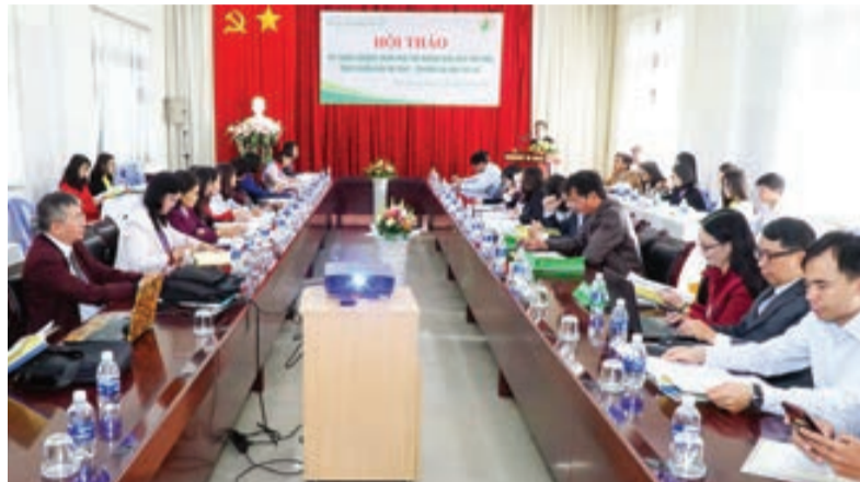
Hội thảo khoa học hoàn thiện chương trình giáo dục tiểu học tại Đại học Đà Lạt.

Chương trình bao gồm 130 tín chỉ, chia làm hai khối: Khối kiến thức đại cương dành cho các ngành