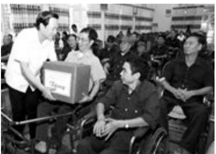
Tặng quà cho người có công.

... Thương binh đang hưởng chế độ mất sức lao động; người hoạt động kháng chiến bị nhiễm chất độc hóa học suy giảm khả năng lao động từ 80% trở xuống đang hưởng trợ cấp ưu đãi hàng tháng; đại diện thân nhân liệt sỹ; người thờ cúng liệt sỹ (trường hợp liệt sỹ không còn thân nhân).