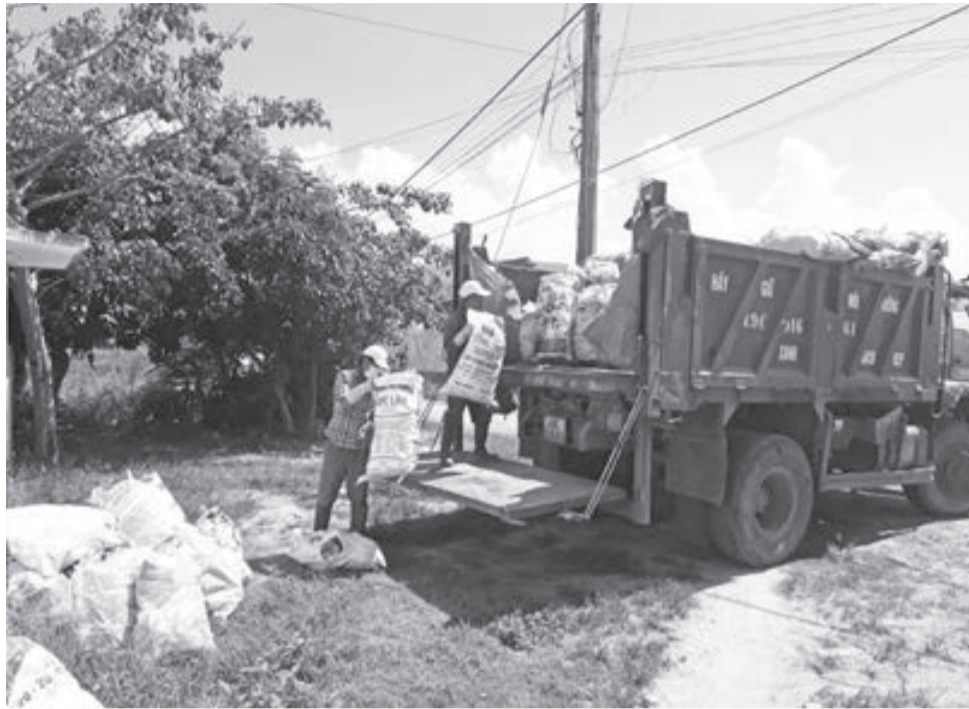
Rác thải nông nghiệp được các CCB thu gom về nơi tập kết để xử lý theo quy trình.