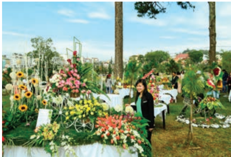
Hoa sẽ là hình ảnh chủ đạo tạo điểm nhấn cho Festival Hoa Đà Lạt 2019.

Là "nhân vật chính" của Festival Hoa Đà Lạt năm 2019, hoa - cây xanh được thành phố tăng cường để duy trì hoa rực rỡ trong suốt thời gian diễn ra Festival. Ngoài việc tổ