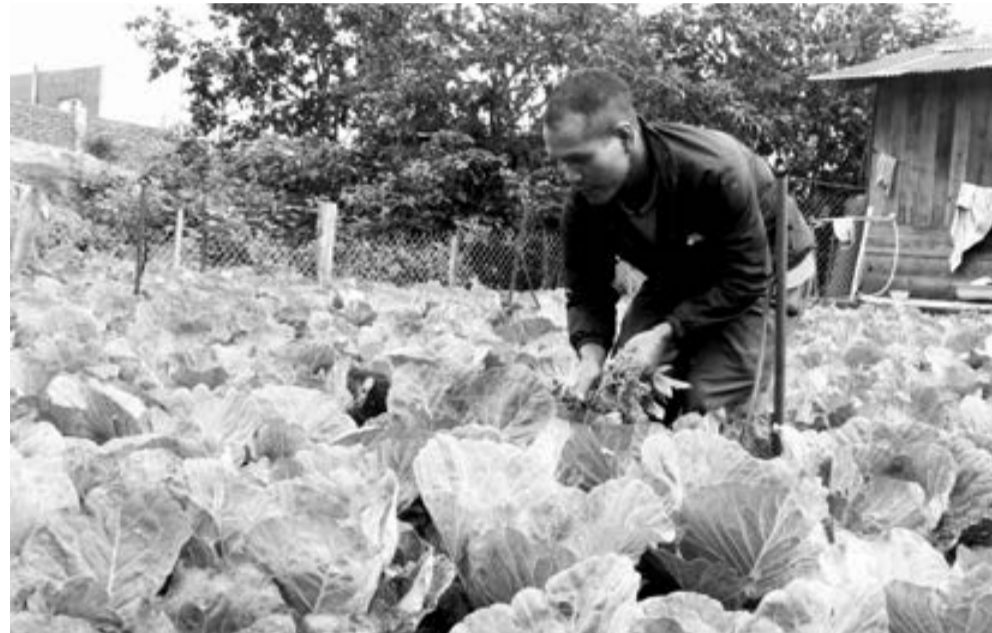
Bà con DTTS ở xã Lát chuyên đổi cơ cấu giống cây trồng, chăm lo sản xuất là một trong những điểm sáng trong thực hiện Chỉ thị 05 ở địa phương này. Ảnh: H.My

Thực hiện Chỉ thị 05 của Bộ Chính trị về “Đẩy mạnh học tập và làm theo tư tưởng, đạo đức, phong cách Hồ Chí Minh” được coi là nhiệm vụ trọng tâm, xuyên suốt của huyện Lạc Dương. Sau 3 năm thực hiện Chỉ thị, những thành tựu đã tươi xanh nhưng những “hạt sạn” thì vẫn còn. Điều đó đặt ra cho địa phương này nhiều nhiệm vụ trước mắt cũng như lâu dài, để Chỉ thị 05 thực sự thấm sâu và lan tỏa.