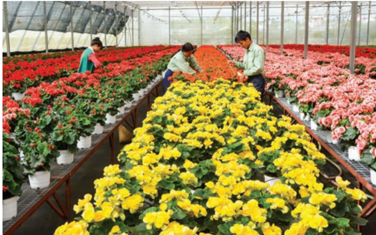
Sản xuất hoa ở Công ty Dalat Hasfarm.

Festival Hoa Đà Lạt - lễ hội đã có thương hiệu của Lâm Đồng, được đông đảo bạn bè trong nước và quốc tế biết đến. Đến hẹn lại lên, cứ 2 năm/lần, lễ hội lại diễn ra trong sự trông chờ, háo hức của người dân và du khách. Là đơn vị chủ trì tổ chức, UBND thành phố Đà Lạt đang gấp rút hoàn thiện kế hoạch cũng như khẩn trương thực hiện công tác chuẩn bị để Festival Hoa lần này có sự đổi mới và ấn tượng.