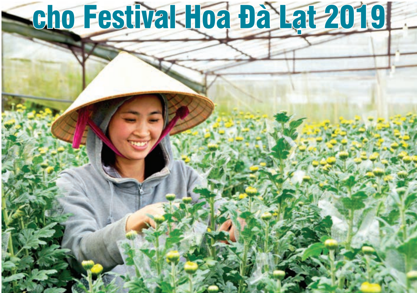
Chăm sóc hoa tại Làng hoa Đa Thiện, Đà Lạt.