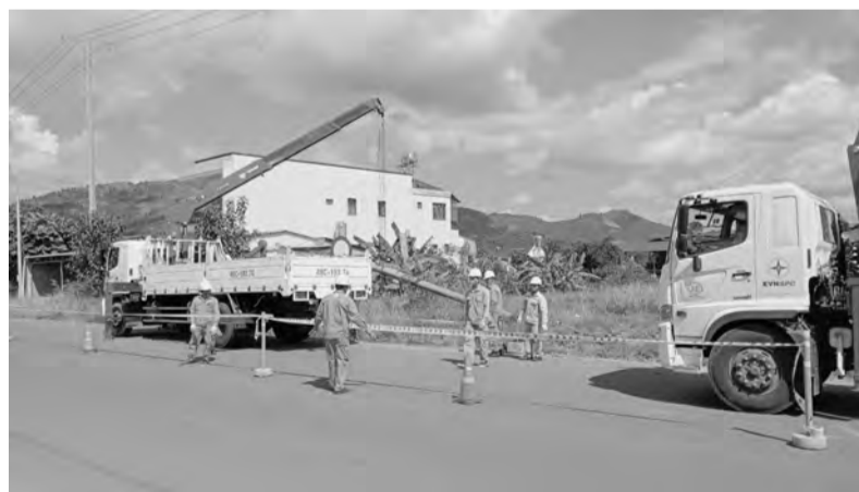
Đưa vật tư, phương tiện ra hiện trường.

Sau đó, bão N đổ bộ vào đất liền đi qua các huyện thuộc tỉnh Lâm Đồng, đến 4 giờ, bão N đã suy yếu thành một