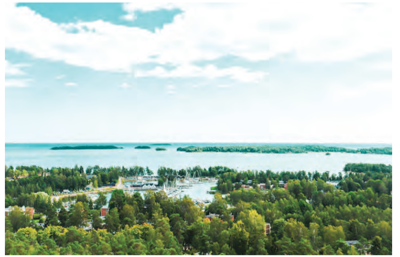
Thành phố Espoo, Phần Lan.