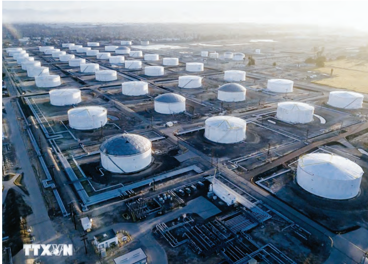
Kho dự trữ dầu thô ở Carson, California, Mỹ.

Giá dầu Brent kỳ hạn tăng 15 xu Mỹ, hay 0,2%, lên 82,75 USD/thùng; giá dầu ngọt nhẹ WTI của Mỹ tăng 12 xu, hay 0,2%, lên 78,62 USD/thùng, đều tăng gần 1% so với phiên trước.