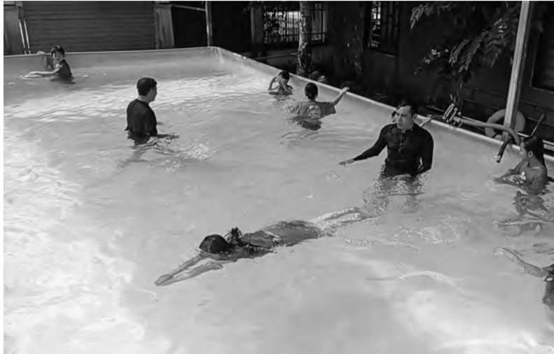
Các đơn vị trên địa bàn huyện Cát Tiên đẩy mạnh dạy bơi cho các em thiếu nhi trong dịp hè.

Những năm qua, công tác chăm sóc, giáo dục thiếu niên, nhi đồng trong dịp hè là một trong những nhiệm vụ trọng tâm được các cấp, ngành trên địa bàn huyện Cát Tiên đặc biệt quan tâm thực hiện với nhiều hoạt động thiết thực. Đặc biệt, năm nay, huyện Cát Tiên triển khai các hoạt động hè gắn với việc thực hiện chương trình bơi an toàn, phòng, chống đuối nước trẻ em.