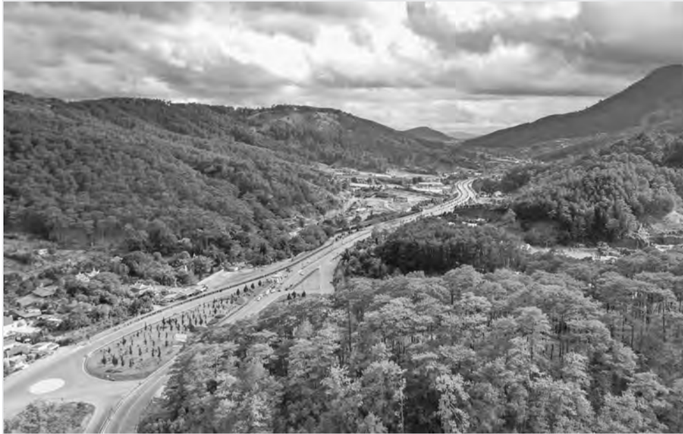
Cao tốc Liên Khương hiện là tuyến cao tốc duy nhất trên địa bàn tỉnh Lâm Đồng nối Đà Lạt với sân bay Liên Khương.

nước tham gia vào dự án để tăng tính khả thi cho dự án, cụ thể là tăng tỷ lệ vốn ngân sách lên từ 49% đến 50%. Theo lý giải của các nhà đầu tư thì hiện tại tỷ lệ góp vốn của nhà nước đối với dự án còn thấp.