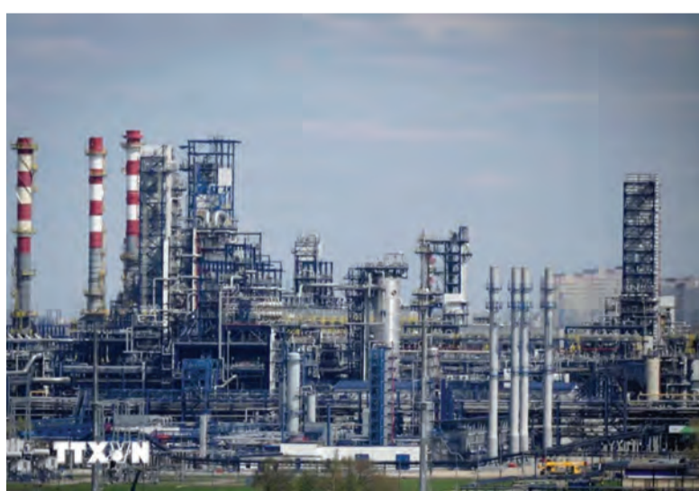
Nhà máy lọc dầu ở ngoại ô Moskva, Nga.

Cuối năm ngoái, chính phủ các nước trong Liên minh châu Âu (EU) thông qua đề xuất của Nhóm các nước công nghiệp phát triển (G7) áp mức giá trần 60 USD/thùng đối với dầu thô xuất khẩu bằng đường biển của Nga.