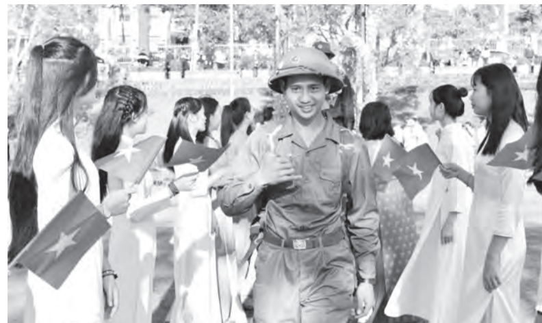
Một năm thắng lợi của Lâm Đồng trong công tác tuyển quân.

2024 có thể xem là một năm thắng lợi của Lâm Đồng trong công tác tuyển chọn, gọi công dân nhập ngũ và tham gia nghĩa vụ quân sự. Theo đó, tỉnh đã hoàn thành 100% chỉ tiêu được giao; các tiêu chí về sức khỏe, trình độ học vấn, chuyên môn kỹ thuật, đảng viên, con cháu cán bộ và công dân tình nguyện đều tăng so với năm 2023.