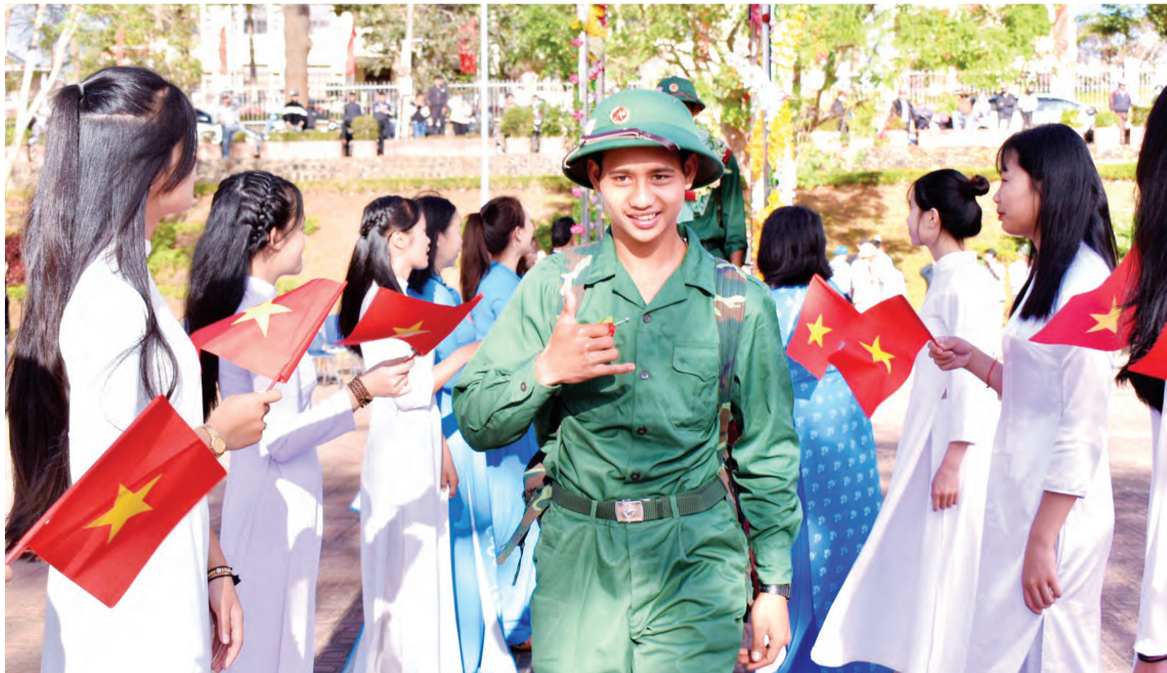
Một năm thắng lợi của Lâm Đồng trong công tác tuyển quân.