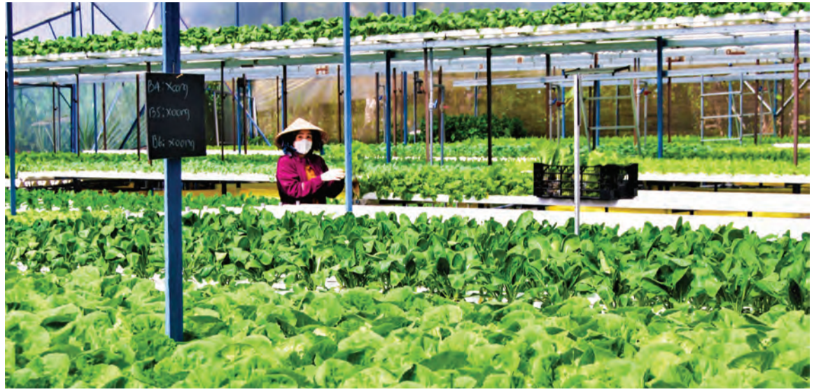
Mục tiêu khuyến nông toàn tỉnh đến năm 2030 tiếp tục chuyển giao ứng dụng nông nghiệp công nghệ cao, công nghệ thông minh và công nghệ chế biến để tăng sức cạnh tranh của nông sản trên thị trường.

Thực hiện Nghị quyết số 21 ngày 27/10/2022 của Tỉnh ủy Lâm Đồng về phát triển nông nghiệp toàn diện, bền vững và hiện đại, đến nay, chương trình khuyến nông trên địa bàn đã ghi nhận những kết quả tích cực.