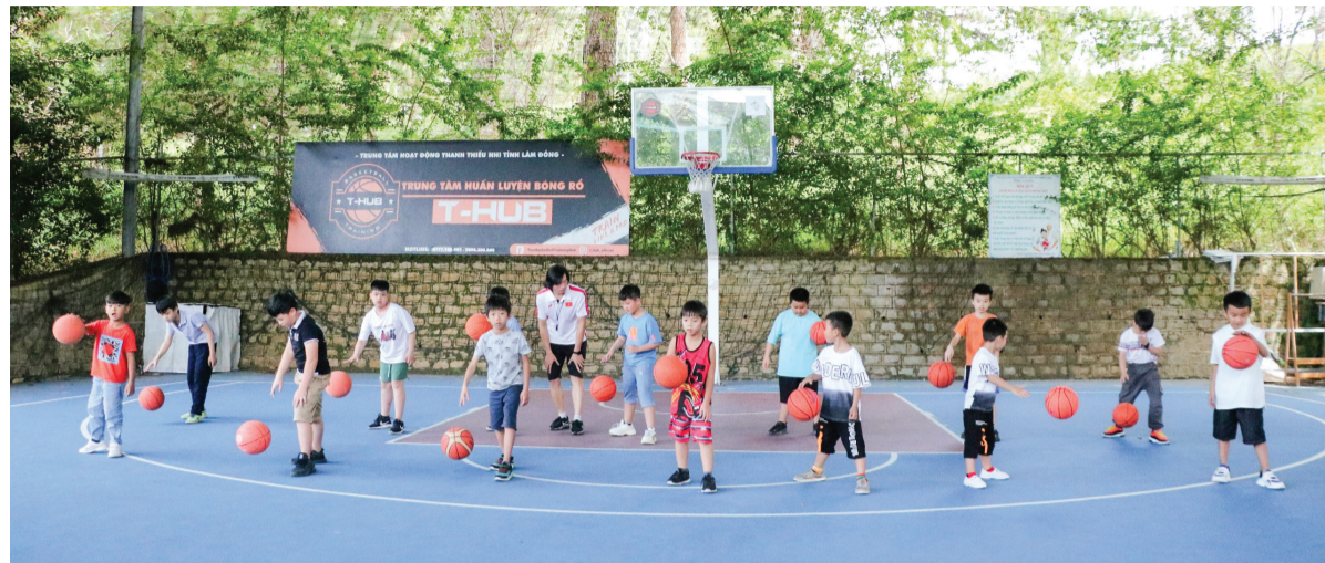
Các em thiếu nhi được tham gia vào những lớp năng khiếu đa dạng, phong phú trong dịp hè.

Ngoài hơn 30 bộ môn năng khiếu truyền thống, mùa hè năm nay, Trung tâm Hoạt động Thanh thiếu nhi (HĐTTN) tỉnh Lâm Đồng còn tổ chức thêm nhiều trại hè và các lớp kỹ năng sống, tạo môi trường để thanh, thiếu nhi trên địa bàn có một mùa hè tươi vui, an toàn, bổ ích.