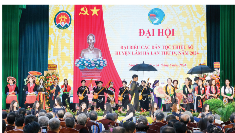
Việc thành lập các CLB, đội, nhóm sẽ là nơi để đồng bào các dân tộc tại Lâm Hà phát huy và duy trì văn hóa vùng, miền.