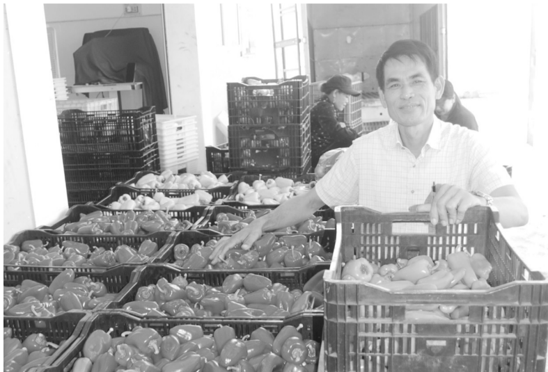
HTX Dịch vụ nông nghiệp tổng hợp An Phú, xã Hiệp An, huyện Đức Trọng đã và đang làm cầu nối tiêu thụ rau, củ, quả của nông dân đến hệ thống siêu thị trong nước.

Toàn tỉnh đến nay có 4 Liên hiệp Hợp tác xã (HTX) nông nghiệp đang hoạt động theo Luật HTX năm 2012 với 25 HTX thành viên. Phân loại có 2 Liên hiệp HTX hoạt động trung bình; 1 Liên hiệp HTX đã củng cố nhân sự, xây dựng phương án kinh doanh và 1 Liên hiệp HTX mới thành lập. Toàn tỉnh cũng có 425 HTX nông nghiệp với 8.818 thành viên, tăng 33 HTX so với năm 2022. Tổng vốn điều lệ hơn 502 tỷ đồng, tăng gần 23 tỷ đồng so với năm 2022. Cụ thể gồm 235 HTX trồng trọt; 17 HTX chăn nuôi; 5 HTX nuôi trồng thủy sản; 1 HTX nước sạch nông thôn và 167 HTX tổng hợp. Bình quân doanh thu khoảng 2,5 tỷ đồng/HTX/năm; thu nhập bình quân khoảng 72 - 75 triệu đồng/la động/năm. Riêng