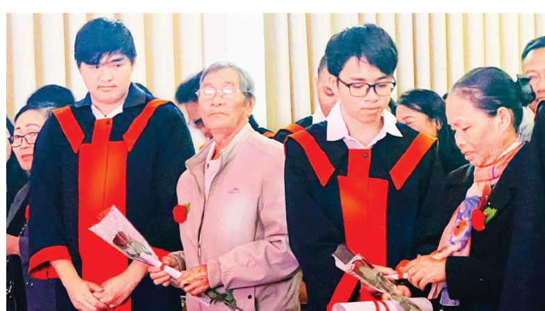
Những bông hoa tươi thắm dâng lên mẹ cha, bày tỏ lòng biết ơn của các em học sinh.

tiếp nhận các em tại ngôi trường này trong một hoàn cảnh hết sức khó khăn khi đại dịch COVID-19 hoành hành; thầy trò gặp nhau qua phần mềm trực tuyến nhưng với sự nỗ lực của tập thể đội ngũ thầy cô giáo trong nhà trường, bằng tình yêu thương và trách nhiệm hướng về các em, đặc biệt là sự quyết tâm vượt qua mọi khó khăn, thử thách của 162 em học sinh hôm nay đang ngồi đây dự lễ tốt nghiệp. Kết quả dành tặng cho thầy trò thật đáng tự hào trong suốt 3 năm học cấp 3, đó là 100% học sinh khối 12 đủ điều kiện tham gia thi tốt nghiệp; 100% học sinh lớp 12 có hạnh kiểm khá tốt, trong đó 91,1% là hạnh kiểm tốt. Đã có những em gặt hái được giải