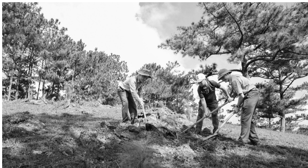
Cán bộ sở, ngành của tỉnh tham gia trồng thông hưởng ứng "Tết trồng cây".

Năm 2024, tổng mức đầu tư các dự án trồng và chăm sóc rừng trồng đã được UBND tỉnh phân bổ chi tiết cho các đơn vị chủ rừng với tổng vốn là 46.980 triệu đồng. Trong đó có 35.158 triệu đồng được bố trí để thực hiện trồng mới 449,32 ha rừng tập trung trên các diện tích đất trồng, đất rừng sau giải toả. Hiện các đơn vị chủ rừng đang tiếp tục