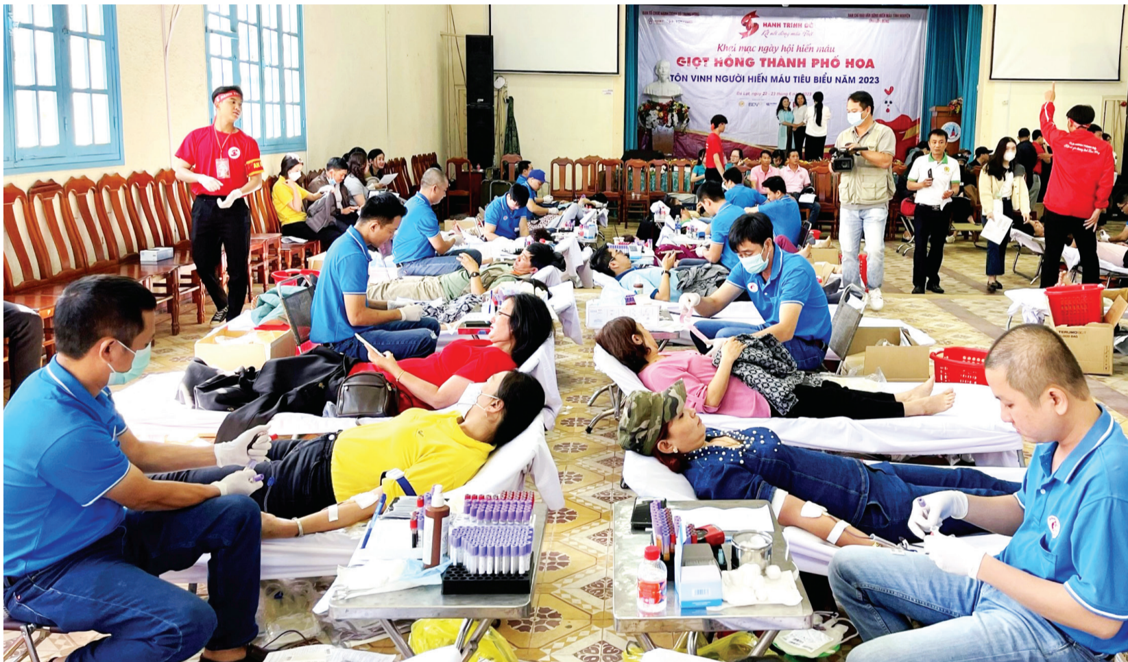
Lâm Đồng là một trong 5 tỉnh, thành phố trong cả nước tổ chức xuyên suốt 12 kỳ Hành trình Đỏ, Ngày hội Hiến máu "Giọt hồng thành phố Hoa".