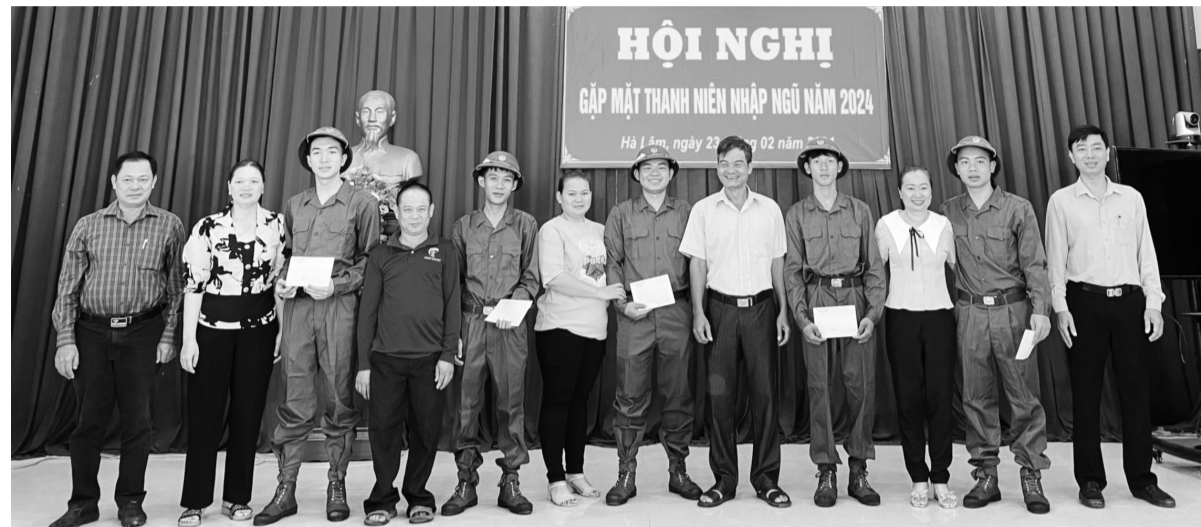
Công tác tạo nguồn kết nạp đảng viên trong lực lượng thanh niên nhập ngũ luôn được huyện thực hiện tốt.

Những năm qua, Đảng bộ huyện Đạ Huoai luôn quan tâm tới công tác phát triển đảng viên nhằm nâng cao năng lực, sức chiến đấu của tổ chức Đảng, lãnh đạo thực hiện thắng lợi nhiệm vụ phát triển kinh tế - xã hội của địa phương. Đạ Huoai luôn xem công tác phát triển đảng viên là một nhiệm vụ quan trọng, thường xuyên, có tính quy luật nhằm tăng cường sức chiến đấu cho Đảng, trẻ hóa đội ngũ đảng viên, bảo đảm tính kế thừa và phát triển của Đảng.