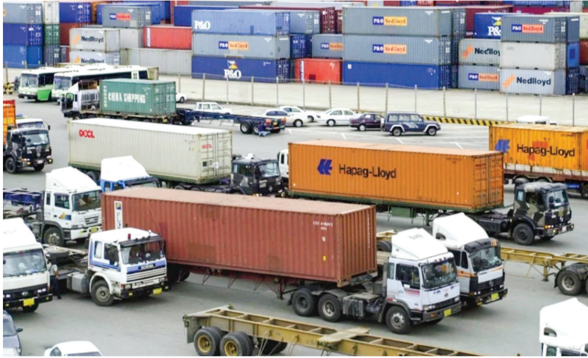
Hàn Quốc đặt mục tiêu thiết lập mạng lưới các hiệp định thương mại tự do lớn nhất thế giới.

Các kế hoạch trên là một phần của "Lộ trình phát triển năng động" của Hàn Quốc, một bộ mục tiêu chính sách dài hạn toàn diện được Bộ Kinh tế và Tài chính Hàn Quốc (MOEF) cùng các bộ liên quan công bố ngày 3/7 nhằm giải quyết tình trạng già tăng trưởng suy yếu của nước này.