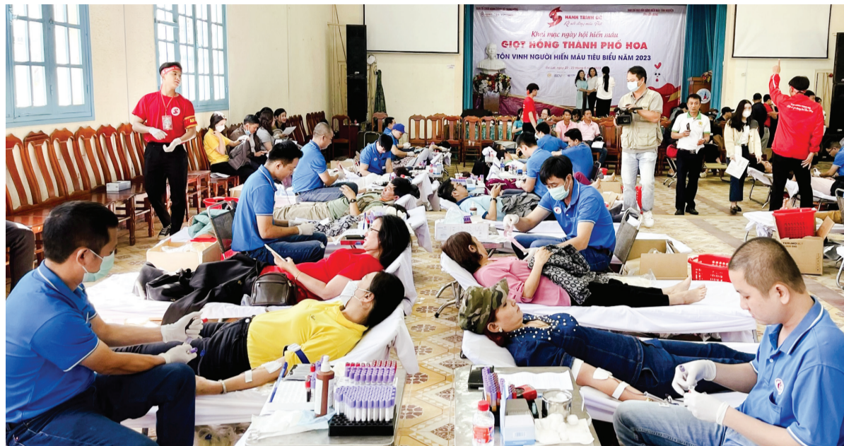
Lâm Đồng là một trong 5 tỉnh, thành phố trong cả nước tổ chức xuyên suốt 12 kỳ Hành trình Đỏ, Ngày hội Hiến máu "Giọt hồng thành phố Hoa".

Sau hơn một thập kỷ tổ chức, Hành trình Đỏ đã trở thành một chiến dịch truyền thông, vận động và tổ chức hiến máu tình nguyện có quy mô lớn nhất ở Việt Nam. Qua 11 kỳ tổ chức (2013-2023), Hành trình Đỏ đã thu hút hàng triệu lượt người tham gia, tổ chức 522 ngày hiến máu với 2.653 điểm hiến máu, tiếp nhận trên 810.000 đơn vị máu. Có 58 tỉnh, thành phố trong cả nước tham gia, nhiều địa phương đã tổ chức Hành trình Đỏ trong nhiều năm liên tiếp. Chương trình góp phần thay đổi nhận thức của hàng triệu người dân