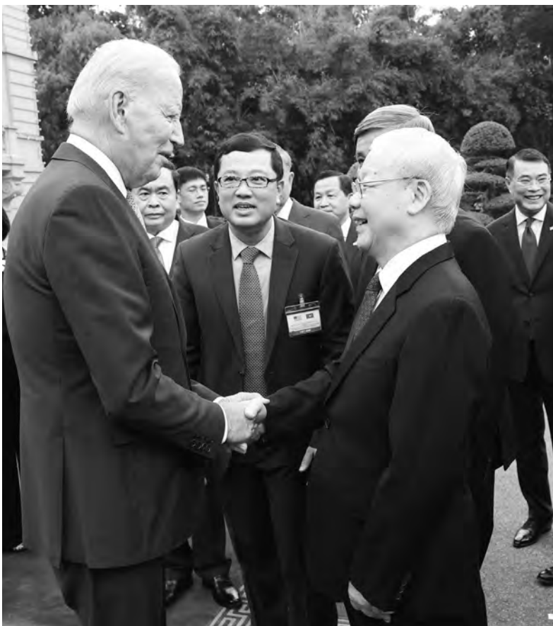
Tổng Bí thư Nguyễn Phú Trọng đón Tổng thống Hoa Kỳ Joe Biden thăm cấp Nhà nước tới Việt Nam.

tham nhũng, tiêu cực, nhất là chống sự suy thoái về tư tưởng chính trị, đạo đức, lối sống và những chuẩn mực đạo đức cách mạng trong giai đoạn mới theo Quy định số 144-QĐ/TW, ngày 9/5/2024, thay mặt Bộ Chính trị, đồng chí đã ký ban hành; từ đó không ngừng xây dựng Đảng ta ngày càng trong sạch, vững mạnh, nâng cao năng lực lãnh đạo, năng lực cầm quyền đáp ứng yêu cầu trong giai đoạn hiện nay. Trong cuốn sách “Kiên quyết, kiên trì đấu tranh phòng, chống tham nhũng, tiêu cực, góp phần xây dựng Đảng và Nhà nước ta ngày càng trong sạch, vững mạnh”, thể hiện tư tưởng xuyên suốt, nhất quán về công tác đấu tranh phòng, chống tham nhũng, tiêu cực với phương châm “không có vùng cấm, không có ngoại lệ”, với quan điểm nhất quán: “Một trong những bài học lớn của công cuộc đổi mới ở Việt Nam là phải giữ vững và đổi mới sự lãnh đạo của Đảng, coi xây dựng Đảng là nhiệm vụ then chốt”. Mặt khác, từ thực tiễn công tác xây dựng Đảng, đồng chí Nguyễn Phú Trọng luôn quan tâm đặc biệt đến công tác đối ngoại của Đảng, dùng đối ngoại để phòng ngừa, ngăn chặn chiến tranh hoặc sớm kết thúc chiến tranh trong vị thế có lợi nhất; đối ngoại luôn phục vụ tốt nhất cho đối nội trong công cuộc xây dựng và bảo vệ Tổ quốc. Chính vì thế, trong tác phẩm: “Xây dựng và phát triển nền đối