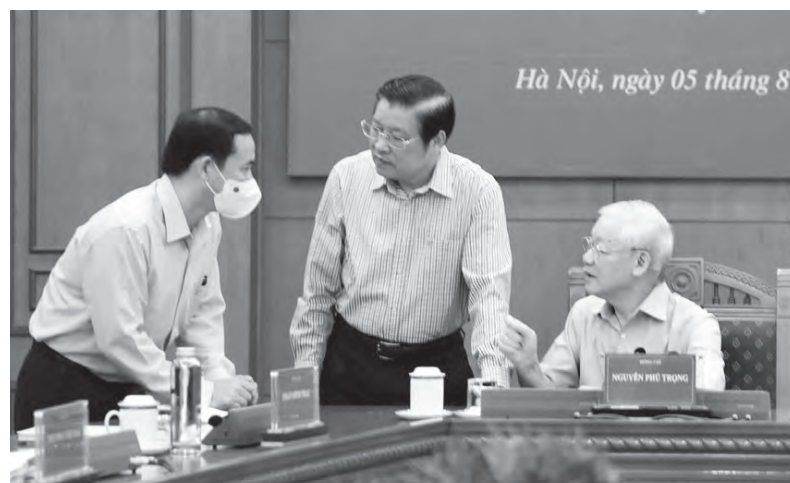
Tổng Bí thư Nguyễn Phú Trọng trao đổi với đồng chí Phan Đình Trạc và đồng chí Nguyễn Thái Học trước giờ họp Ban Chỉ đạo tháng 8/2021.

Sau khi bàn thảo cuốn sách được hoàn thành, Tổng Bí thư mang vào bệnh viện để đọc và âm thầm sửa. Tôi lại được gọi vào bệnh viện để lấy bản thảo. Tại đây, tôi được tận mắt chứng kiến Tổng Bí thư vẫn mang tài liệu vào làm việc hằng ngày. Tổng Bí thư thân tình nói với tôi: “Mình đã đọc và sửa vào đây đến trang 12, anh