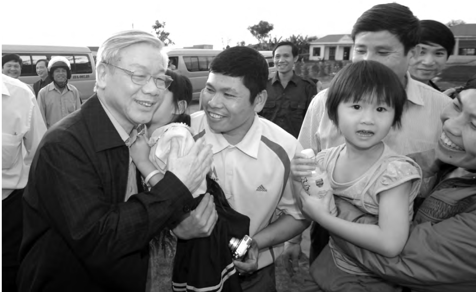
Tổng Bí thư Nguyễn Phú Trọng thân thiện với các em nhỏ ở xã Đông Thanh (Lâm Hà).

Với 80 tuổi đời, 57 năm tuổi Đảng và cũng là 57 năm công tác, đồng chí Tổng Bí thư Ban Chấp hành Trung ương Đảng Cộng sản Việt Nam Nguyễn Phú Trọng đã trở về cõi vĩnh hằng cùng các bậc tiền nhân, để lại nỗi tiếc thương vô hạn và lòng kính yêu sâu sắc trong lòng mọi người về nhân cách, lẽ sống của một con người “... đời người chỉ sống có một lần phải sống sao cho khỏi xót xa, ân hận vì những năm tháng đã sống hoài, sống phí, để khỏi hổ thẹn vì những việc làm ti tiện, đốn hèn bị mọi người khinh bỉ, để khi nhắm mắt xuôi tay ta có thể tự hào rằng: Tất cả đời ta, tất cả sức ta đã hiến dâng cho sự nghiệp cao đẹp nhất trên đời - sự nghiệp đấu tranh giải phóng dân tộc, giải phóng con người, mang lại hạnh phúc cho Nhân dân”.