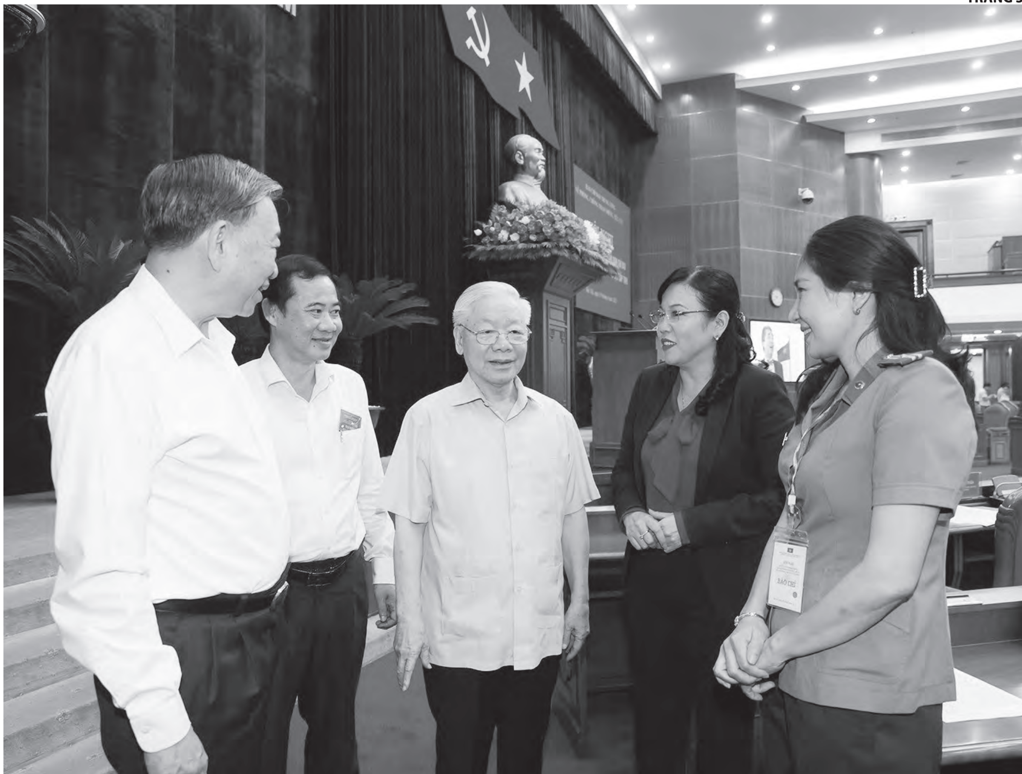
Tổng Bí thư Nguyễn Phú Trọng trao đổi với các đại biểu bên lễ Hội nghị toàn quốc Sơ kết 1 năm hoạt động của Ban Chỉ đạo về phòng, chống tham nhũng, tiêu cực tỉnh, thành phố trực thuộc Trung ương tháng 6/2023.