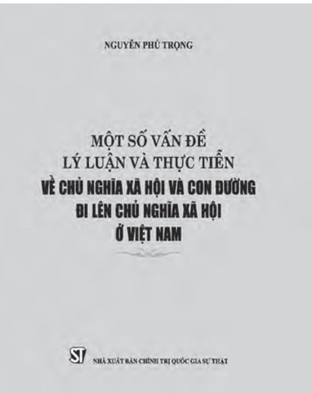
Cuốn sách "Một số vấn đề lý luận và thực tiễn về chủ nghĩa xã hội và con đường đi lên chủ nghĩa xã hội ở Việt Nam" của Tổng Bí thư.