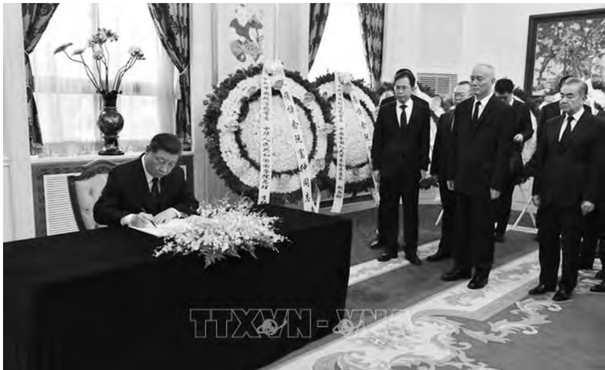
Tổng Bí thư, Chủ tịch Trung Quốc Tập Cận Bình ghi sổ tang tại Lễ viếng Tổng Bí thư Nguyễn Phú Trọng ở Đại sứ quán Việt Nam tại Trung Quốc.

Cộng hòa Pháp Gérard Larcher nhắc lại kỷ niệm về những nội dung đã trao đổi với Tổng Bí thư Nguyễn Phú Trọng trong chuyến thăm Việt Nam của ông vào tháng 12/2022.