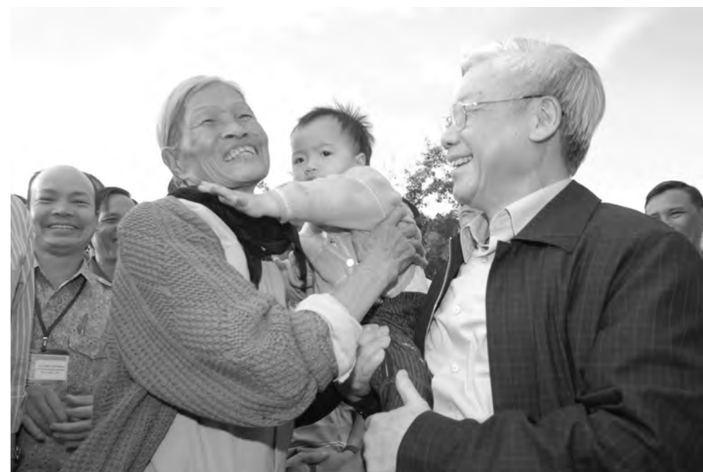
Tổng Bí thư Nguyễn Phú Trọng với bà con xã Đông Thanh (Lâm Hà).

Thư luôn dành sự quan tâm và chỉ đạo với phương châm “Tạo điều kiện để phụ nữ phát triển là quan điểm xuyên suốt của Đảng”. Bản thân tôi vinh dự được tham dự Đại hội đại biểu phụ nữ toàn quốc lần thứ XIII, nhiệm kỳ 2022-2027, được Tổng Bí thư Nguyễn Phú Trọng gửi hoa chúc mừng Đại hội và gặp gỡ cán bộ, hội viên phụ nữ cả nước bên lề Đại hội với những chia sẻ, nhắn nhủ về công tác Hội và phong trào phụ nữ... Trong những năm qua, sự tiến bộ của phụ nữ được nâng lên rõ rệt, Luật Bình đẳng giới được tuyên truyền và nhận thức của toàn xã hội về vai trò, vị trí của phụ nữ cũng ngày được khẳng định.