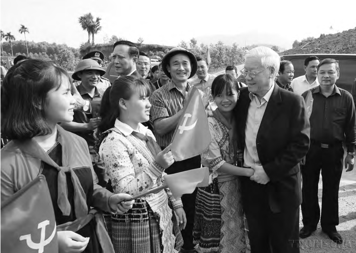
Tổng Bí thư Nguyễn Phú Trọng với các tầng lớp Nhân dân các dân tộc tỉnh Yên Bái dự Tết trồng cây.

Có tư duy rõ ràng, mạch lạc của nhà nghiên cứu khoa học, phát biểu của Tổng Bí thư về vấn đề nào rõ vấn đề đó. Cách nói với bà con, với đồng bào các dân tộc thì mộc mạc, gần gũi, nhưng với cán bộ chủ chốt ở tỉnh lại khác, phù hợp từng đối tượng, từng cuộc làm việc, dễ nghe, dễ hiểu.