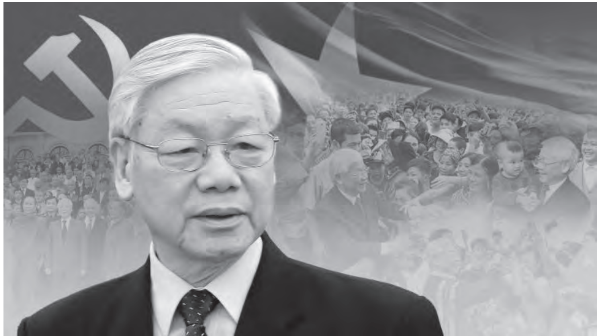
Tổng Bí thư Nguyễn Phú Trọng - Nhà lãnh đạo lỗi lạc, trọn đời vì nước, vì dân.