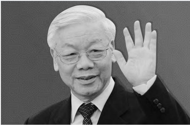
Tổng Bí thư Nguyễn Phú Trọng.