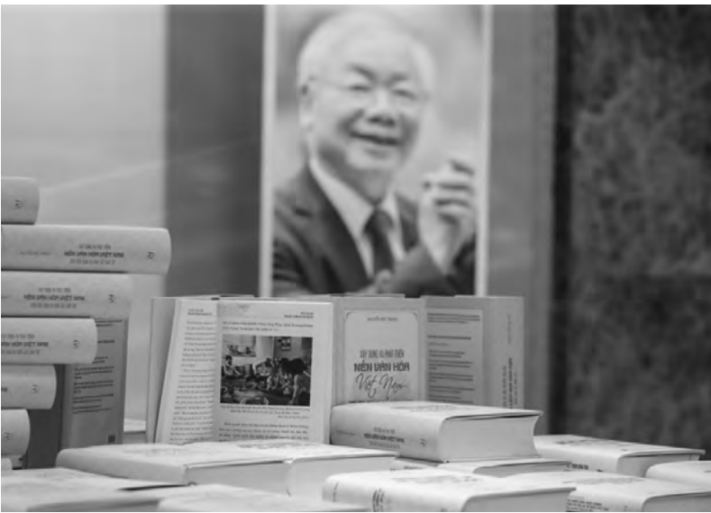
Cuốn sách Xây dựng và phát triển nền văn hóa Việt Nam tiên tiến, đậm đà bản sắc dân tộc của Tổng Bí thư Nguyễn Phú Trọng do Ban Tuyên giáo Trung ương chủ trì, phối hợp với Bộ Văn hóa, Thể thao và Du lịch, Nhà xuất bản Chính trị quốc gia Sự thật, Tạp chí Cộng sản, Thông tấn xã Việt Nam và các cơ quan liên quan tổ chức biên tập, xuất bản.

Trước hết, văn hóa là giá trị sáng tạo tinh hoa, tinh túy; là hồn cốt, sinh khí; là sức mạnh tinh thần to lớn của