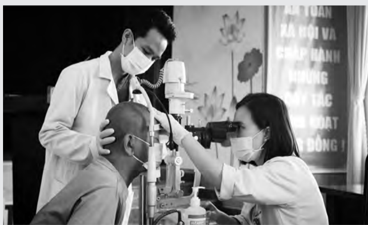
Đoàn y, bác sĩ Bệnh viện Mắt Sài Gòn - Đà Lạt tổ chức khám, đo thị lực miễn phí cho người dân trên địa bàn TP Bảo Lộc.

Trong thời gian trên, đoàn y, bác sĩ Bệnh viện Mắt Sài Gòn - Đà Lạt cùng với sự hỗ trợ của các tình nguyện viên Hội Chữ thập đỏ TP Bảo Lộc sẽ có mặt tại tất cả các