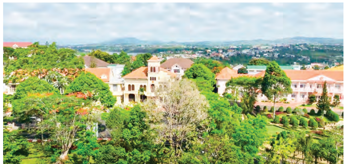
Công trình tọa lạc giữa cao nguyên Di Linh trù phú.