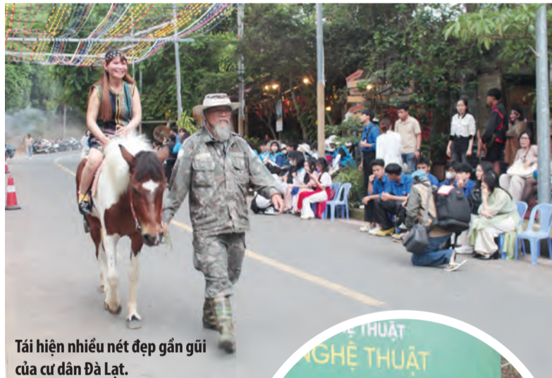
Tái hiện nhiều nét đẹp gắn gũi của cư dân Đà Lạt.

diễn âm nhạc, biểu diễn thời trang đường phố, cuộc thi âm nhạc, trình diễn nghi thức đội theo chủ đề, diễn tấu công chiêng, múa xoang, trình diễn nghệ thuật đường phố, trình diễn những bài ca về Đà Lạt, tham quan các tác phẩm nhiếp ảnh, điêu khắc, hiện vật văn hóa các dân tộc Tây Nguyên, thưởng lãm không gian nghệ thuật sắp đặt, tọa đàm giao lưu với các nghệ sĩ thành danh trên cả nước.