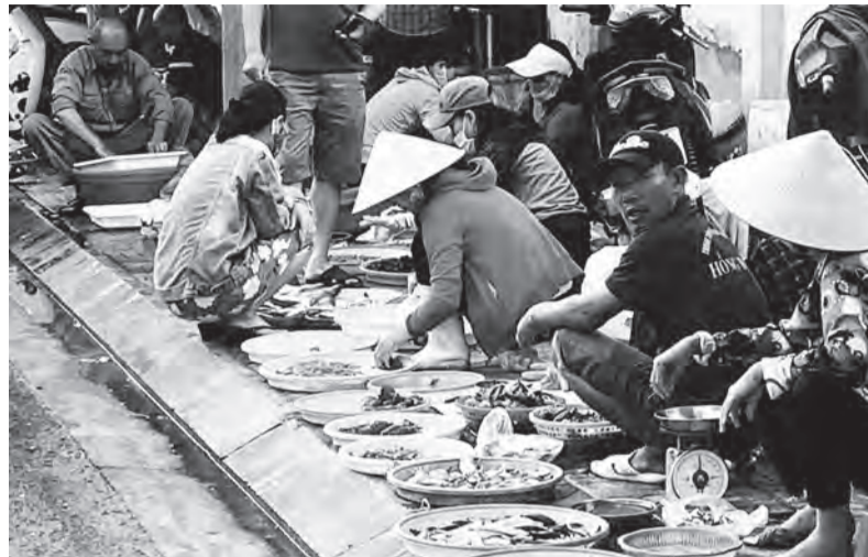
Chợ cá sớm mai sương.

Đạo này theo quy định của thành phố về ổn định trật tự, giải tỏa việc lấn chiếm lòng lề đường để kinh doanh buôn bán, các chợ đã vào trật tự, riêng các chị bán cá lại chuyển sang mô hình bán di động. Điển hình như trên đường Võ Thị Sáu, đoạn đi qua chợ Bình Tân, các chị bán cá chuyển qua mô hình bán cá di chuyển, là cá để trong các rổ nhỏ, chạy theo khách đi ngang mời mua. Cách bán cá di động thường mỗi khay nửa ký, khách mua khỏi cần chọn lựa. Thật ra, khu chợ di động đường Võ Thị Sáu cá rất tươi ngon, do nguồn cung cấp từ cảng cá Cửa Bể, và những người bán cá di động ở đây đa phần là người dân