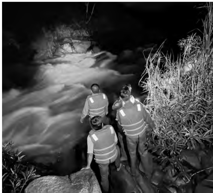
Lực lượng chức năng huyện Di Linh giải cứu nhóm thanh niên mắc kẹt trên sông Đồng Nai trong mùa mưa 2024.

Những cơn mưa lớn, kéo dài thời gian qua đã phát sinh nhiều tình huống về ngập úng cục bộ, sạt trượt đất ở nhiều mức độ khác nhau, gây thiệt hại về người và tài sản tại một số địa phương trên địa bàn tỉnh. Để bảo đảm an toàn tính mạng, tài sản của người dân, tại địa bàn huyện Di Linh, các lực lượng, đơn vị chức năng đã và đang chủ động thực hiện nhiều biện pháp để sẵn sàng ứng phó với thiên tai.