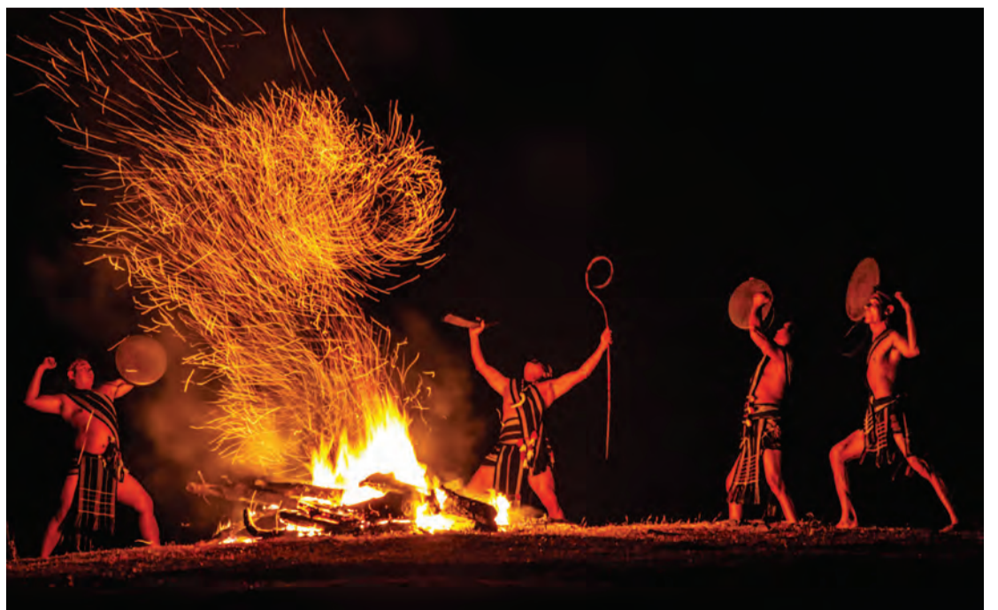
Ngọn lửa cao nguyên.