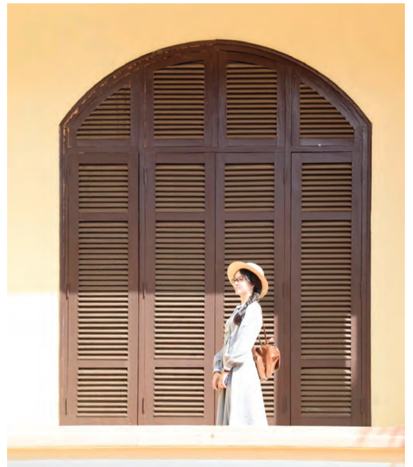
Hệ thống cửa gỗ vẫn nguyên vẹn sau hơn 110 năm tồn tại.

là di tích lịch sử văn hóa cấp tỉnh hoặc cấp quốc gia. Khi đó, công trình Tòa thị chính tỉnh Đồng Nai Thượng sẽ thành điểm nhấn du lịch của huyện Di Linh; đồng thời, huyện sẽ được hỗ trợ, hướng dẫn các bước cần thiết để bảo tồn, tu bổ và phát huy giá trị của công trình này. Và, một ngày không xa, người dân, du khách sẽ có cơ hội được chiêm ngắm công trình kiến trúc lịch sử trong không gian một trung tâm hành chính cấp huyện đẹp, luôn xanh mát và rực rỡ sắc hoa Di Linh.