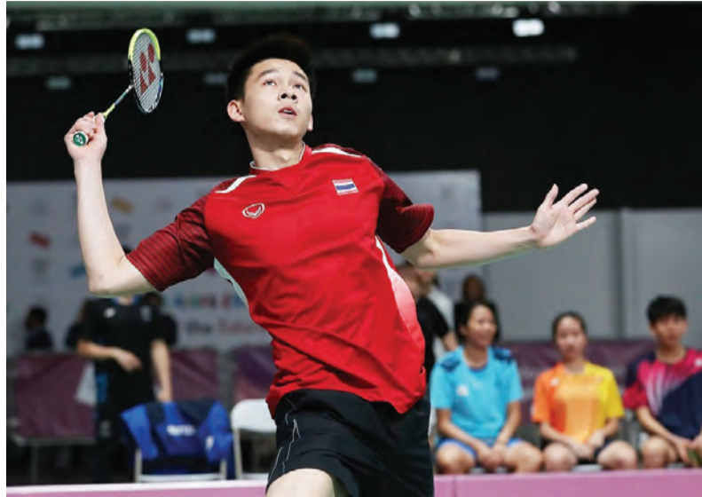
Thái Lan hiện có đương kim vô địch cầu lông đơn nam thế giới Kunlavut Vitidsarn, trong đội hình của mình, ứng viên giành HC Vàng Olympic năm nay.

Tuy nhiên, quốc gia mạnh nhất về thể thao và dẫn đầu khu