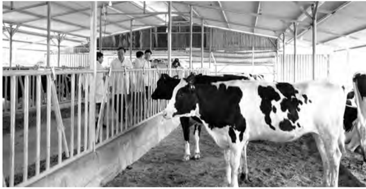
Huyện Cát Tiên hiện có 270 con bò cho khai thác sữa để bán với tổng sản lượng bình quân mỗi ngày đạt hơn 6,2 tấn sữa.

Tuy nhiên, qua thực tế nuôi đã phát sinh một số khó khăn