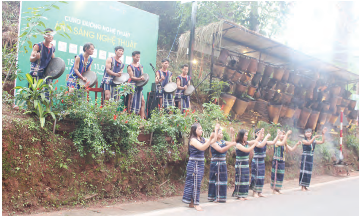
Đội công chiêng Đưng K’no biểu diễn vũ điệu xoang.

Khúc của lãng mạn trên đường Lý Tự Trọng (Phường 2, TP Đà Lạt) những ngày này đang mang trên mình diện mạo mới. Cung đường nghệ thuật với chủ đề “Ánh sáng nghệ thuật” được mở ra tạo không gian kết nối trong cộng đồng, một nơi giao lưu độc đáo, sáng tạo cho cả người dân địa phương và du khách.