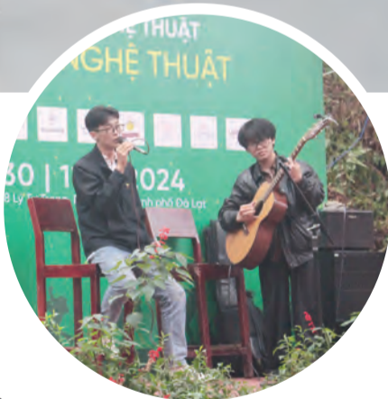
Biểu diễn các ca khúc hát về Đà Lạt.

Nhiếp ảnh gia Thái Phiến giải bày: “Người nghệ sĩ sinh ra để làm đẹp cho đời và mong muốn mang cái đẹp đến với nhiều người. Cung đường “Nghệ thuật ánh sáng” đã mở ra không gian đẹp đa sắc màu để nghệ sĩ chúng tôi góp sức đưa tác phẩm của mình đến với công chúng”. Gặp gỡ trò chuyện cùng người xem, nói về hành trình sáng tạo nghệ thuật của mình, nghệ sĩ Thái Phiến đã làm thay đổi quan niệm, cái nhìn của mọi người về ảnh nude, nghệ thuật nude bởi sự lao động nghệ thuật nghiêm túc của ông, làm bật lên cái đẹp của tạo hóa, cái