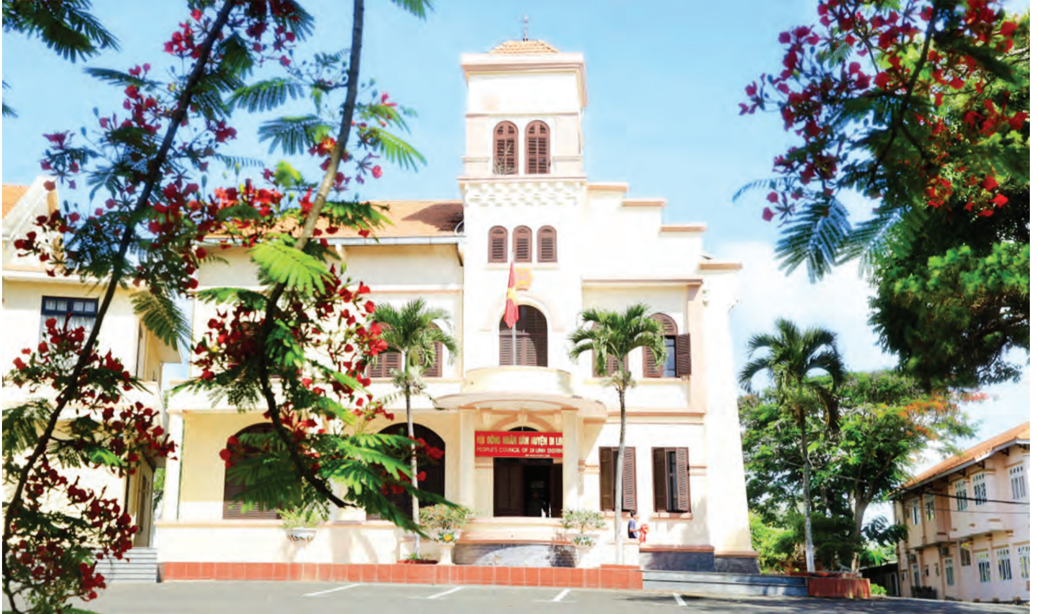
Tòa nhà Thị chính tỉnh Đồng Nai Thượng nay là trụ sở Hội đồng Nhân dân huyện Di Linh.