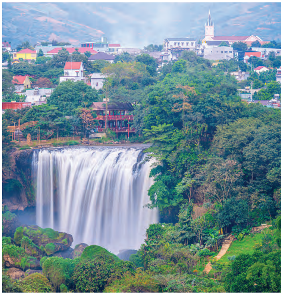
Thác Voi.