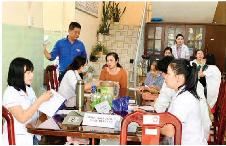
Câu lạc bộ Thấy thuốc trẻ Trung tâm Y tế huyện phối hợp tổ chức tư vấn, khám, chữa bệnh và phát thuốc miễn phí cho người dân thuộc đối tượng chính sách xã Quảng Ngãi.

Ngoài ra, tuổi trẻ Cát Tiên còn xung kích, đi đầu trong thực hiện Phong trào "Toàn dân đoàn kết