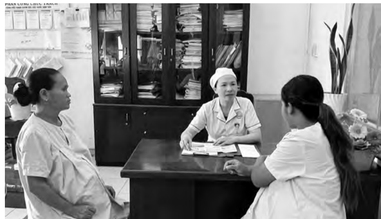
Tư vấn cho các mẹ bầu chuẩn bị sinh con về chương trình sàng lọc sơ sinh tại Khoa Sản của Trung tâm Y tế huyện Di Linh.

dự phòng hiện đại, dùng kỹ thuật y khoa sử dụng các biện pháp thăm dò, xét nghiệm mẫu máu gót chân và xét nghiệm đặc hiệu đối với trẻ ngay trong những ngày đầu sau khi sinh để chẩn đoán xác định những trường hợp nghi ngờ mắc bệnh thông qua việc sàng lọc. Sàng lọc sơ sinh nhằm tìm kiếm để phát hiện ra các bệnh liên quan đến nội tiết, rối loạn di truyền ngay khi đưa trẻ ra đời; cho phép phát hiện một số rối loạn bẩm sinh và di truyền ở trẻ sơ sinh như: thiếu năng trí tuệ, thiếu men G6PD (glucose 6 phosphate dehydrogenase), suy giáp bẩm sinh, tăng sản tuyến thượng thận bẩm sinh... ảnh hưởng đến sự phát triển thể chất, tâm thần, thậm chí