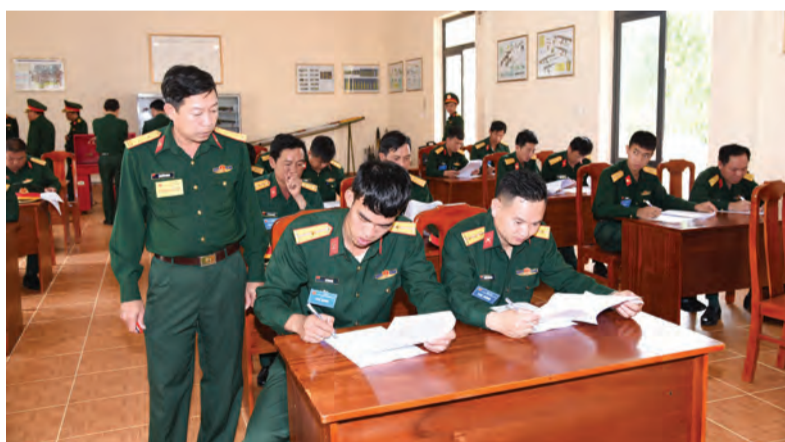
Phương pháp dạy - học, huấn luyện, diễn tập và chấm thi được Học viện thường xuyên đổi mới, đảm bảo nâng cao chất lượng giáo dục - đào tạo.

Năm học 2023-2024 vừa qua, Học viện Lục quân tiếp tục khẳng định vị thế trong hệ thống nhà trường quân đội. Với tinh thần trách nhiệm cao và nỗ lực không ngừng của tập thể cán bộ, giảng viên và học viên, Học viện đã hoàn thành xuất sắc mọi nhiệm vụ, góp phần nâng cao sức mạnh tổng hợp của Quân đội Nhân dân Việt Nam, đáp ứng yêu cầu bảo vệ Tổ quốc trong tình hình mới.