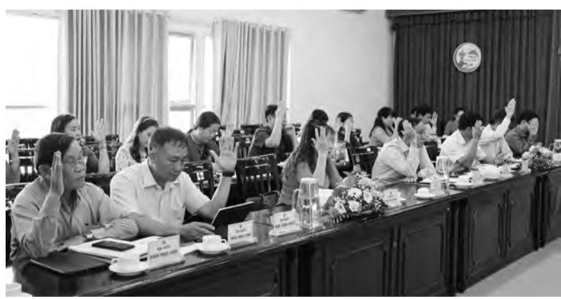
Đại biểu HĐND các xã, thị trấn tham dự các kỳ họp đã biểu quyết thống nhất tán thành sáp nhập 3 huyện phía Nam.

các xã, thị trấn trong huyện đã đồng loạt lấy ý kiến cử tri về sáp nhập 3 huyện Đạ Huoai, Đạ Tẻh, Cát Tiên thành một đơn vị hành chính huyện mới. Kết quả, toàn huyện Cát Tiên có 30.082 cử tri tham gia lấy ý kiến. Qua đó đã có 98,37% cử tri trong huyện tán thành chủ trương sáp nhập 3 huyện Đạ Huoai, Đạ Tẻh, Cát Tiên thành một đơn vị hành chính huyện mới; 85,55% cử tri trong huyện đồng ý lấy tên huyện mới là Đạ Huoai. "Việc sắp xếp các đơn vị hành chính cấp huyện, xã là chủ trương lớn nhưng quá trình triển khai thực hiện chắc chắn sẽ nảy sinh nhiều khó khăn, phức tạp.