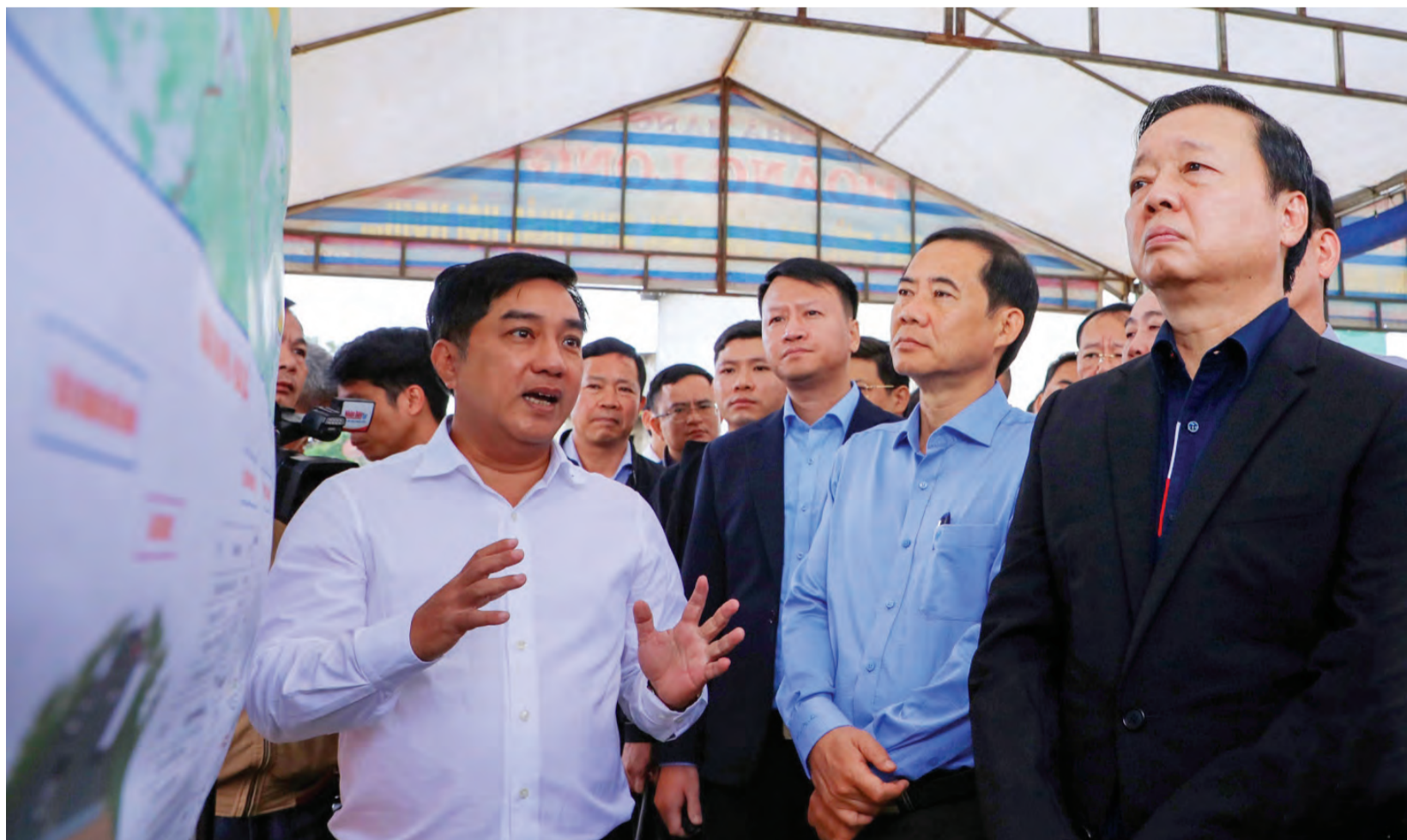
Đại diện Tập đoàn Đèo Cả trình bày một số khó khăn, vướng mắc ở đoạn cao tốc Tân Phú - Bảo Lộc với Phó Thủ tướng và lãnh đạo tỉnh Lâm Đồng.