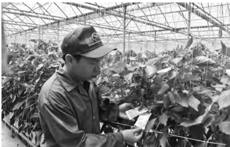
Sử dụng thiên địch thay thế thuốc bảo vệ thực vật hóa học tại một trong những nông trại nhà kính của Dalat Hasfarm.