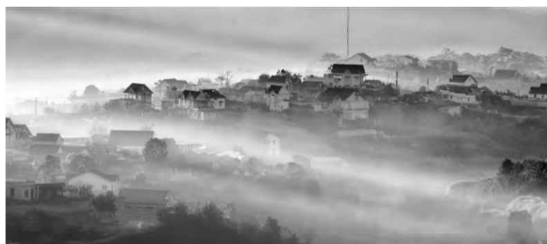
Đà Lạt sở hữu nhiều giá trị thiên nhiên đẹp để kiến tạo hệ giá trị kinh doanh xanh.

Omirita Resort rộng trên 40 ha - nơi sinh sống của 22.000 cây thông, nơi để các nhà khoa học chia sẻ những kiến thức về sinh học, từ các sinh vật đơn bào đến các sinh vật đa bào, từ lịch sử tiến hóa của các loài sinh vật cho đến những trải nghiệm "tắm" dưới rừng thông, một điểm đưa khách du lịch trở về với mẹ thiên nhiên, giúp khách du lịch hiểu và yêu hơn sự đa dạng sinh học, cả động