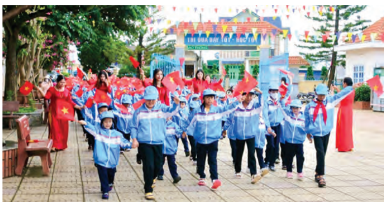
Học sinh trường vùng sâu, vùng xa, vùng DTTS huyện Lạc Dương đón chào năm học mới.

Là địa phương có học sinh dân tộc thiểu số (DTTS) chiếm tỷ lệ cao, nhưng trong năm học 2023-2024, ngành Giáo dục huyện đã huy động trên 17% trẻ nhà trẻ, 85% trẻ mẫu giáo DTTS đến trường. 100% trường, lớp mầm non, mẫu giáo thực hiện Chương trình giáo dục mầm non quốc gia phù hợp với văn hóa vùng, miền của trẻ; 7/7 trường mầm non triển khai thực hiện có