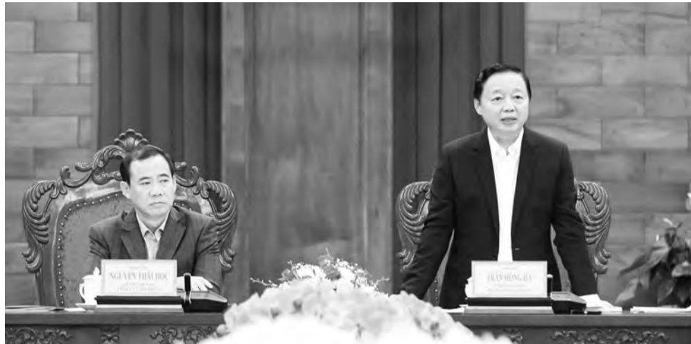
Phó Thủ tướng Chính phủ Trần Hồng Hà và Quyền Bí thư Tỉnh ủy Lâm Đồng Nguyễn Thái Học chủ trì buổi làm việc.

N gày 4/9, tại TP Đà Lạt, Phó Thủ tướng Trần Hồng Hà và Đoàn công tác Chính phủ có buổi làm việc với lãnh đạo tỉnh Lâm Đồng cùng các đơn vị, địa phương liên quan để giải quyết các khó khăn, vướng mắc của Dự án đường bộ Cao tốc Tân Phú (Đông Nai) - Bảo Lộc, Bảo Lộc - Liên Khương và Nha Trang - Đà Lạt.