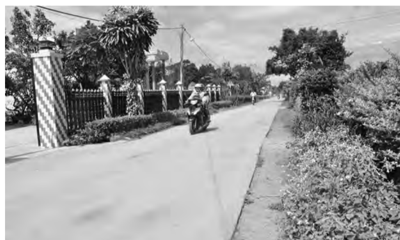
Một con đường xanh, sạch, đẹp tại Quang Lập - Đơn Dương, xã trong diện sắp xếp sáp nhập đơn vị hành chính trong năm nay.

thuộc cơ quan chuyên môn trực thuộc UBND tỉnh; giảm 14 cơ quan, đơn vị thuộc ngành dọc Trung ương đóng trên địa bàn và giảm 10 hội đặc thù tại địa bàn các huyện; giảm 95 biên chế so với năm 2024 (khi chưa sáp nhập), tương ứng 24,2% nên tổng các trường hợp dôi dư khoảng 54 người.