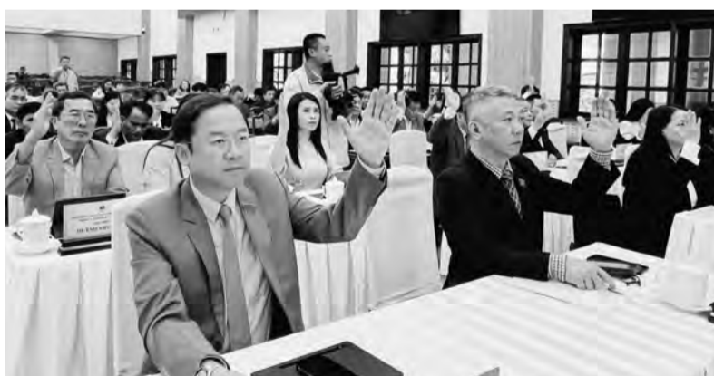
Đại biểu HĐND tỉnh biểu quyết thông qua Nghị quyết sắp xếp đơn vị hành chính cấp huyện, xã giai đoạn 2023 - 2025.