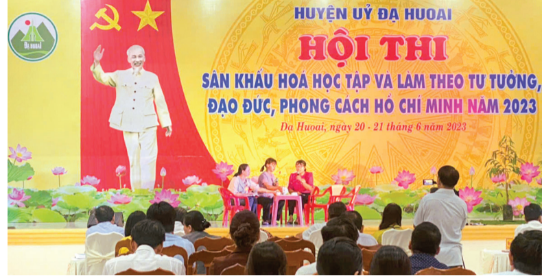
Huyện Đạ Huoai tổ chức Hội thi sân khấu hóa Học tập và làm theo tư tưởng, đạo đức, phong cách Hồ Chí Minh.

Đẩy mạnh học tập và làm theo tư tưởng, đạo đức, phong cách Hồ Chí Minh; Huyện ủy Đạ Huoai đã tăng cường công tác lãnh, chỉ đạo cấp ủy, chính quyền, Mặt trận Tổ quốc và các đoàn thể từ huyện đến cơ sở nhằm nâng cao nhận thức cho cán bộ, đảng viên trong thực hiện nhiệm vụ; phát huy hiệu quả của các phong trào, mô hình.