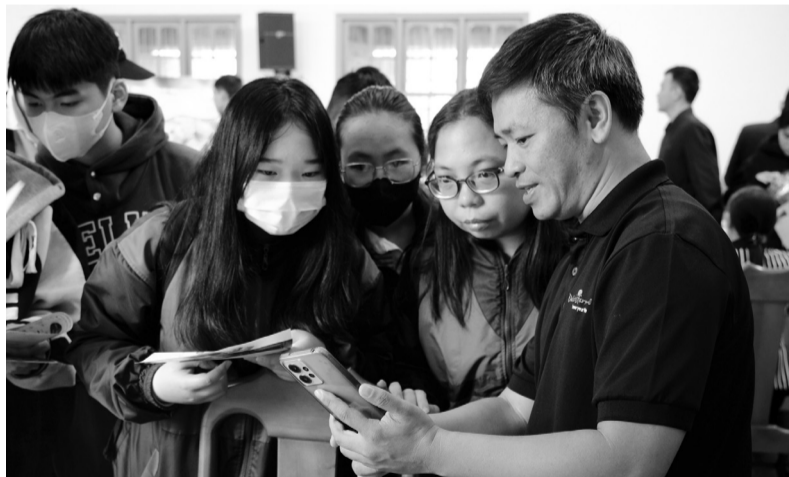
Các doanh nghiệp có yêu cầu cao về kỹ năng mềm khi tuyển dụng.

Cụ thể hơn, trong năm 2024, dự kiến những tháng cuối năm, nhóm ngành nông - lâm nghiệp sẽ tuyển dụng 2.000 vị trí việc làm, trong đó, chủ yếu là tuyển dụng công nhân kỹ thuật có kỹ năng mềm. Với nhóm ngành du lịch - dịch vụ, dự kiến xu hướng tuyển dụng là 2.500 vị trí