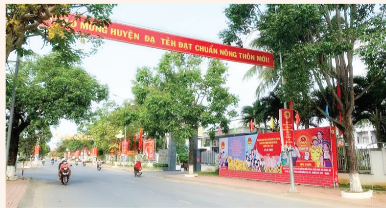
ĐVHC mới sẽ làm việc tập trung tại Trung tâm hành chính hiện có của huyện Đạ Tẻh hiện nay. Trong ảnh: Một con đường tại khu vực trung tâm thị trấn Đạ Tẻh.

Ngành chức năng Lâm Đồng đã lên phương án chi tiết việc sắp xếp lại hệ thống trụ sở làm việc, quản lý tài sản công của các cơ quan, tổ chức tại các đơn vị hành chính (ĐVHC) cấp huyện ở 3 huyện Đạ Huoai, Đạ Tẻh, Cát Tiên và tại 10 xã khi thực hiện sắp xếp sáp nhập thành ĐVHC mới trong giai đoạn 2023-2025.