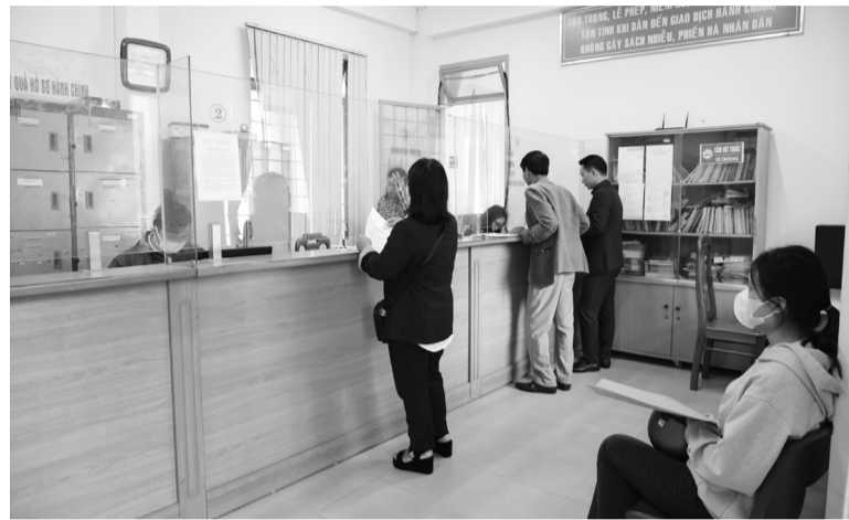
Cán bộ cấp xã ngày càng được chuẩn hoá về chuyên môn, nghiệp vụ. Trong ảnh: Cán bộ trẻ Bộ phận Một cửa của UBND xã Tân Hội, Đức Trọng tiếp nhận thủ tục hành chính.

Đề án tuyển chọn, đào tạo và bồi dưỡng trí thức trẻ là người dân tộc gốc Tây Nguyên để tăng cường đội ngũ Phó Chủ tịch UBND các xã thuộc tỉnh Lâm Đồng đã đạt được những thành công. Cụ thể, Đề án tuyển chọn, đào tạo, bồi dưỡng trí thức trẻ là người dân tộc gốc Tây Nguyên để tăng cường về làm Phó Chủ tịch UBND các xã thuộc tỉnh Lâm Đồng (Đề án 50) được triển khai thực hiện từ năm 2013 theo Quyết định số 1028/QĐ-UBND, ngày 29/5/2013 của UBND tỉnh Lâm Đồng. Đề án cũng tuyển chọn được 43 đội viên tham gia lớp bồi dưỡng và được bố trí công tác về các xã trong tỉnh. UBND tỉnh cũng đã triển khai Dự án 600 Phó Chủ tịch xã và đã tuyển chọn được 5 Phó Chủ tịch xã thuộc huyện Đam Rông. Sau khi kết thúc Dự án có 1 đồng chí bố trí vào chức danh Phó Trưởng Ban Dân tộc HĐND huyện; 1 đồng chí giữ vị trí Phó Bí thư Đảng ủy, Chủ tịch UBND xã; 3 đồng chí tiếp tục giữ chức vụ Phó Chủ tịch UBND xã.