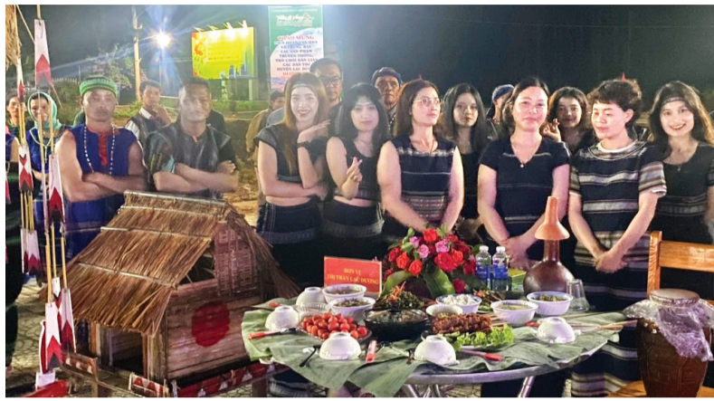
Bản sắc văn hóa truyền thống được các DTTS trên địa bàn tỉnh giữ gìn và phát huy.

Những năm qua, việc thực hiện chính sách dân tộc về văn hóa - xã hội luôn được Tỉnh ủy, HĐND, UBND tỉnh cũng như các sở, ban, ngành, các tổ chức chính trị - xã hội và Nhân dân quan tâm, tập trung ưu tiên thực hiện ở những vùng có điều kiện kinh tế - xã hội đặc biệt khó khăn. Đặc biệt là việc ban hành các nghị quyết, quy định, các chương trình, dự án... nhằm giải quyết kịp thời những khó khăn ở các xã nghèo, vùng đồng bào DTTS như: Nghị quyết số 67/NQ-HĐND ngày 8/12/2017 quy định một số chính sách hỗ trợ phát triển sản xuất tại các xã nghèo trên địa bàn