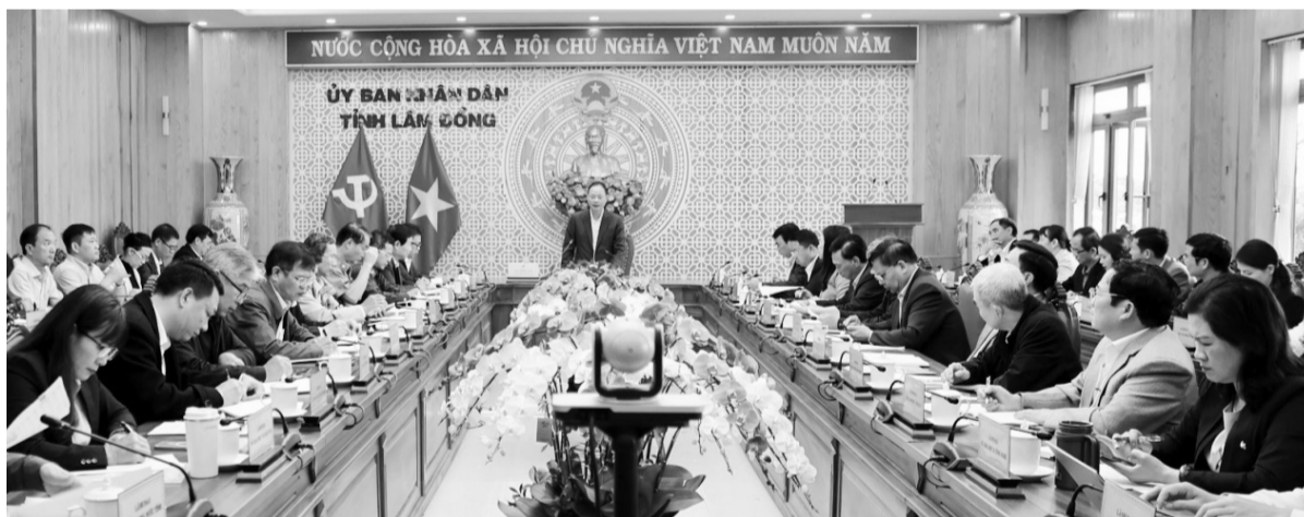
Toàn cảnh hội nghị.

Bên cạnh những kết quả đạt được, tình hình kinh tế - xã hội vẫn gặp nhiều khó khăn, thách thức như: Phát sinh dịch bệnh tiêu chảy trên đàn bò sữa tại một số địa phương trên địa bàn tỉnh gây thiệt hại về tài sản của người dân. Giải ngân vốn đầu tư công tỷ lệ đạt thấp (chỉ đạt 24,5% kế hoạch); công tác bồi thường, giải