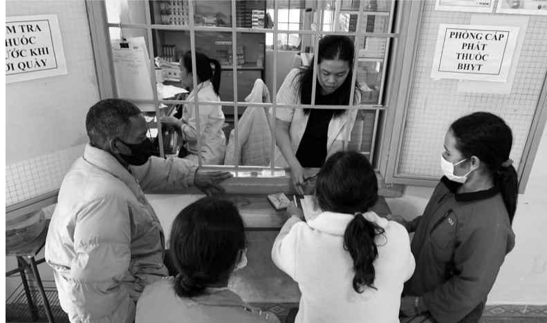
Cấp phát thuốc BHYT tại tuyến y tế cơ sở.

UBND tỉnh Lâm Đồng vừa ban hành kế hoạch thực hiện Chiến lược quốc gia về phòng, chống kháng thuốc giai đoạn 2024-2030, tầm nhìn đến năm 2045 kiểm soát cơ bản tình trạng kháng thuốc trên địa bàn tỉnh; có hệ thống giám sát kháng thuốc, sử dụng, tiêu thụ kháng sinh của tỉnh hoạt động hiệu quả.