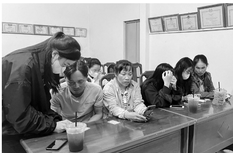
Các tổ công nghệ số cộng đồng ở địa phương tận tình hướng dẫn người dân tiếp cận dễ dàng hơn với các ứng dụng, dịch vụ công trực tuyến.

Đầu năm 2024, xã Lạc Lâm được huyện Đơn Dương chọn thí điểm xây dựng xã nông thôn mới (NTM) thông minh, với mục tiêu không chỉ nâng cao đời sống người dân mà còn tạo ra một môi trường sống hiện đại, an toàn và tiện ích. Để đạt được mục tiêu này, chính quyền địa phương đã nỗ lực không ngừng trong việc thực hiện các nội dung, mục tiêu và chỉ tiêu thành phần, đặc biệt chú trọng vào việc đẩy mạnh chuyển đổi số trong cải cách hành chính (CCHC). Đây là một trong những nền tảng quan trọng nhằm xây dựng chính quyền điện tử, tạo cơ sở cho xã nông thôn mới thông minh.