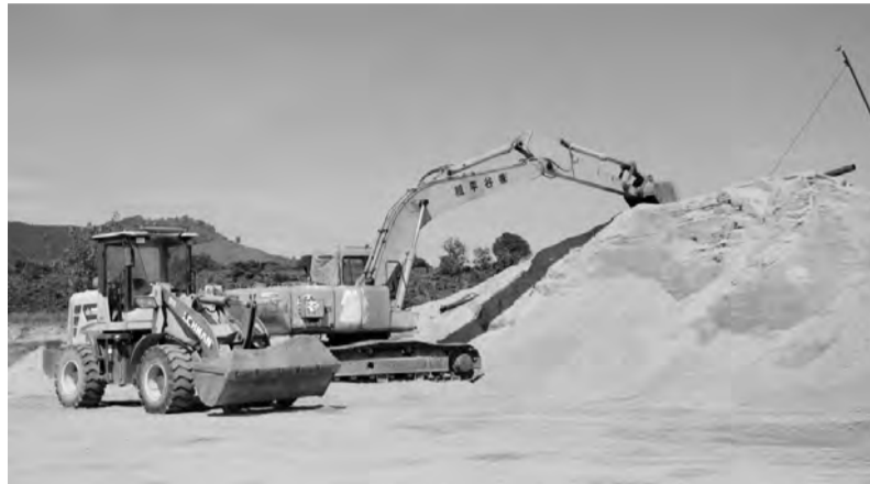
Quản lý tài nguyên khoáng sản hiệu quả góp phần thúc đẩy phát triển kinh tế - xã hội của địa phương.

Thời gian qua, huyện Đam Rông đã chú trọng triển khai đồng bộ các giải pháp nhằm nâng cao hiệu quả quản lý nhà nước về tài nguyên khoáng sản. Điều này góp phần quan trọng trong việc thúc đẩy phát triển kinh tế - xã hội, nhất là việc triển khai các chương trình, dự án trọng điểm trên địa bàn huyện và đảm bảo an ninh trên địa bàn.