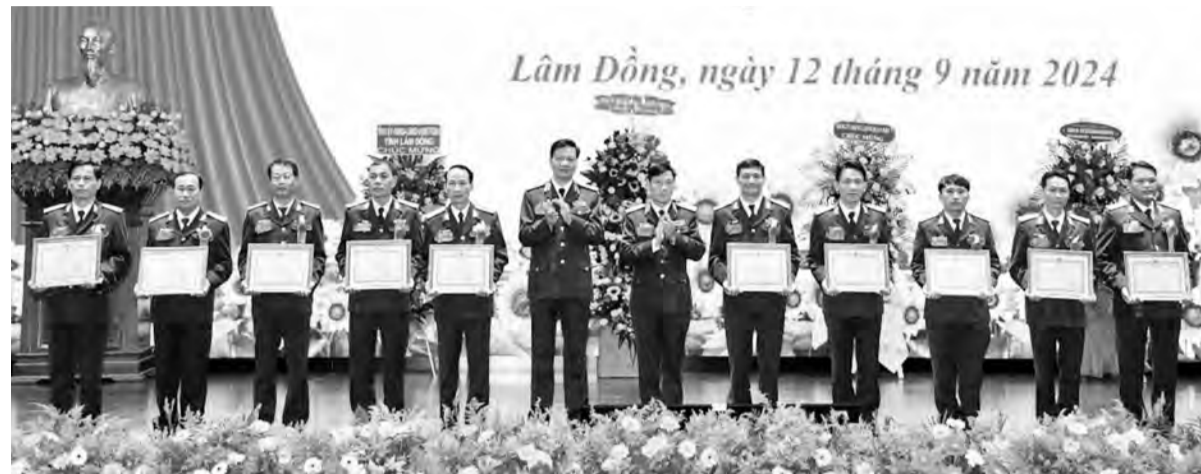
Nhiều tập thể có thành tích xuất sắc được Học viện Lục quân khen thưởng tại Đại hội TĐQT, giai đoạn 2019 - 2024.

5 năm qua, Phong trào thi đua Quyết thắng (TĐQT) đã được Học viện Lục quân triển khai toàn diện, sâu rộng và đạt được nhiều kết quả nổi bật. Phong trào đã trở thành nguồn động lực quan trọng, thúc đẩy cán bộ, giảng viên, học viên, nhân viên, chiến sĩ toàn Học viện nỗ lực thi đua, rèn luyện, hoàn thành xuất sắc mọi nhiệm vụ được giao.