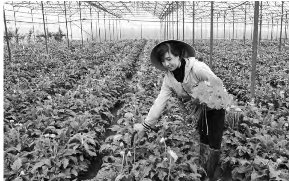
Thu hoạch hoa đồng tiền tại Đơn Dương.

rộng và tính đến nay, Lâm Đồng đã phát triển được 234 chuỗi liên kết với 31.092 hộ liên kết, quy mô liên kết trong trồng trọt đạt 52.897 ha với sản lượng đạt 589.261 ha.