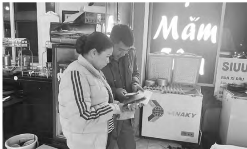
Tuổi trẻ Công an TP Đà Lạt hướng dẫn người dân cài đặt tài khoản định danh điện tử.