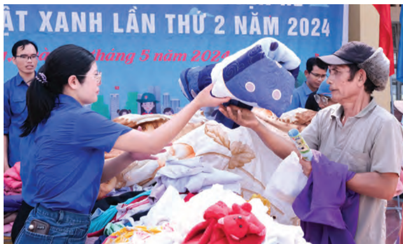
Tuổi trẻ toàn tỉnh đã thực hiện nhiều hoạt động ý nghĩa, thiết thực tại các xã vùng sâu, vùng xa, vùng đồng bào dân tộc thiểu số.

Đơn cử như Chiến dịch Kỳ nghỉ hồng, đây là hoạt động được tổ chức