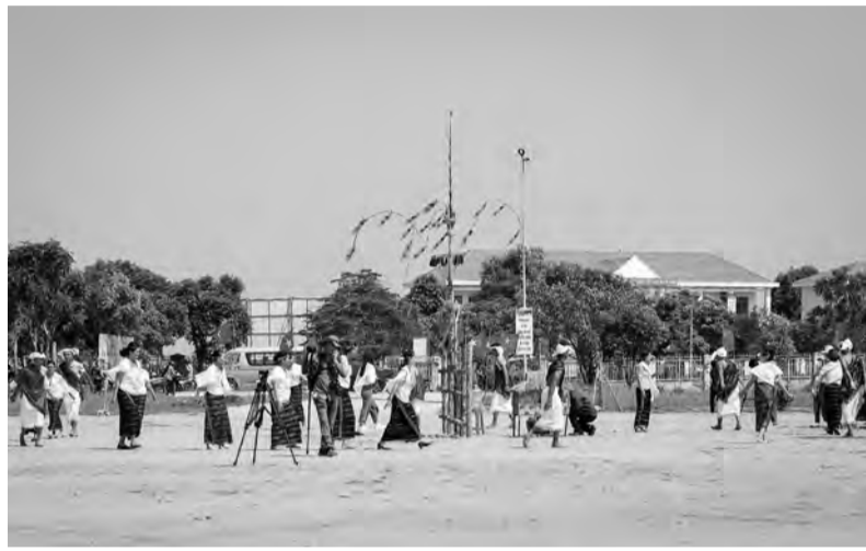
Bà con DTTS mùa mừng lúa mới ở Tà In, Đức Trọng.

Với mục tiêu nâng cao đời sống cho đồng bào dân tộc thiểu số (DTTS), gìn giữ và phát huy nét đẹp văn hóa truyền thống và phát triển, một số địa phương của tỉnh Lâm Đồng đã đề xuất triển khai các dự án tái định cư kết hợp với bảo tồn văn hoá. Theo đó, ý tưởng biến một giải pháp xã hội thành một mô hình phát triển bền vững cho đồng bào DTTS đang nhận được sự quan tâm không chỉ của người dân mà cả những người làm văn hoá và du lịch.