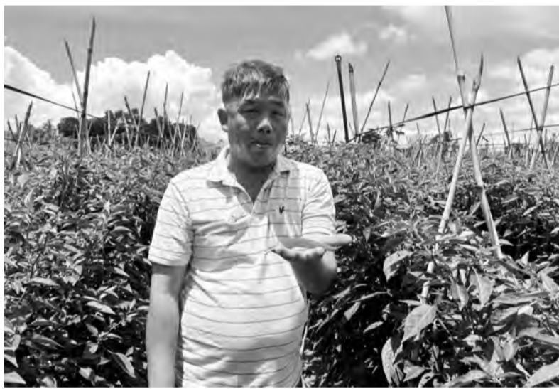
Người Pré canh tác ớt sừng ngoài trời.

“Bà con trồng ớt sừng nhiều vì cây ớt khá dễ tính, trồng ngoài trời cũng hiệu quả. Đặc biệt, những mảnh đất trồng rau màu, trồng cây 1 vụ được bà con chuyển hết sang trồng ớt sừng cho hiệu quả kinh tế cao hơn, thu nhập đều đặn hơn. Chúng tôi thường xuyên động viên bà con chuyển đổi đất năng suất thấp sang trồng các loại rau màu cho kinh tế cao”, Trưởng thôn Trương