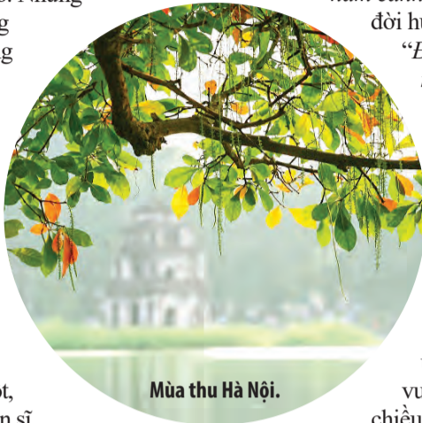
Mùa thu Hà Nội.

“ Đêm, cái đêm rút qua gầm cầu/ Anh đã hẹn ngày mai trở lại ”. Ta chú ý nhịp điệu câu thơ như dừng lại đột ngột, như hình ảnh người chiến sĩ dừng lại để nhận thêm bó hoa, như cái bắt tay ôm hôn siết chặt của người lính về giải phóng thủ đô với những người dân Thủ đô đổ ra đường chào mừng ngày chiến thắng. Câu thơ tả thực để rồi ngân vang một hào hứng trữ tình lẫn mạn bay bổng: “ Sóng sóng Hồng vô bờ hát mãi/ Đò niềm tin là khúc khải hoàn ca ”. Đoàn quân trở về trong sắc đỏ cờ hoa hồng lên sắc mặt. Đoàn quân mang trong mình tình yêu Hà Nội, tình yêu đất nước mà con sông Hồng đỏ nặng phù sa là một biểu tượng hùng vĩ và thân thiết để “đò niềm tin” để “vô bờ hát mãi”. Có một con sông Hồng chảy vào lòng Hà Nội trong “Cảm xúc tháng Mười” thật hùng tráng và hoan ca.