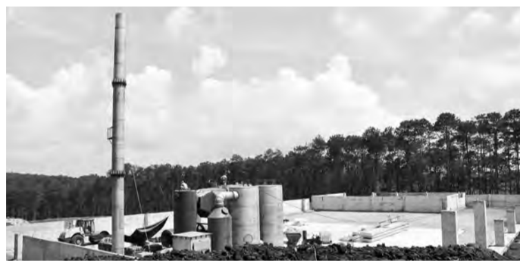
Khu xử lý rác thải mới với hệ thống lò đốt đang được lắp đặt tại huyện Di Linh.

trong tổng số 10 bãi nêu trên sẽ được đầu tư trong thời gian đến, gồm bãi rác Ka Đô -