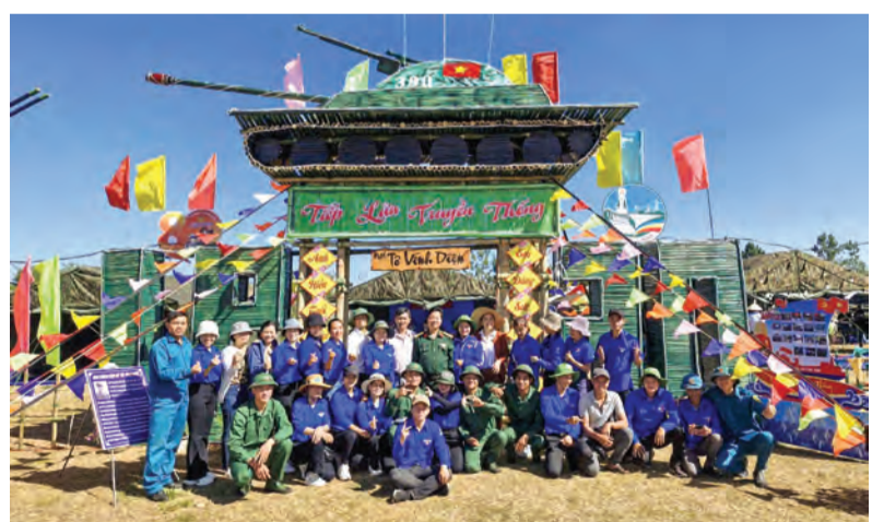
Thanh niên xã Lộc Phú luôn năng động, sáng tạo, thể hiện tinh yêu Tổ quốc bằng những việc làm thiết thực, cụ thể.

Hiện nay, Hội LHTN xã duy trì có hiệu quả 2 đội hình thanh niên xung kích bảo vệ môi trường, ứng phó với biến đổi khí hậu, tổ chức nhiều đợt ra quân nhằm dọn dẹp vệ sinh, góp ngày công giúp bà con Nhân dân tu sửa nhà cửa, khắc phục hậu quả do mưa bão. Hội tiếp tục phát triển mới, đồng thời củng cố và duy trì hoạt động của các tổ đội công của 8/8 chi hội giúp nhau làm ăn hoạt động khá hiệu quả, nhất là vào các mùa vụ. Đến nay, đã có 3 đề án thanh niên khởi nghiệp được vay vốn của tỉnh, toàn xã có 84 hộ thanh niên tiếp cận với nguồn vốn vay từ Ngân hàng Chính sách xã hội huyện với tổng số hơn 6 tỷ đồng. Riêng năm 2023, hỗ trợ, giúp đỡ 5 thanh niên thoát nghèo và có trăn