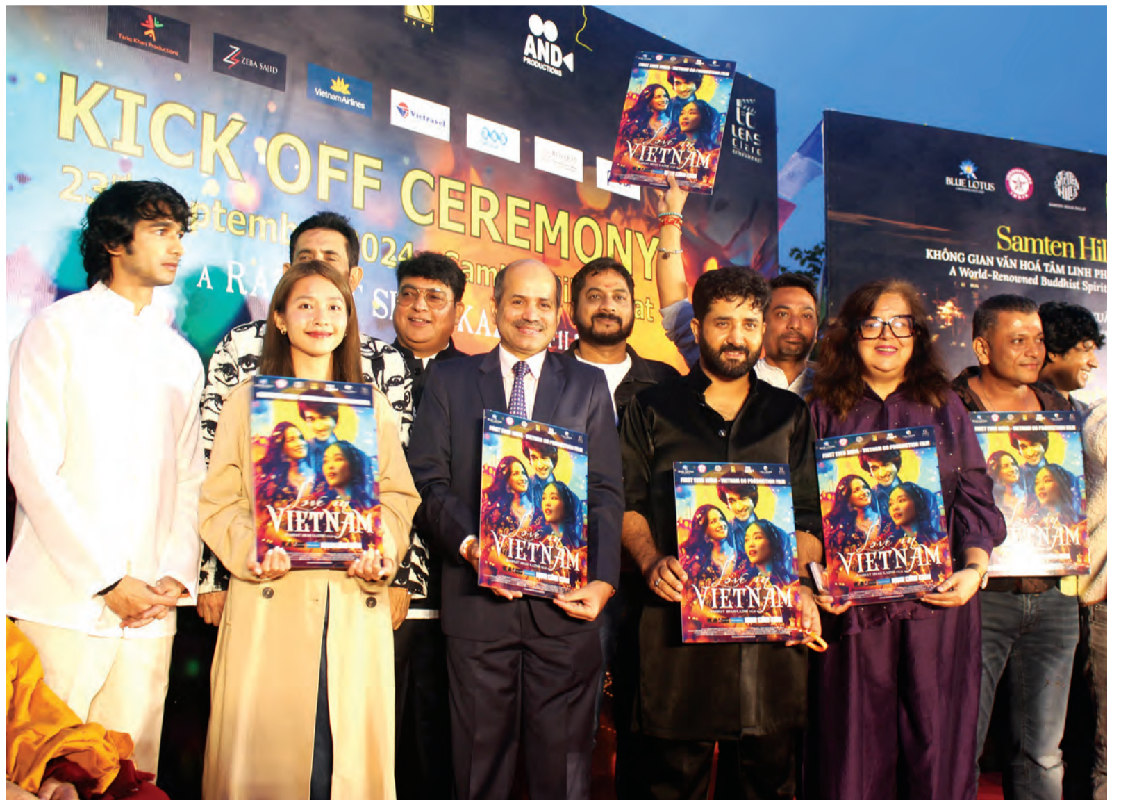
Các diễn viên cùng ngài Đại sứ đặc mệnh toàn quyền Ấn Độ tại Việt Nam trong lễ khai máy.