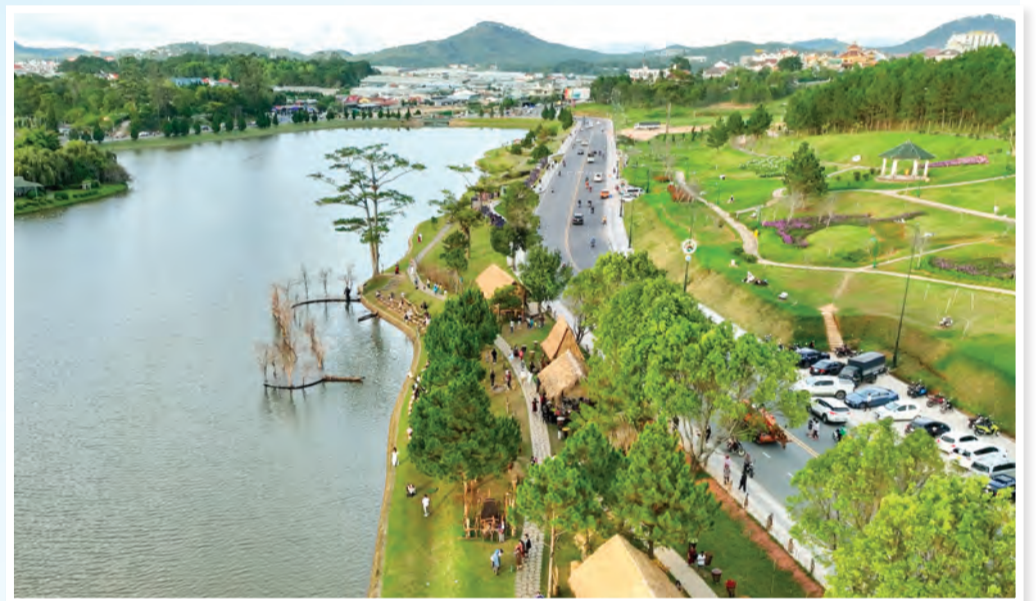
Cảnh sắc tươi sáng và bình yên bên bờ hồ Xuân Hương.