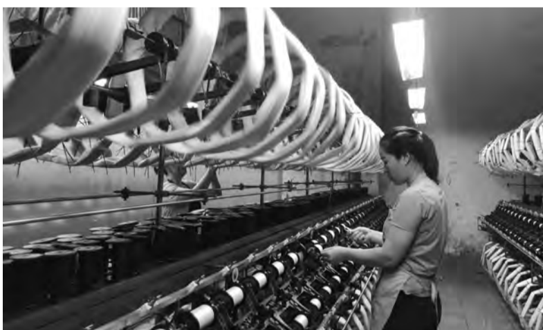
Tiết giảm chi phí giúp Công ty Cổ phần - Tổng Công ty Dầu tầm tơ Việt Nam vươn lên.

Rất nhiều máy móc của công ty hiện tại vẫn còn được sử dụng. Các dàn máy được chế tạo từ lâu, hoạt động vẫn ổn định nhưng tiêu hao năng lượng khá lớn. Vì vậy, công ty đã đặt ra quy trình lao động chặt chẽ để công nhân, người lao động thực hiện nhằm tiết giảm chi phí điện năng. Tại mỗi xưởng, đều có bản quy định, nhắc nhở công nhân trong giờ sản xuất thì bật điện, ngoài giờ sản xuất phải tắt điện. Công nhân công ty đã quen với việc tới đây chuyên nào, đưa tay mở điện chiếu sáng; khi công việc hoàn thành, rời khỏi chuyên