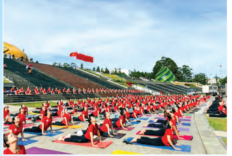
Quảng trường Lâm Viên là địa điểm đồng diễn yoga chào mừng Ngày Quốc tế yoga.