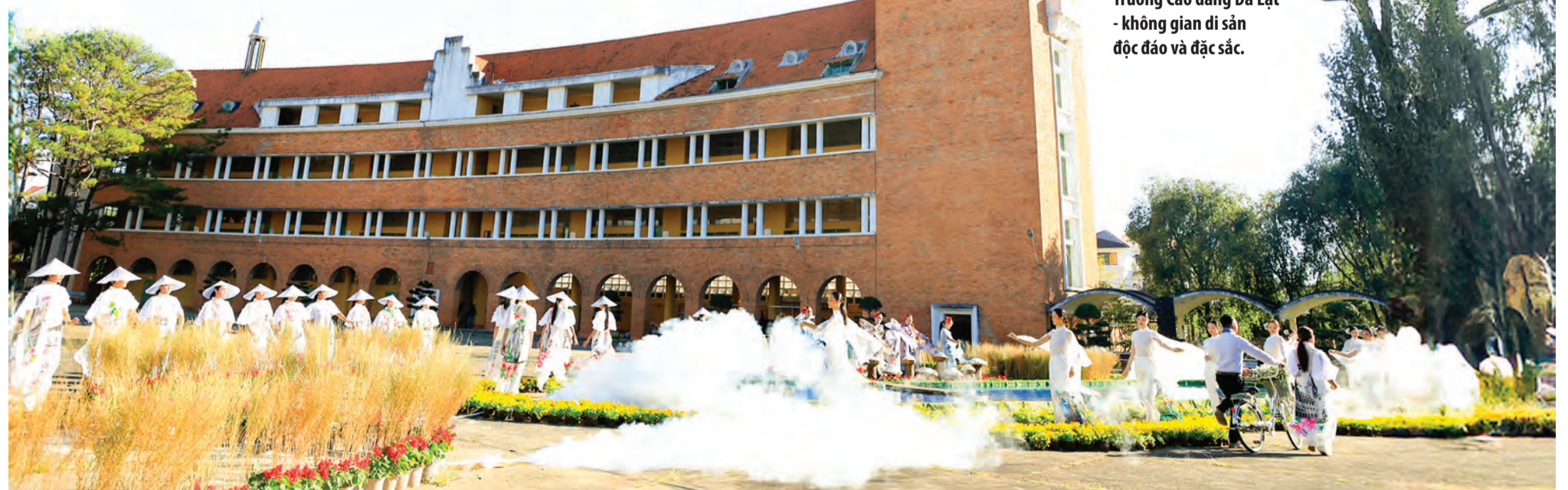
Trường Cao đẳng Đà Lạt - không gian di sản độc đáo và đặc sắc.