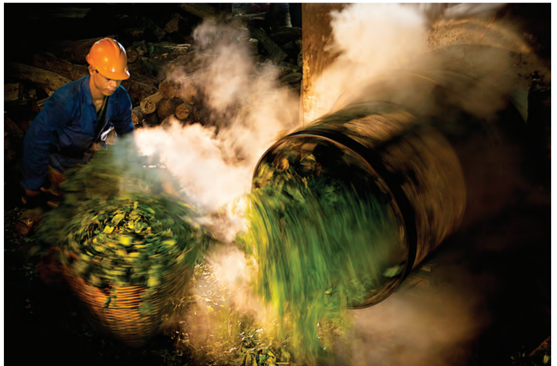
Chế biến trà xanh.