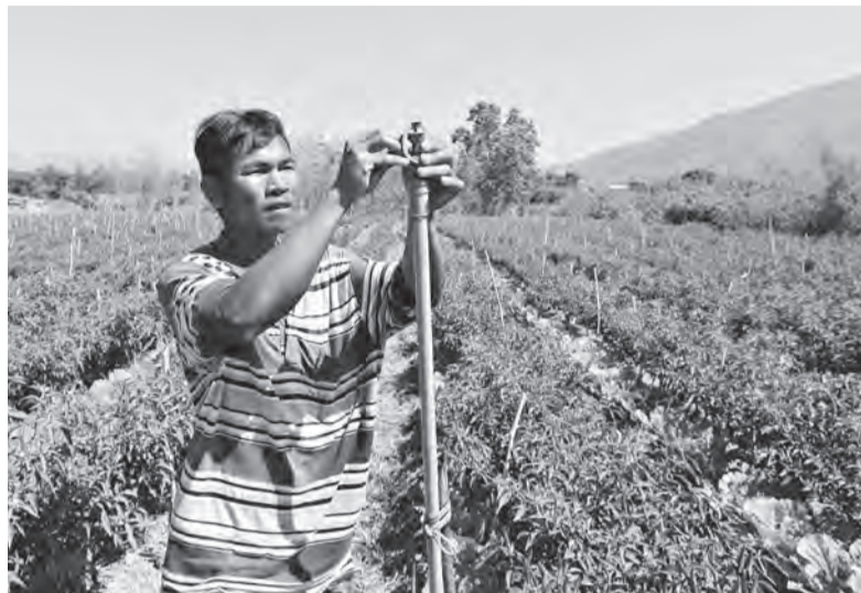
Huyện Đam Rông đẩy mạnh các giải pháp hỗ trợ bà con DTTS phát triển sản xuất, chuyển đổi cơ cấu cây trồng.

Huyện Đam Rông cũng đẩy mạnh các giải pháp hỗ trợ bà con phát triển sản xuất, chuyển đổi cơ cấu cây trồng, vật nuôi; hình thành các vùng sản xuất chuyên canh, chuyển dần từ các cây trồng có giá trị kinh tế thấp sang các loại cây trồng có giá trị kinh tế cao như trồng dâu, nuôi tằm, trồng bơ ghép, sầu riêng ghép... nâng cao thu nhập trên một đơn