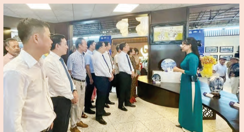
Tham quan triển lãm "Hồn của đất".

Triển lãm "Hồn của đất" góp phần tôn vinh các giá trị văn hóa truyền thống, những tinh hoa của nghề gốm sứ cổ truyền, khẳng định tình yêu với Bác Hồ, với Thủ đô Hà Nội và Tổ quốc thân yêu của những người con Bát Tràng, quyết tâm học tập và làm