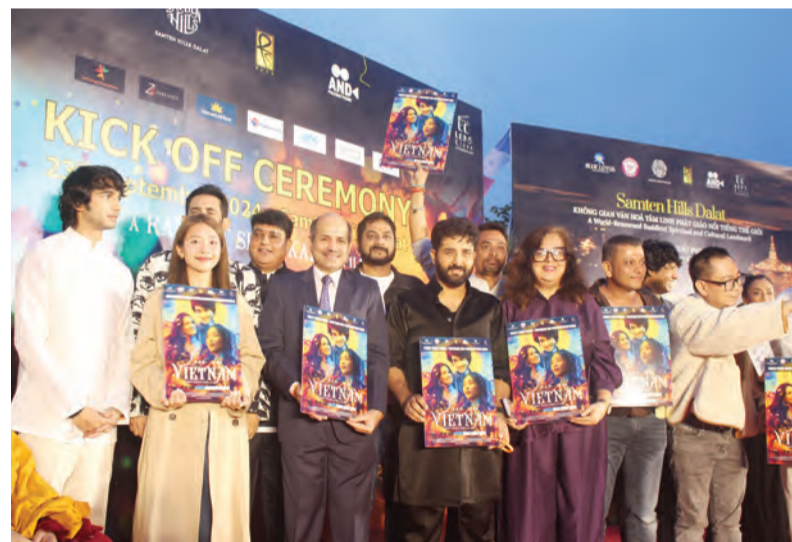
Các diễn viên cùng ngài Đại sứ đặc mệnh toàn quyền Ấn Độ tại Việt Nam trong lễ khai máy.

Đồng với thời lượng khoảng hơn 30 phút. Nhiều cảnh quay đẹp sẽ đi vào phim như: Ga Đà Lạt, khách sạn Dalat Palace, Trường Đại học Đà Lạt, Công ty Dalat Hasfarm, Bệnh viện Hoàn Mỹ, các đường hoa Đà Lạt và nhiều điểm du lịch. Trong đó, Khu du lịch tâm linh Samten Hills là khung cảnh lãng mạn mang nét văn hóa Ấn Độ để quay các cảnh hẹn hò, nhiều cảnh quay đẹp dưới chân Đại bảo tháp Kinh Luân, Cầu bàn tay, cảnh quay thiên định, cảnh hai nhân vật chính ngắm hoàng hôn, cảnh đám cưới xa hoa lộng lẫy sẽ diễn ra tại đây. Ngoài ra, bối cảnh phim còn diễn ra ở nhiều tỉnh, thành ven biển miền Trung với biển trời mênh mông, cát trắng, nắng vàng, cảnh làng quê Việt Nam thanh bình trải dài từ Đà Nẵng, Quảng Nam, Phú Yên, Nha Trang - Khánh Hòa... Hình ảnh đất nước Việt Nam lên phim tươi đẹp, con người Việt Nam lên phim nông hậu, nhân nghĩa, thủy chung. Đây là tác phẩm điện ảnh đầu tiên hợp tác giữa 2 đất nước,