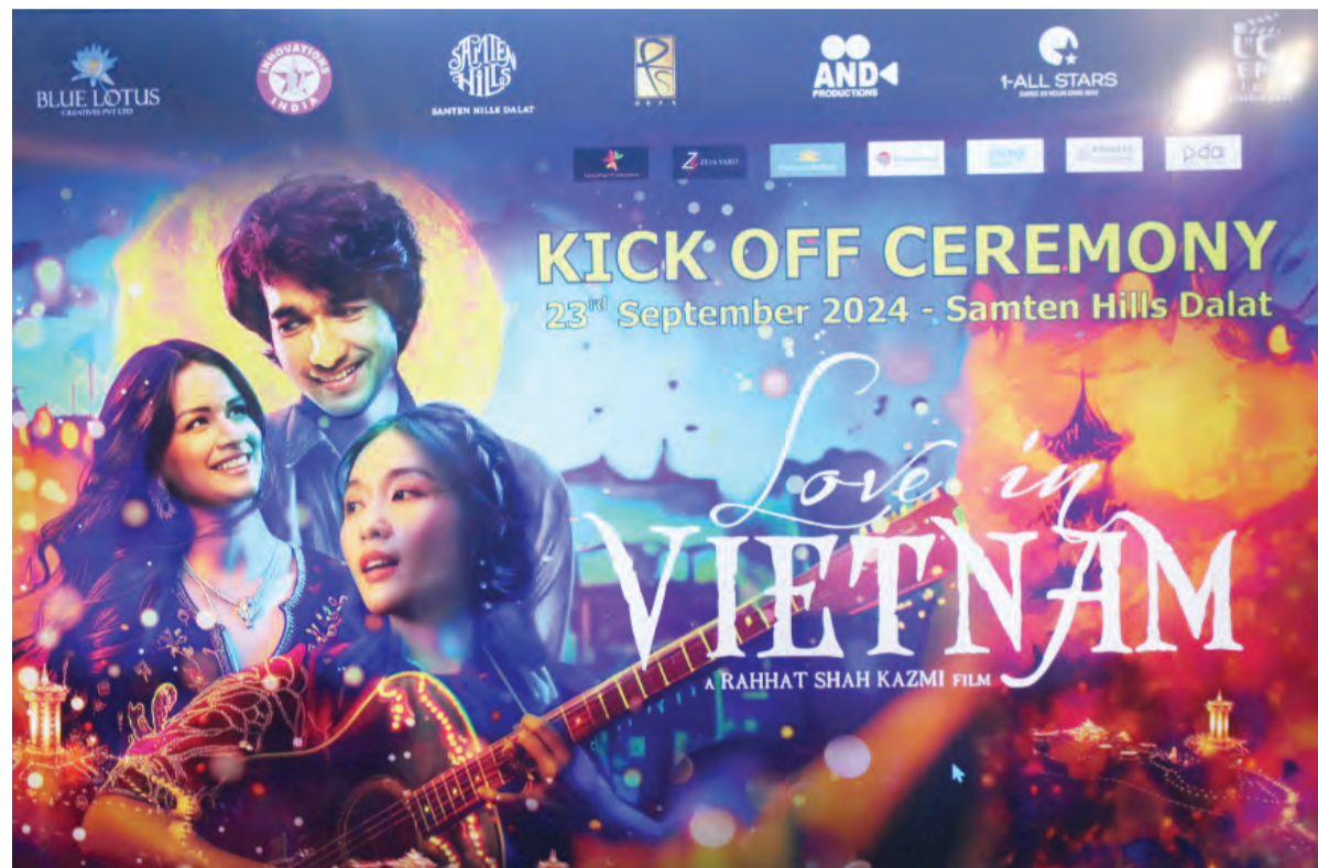
Poster của bộ phim.

Love in Vietnam (Chuyện tình Việt Nam), tác phẩm điện ảnh do Công ty Innovations India (Ấn Độ) và Công ty TNHH Y1A (Việt Nam) hợp tác sản xuất đã bắt đầu khởi quay tại Đà Lạt. Đây được coi là dấu mốc của sự kết nối điện ảnh giữa Việt Nam và Ấn Độ.