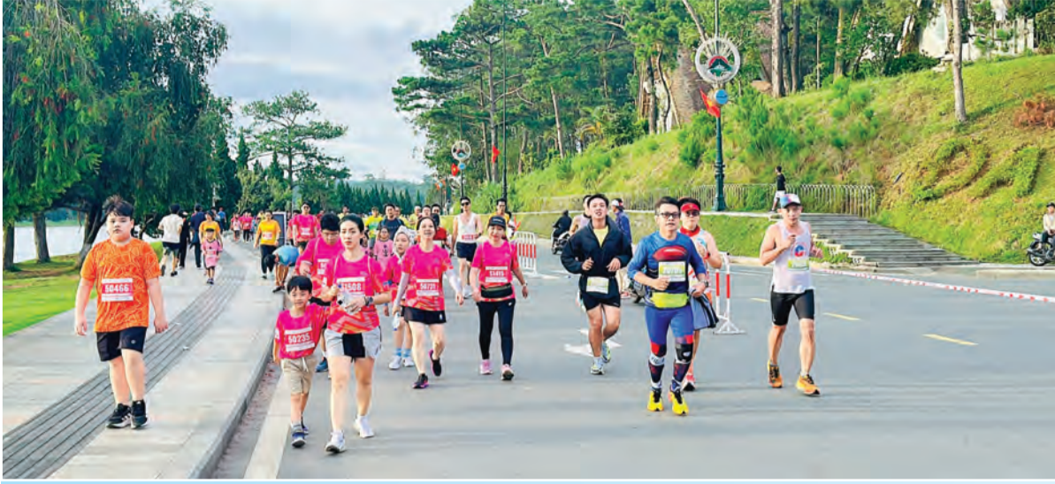
Không gian đi bộ lãng mạn và trong lành.