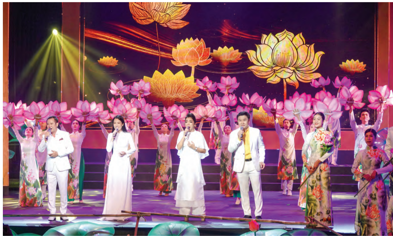
Biểu diễn ca khúc Hồ Chí Minh đẹp nhất tên Người.