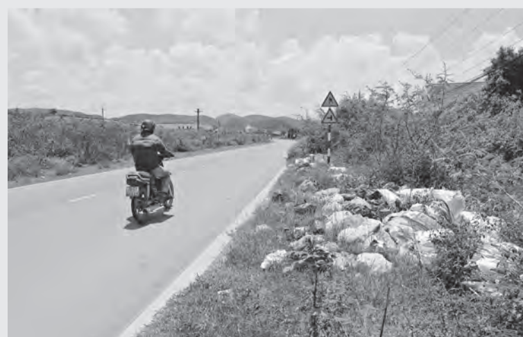
Một điểm rác thải được bỏ tràn lan ven đường.