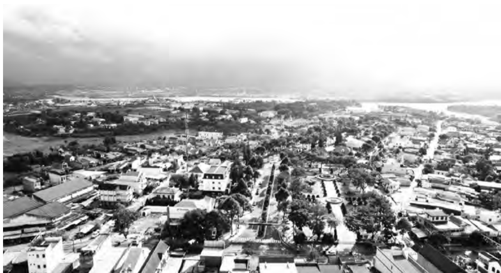
Một góc thị trấn Lộc Thắng.

Theo cán bộ và người dân Bảo Lâm, những năm đầu thành lập, kết cấu hạ tầng kinh tế - xã hội của huyện gặp rất nhiều khó khăn, giao thông đi lại cách trở, nhất là ở các xã vùng sâu, vùng xa, vì toàn bộ hệ thống đường là đường đất, mùa nắng thì bụi, mùa mưa thì lầy lội. Bên cạnh đó, cơ sở vật chất trên nhiều lĩnh vực đều thiếu thốn, thậm chí nhiều xã không có trạm y tế, hệ thống trường học thiếu thốn... Tuy nhiên, 30 năm sau, có thể nói rằng, kết cấu hạ tầng đã được đầu tư xây dựng đồng bộ và tương đối hiện đại. Để đạt được thành tựu như ngày nay, xuyên suốt 30 năm thành lập và phát triển của huyện Bảo Lâm, các cấp ủy Đảng, chính quyền huyện luôn nhận thức sâu sắc vai trò và tầm quan trọng của kết cấu hạ tầng đối với sự phát triển kinh tế - xã hội, từ đó tập trung huy động mọi