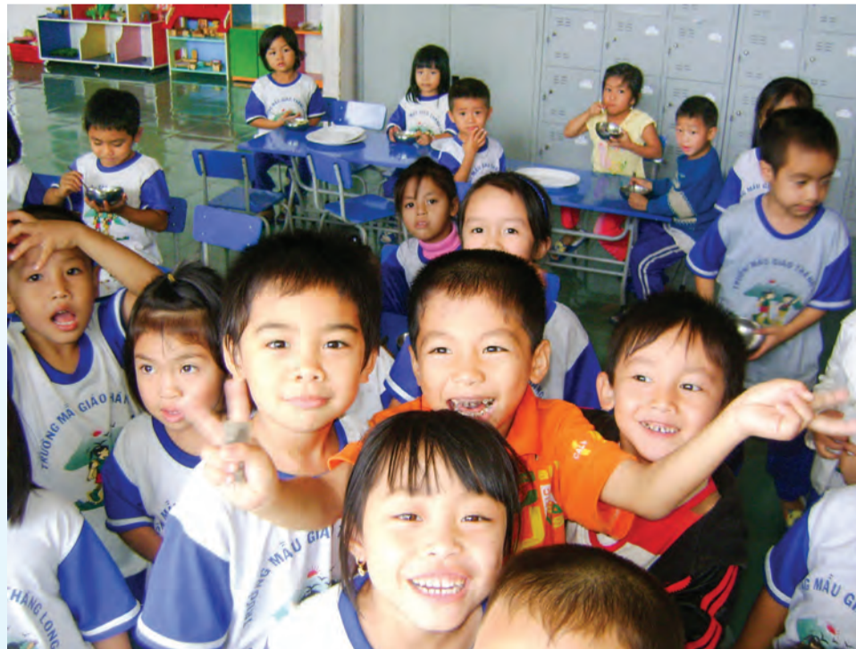
Chủ nhân tương lai của vùng đất Lâm Hà.

Tại một hội nghị Trung ương sau ngày đất nước thống nhất bàn về việc phân bố lại nguồn lao động và dân cư trên phạm vi toàn quốc, cố Chủ tịch Hội đồng Bộ trưởng Phạm Văn Đồng chỉ đạo: Tổ chức đưa hàng triệu Nhân dân từ các tỉnh đồng bằng và đô thị đất chật người đông lên miền núi phía Bắc, đến Tây Nguyên và đồng bằng sông Cửu Long khai hoang, xây dựng các vùng kinh tế mới để khai thác có hiệu quả nguồn lực lao động, đất đai, làm ra nhiều của cải, đem lại đời sống ấm no, hạnh phúc cho Nhân dân.