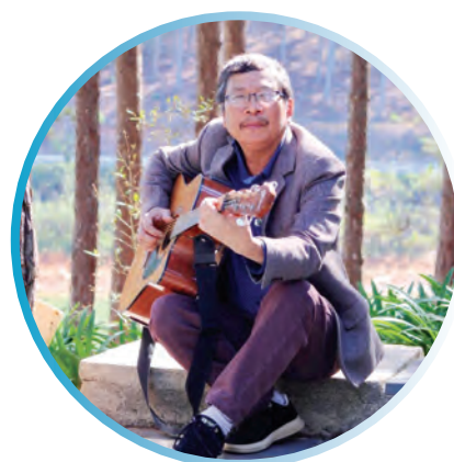
Nhạc sĩ Đinh Nghị.

- Con uống sữa gì anh cũng không biết luôn hả?