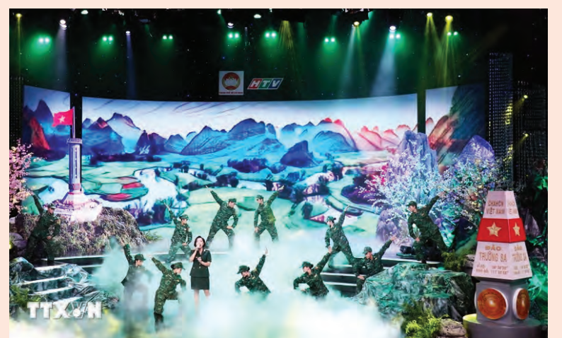
Một tiết mục trong Chương trình giao lưu nghệ thuật "Hướng về biên giới, biển, đảo Tổ quốc" lần thứ 10 năm 2023.