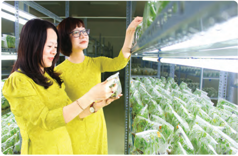
Không gian phòng nuôi cấy mô.