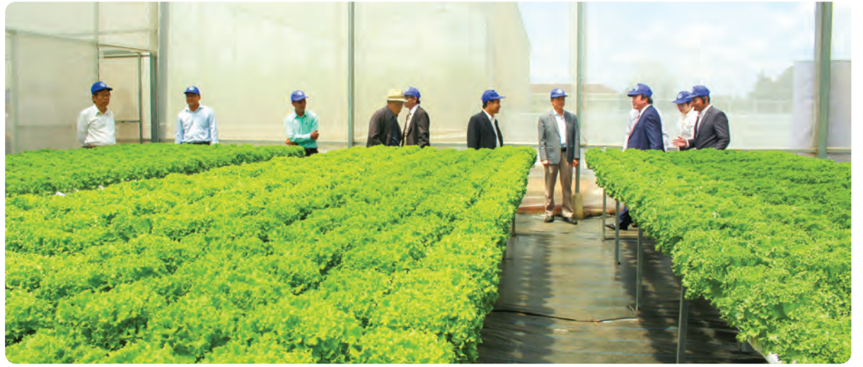
Khu thực nghiệm công nghệ trồng thủy canh.