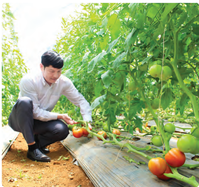
Vườn sản xuất với hệ thống tưới tiêu hiện đại.