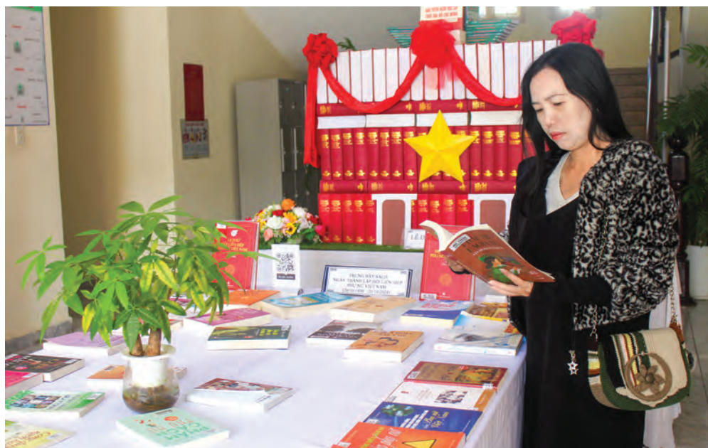
Không gian trưng bày sách thu hút độc giả là phụ nữ.

Kỷ niệm 94 năm Ngày thành lập Hội Liên hiệp Phụ nữ Việt Nam 20/10, Thư viện Lâm Đồng đã tổ chức trưng bày sách về truyền thống phụ nữ Việt Nam giới thiệu với công chúng bạn đọc gần 60 đầu sách về phẩm chất cao đẹp của phụ nữ Việt Nam.