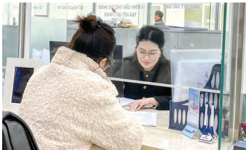
Giải quyết TTHC lĩnh vực y tế.

Nhờ ứng dụng công nghệ thông tin được đẩy mạnh nên việc cập nhật hồ sơ và tiến độ giải quyết công việc đáp ứng yêu cầu, kịp thời nhanh chóng. Việc sắp xếp hồ sơ, tài liệu có hệ thống, khoa học và hợp lý tạo thuận lợi cho việc tra cứu hồ sơ. Đề xuất, kiến nghị từ các cá nhân, các phòng được lãnh đạo xem xét kịp thời, bảo đảm sẵn có các nguồn lực để thực hiện tốt mục tiêu đề ra. Thực hiện tích hợp các TTHC thuộc thẩm quyền giải