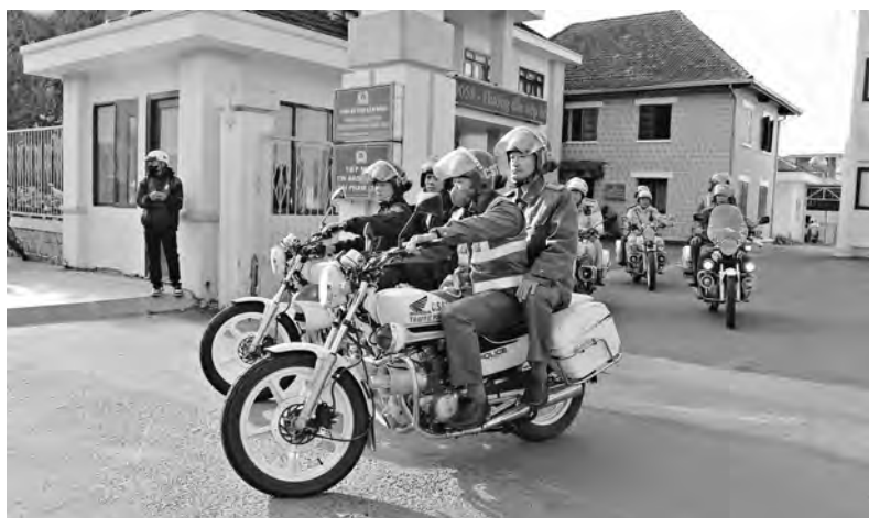
Công an TP Đà Lạt ra quân tăng cường kiểm tra, xử lý các trường hợp vi phạm giao thông.

Theo UBND TP Đà Lạt, việc chấn chỉnh, tăng cường công tác quản lý trật tự đô thị (TTĐT), trật tự an toàn giao thông (TTATGT) trên địa bàn là công việc thường xuyên, liên tục. Thành phố xác định đây là nhiệm vụ trọng tâm của chính quyền, các cấp, các ngành, huy động tối đa, sử dụng hiệu quả nguồn lực xã hội và ngân sách nhà nước để thực hiện mục tiêu đề ra. Tuy nhiên, để Festival Hoa Đà Lạt năm 2024 thành công tốt đẹp, việc tăng cường công tác kiểm tra, xử lý, khắc phục những tồn tại, thiếu sót là rất quan trọng, đúng chủ trương của Tỉnh ủy, UBND tỉnh, Thành ủy và UBND thành phố với chủ đề năm 2024 “Quyết liệt, đồng bộ, đột phá, kỷ cương, nêu gương, bản lĩnh, hiệu quả” và trên nguyên tắc “Không có vùng