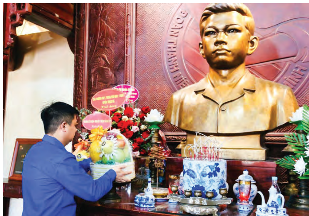
Thế hệ trẻ dâng hương tưởng niệm anh hùng Lý Tự Trọng.

Ngay sau khi đến Quảng Châu cũng như suốt thời gian mấy năm được sự chăm sóc ân cần từ nơi ăn, chốn ở, nhất là trong việc rèn luyện, học tập hàng ngày của đồng chí Vương (tức Lý Thụy - Nguyễn Ái Quốc), cả nhóm thiếu niên đã thể hiện tinh thần cố gắng trong mọi việc học tập, sinh hoạt. Nhóm thiếu niên được đồng chí Vương đưa vào nhóm "Thiếu niên tiên phong Việt Nam", một hình thức tổ chức thanh thiếu niên cộng sản đầu tiên của cách mạng Việt Nam và trực tiếp giáo dục, rèn luyện. Đồng chí Vương thường trao đổi với các đồng chí trong Tổng bộ về Lê Hữu Trọng, một học viên bé nhất trong nhóm nhưng có tư chất thông minh, rất ham học, rất tích cực rèn luyện và có ý thức tổ chức kỷ luật trong cuộc sống hàng ngày. Đồng chí Vương cùng các đồng chí trong Tổng bộ đã dự kiến kế hoạch chọn một số thiếu niên trong đó có Lê Hữu Trọng đưa sang Liên Xô để đào tạo lâu dài. Để đảm bảo cho việc hoạt động bí mật của nhóm, tất cả các thành viên trong nhóm đều được thay đổi sang họ Lý (cùng họ với Lý Thụy - tức Nguyễn Ái Quốc). Lê Hữu Trọng đổi tên thành Lý Tự Trọng, sau đó được Nguyễn Ái Quốc giới thiệu vào học trung học tại Quảng Châu. Vốn thông minh hoạt bát, mưu trí, qua một thời gian ngắn, Lý Tự Trọng đã thông thạo tiếng Trung