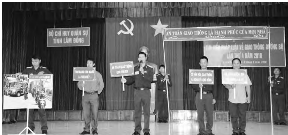
Cán bộ, chiến sĩ lực lượng vũ trang tỉnh tham gia thi tìm hiểu pháp luật.

Giai đoạn 2021 - 2024, việc thực hiện Đề án “Phát huy vai trò của lực lượng quân đội Nhân dân tham gia công tác phổ biến, giáo dục pháp luật, vận động Nhân dân chấp hành pháp luật tại cơ sở giai đoạn 2021 - 2027” (gọi tắt Đề án 1371) đã đạt được những kết quả nhất định. Tuy vậy vẫn còn những khó khăn đặt ra đòi hỏi lực lượng vũ trang tỉnh khắc phục để tiếp tục thực hiện Đề án hiệu quả trong tình hình mới.