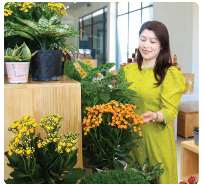
Không gian trưng bày sản phẩm.