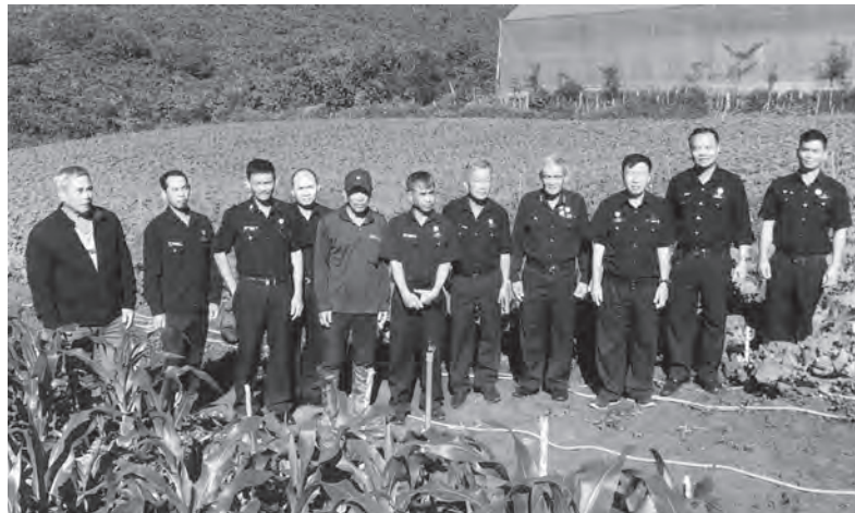
Hội CCB huyện thường xuyên tổ chức các đợt tham quan mô hình kinh tế hiệu quả cho hội viên.

Từ sự chung tay của các hội viên, Hội CCB huyện đã nâng cấp