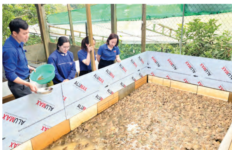
Mô hình nuôi ếch từ nguồn vốn vay ưu đãi đang mang lại hiệu quả kinh tế cho thanh niên Bảo Lộc khởi nghiệp, lập thân.

Nhờ nguồn vốn tín dụng chính sách, nhiều đoàn viên, thanh niên (ĐVTN) trên địa bàn TP Bảo Lộc đã có thêm nguồn vốn để sản xuất, kinh doanh, khởi nghiệp, làm giàu trên chính quê hương. Đồng thời, phát huy các điều kiện, lợi thế sẵn có của địa phương, mở ra cơ hội việc làm cho ĐVTN góp phần phát triển kinh tế - xã hội.