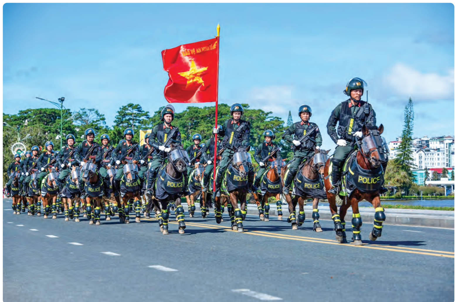
Đội Kỳ mã CSCĐ Công an Nhân dân điều hành tại Đà Lạt.