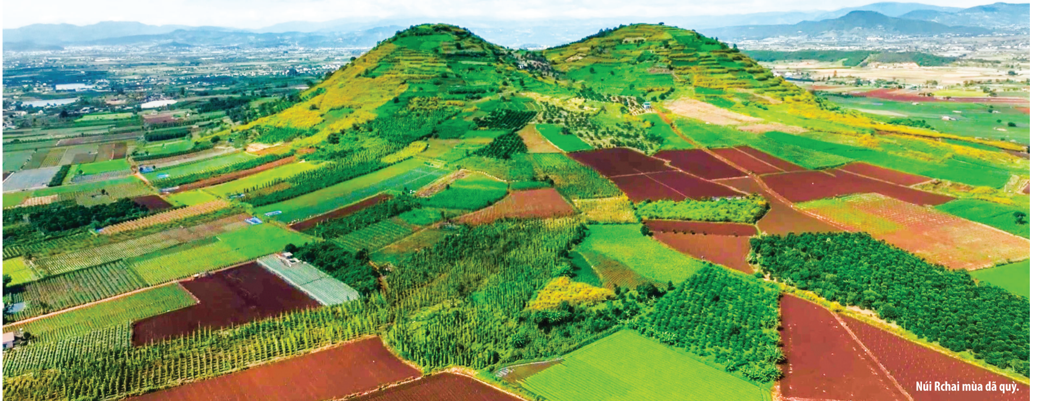
Núi Rchai mùa dã quỳ.