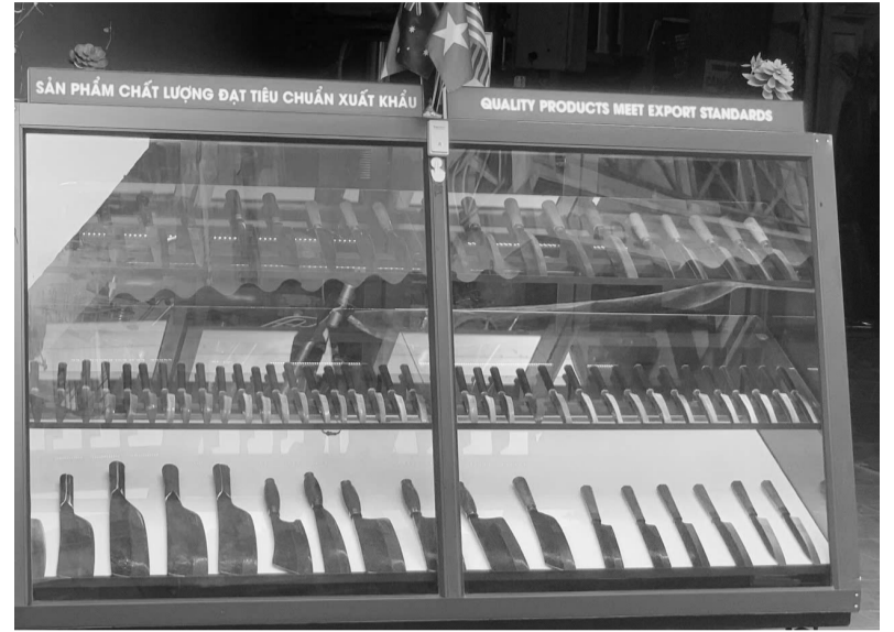
Sản phẩm làng rèn Đa Sĩ.