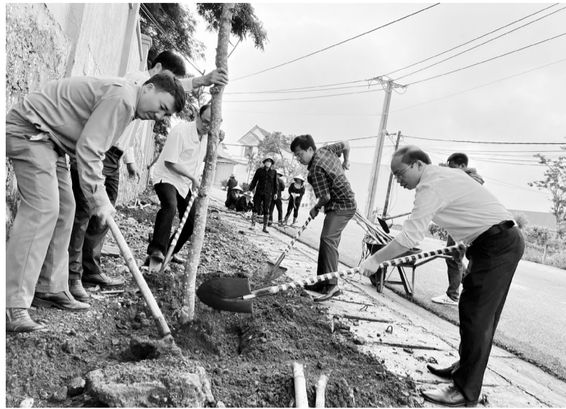
Lãnh đạo huyện Di Linh gương mẫu đi đầu trong thực hiện việc trồng cây xanh.

Thực hiện Đề án này, tỉnh Lâm Đồng cũng xây dựng và triển khai Đề án "Trồng 50 triệu cây xanh" giai đoạn 2021 - 2025 trên địa bàn tỉnh. Trong đó huyện Di Linh được giao chỉ tiêu trồng 4,9 triệu cây xanh. Để thực hiện nhiệm vụ này, UBND huyện Di Linh đã tiến hành rà soát xác định quỹ đất trồng cây xanh, xác định số lượng, loài cây trồng để xây dựng kế hoạch trồng cây hàng năm và nguồn lực thực hiện. Huyện Di Linh đã xác định mục tiêu trồng