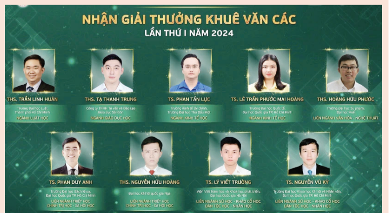
Các nhà khoa học đạt giải Khuê Văn Các năm 2024.

Mỗi cá nhân đạt Giải thưởng được nhận Huy hiệu “Tuổi trẻ sáng tạo” của Ban Chấp hành