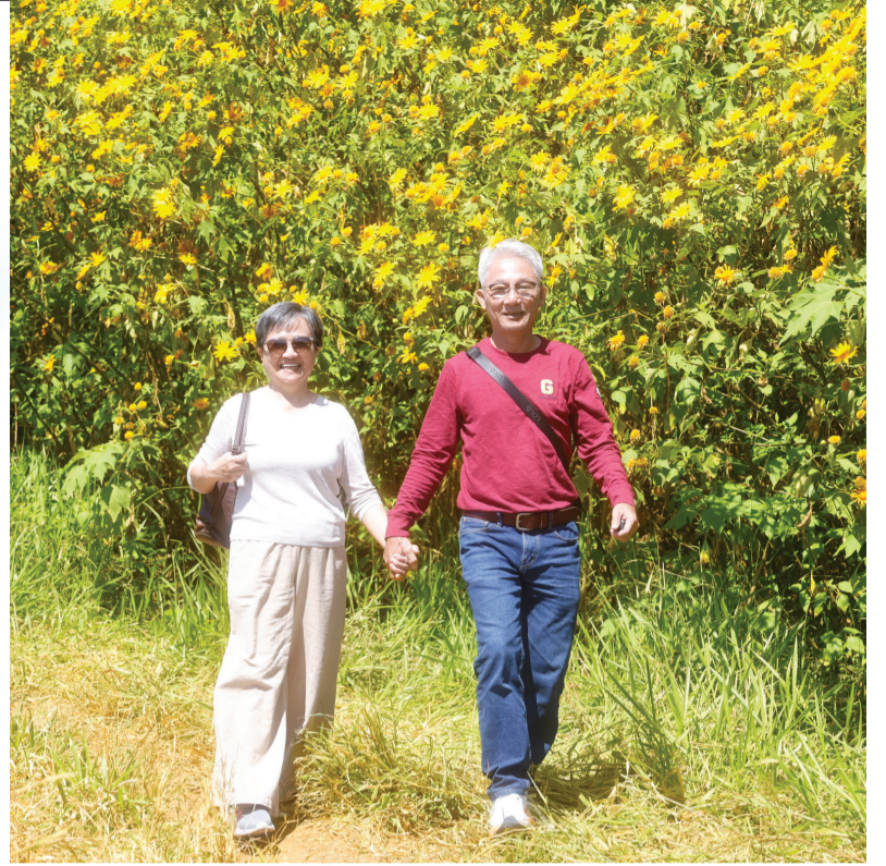
Dã quỳ là loài hoa biểu tượng của tình yêu giản dị, bền bỉ và thủy chung.