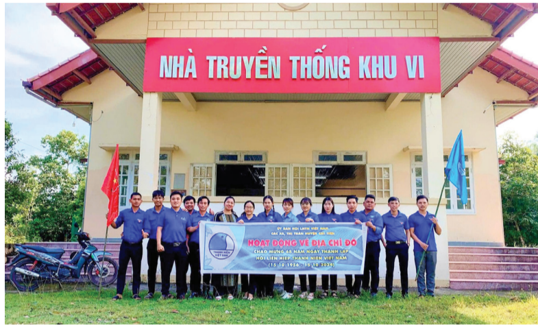
Hội LHTN Việt Nam huyện Cát Tiên tổ chức tham quan, tìm hiểu lịch sử tại Khu căn cứ Kháng chiến Khu ủy Khu VI, Cát Tiên.

Cụ thể, trong nhiệm kỳ vừa qua, Hội LHTN từ huyện đến cơ sở đã tổ chức trên 150 buổi tọa đàm, hội nghị quán triệt và học tập, thảo luận về cuốn sách Bác Hồ, tổ chức