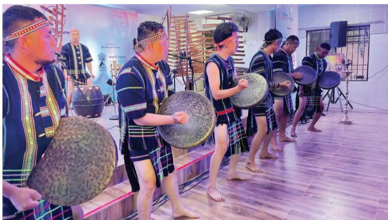
Biểu diễn công chiêng giao lưu.