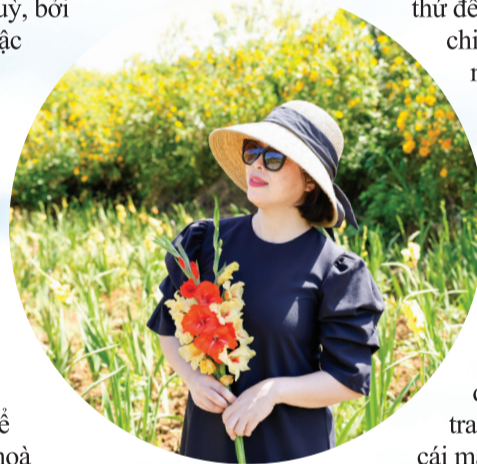
Du khách trong vườn hoa layon được bao bọc bởi dã quỳ.

Nhiều người thích mùa hoa dã quỳ còn bởi đây là loài hoa dân dã, hoang dại, nhưng màu sắc tươi sáng, sang trọng... Và, ẩn sâu trong đó là hình bóng của những miền quê bình yên và xinh đẹp!