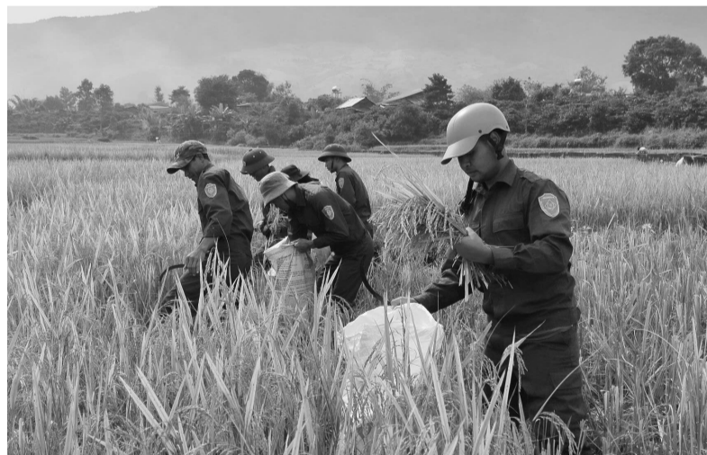
Chi đoàn dân quân xã Đa Tông đẩy mạnh các hoạt động giúp đỡ người có hoàn cảnh khó khăn trên địa bàn.

Ông Rơ Ông Cha Ry ngụ tại thôn Chiêng Cao Cil Múp chia sẻ: "Từ xạc cò, cuốc đất đến chăm sóc cây cà phê, các bạn trẻ đều không ngại xắn tay áo giúp gia đình chúng tôi. Nhờ