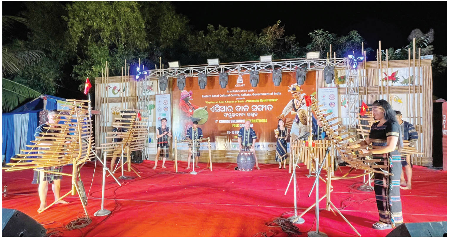
Chương trình biểu diễn của đoàn tại lễ hội được đón nhận nồng nhiệt.

Riêng tiết mục Chali Chali Ga (dân ca Ấn Độ), trên chính những nhạc cụ dân tộc mình, đoàn đã chuyên soạn biểu diễn hòa tấu với một số nốt nhích lên nửa cung bậc, những âm sắc mang đậm bản sắc của nền âm nhạc Ấn đã làm nức lòng nhân dân Ấn Độ. Với tinh thần giao lưu văn hóa, Đoàn Nghệ thuật Dân tộc Nam Tây Nguyên đã kết hợp tinh tế giữa âm nhạc truyền thống Ấn Độ với nhạc cụ các dân tộc Nam Tây Nguyên. Qua đó cho thấy, các nhạc cụ bộ gõ chế tác từ chất liệu tre, nứa của người K'Ho, Mạ, Churu nhìn có vẻ thô sơ, mộc mạc nhưng có thể biểu diễn được mọi nốt nhạc, mọi âm vực, thể hiện được tất cả âm điệu, vẻ đẹp của các nền âm nhạc của các dân tộc anh em trên thế giới mà không có trở ngại nào. Tiết mục vừa tạo nên sự mới mẻ, độc đáo, vừa mang đậm màu sắc dân gian của hai quốc gia, hai dân tộc.