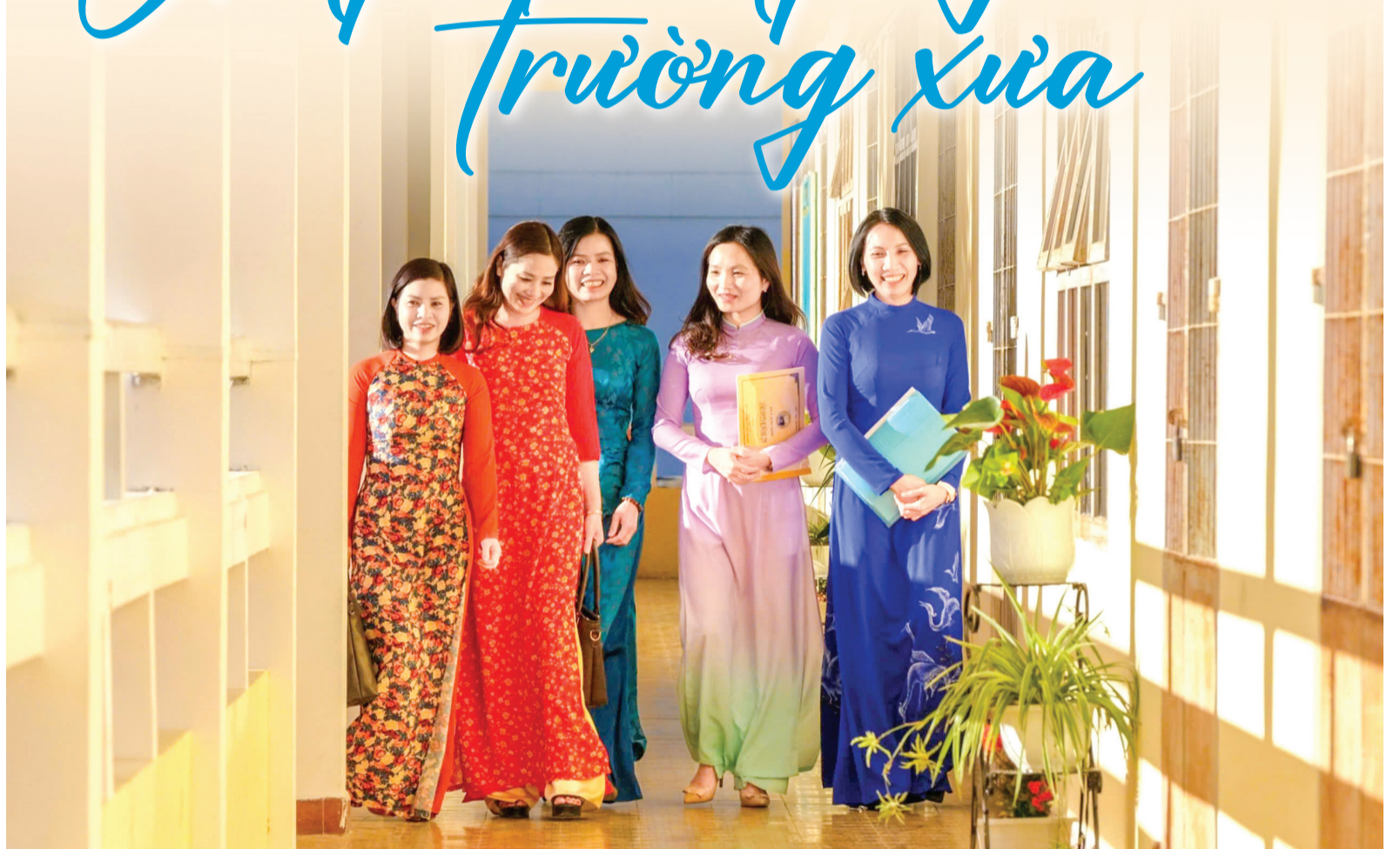
Nét đẹp nhà giáo.