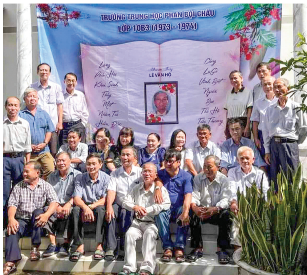
Lễ tri ân thầy Hồ của học trò cũ.