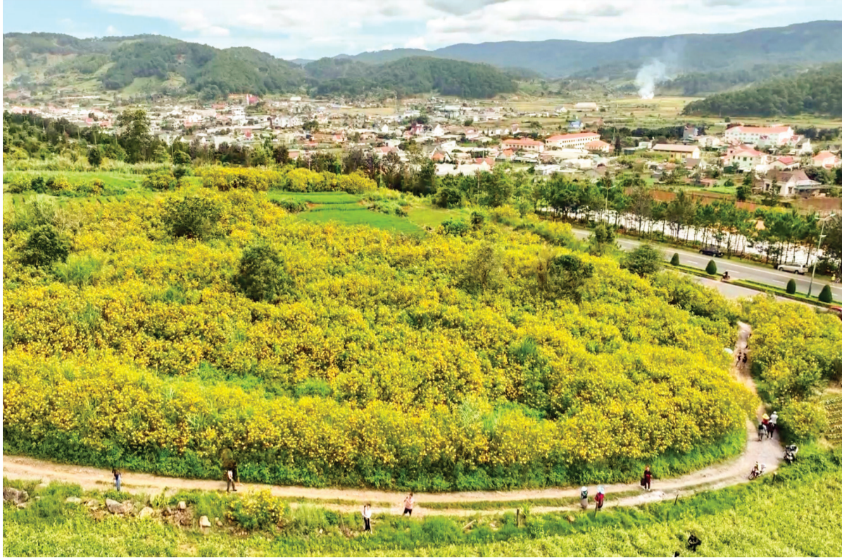
Những cung đường thu hút du khách mùa dã quỳ.