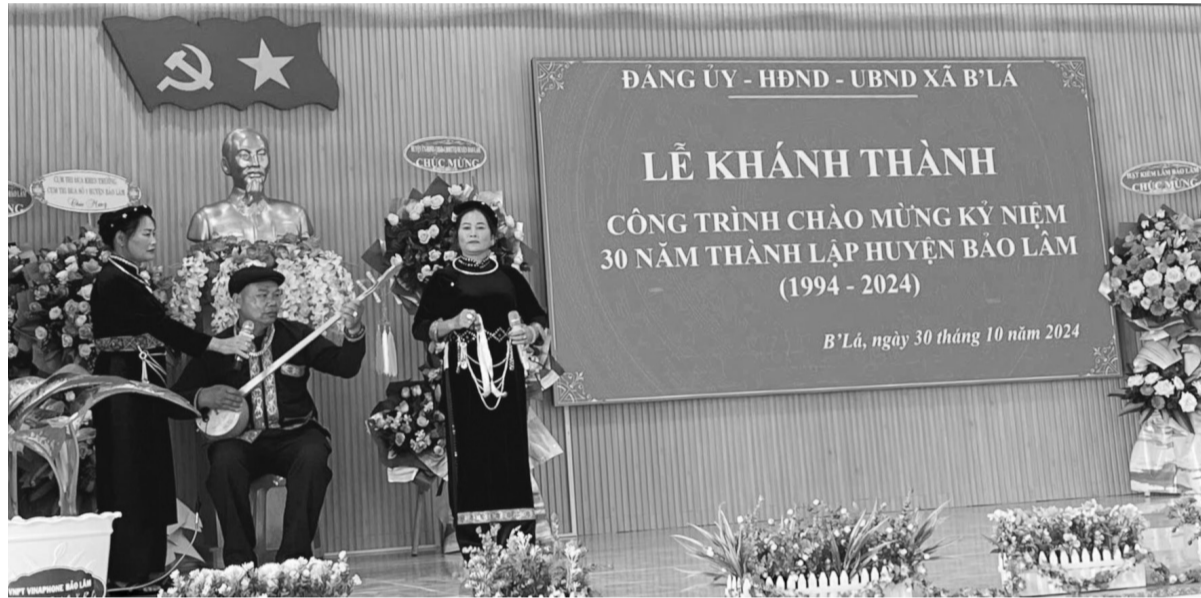
Nhân dân xã B' Lá trong niềm hân hoan chào mừng kỷ niệm 30 năm thành lập huyện Bảo Lâm.

đàn được sống trong những ngôi nhà kiên cố, khang trang. Người dân có công ăn việc làm ổn định, con em được ăn học tử tế, tình làng nghĩa xóm được phát huy... Cùng với đó, Phong trào Toàn dân bảo vệ an ninh Tổ quốc trên địa bàn xã thời gian qua được thực hiện có hiệu quả. Các mô hình về đảm bảo an ninh trật tự được xây dựng, duy trì và nhân rộng. Qua đó, trật tự an toàn xã hội được giữ vững, cuộc sống của người dân luôn yên bình, kinh tế - xã hội có nhiều khởi sắc. Điển hình như Mô hình "Khu dân cư tham gia đấu tranh phòng, chống tội phạm trên lĩnh vực quản lý, bảo vệ rừng" ở xã B' Lá được nhân rộng thực hiện vào tháng 4/2020 tại 5/5 thôn với 50 thành viên nòng cốt và sự tham gia của toàn dân. Qua thời gian hoạt động, mô hình đã được duy trì thường xuyên và đạt được một số hiệu quả cao trong công tác quản lý, bảo vệ rừng như: Các tổ mô hình tham gia tuyên truyền về công tác quản lý, bảo vệ rừng; vận động các hộ dân trên địa bàn ký cam kết tham gia công tác bảo vệ rừng, không lấn chiếm đất rừng, không khai thác lâm sản, khoáng sản trái phép; tham gia tuần tra, kiểm tra bảo vệ rừng, ngăn chặn