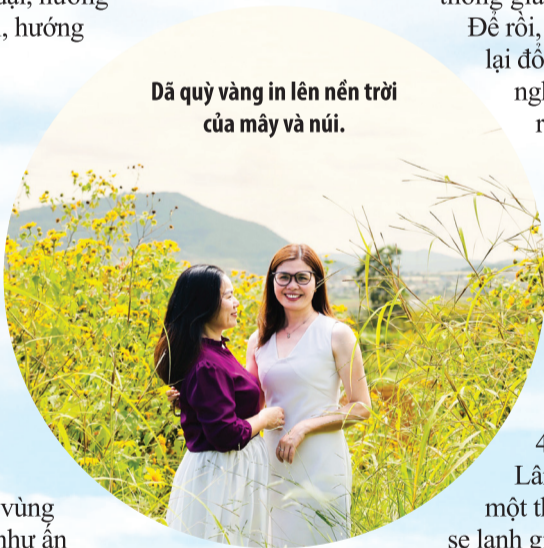
Dã quỳ vàng in lên nền trời của mây và núi.