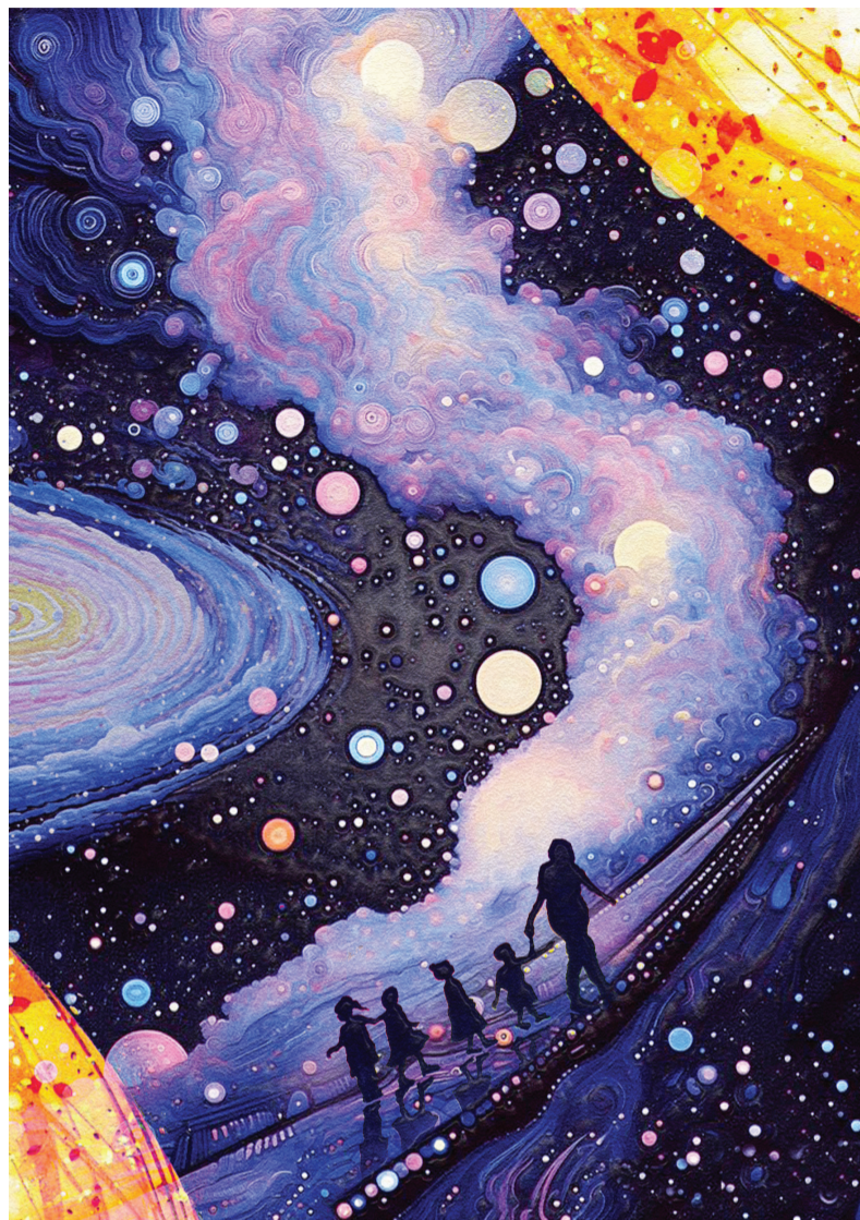
Minh họa: Phan Nhân

Chỉ có một vai Sơn Tinh, một vai Thủy Tinh, một vai Vua Hùng