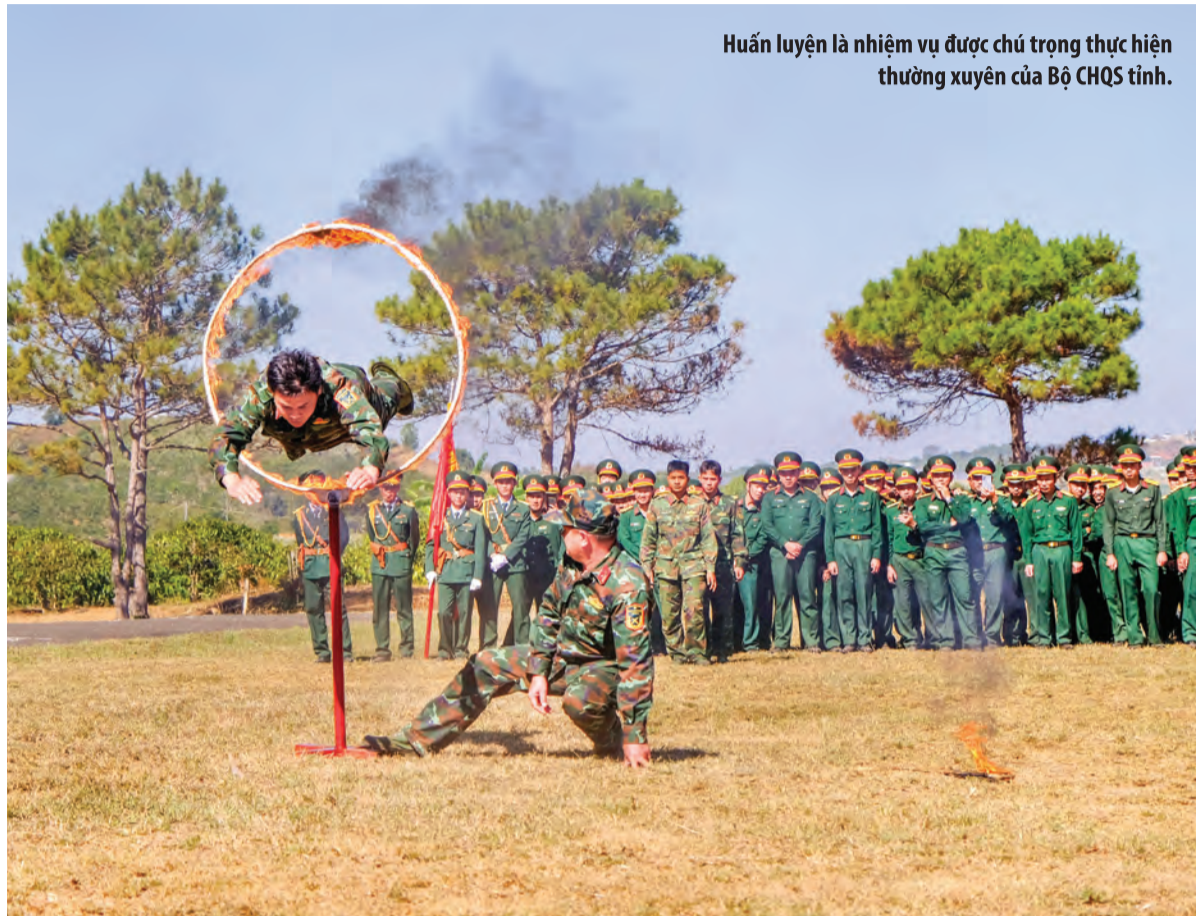
Huấn luyện là nhiệm vụ được chú trọng thực hiện thường xuyên của Bộ CHQS tỉnh.

Thực hiện nhiệm vụ huấn luyện chiến đấu năm 2024, các đơn vị