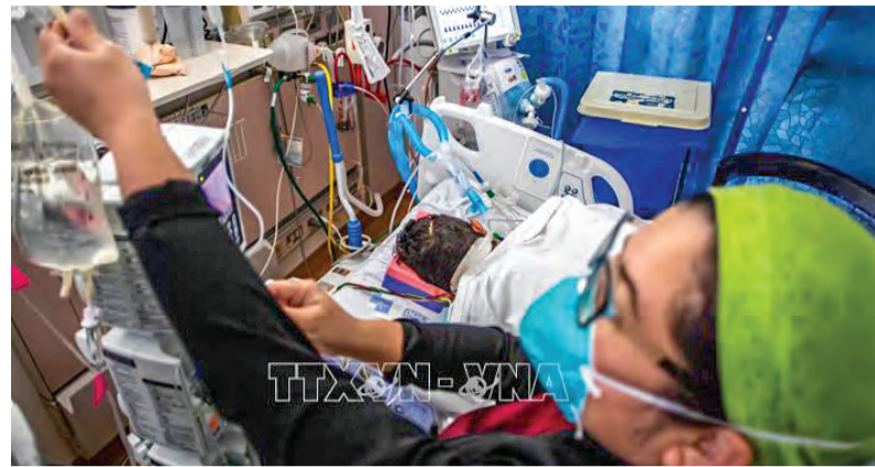
Điều trị cho bệnh nhân nhiễm COVID-19 tại bệnh viện ở Tarzana, California, Mỹ.