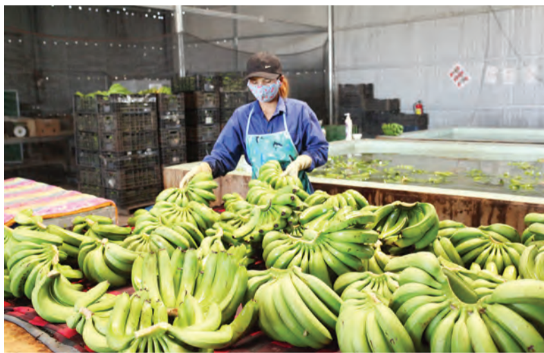
Chuỗi liên kết trồng và tiêu thụ chuối Laba tại xã Đạ K’nang mang lại thu nhập cao cho người dân.

80,4 ha mắc ca, 158 ha dâu tằm. Huyện Đam Rông luôn quan tâm công tác phát triển các mô hình kinh tế tập thể; hỗ trợ xây dựng các chuỗi liên kết giá trị, phát triển các sản phẩm đặc trưng của huyện và đẩy mạnh thực hiện hiệu quả Chương trình Mỗi xã một sản phẩm (OCOP) trên địa bàn. Đến nay, toàn huyện đã có 15 chuỗi liên kết trong sản xuất và tiêu thụ nông sản với trên 1.100 hộ tham gia, sản lượng nông sản qua chuỗi trên 11.500 tấn. Đối với Chương trình Giảm nghèo bền vững, đến cuối năm 2024, qua thực hiện rà soát hộ nghèo, hộ cận nghèo theo chuẩn nghèo đa chiều giai đoạn 2022-2025, trên địa bàn huyện đã giảm còn 1.033 hộ, tỷ lệ nghèo đa chiều chiếm 7,00% (giảm 668 hộ, tương ứng giảm 4,63% so với hộ nghèo đa chiều cuối năm 2023). Bên cạnh đó, thực hiện các chính sách giảm nghèo thường xuyên, huyện Đam Rông đã có chính sách hỗ trợ y tế thực hiện cấp thẻ Bảo