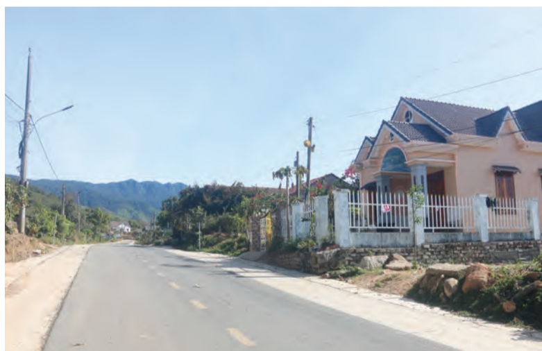
Cơ sở hạ tầng thiết yếu được quan tâm đầu tư đã làm thay đổi bộ mặt nông thôn, tạo nền tảng phát triển kinh tế - xã hội ở các xã vùng khó khăn.

Tương tự, đến với các thôn ở các xã Đạ M'rông, Liêng S'rông trong những tháng cuối năm, chúng tôi được chứng kiến không khí bà con vui tươi thu hái, vận chuyển cà phê bằng máy cày, máy kéo bon bon trên khắp nẻo đường, xen lẫn cảnh phơi thu gom cà phê... từ các thôn ở khu trung tâm xã cho đến vùng sâu, vùng xa như Tiểu khu 179 (Thôn 5, xã Liêng S'rông), nơi sinh sống của 120 hộ, với hơn 700 nhân khẩu đồng bào dân tộc H'Mông, đầu đầu