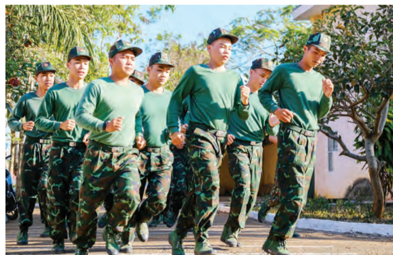
Kết quả huấn luyện luôn là một trong những điểm nổi bật trong thực hiện nhiệm vụ của Trung đoàn Bộ binh 994.

Đơn vị tập trung thực hiện nghiêm túc quyết định của Bộ Quốc phòng về việc sáp nhập Ban Hậu cần, Ban Kỹ thuật thành Ban Hậu cần - Kỹ thuật. Đồng thời thực hiện tốt công tác thanh tra quốc phòng. Quản lý, sử dụng tốt