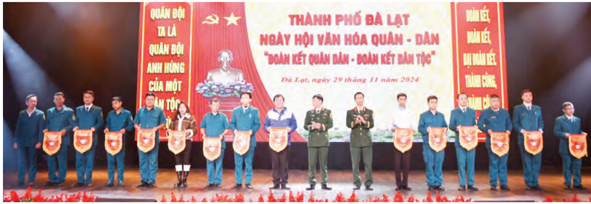
Ban CHQS TP Đà Lạt tổ chức Ngày hội Văn hóa quân - dân năm 2024.

Trong năm, Ban CHQS TP Đà Lạt đã tham mưu tổ chức diễn tập