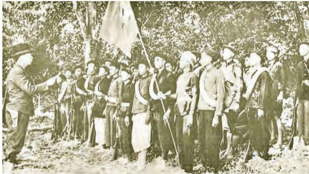
Đội Việt Nam Tuyên truyền Giải phóng quân, tiền thân của Quân đội Nhân dân Việt Nam được thành lập ngày 22/12/1944 tại khu rừng Trần Hưng Đạo (Cao Bằng).

Quân đội Nhân dân Việt Nam do Đảng Cộng sản Việt Nam và Chủ tịch Hồ Chí Minh sáng lập, lãnh đạo, giáo dục và rèn luyện, là quân đội mang bản chất giai cấp công nhân, có tính Nhân dân và tính dân tộc sâu sắc. Trải qua 80 năm xây dựng, chiến đấu và trưởng thành, Quân đội Nhân dân Việt Nam cùng toàn Đảng, toàn dân vượt qua muôn vàn khó khăn, thử thách, lập được nhiều chiến công hiển hách, xứng đáng là quân đội anh hùng của dân tộc Việt Nam anh hùng.