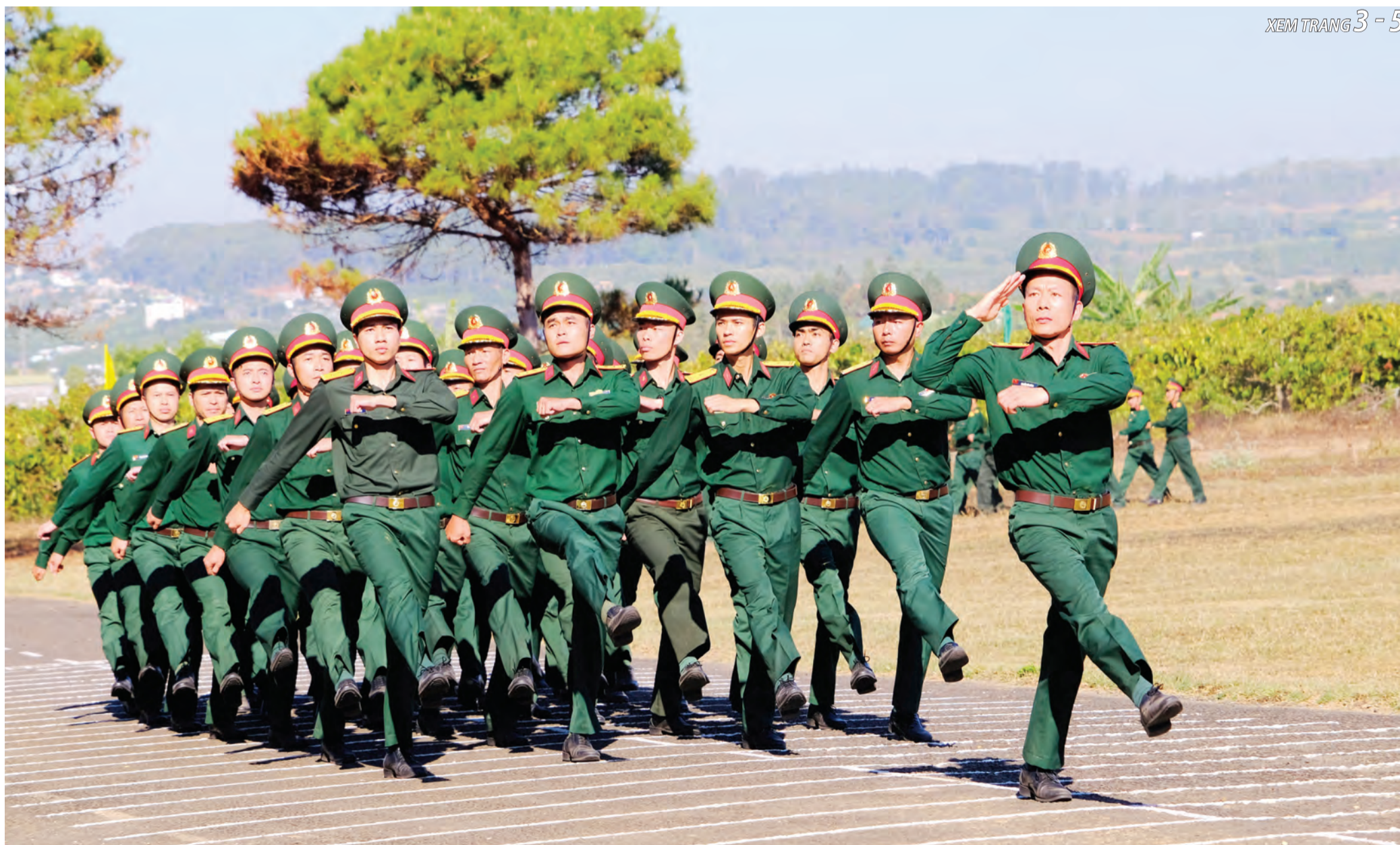
Lực lượng vũ trang tỉnh Lâm Đồng luôn giữ vững và phát huy truyền thống “Trung thành vô hạn - Đoàn kết kỷ cương - Tự lực tự cường - Quyết chiến quyết thắng”.