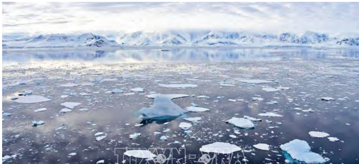
Băng trôi tại vịnh Chiriguano, quần đảo Nam Shetland, Nam Cực.

Theo kết quả một nghiên cứu công bố ngày 18/12, lượng băng tan tại Nam Cực kỷ lục trong năm 2023 là nguyên nhân gây ra nhiều cơn bão xuất hiện với tần suất dày hơn ở các vùng mới được phát hiện trên Nam Đại Dương.