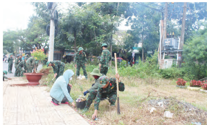
Lực lượng vũ trang hỗ trợ người dân dọn dẹp vệ sinh môi trường.

Bước vào thực hiện nhiệm vụ phát triển kinh tế - xã hội năm 2024 mặc dù còn gặp nhiều khó khăn do tác động nhiều yếu tố, song với sự quan tâm, chỉ đạo sát sao của tỉnh, sự chỉ đạo thường xuyên, sâu sát, quyết liệt của Thường trực Huyện ủy, sự quan tâm, giám sát của HĐND huyện, UBND huyện đã kịp thời ban hành các chương trình, kế hoạch để cụ thể hóa và chỉ đạo tổ chức thực hiện toàn diện, quyết liệt các mục tiêu, nhiệm vụ. Do vậy, tình hình kinh tế - xã hội và bảo đảm quốc phòng, an ninh của huyện đã đạt được nhiều kết quả nổi bật, toàn diện.