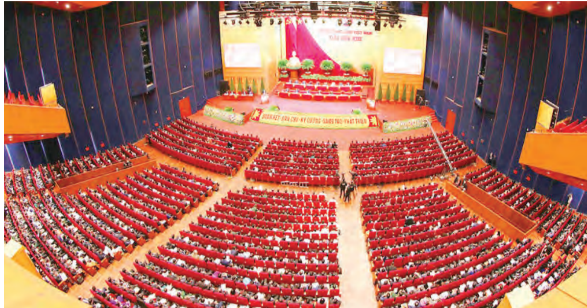
Quang cảnh Đại hội XIII của Đảng.

Đại hội Đảng, ngoài vấn đề xây dựng văn kiện về chính trị, tư tưởng, đường lối phát triển kinh tế, phát triển xã hội, chính sách quốc phòng, an ninh, ngoại giao thì có một vấn đề hết sức quan trọng đó là khâu tổ chức, nhân sự, con người. Cách mạng là sự nghiệp của Nhân dân, nhưng người lãnh đạo chủ chốt của các cấp cũng có vị trí vai trò quyết định đến sự tồn vong của Đảng và của chế độ.