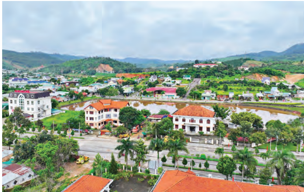
Sau 20 năm huyện Đam Rông đã đổi thay tích cực trên nhiều mặt.

Nếu ai lần đầu đến với Đam Rông, sẽ khó tưởng tượng được hình ảnh của mảnh đất này 20 năm về trước, cách trở, xa xôi và đói nghèo bủa vây. Là một trong 62 huyện nghèo của cả nước với hơn 65% dân số là người đồng bào dân tộc thiểu số (DTTS), trong đó chủ yếu gồm bà con các dân tộc gốc Tây Nguyên. Thu nhập bình quân đầu người của huyện ở mức 2,4 triệu đồng/người/năm. Con số thống kê thời điểm đó có lẽ chỉ là tương đối. Bởi 8 xã, 48 thôn của toàn huyện đều thuộc diện đặc biệt khó khăn; trên 73% dân số là hộ nghèo, trong đó, hộ nghèo đồng