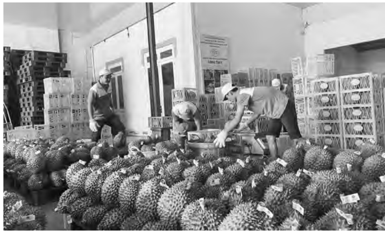
Năm 2024, rau, củ, quả các loại xuất khẩu tăng 19,5%.

Đáng chú ý, năm qua, ngành Chăn nuôi tiếp tục gặp những khó khăn do giá vật tư đầu vào (thức ăn, con giống, thuốc thú y) ở mức cao, trong