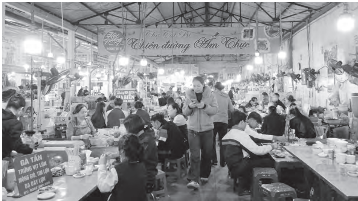
Chợ Cát Bi - một trong những địa điểm ẩm thực được nhiều du khách tìm đến.