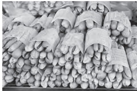
Bánh mì cay Hải Phòng.