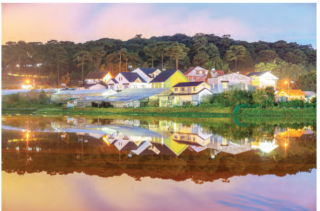
Phố bên đời.