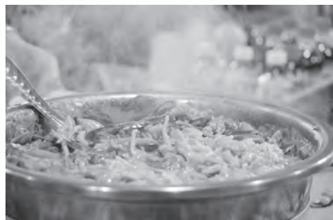
Giá bể xào - món ăn đặc sản xứ biển của Hải Phòng.