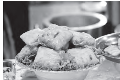
Nem cua bể.