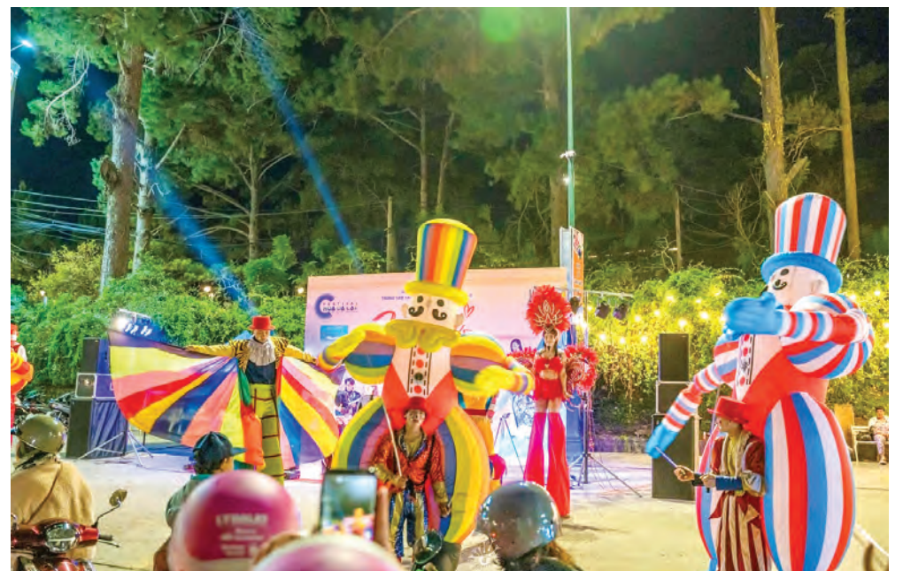
Nhộn nhịp cùng caravan đường phố.