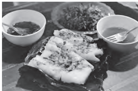
Bánh bèo Hải Phòng.