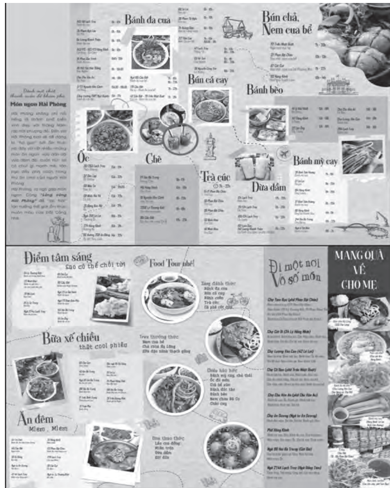
Bản đồ Food Tour được Sở Du lịch thiết kế trẻ trung, ấn tượng.

Với sáng tạo này, du khách không phải “đau đầu” lựa chọn mà vẫn có được những địa chỉ uy tín để thưởng thức phong vị ẩm thực phong phú, phù hợp. Thực tế trải nghiệm một vòng Food Tour ở Hải Phòng mới thấy đây thực sự là một cách làm độc đáo, đem lại hiệu quả thu hút khách và quan trọng nhất là đem lại sự hài lòng, thuận tiện cho khách du lịch. Đó thực sự là điểm mấu chốt để không chỉ một mà rất nhiều lần du khách vì nhớ từng hương vị mà tìm đến mảnh đất này.