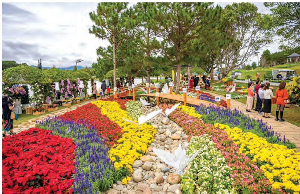
Rực rỡ với hoa và Festival Hoa 2024.

Song song đó, nâng cao vai trò, trách nhiệm của chính quyền địa phương các cấp trong công tác phối hợp triển khai thực hiện các chính sách về phát triển du lịch dịch vụ. Tiếp tục kiện toàn bộ máy quản lý nhà nước về du lịch bảo đảm đồng bộ, hiệu lực, hiệu quả, đáp ứng yêu cầu phát triển du lịch trở thành ngành kinh tế mũi nhọn.