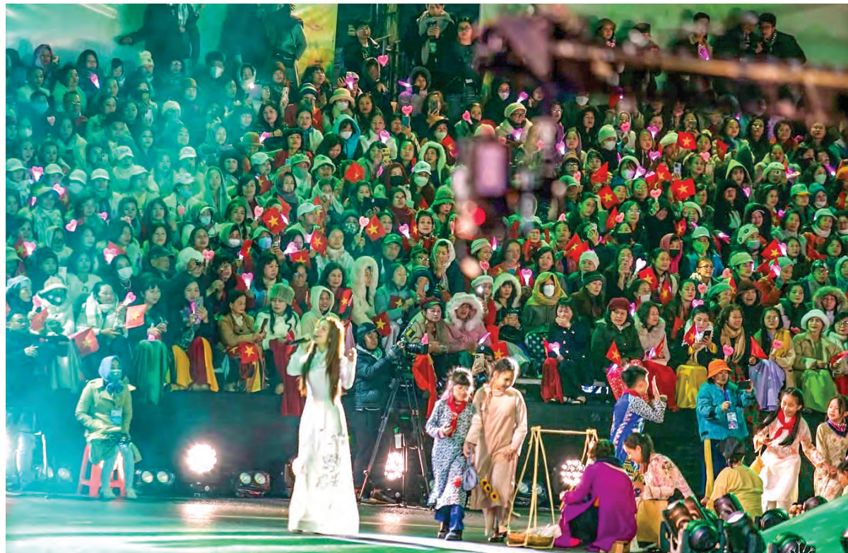
Đà Lạt lắng đọng với những cung bậc văn hóa.

Du lịch Lâm Đồng đã có bước phát triển nhanh cả về quy mô và chất lượng. Khách du lịch quốc tế, trong nước và doanh thu từ du lịch liên tục tăng trưởng với tốc độ cao, đóng góp lớn vào tăng trưởng GDP. Để du lịch không chỉ là ngành dịch vụ, mà là một ngành kinh tế tổng hợp có những đóng góp đặc biệt quan trọng trong nền kinh tế, tỉnh Lâm Đồng đang nỗ lực phát triển ngành công nghiệp "không khói" này theo hướng hiện đại, tương xứng với tiềm năng.