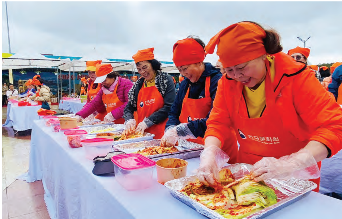
Người Đà Lạt trải nghiệm làm món kim chi Hàn Quốc trong Ngày Văn hoá Hàn Quốc tại Đà Lạt.

Với quận Nam của TP Gwangju và huyện Jangheung, thuộc tỉnh Jeollanam, Đà Lạt cũng tổ chức các chuyến trao đổi đoàn học tập kinh nghiệm trên các lĩnh vực hành chính, nông nghiệp, giao lưu văn hoá. Trong tháng 8/2024, TP Đà Lạt đã ký kết hợp tác nhiều mặt với quận Nam của TP Gwangju.