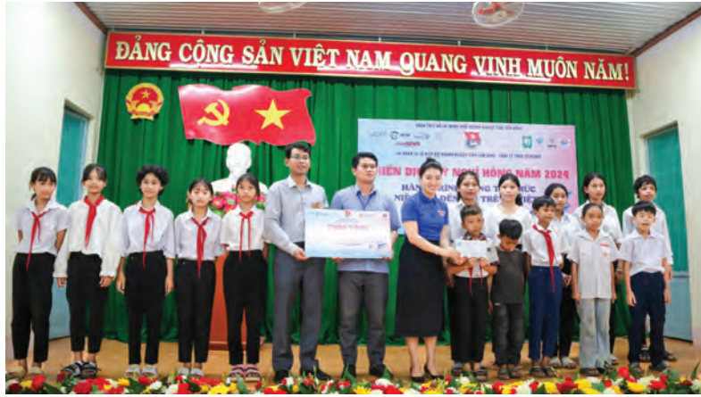
Đoàn Khối Doanh nghiệp tỉnh trao tặng học bổng cho các em có hoàn cảnh khó khăn tại xã Đạ M'rông.

Thực hiện tốt Phong trào Thanh niên tình nguyện, các hoạt động hướng về cộng đồng, năm 2024, Đoàn Khối Doanh nghiệp tỉnh Lâm Đồng tiếp tục