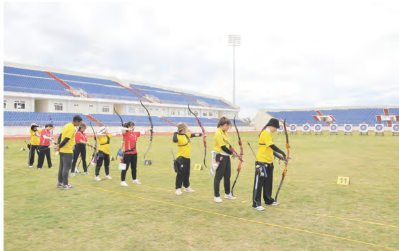
Các VĐV thi đấu tại Giải Bản cung quốc gia do Lâm Đồng đăng cai tổ chức tại Đà Lạt trong tháng 12/2024.

Sở VHTTDL Lâm Đồng trong năm còn phối hợp với rất nhiều sở, ngành, liên đoàn, đơn vị để tổ chức các hội thi, các giải thể thao lớn trong tỉnh với số lượng rất đông VDV trong và ngoài tỉnh, VDV nước ngoài tham dự.