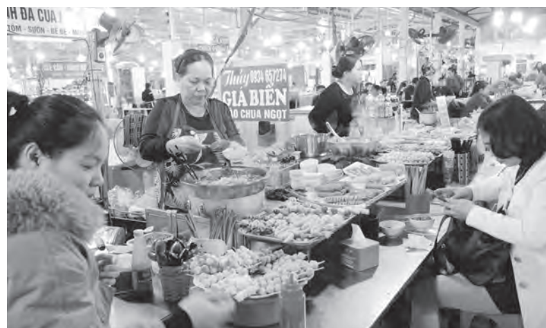
Food Tour sẽ là mối liên kết để du khách biết tới, trải nghiệm và nhận lại những món quà quý từ đất và người Hải Phòng.