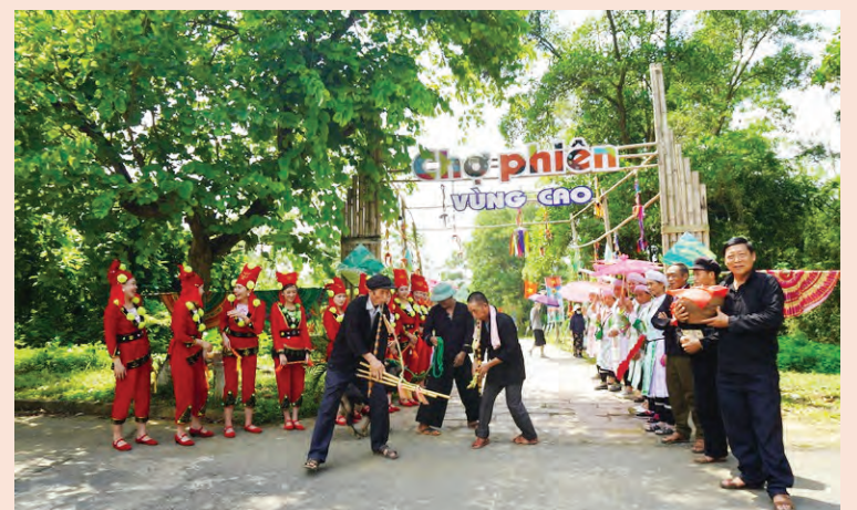
Đồng bào các dân tộc tham gia hoạt động tại chợ phiên vùng cao chào năm mới 2025.

Trong khuôn khổ các hoạt động chào đón mùa xuân 2025, tại "Ngôi nhà chung" của cộng đồng các dân tộc Việt Nam còn diễn ra hoạt động