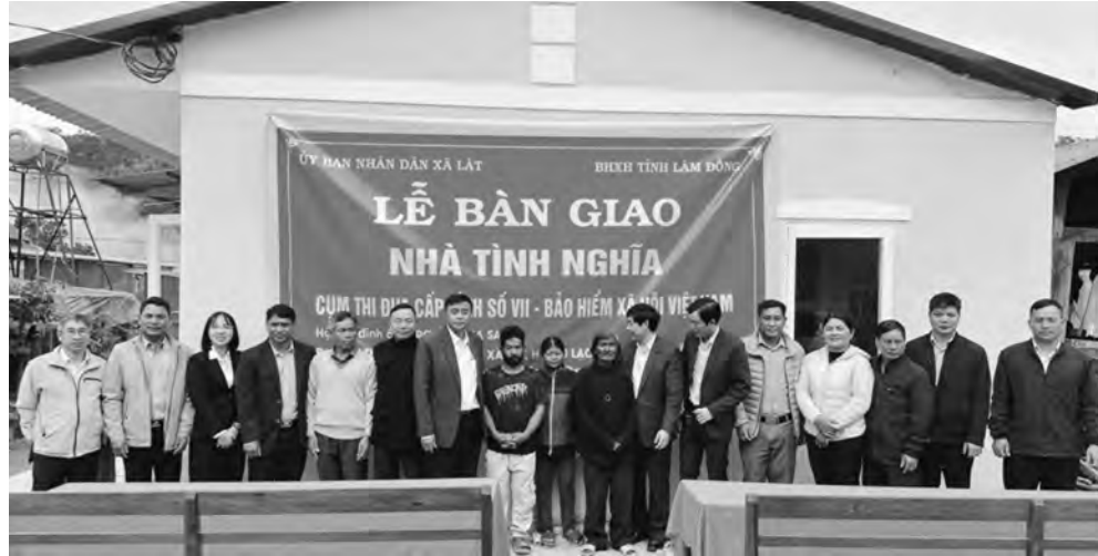
Các đại biểu tham dự lễ bàn giao nhà tình nghĩa.

Đặc biệt, hưởng ứng phong trào thi đua của tỉnh về "Chung tay xóa nhà tạm, nhà dột nát trên phạm vi cả nước trong năm 2025" trên địa bàn tỉnh Lâm Đồng, để đồng hành, chia sẻ với các hoàn cảnh khó khăn của người dân địa phương, BHXH tỉnh đã phối hợp với UBND xã Lát, huyện