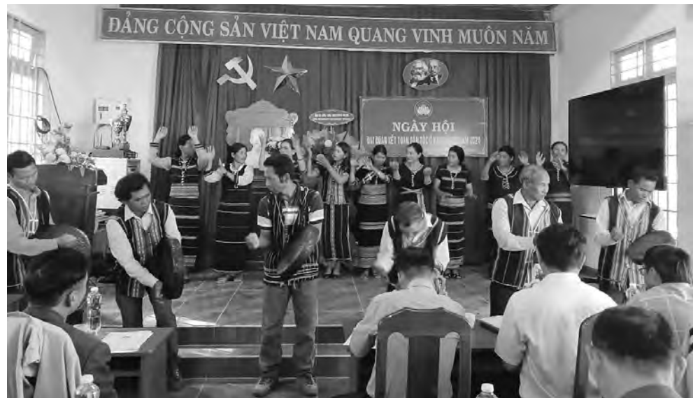
Người dân xã Phú Sơn diễn tấu công chiêng kết hợp hát múa tại Ngày hội Đại đoàn kết dân tộc năm 2024.

Thời gian qua, Ủy ban Mặt trận Tổ quốc (MTTQ) Việt Nam xã Phú Sơn, huyện Lâm Hà đã phát huy truyền thống tốt đẹp, tạo được sự đồng thuận, gắn kết của các thành viên trong cộng đồng dân cư để thực hiện tốt các nhiệm vụ trọng tâm trong công tác Mặt trận tại địa phương.