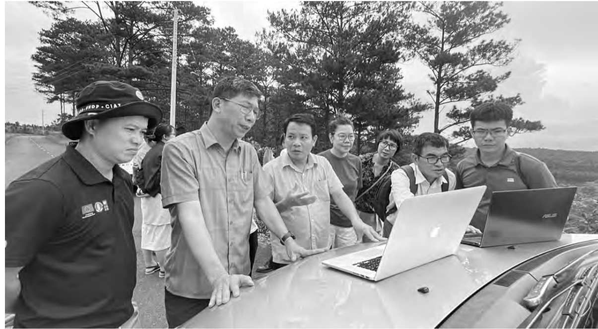
Đoàn đánh giá của Trung ương trong chuyến kiểm tra dữ liệu hiện trường tại huyện Di Linh trong tháng 7/2024.

Chương trình cũng xây dựng hệ thống truy xuất sản phẩm cà phê dành cho cà phê nhân xuất khẩu với các thông tin bắt đầu từ nông hộ - vườn cây đến các đại lý thu mua tại địa phương. Riêng việc truy xuất từ đại lý thu mua đến bước chế biến và xuất khẩu sẽ do các công ty phụ trách theo hệ thống riêng.