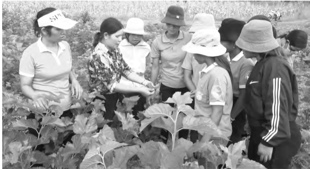
Nghề trồng dâu, nuôi tằm phát triển mạnh mẽ ở Đam Rông.

Dự án đã chuyển giao những tiến bộ kỹ thuật trong trồng dâu, nuôi tằm phù hợp với điều kiện sản xuất của vùng đồng bào dân tộc thiểu số (DTTS) tại các xã trong huyện Đam Rông. Cụ thể, dự án đã xây dựng thành công Mô hình Trồng và thâm canh giống dâu mới S7-CB, TBL-03 với quy mô 2 ha, đạt năng suất lá hơn 25 tấn/ha, năng suất kén đạt 1.960 kg/ha; xây dựng thành công mô hình tưới nước thông minh cho cây dâu tằm năng suất vượt đối chứng 20,7%; xây dựng thành công Mô hình Nuôi tằm con tập trung, quy mô 400 hộp trứng 20 g/ký, tằm khỏe, phát dục đều và xây dựng thành công Mô hình Nuôi tằm lớn trên nền nhà và trên khay bằng dâu cảnh, năng suất đạt 42,6 kg/kén/hộp. Kén đạt tiêu chuẩn ươm tơ tự động, hệ số tiêu hao 7,57 kg kén/1 kg tơ. Đã đào tạo 10 kỹ thuật viên và tập huấn hướng dẫn trực tiếp cho 100 lượt nông dân là người đồng bào DTTS tại địa phương nắm được quy trình kỹ thuật trồng, thâm canh dâu và nuôi tằm và phát triển dự án, nhân rộng các mô hình.