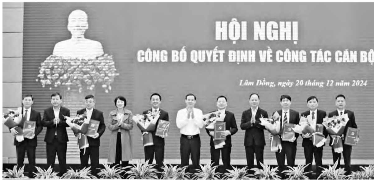
Lãnh đạo Tỉnh ủy, HĐND, UBND tỉnh trao các quyết định bổ nhiệm, điều động 7 cán bộ.

Năm 2024, ngành Tổ chức xây dựng Đảng tỉnh Lâm Đồng đã chọn phương châm “Kỷ cương - Linh hoạt - Hiệu quả” làm kim chỉ nam cho mọi hoạt động. Đây là sự quyết tâm mạnh mẽ không chỉ nhằm nâng cao chất lượng công tác tổ chức xây dựng Đảng mà còn tạo ra những chuyển biến rõ rệt trong năng lực lãnh đạo, điều hành của đội ngũ cán bộ, đảng viên trong toàn tỉnh. Phương châm này thể hiện sự kết hợp giữa tính nghiêm túc, kỷ luật trong công tác xây dựng Đảng và sự linh hoạt trong việc đáp ứng yêu cầu công việc trong bối cảnh mới.