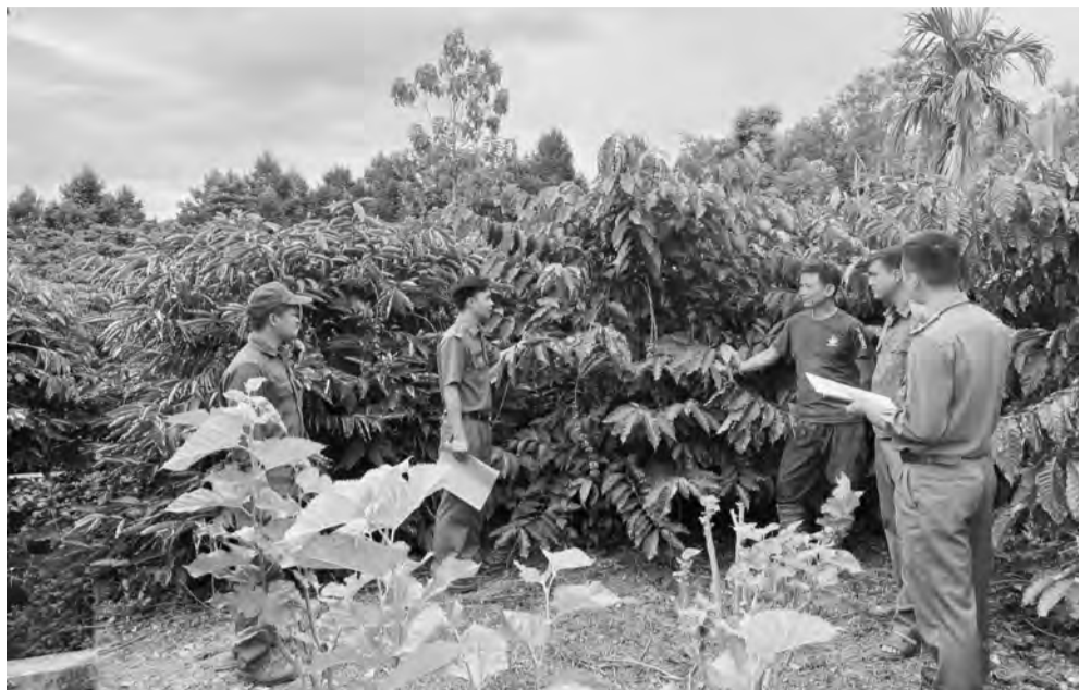
Công an xã Đạ Rsal tuyên truyền người dân chủ động phòng ngừa, ngăn chặn tình trạng trộm cắp cà phê.

Theo ông Nguyễn Ngọc Thanh - Chủ tịch UBND xã Đạ Rsal, trên cơ sở hướng dẫn thực hiện phong trào của cấp trên, Đảng ủy xã Đạ Rsal đã ban hành nghị quyết, chỉ thị, kế hoạch để thực hiện phong trào phù hợp với đặc điểm, tình hình của địa phương, đảm bảo ổn định ngay từ cơ sở, không để xảy ra các điểm nóng. Tuyên truyền là giải pháp "xương sống" được xã Đạ Rsal thực hiện thường xuyên, liên tục ở các thời điểm. Ngoài việc tổ chức tuyên truyền trực tiếp, hoạt động này còn được lồng ghép vào tất cả các hoạt động khác của địa phương. Đặc biệt, đề công tác tuyên truyền đi sâu và lan rộng trong mỗi địa bàn, xã đã ra mắt 7 tổ tham gia bảo vệ an ninh trật tự cơ sở với 26 thành viên. Đây là cánh tay nối dài của lãnh đạo địa phương tiến hành tuyên truyền pháp luật thường xuyên, liên tục bằng nhiều cách thức phù hợp với từng địa bàn dân cư. Qua