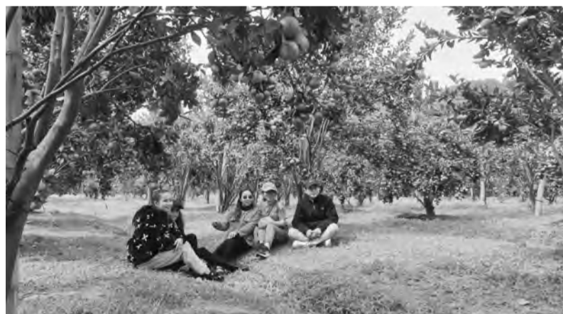
Vườn quýt ngọt ở Pró thu hút khách du lịch vào dịp tết.

Thực tế trong những năm qua đã chứng minh rằng, Chương trình xây dựng Nông thôn mới đóng vai trò quan trọng trong việc hỗ trợ cho phát triển của du lịch nông thôn thông qua việc nâng cấp và hoàn thiện hệ thống