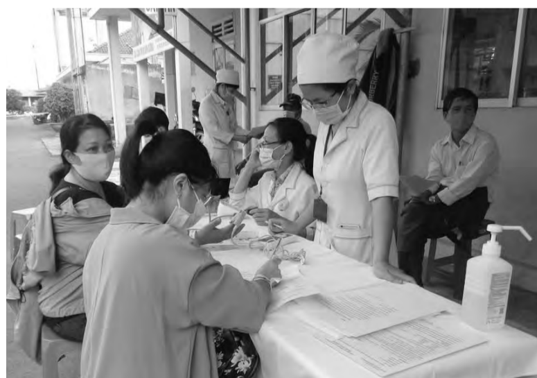
Công tác khám, chữa bệnh tại huyện Đơn Dương không ngừng được nâng cao.

Trung tâm Y tế huyện luôn nỗ lực nâng cao dịch vụ y tế, không để xảy ra các sai sót trong công tác chuyên môn. Duy trì và thực