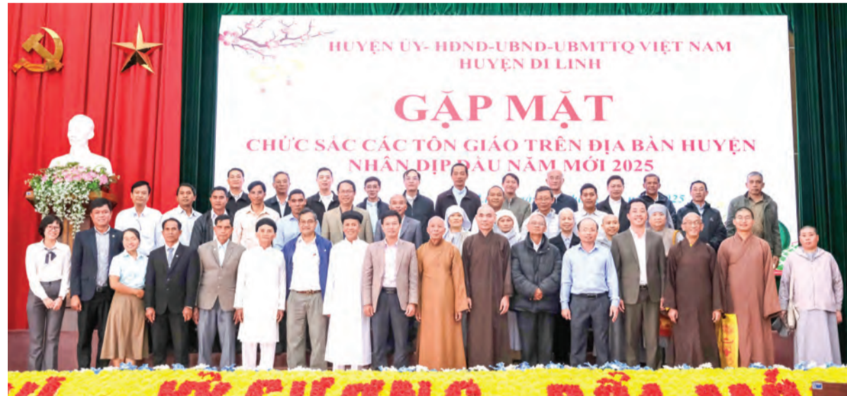
Ủy ban MTTQ Việt Nam huyện Di Linh phối hợp tổ chức gặp mặt chức sắc, chức việc các tôn giáo nhân dịp Tết Nguyên đán Ất Tỵ 2025.

Thông qua việc triển khai có hiệu quả các nhiệm vụ trong công tác Mặt trận, thời gian qua, Ủy ban Mặt trận Tổ quốc (MTTQ) Việt Nam huyện Di Linh và các tổ chức thành viên đã khẳng định vai trò quan trọng trong việc xây dựng khối đại đoàn kết toàn dân tộc, tạo sự đồng thuận lòng dân. Từ đó góp phần quan trọng cùng với địa phương thực hiện thắng lợi các nhiệm vụ, chỉ tiêu phát triển kinh tế - xã hội, quốc phòng - an ninh, xây dựng Đảng và hệ thống chính trị.