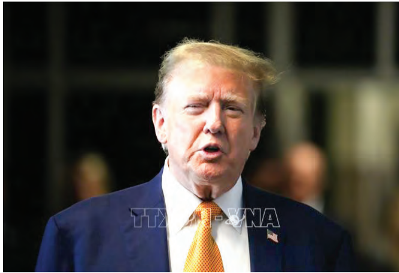
Tổng thống đắc cử Mỹ Donald Trump tại New York.

Việc ông Trump thể hiện mong muốn sớm đối thoại với Nga làm dấy lên những lo ngại về khả năng thay đổi trong chính sách của Washington đối với Ukraine. Trong nhiệm kỳ trước, ông từng